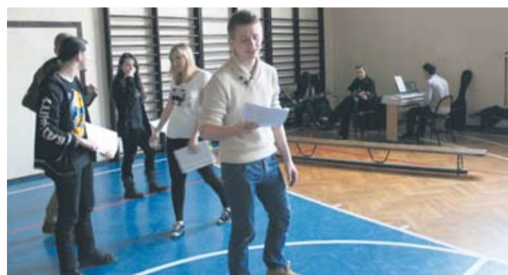
Młodzi artyści ciężko pracują na próbach.