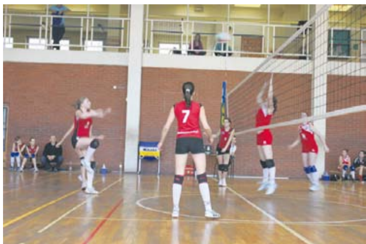
Zawodniczki GKS-u Wawel Wirek z meczu na mecz radzą sobie coraz lepiej.

W pierwszym spotkaniu rozgrywanym tego dnia rudzianki zmierzyły się z MUKS-em Michałko-