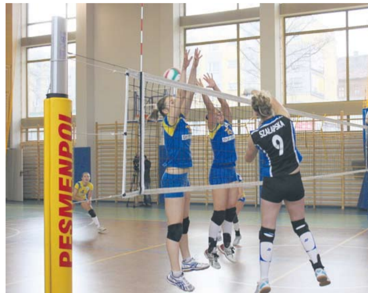
Siatkarki KPKS-u Halemba do zwycięstwa potrzebowały tylko trzech setów.