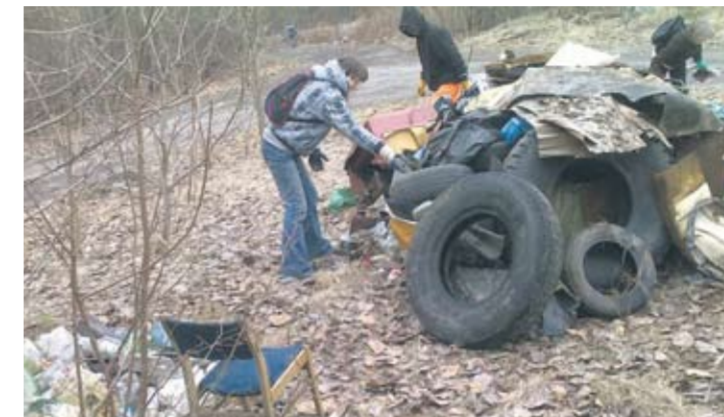
Ważne miejsce wśród wykonywanych w Rudzie Śląskiej prac społecznie użytecznych zajmuje porządkowanie miasta.

Sztandarowym przykładem przydatności tej formy aktywizacji osób bezrobotnych jest dziesięć mieszkań socjalnych i cztery mieszkania chronione, które zostały wyremontowane w ramach programu „Gminne programy aktywizacji społeczno-zawodowej na rzecz budownictwa socjalnego”. W ubiegłym