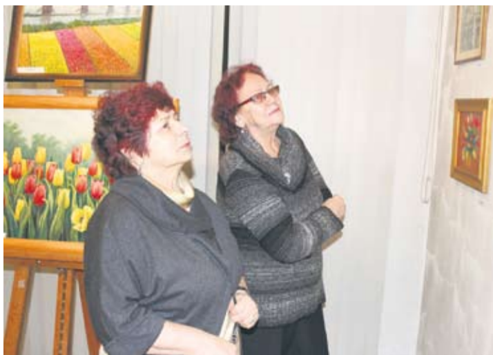
Prace można oglądać w galerii Fryna MCK.