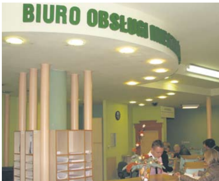
W zeszłym roku zarejestrowano ponad 12 tys. pojazdów, wydano 5 tys. praw jazdy oraz ponad 700 pozwoleń na budowę.

Ujemny przyrost naturalny to tendencja, która utrzymuje się w Rudzie Śląskiej już od kilku lat. Jaskółka nadziei zwiastująca zmianę tego trendu mogą być dane za ubiegły rok. Co prawda w 2012 r. nadal więcej ruzdzian umarło niż przyszło na świat – odpowiednio 1599 i 1447, jednak różnica ta była mniejsza niż jeszcze dwa lata temu. Urodziło się wtedy 1424 dzieci, a zmarło 1610 mieszkańców Rudy Śląskiej. – Z jednej strony odnoto-