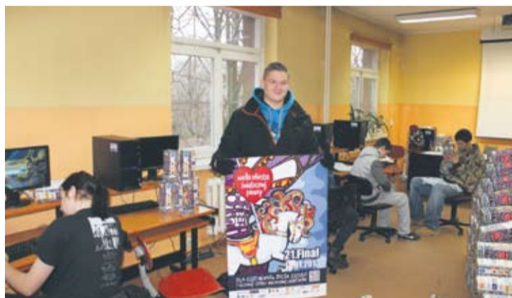
Uczniowie ZSO nr 4 przygotowują puszki... i plakaty.

– Młodzież bardzo chce pomagać i to jest fenomen tej akcji. Mamy