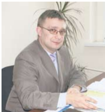
Krzysztof Mikołajczak – rzecznik prasowy MPGM-u.

Książeczka opłat na 2013 rok lub, w przypadku rezygnacji z książeczki, zawiadomienie uwzględniające nowy numer konta bankowego, były dostarczone do skrzynek pocztowych w grudniu ub. roku.