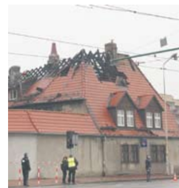
Budynek przy Raciborskiej kilka minut po ugaszeniu pożaru.

„Zgodnie z informacją otrzymaną z MGSM „Perspektywa” budynek będzie wyłączony z eksploatacji przez okres jednego roku, w celu wykonania remontu. Z uwagi na tak długi