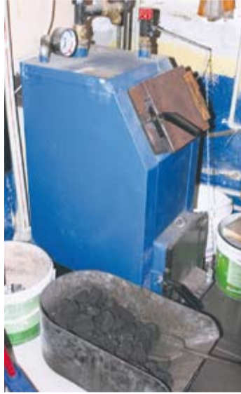
Wielu mieszkańców chciałoby zamienić piece węglowe na gazowe.

W związku ze zmianą obowiązujących przepisów, tj. ustawy „Prawo ochrony środowiska”, od 1.01.2010 r. wstrzymana została realizacja złożonych wniosków, bowiem nie można było dotować osób fizycznych. Od 30.04.2010 r. wstrzymano przyjmowanie wniosków na dofinansowanie zmiany systemu ogrzewania do czasu wprowadzenia odpowiednich uregulowań ustawowych przywracających możliwość wspierania przedsięwzięć proekologicznych realizowanych przez osoby fizyczne. Pomimo, że od grudnia 2010 ustawowo przywrócono taką możliwość,