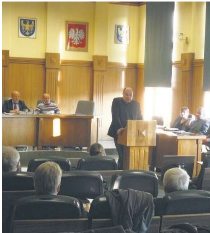
Jedno z ubiegłorocznych posiedzeń Komisji Środowiska.