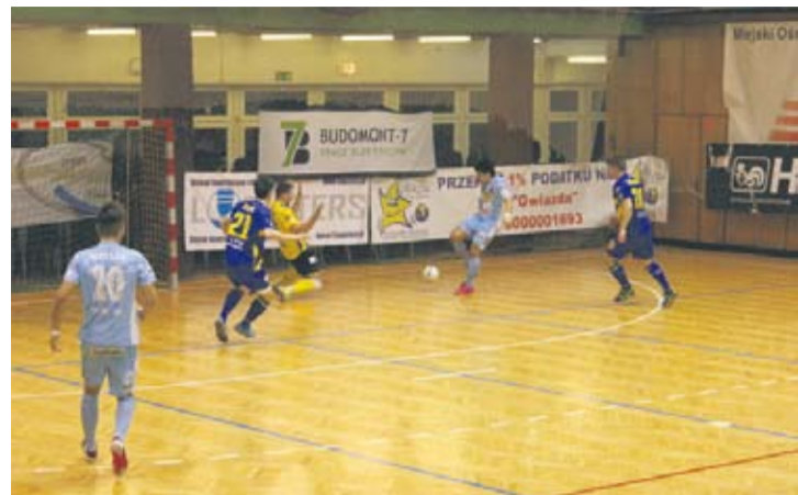
Mimo ambitnej walki rudzianie musieli uznać wyższość zawodników ze Szczecina.