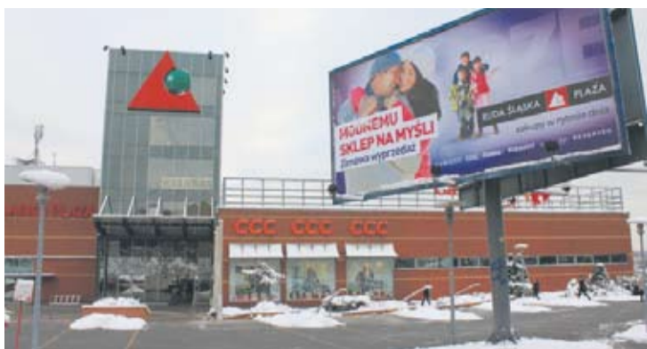
W Centrum Handlowym Plaza można znaleźć wiele okazji.

– Wyprzedaże sezonowe to domena branży odzieżowej, obuwniczej i galanterii oraz dodatków sezonowych, gdzie oferta zmienia się jak w kalejdoskopie, zgodnie z kolejnymi, błyskawicznie przemijającymi trendami. Rabaty w sklepach odzieżowych sięgają nawet 70 proc. Niemniej, w naszym Centrum, nawet księgarnie przyłączają się do wyprzedażowego szaleństwa, oferując bardzo atrakcyjne