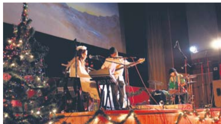
W kolędach można było wyczuć takie style muzyczne jak: jazz, blues, rock czy soul.