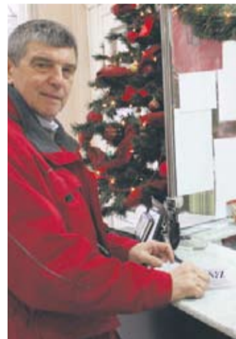
System elektronicznej weryfikacji uprawnień świadczeniobiorców (eWUŚ) funkcjonuje także w Rudzie Śląskiej