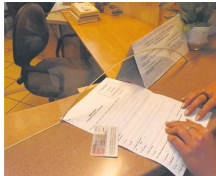
Od nowego roku wymeldowania i zameldowania można dokonać już podczas jednej wizyty w urzędzie.

W ubiegłym roku w Rudzie Śląskiej zameldowano na pobyt stały 3115 osób, wymeldowały się zaś 3002 osoby. Przed dwoma laty było to odpowiednio: 3195 i 2945 osób. Znowelizowana ustawa o ewidencji ludności i dowodach osobistych przewiduje zniesienie obowiązku meldunkowego od 1 stycznia 2016 r.