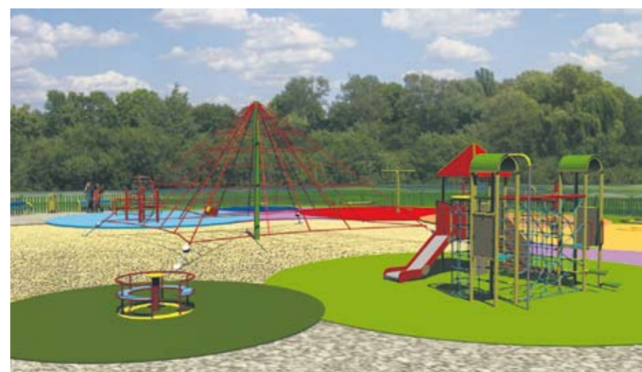
Tak będzie wyglądać nowoczesny plac zabaw w Parku Dworskim.