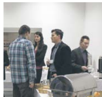
Śniadanie rozpoczęło się o godz. 9.00.

Na pierwszym śniadaniu biznesowym klastra – przedstawiciele firm mieli okazję zaprezentować swoją ofertę, nawiązać nowe kontakty biznesowe, wymienić rekomendacje. Podczas spotkania biznesowego przedstawiono ofertę Śląskiego Klastra Multimedialnego, omówiono korzyści płynące z członkostwa w klastrze, a także przedsta-