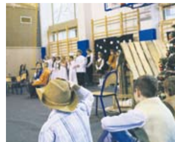
Premiera spektaklu odbyła się w grudniu.