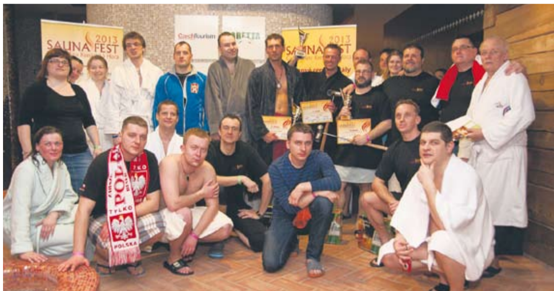
Uczestnicy Sauna Fest 2013.