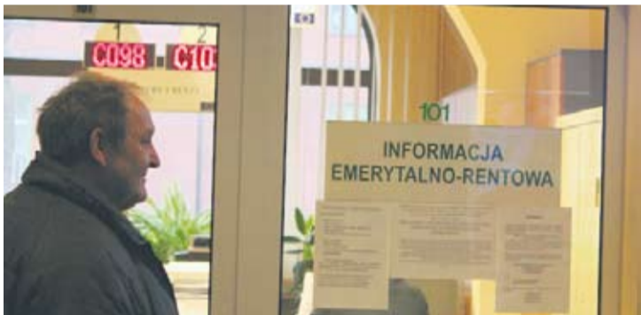
Wyższe świadczenia już od 1 marca.