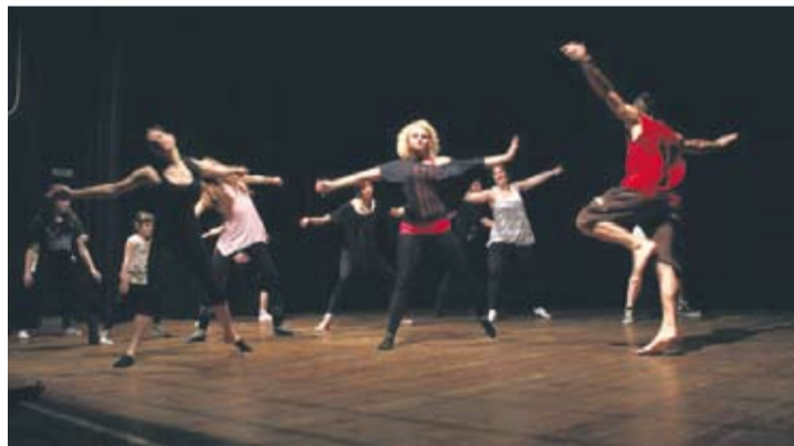
Uczestnictwo w warsztatach było szansą na przełamanie swojego strachu przed wystąpieniami publicznymi.

„Wystąpił w Rudzie, spał w Pile i to jak na razie tyle!” – tak mogą zaśpiewać fani twórczości Artura Andrusa po jego świetnym koncercie w Miejskim Centrum Kultury. Artysta we wtorkowy wieczór ekspresowo rozruszał rudzką publiczność.