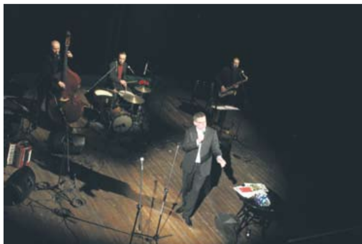
Artur Andrus był w trakcie koncertu pełen energii.