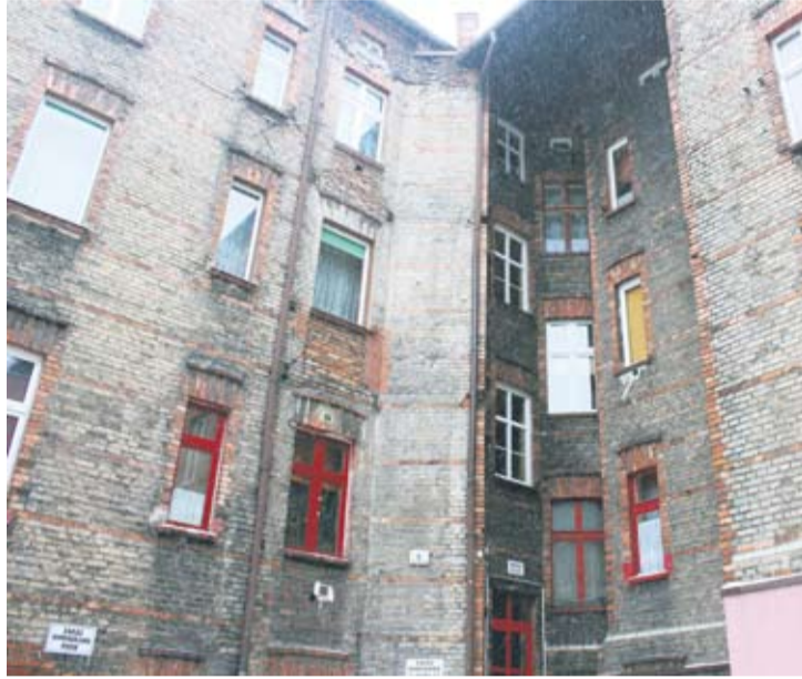
To w tym budynku mogłaby zależeć się kotłownia gazowa.