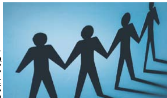
Problemami ofiar przespstw są często alimenty czy testy na ojcostwo.

w Rudzie Śląskiej. – Ta akcja ma na celu zachęcenie ofiar przespstw do skorzystania z bezpłatnej pomocy. Chcemy, by takie osoby przełamały swój strach – dodaje. Dyżury są interdyscyplinarne – informacji mogą udzielać adwokaci, radcy prawni, aplikanci adwokacy, prokuratorzy, funkcjonariusze policji, kuratorzy sądowi, komornicy, a także psycholodzy. Spotkania odbywają się w Ośrodkach Pomocy dla Osób Pokrzywdzonych Prześpiwstwem od poniedziałku do piątku w godzinach od 10.00 do 18.00 oraz w sobotę od 10.00 do 13.00. MS