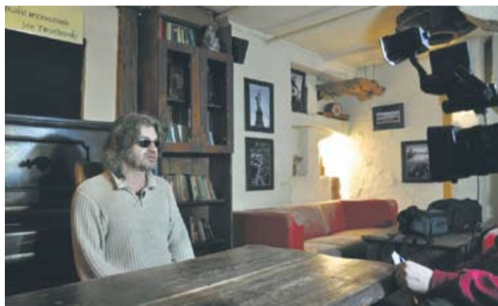
Zdjęcia kręcono w Rudzie Śląskiej.