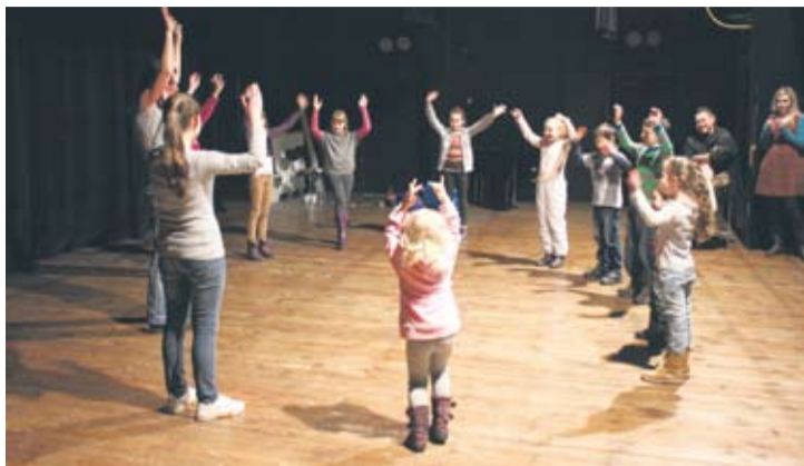
Uczestnicy pierwszych warsztatów.