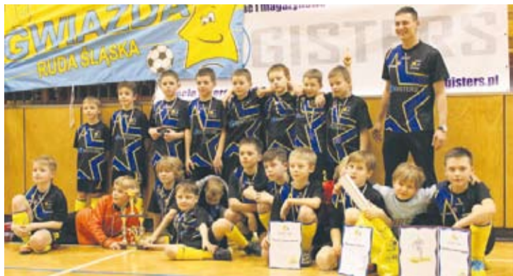
Rocznik 2004 i młodszy jest kolejnym, który odniósł zwycięstwo w turnieju.

Zespoły podzielone zostały na dwie grupy, w których każdy zagrał z każdym. Czas gry wynosił 13 minut. Do grupy A weszły: Wyzwolenie Chorzów, Gwiazda II Ruda Śląska, Orlik Ruda Śląska, Promotor Zabrze I i GKS Katowice. Po rozegraniu wszystkich spotkań, pierwsze miejsce zajęła GKS Katowice, zaś drugie Gwiazda II Ruda