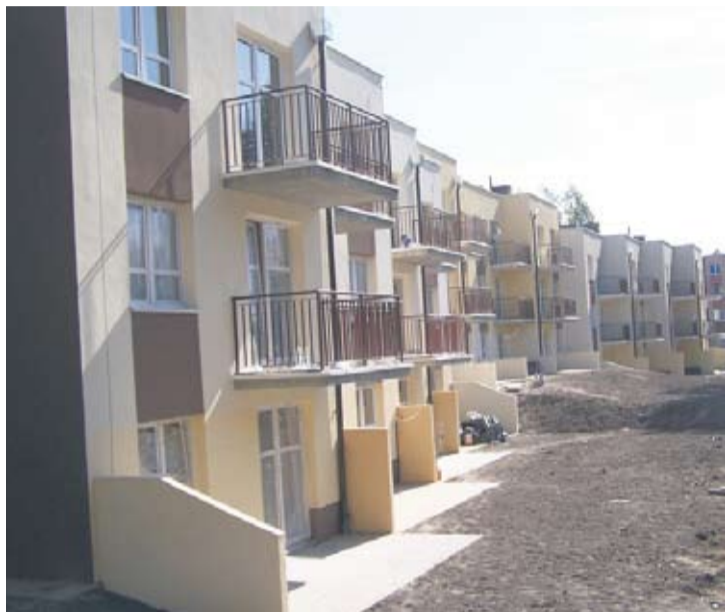
Na mieszkanie z Urzędu Miasta jest wielu chętnych.

Sandra Hajduk – sandra.hajduk@wiadomoscirudzkie.pl