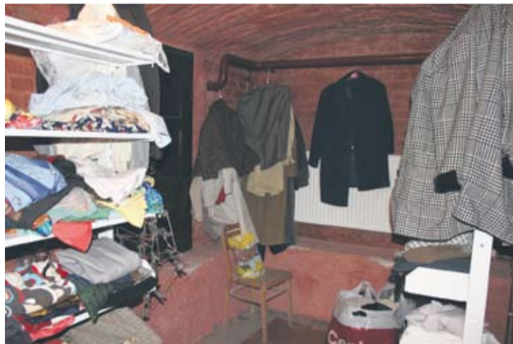
Zbiórka odzieży trwa m.in. w świetlicy PAL-u w Orzegowie.

Nie bez powodu świetlice Programu Aktywności Lokalnej powstają właśnie w Orzegowie oraz na osiedlu Kaufhaus. To tutaj prowadzone są zajęcia integracyjne dla dorosłych, m.in. warsztaty plastyczne, wyjścia do kina. Europejski Fundusz Społeczny finansuje m.in. pracę socjalną z rodzinami wielo-problemowymi, w tym wyjazdowe treningi kompetencji i umiejętności społecznych, organizowanie treningów kompetencji cywilizacyjnych dla osób bezrobotnych, wyjazdowe zajęcia rehabilitacyjne dla niepełnosprawnych czy szereg działań o charakterze środowiskowym.