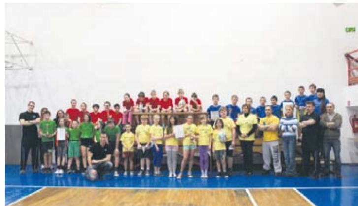
Dzieciom wyraźnie spodobała się taka forma rugby.

– Dzieci są bardzo zaangażowane i daje im to dużą radość. Nie zwracają uwagi na to, czy wygrywają czy przegrywają. Liczy się po prostu dobra zabawa. Widzę tu kilkoro dziewczyn i chłopców, którzy