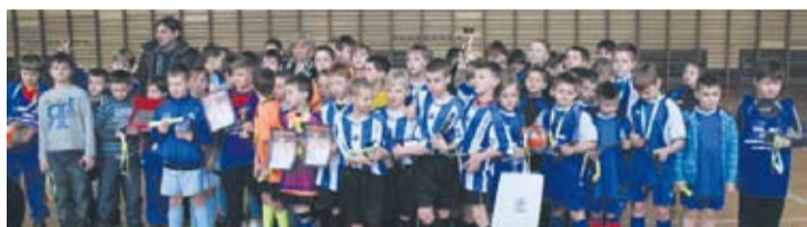
Każdy uczestnik turnieju otrzymał jakąś nagrodę.

W turnieju udział wzięli zawodnicy takich klubów jak: GKS Wawel, KS Slavia, MKS Pogoń, TP Jastrzęb, SRS Gwiazda, GKS Urania.