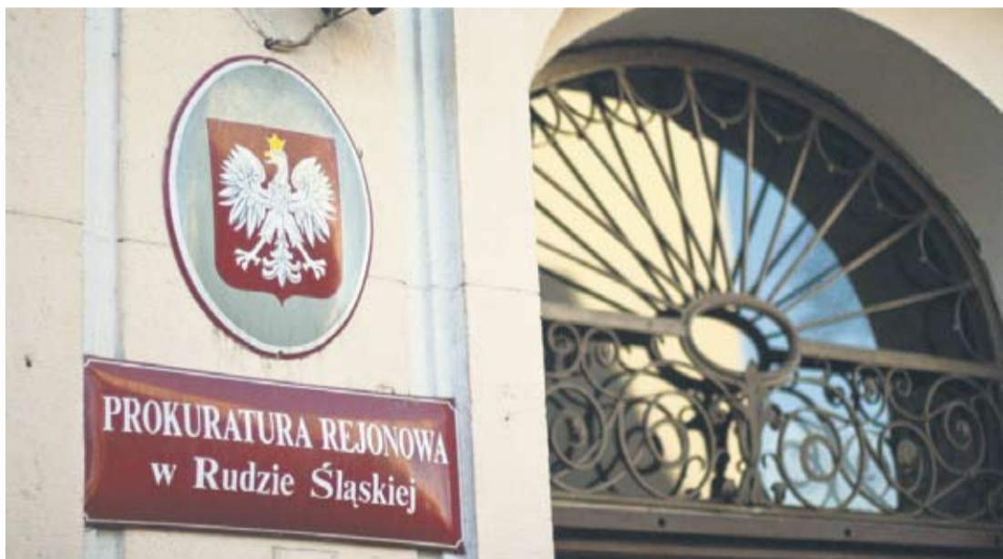
Prokuratura Rejonowa w Rudzie Śląskiej zapowiada odwołanie od wyroku.