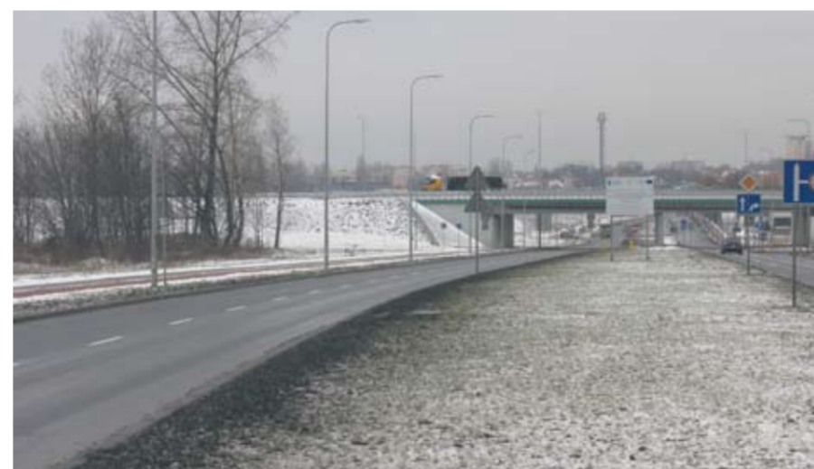
W tym roku rozpocznie się budowa kolejnego odcinka trasy N-S.

Tegoroczne 51 mln zł na inwestycje to jedynie trochę mniej niż przed rokiem, kiedy to wydano na ten cel 54 mln zł. W zeszłym roku prawie 19 mln zł stanowiły wydatki związane z realizacją inwestycji unijnych – 14 mln zł pochłonęły koszty budowy sztandarowej inwestycji drogowej w Rudzie Śląskiej – trasy N-S, a ponad 5 mln złotych przebudowa ul. Kokota. – W tym roku nie realizujemy tak dużych inwestycji. Skupiamy się za to na tych, które mają największe znaczenie z punktu widzenia mieszkańca, dla którego najważniejsze są: wyremontowany chodnik oraz droga, a także nowy parking i plac zabaw – podkreśla Grażyna Dziedzic. – Musimy też pamiętać, że miasto, aby mogło skorzystać z unijnych pieniędzy na lata 2014-2020, musi spełnić wskaźnik spłaty zadłużenia, o którym mówią przepisy ustawy o finansach publicznych. Wskaźnik ten liczony jest według wzoru, jako średnia za trzy ostatnie lata. Stąd też rozważa w wydawaniu pieniędzy – dodaje. TK