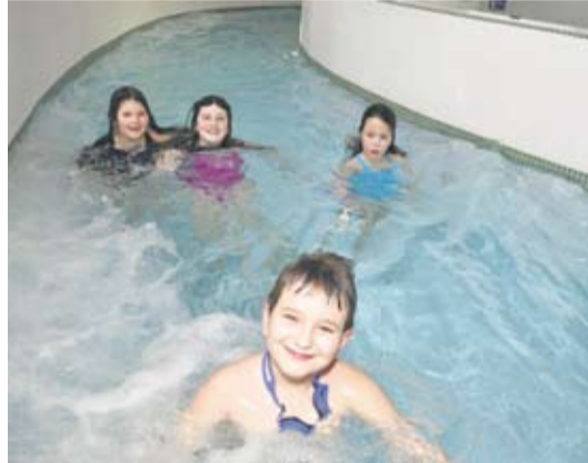
Woda to zabawa.