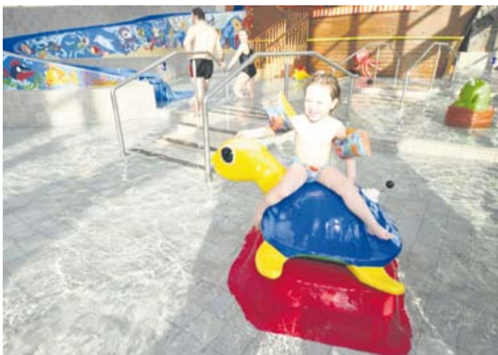
...szczególnie dla najmłodszych.