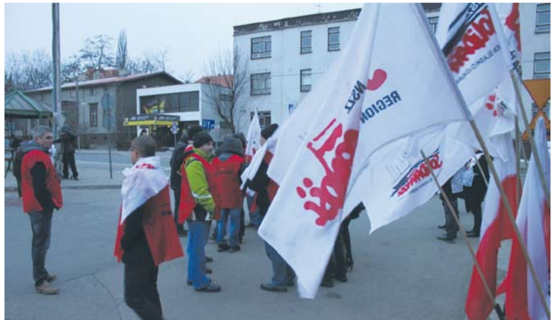
Związkowcy są niezadowoleni z polityki rządu.

Godziny strajku były uzależnione m.in. od tego, w jakim systemie pra-