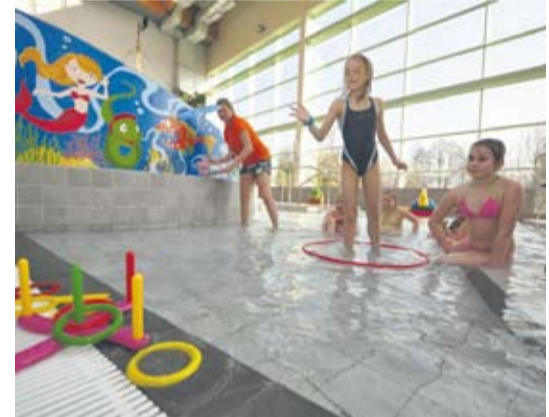
Konkurencje wodne wzbudzały duże emocje.