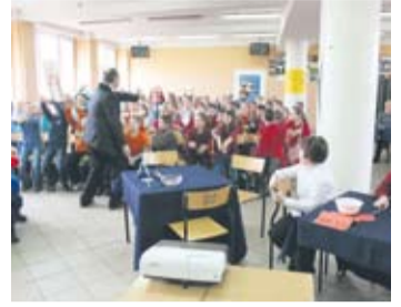
Konkurs wzbudzał ogromne emocje.

Konkurs jest podsumowaniem zajęć warsztatowych o tematyce związanej z bezpieczeństwem użytkownika urządzeń elektrycznych. Uczniowie szkoły kształcący się w zawodzie