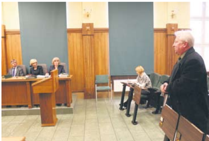
Forum mieszkańców to kolejna forma dialogu z mieszkańcami.

Na początku rudzianie obecni na forum obejrzeli krótki film edukacyjny, w którym poruszony był problem segregacji odpadów. Później nadszedł czas na dyskusję. Przedstawiciel działkowców zwracał uwagę na niesprawiedliwe traktowanie właścicieli ogródków, którzy płacą za wywóz śmieci dwukrotnie – z miejsca zamieszkania i z działki. Zainteresowani dowiedzieli się, że zastosowana kolejność, to jest ustalenie stawki przed ogłoszeniem przetargu, jest wymuszona przez ustawę. Pojawił się także wniosek o przełożenie wdrożenia w życie „ustawy śmieciowej” o okres liczący od sześciu do dwunastu miesięcy.