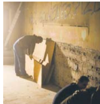
Teatr Bezpański remontuje dworzec własnymi siłami.

– Remont powoli idzie do przodu. Widać postępy. Faktycznie weszliśmy na teren pomieszczenia ze sceną. Niemniej jednak remont odbywa się naszymi własnymi siłami, w temperaturze minusowej, bez wody i toalety. Nie jest to nic przyjemnego. Pozytywne jest to, że przyjeżdżają osoby, które są pasjonatami tej sztuki i kochają Teatr