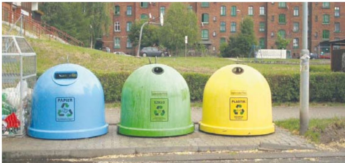
Nowa „ustawa śmieciowa” zacznie obowiązywać w lipcu.

Sandra Hajduk – sandra.hajduk@wiadomoscirudzkie.pl