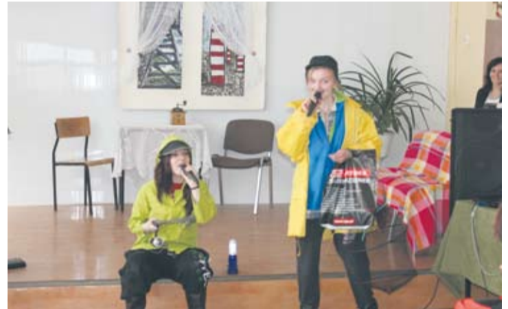
Uczniowie podczas występu artystycznego.