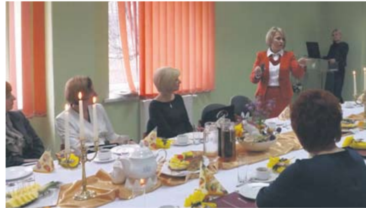
Obecnie tylko jedna czwarta mikroprzedsiębiorstw w Polsce to firmy z udziałem kobiet.