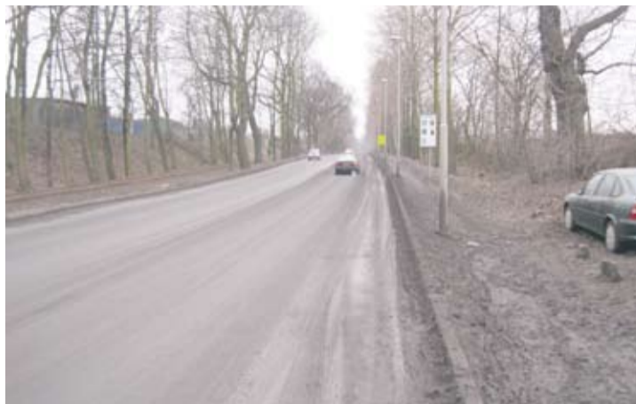
Brud na tej drodze to zmora kierowców.