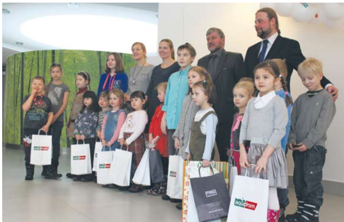
Laureaci konkursu „Woda w życiu codziennym” w Aquadromie.