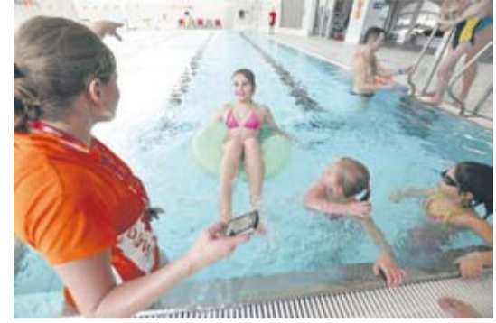
Dużą radość sprawiły animacje wodne.