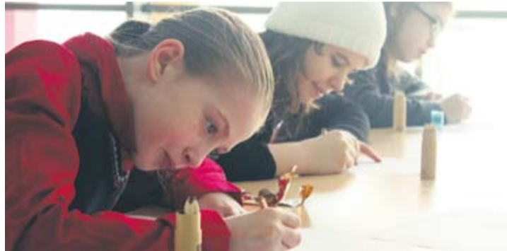
Dzieci rysują podczas Dni Wody.