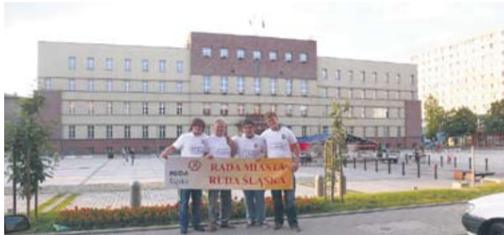
Uczestnicy rejsu tuż przed wyjazdem.