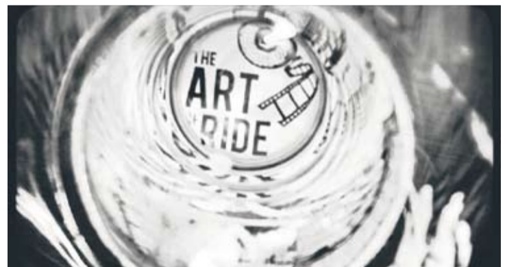
The Art Of Ride to jedyny taki festiwal w Polsce.