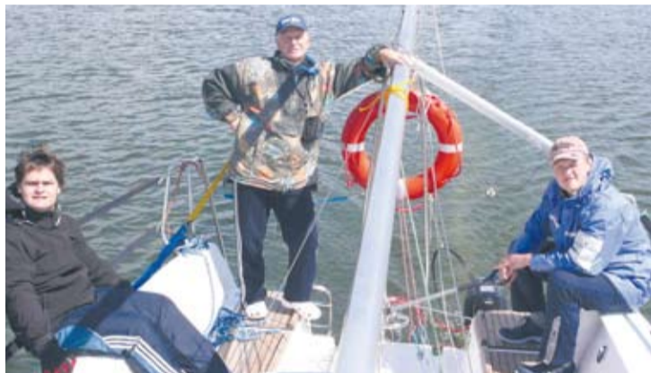
...i w trakcie rejsu.