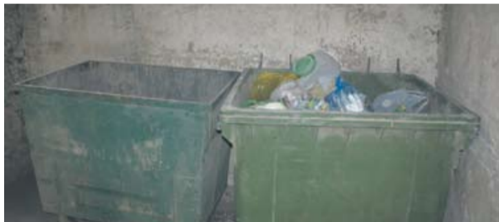
W oznakowanych kontenerach śmieci często są zanieczyszczone.