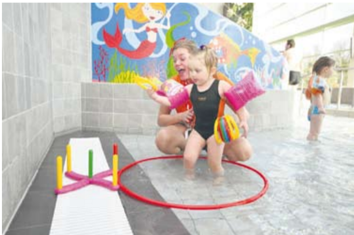
...i bezcenna radość...