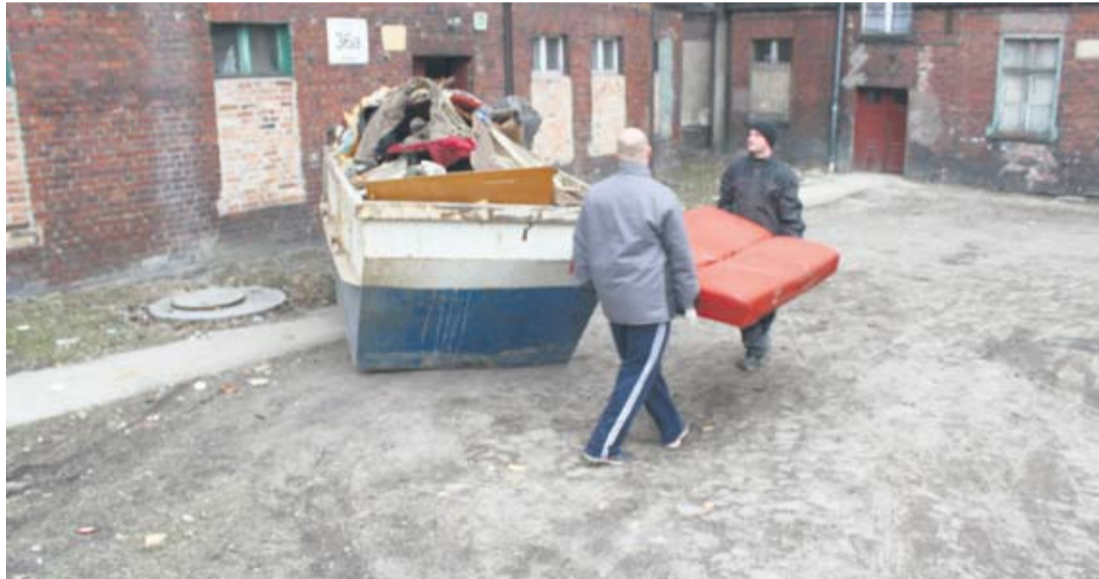
Ludzie dobrej woli pomagają w uprzątnięciu mieszkania.