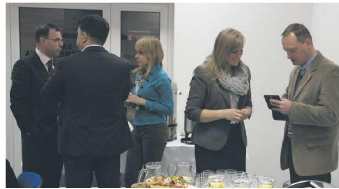
Śniadanie biznesowe odbyło się w Rudzким Inkubatorze Przedsiębiorczości.