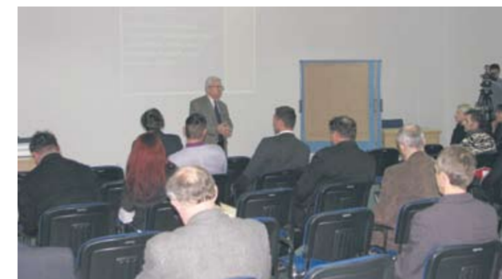
Uczestnicy warsztatów dyskutowali o korzyściach, jakie nowa strategia może przynieść lokalnym firmom.

W Rudzким Inkubatorze Przedsiębiorczości odbyło się drugie śniadanie biznesowe Śląskiego Klastra Multimedialnego. Przedsiębiorcy z województwa śląskiego działający w branży IT i multimedialnej spotkali się, aby nawiązać nowe kontakty biznesowe, wymienić rekomendacje, zaprezentować swoją ofertę.