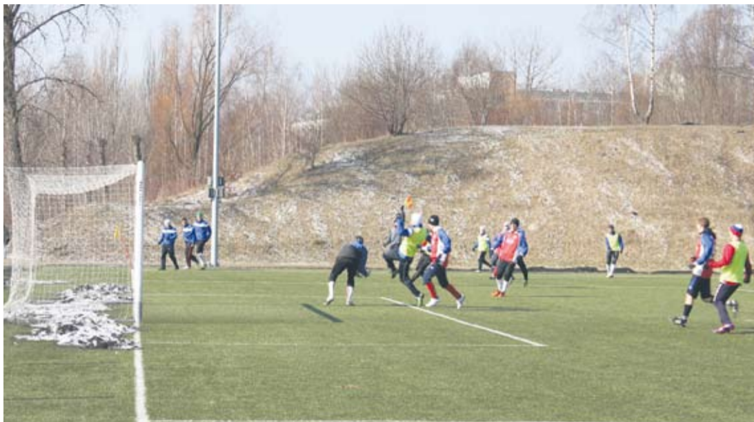
Przerwę między rozgrywkami rudzkie kluby spędziły na intensywnych treningach.