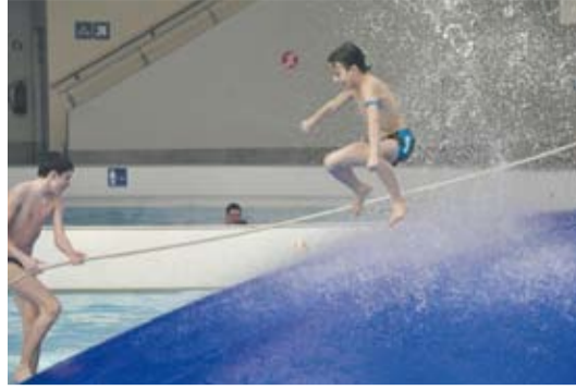
Takie atrakcje to dla wielu wyzwanie.