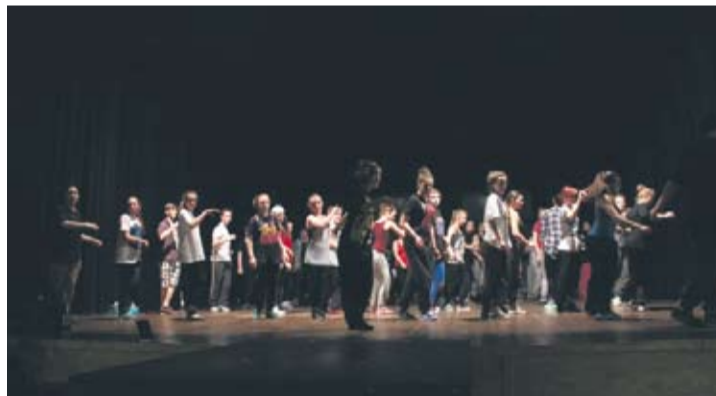
Na warsztaty zjechała młodzież z całego regionu.

– O warsztatach dowiedziałam się od koleżanki. Chętnie biorę w nich udział, bo bardzo lubię tańczyć. Fajnie, że impreza odbywa