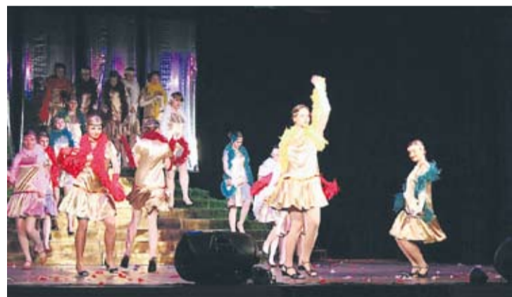
Uczniowie na deskach MCK-u.