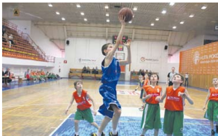
Pogoń wygrała wszystkie mecze w turnieju finałowym.