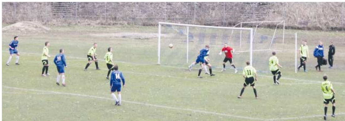
Porażka Slavii z Kamienicą jest uznawana za niespodziankę tej kolejki.