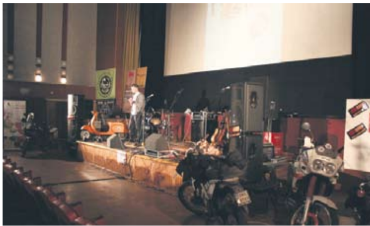
W trakcie festiwalu można było usłyszeć wiele ciekawych historii z wypraw motocyklowych.