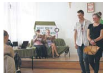
W ramach Szkolnego Święta Teatru uczniowie wystawili „Świteziankę”.

Młodzieży tak spodobaly się warsztaty prowadzone przez członków Fundacji Tworzenia i Promowania Sztuki –