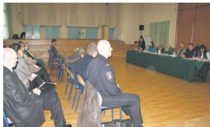
Spotkanie z mieszkańcami w SP nr 30 w Rudzie.