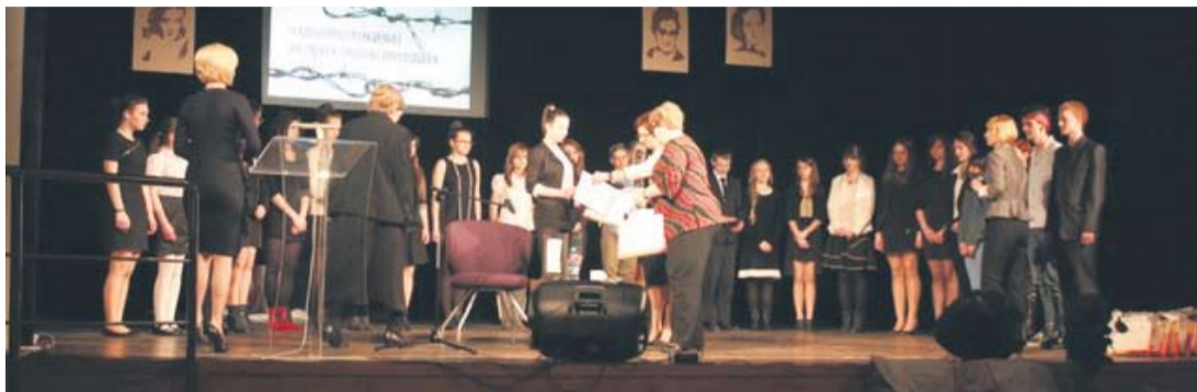
Konkurs poezji lagrowej.

Na scenie MCK-u zaprezentowało się 26 laureatów konkursów półfinałowych, które odbywały się w Rybniku, Gliwicach, Katowicach, Bielsku-Białej, Sosnowcu, Chorzowie i Rudzie Śląskiej. Recytujący wykazali się ogromną dojrzałością i świadomością w wyborze utworów.