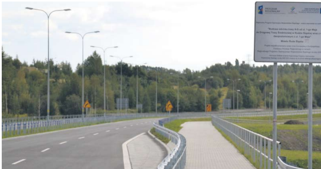
Miasto czeka na ostateczną decyzję o dofinansowaniu.