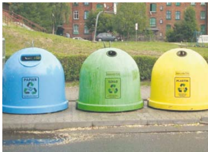
Osobom, które nie złożą w urzędzie formularza, opłata śmieciowa zostanie naliczona na podstawie danych meldunkowych.

Osobom, które nie złożą w urzędzie formularza, „opłata śmieciowa” zostanie naliczona „z automatu” na podstawie danych meldunkowych. Może być to niekorzystne dla właścicieli nieruchomości, gdzie faktycznie mieszka mniej osób, niż jest zgłoszonych w urzędowej ewidencji. Najpoważniejszą konsekwencją uchylania się od obowiązku deklaracyjnego może być zaś nieodbióranie śmieci z nieruchomości. – Żeby