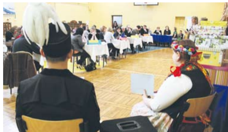
Drużyny zmierzyły się z pytaniami dotyczącymi Śląska i UE.