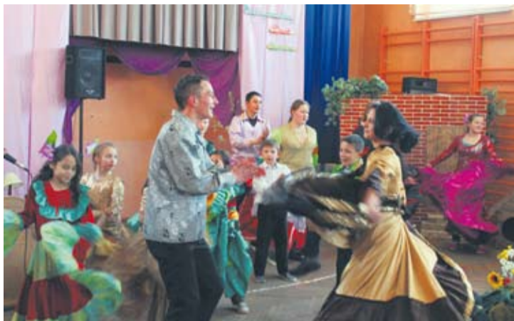
Na widzach ogromne wrażenie zrobili barwne romskie stroje.

Międzynarodowy Dzień Romów został ustanowiony w 1971 roku. Data ta upamiętnia I Światowy Kongres Romów, który odbył się pod Londynem.