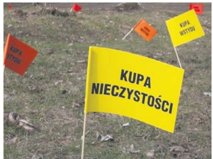
Zanieczyszczone miejsca w parku oznaczono chorągiewkami.