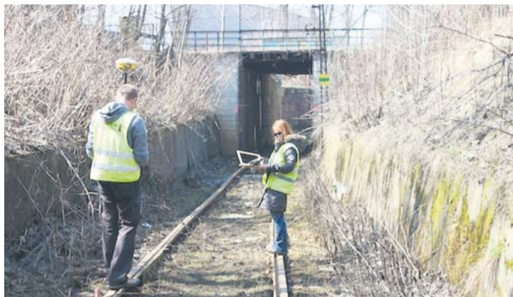
Pierwsze prace już ruszyły

Agnieszka Pach – agnieszka.pach@wiadomoscirudzkie.pl