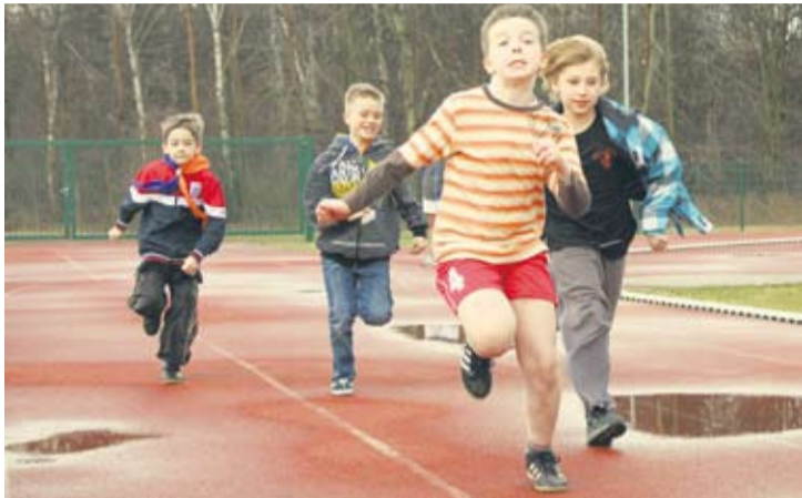
Zuchy i harcerze dawali z siebie wszystko w każdej z dyscyplin.