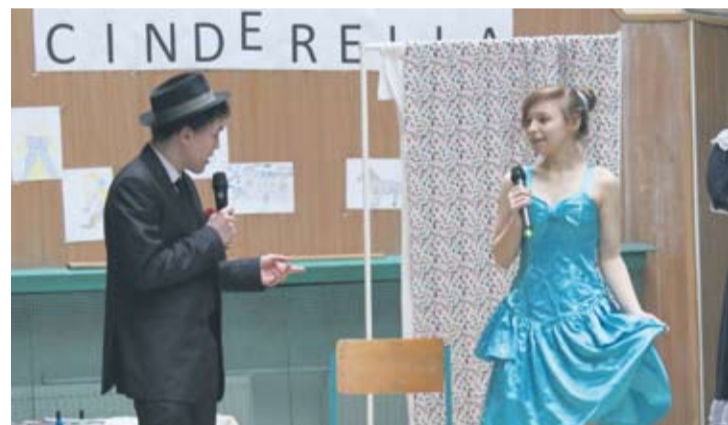
„Kopciuszek” w wersji angielskiej przypadł do gustu zebranym w auli uczniom.

Szesnaście kandydatek ubiegających się o tytuł Miss Rudy Śląskiej w pocie czoła ćwiczy kroki i układy taneczne, by oczarować publiczność i jury. O tym, która z dziewczyn zdobędzie tytuł Miss Rudy Śląskiej, przekonamy się już 20 kwietnia w trakcie wielkiej gali finałowej w MCK-u.