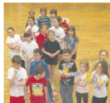
Zawodnicy z SP nr 41.