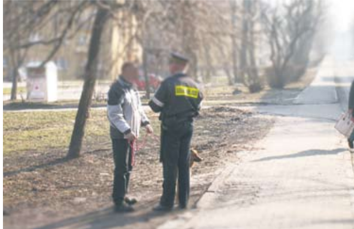
O sprząkaniu po psie przypomina również właścicielom czworonogów Straż Miejska.

– Z wyżej wymienionych powodów oraz z uwagi na ograniczone środki finansowe, miasto nie planuje w najbliższym czasie zakupu nowych koszy przeznaczonych wyłącznie na zwierzęce odchody – mówi rzecznik UM.