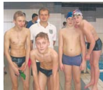
Młodzi pływacy z Rudy Śl. dobrze zaprezentowali się na zawodach.

reprezentanci Rudy Śląskiej. Miejsce drugie zajęła SP nr 30 wygrywając dziesięć konkurencji, dominując szczególnie w kategorii chłopców klas VI. Ogółem dziewczęta i chłopcy zdobyli 245 pkt. Trzecie miejsce przypadło naszym przedstawicielom z SP nr 18, którzy w obydwu kategoriach zdobyli 224 pkt. Szkoła Katolicka zadowolona się miejscem czwartym, zdobywając odpowiednio 136 i 218 pkt. Do wysokiego poziomu sportowego zawodów dostosował się również poziom organizacyjny. Dzięki współpracy organizatorów – nauczycieli z SP nr 30 i SP nr 18 oraz pracowników MOSiR-u z Rudy Ślą-