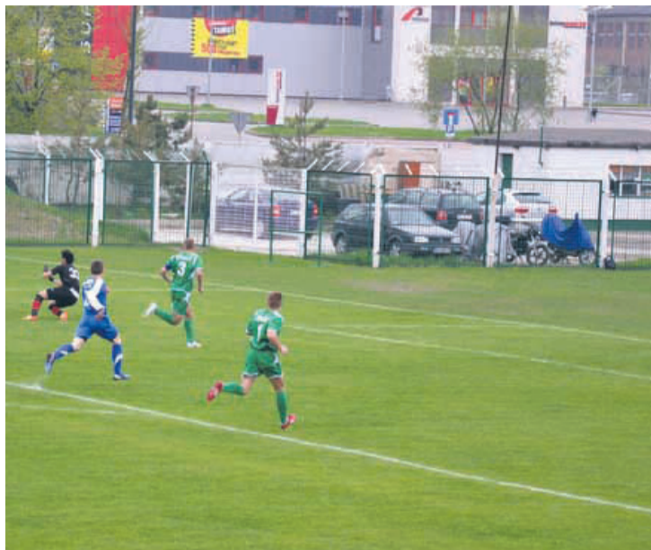
Grunwald w minionym tygodniu zdobył komplet punktów.

Z pewnością do udanych może zaliczyć ostatnie dwie kolejki Grunwald Ruda Śląska. Najpierw w środę zieloni pokonali przed własną publicznością Przyszłość Ciochowice 2:1. Następnie w sobotę udali się do Dąbrowy Górniczej, gdzie pokonali tamtejszego Zagłębiaka, wygrywając takim samym bilansem jak w środowym meczu.