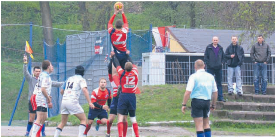
Gospodarzom niewiele zabrakło do tego, by znaleźć się w finałach mistrzostw Polski.