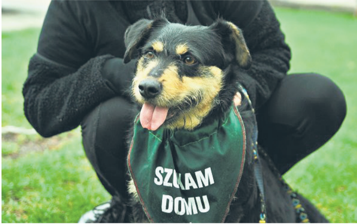
Każdy chętny może adoptować zwierzaka na odległość.

– Wirtualna Adopcja jest stworzona z myślą o osobach, które z różnych przyczyn nie mogą sobie pozwolić na posiadanie czworonoga we własnym mieszkaniu. Adoptujący ma możliwość odwiedzania i wyprowadzania na spacer swojego wirtualnego podopiecznego. My oferujemy comiesięczne przesyłanie informacji na temat danego podopiecznego oraz wmiarę możliwości, zdjęcia. Jeśli ktoś ma ochotę sprawić „swojemu” psiakowi niespodziankę w postaci zabawki lub karmy, nie ma problemu. Wystarczy przesłać prezent do