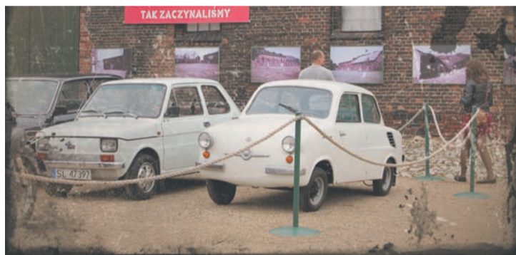
Muzeum PRL-u jest bogate w różne eksponaty.