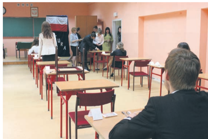
Uczniowie „Morcinka” nie wyglądali na szczególnie przerażonych.