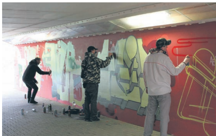
Pasjonaci graffiti tworzyli swoje prace prawie cały dzień.