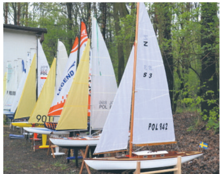
Na mistrzostwach pojawiło się wiele ciekawych modeli.

– Zainteresowaniem modelarstwem przejąłem od ojca, który gdy tylko skończyłem dziesięć lat zaczął mnie brać ze sobą na za-