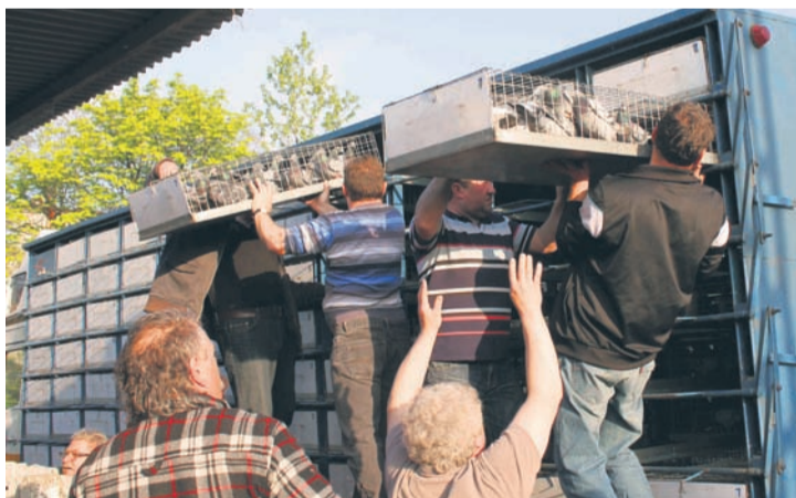
Ptaki czekała podróż, a później lot.

– Całą zimę przygotowywaliśmy się do tego sezonu. W poprzednim