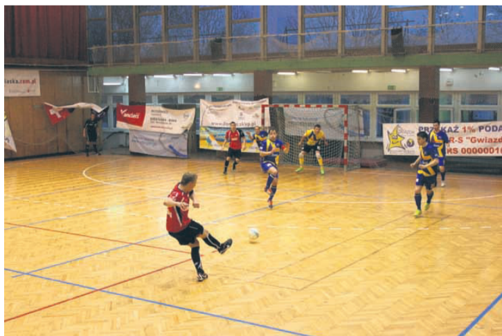
Gwiazda spadła do I ligi.