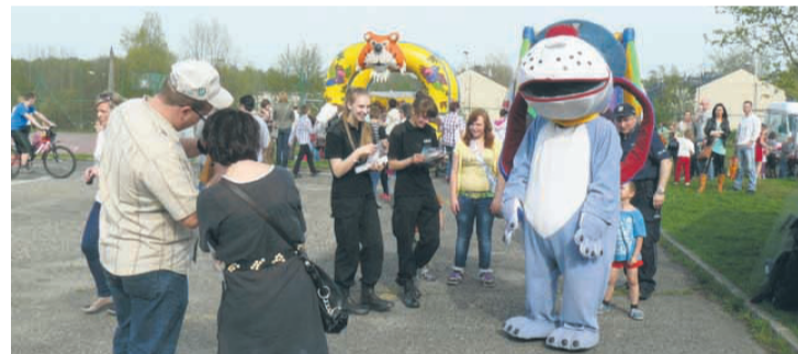
Na licznie przybyłych uczestników festynu czekał szereg atrakcji.