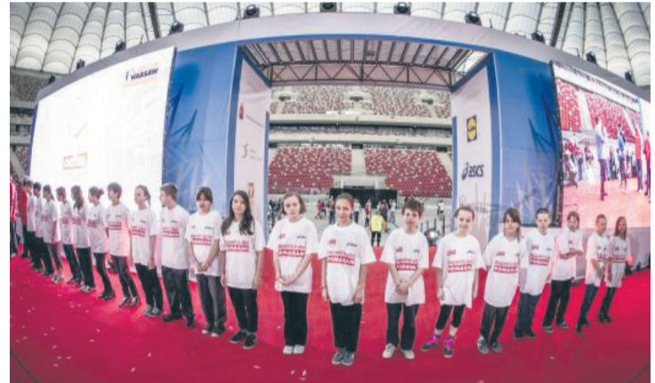
Uroczyste wręczenie stypendiów odbyło się 20 kwietnia br. na Stadionie Narodowym w Warszawie, na mecie biegu.