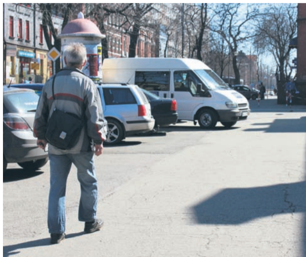
Plac przy MCK-u to niebezpieczne miejsce, głównie dla pieszych.