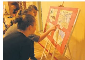
Pocztówki z Nowego Bytomia stworzone na potrzeby konkursu.

– Nasi uczniowie wiedzą o swojej dzielnicy bardzo dużo. Wiedzę czerpią z książek, Internetu, wiele zabytków dzielnicy mijają na co dzień – Hutę Po-