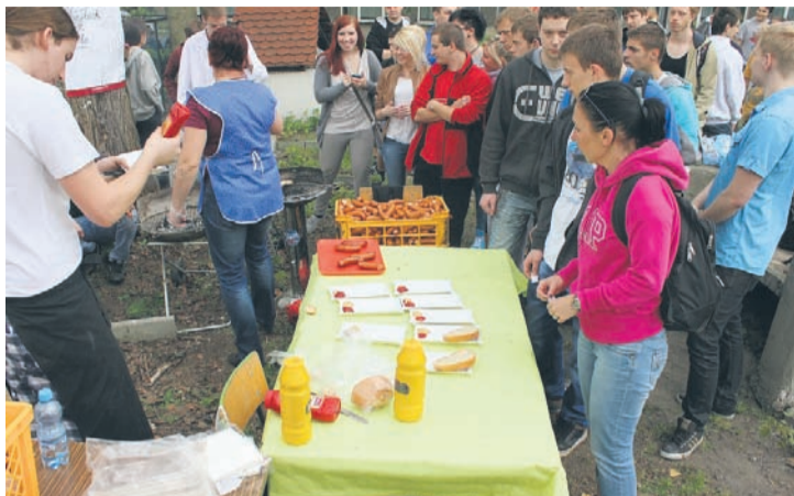
Grill na świeżym powietrzu na terenach ZSP nr 6 na Wirku.

– Podczas rajdu promujemy zdrowe życie i zdrowe odżywianie, impreza ma charakter profilaktycz-