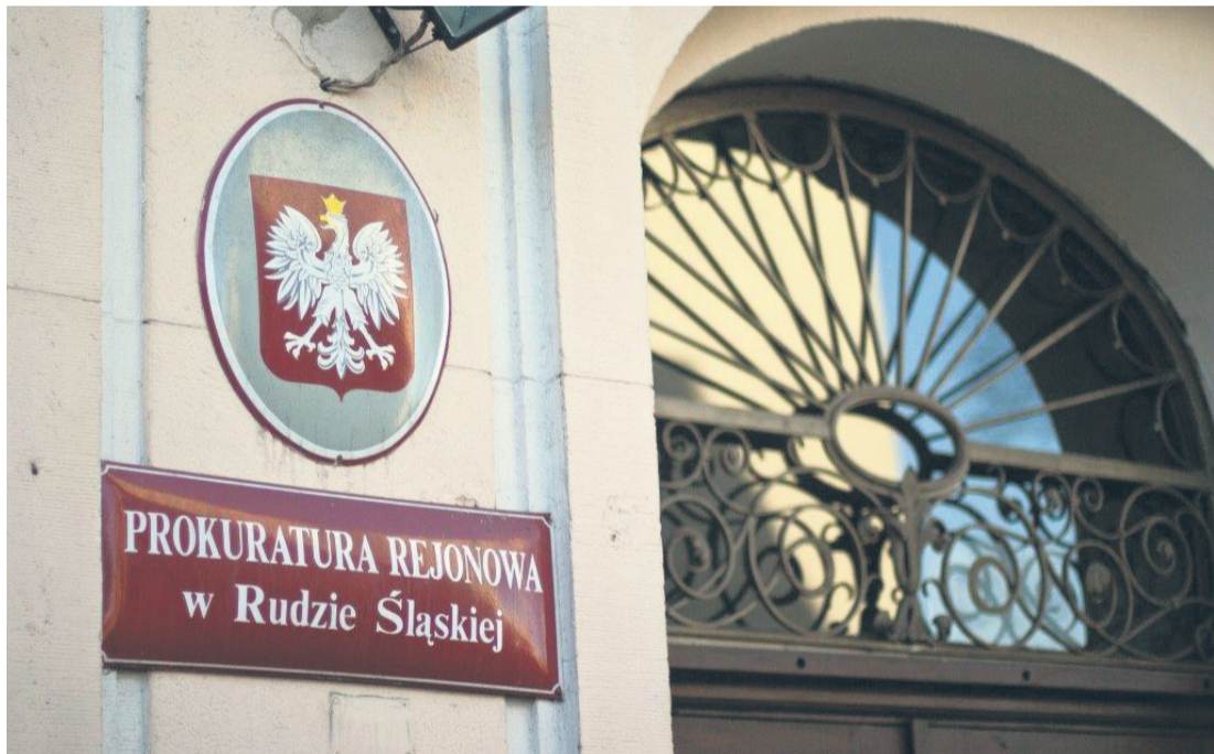
Prokuratura szybko zakończyła śledztwo dotyczące śmierci noworodka.