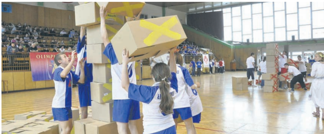
Ubiegłoroczna Olimpiada Radości odbyła się w hali MOSiR-u na Halembie.

– Tydzień Godności Osób Niepełnosprawnych to nasza rudzka tradycja, a zarazem okres wyczekiwany przez osoby niepełnosprawne zaangażowane w jego obchody. Miejski Ośrodek Pomocy Społecznej pełni rolę koordynatora tych działań, które zapoczątkowane zostały w naszym mieście przez Caritas Archidiecezji Katowickiej w 2003 roku. Dzięki zaangażowaniu wielu organizacji i instytucji, impreza ta staje się coraz bardziej barwna i interesująca. Powoli zaczyna brakować dni tygodnia, aby każdy z chętnych organizatorów mógł zaprezentować osiągnięcia swoich podopiecznych lub podzielić się tym, co najlepsze w jego działalności. Z tej okazji serdecznie zapraszam do udziału w imprezach przede wszystkim osoby niepełnosprawne, które są gospodarzami tego przedsięwzięcia, jak również wszystkich życzliwych mieszkańców Rudy Śląskiej, którym na sercu leżą problemy tych osób.