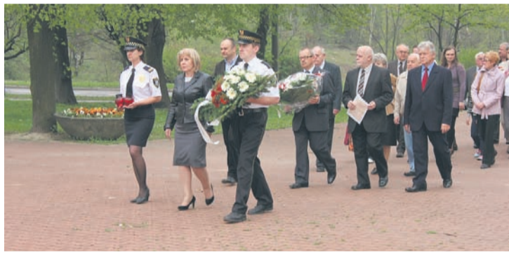
Złożenie kwiatów pod Pomnikiem Czynu Powstańczego w Rudzie Śląskiej.