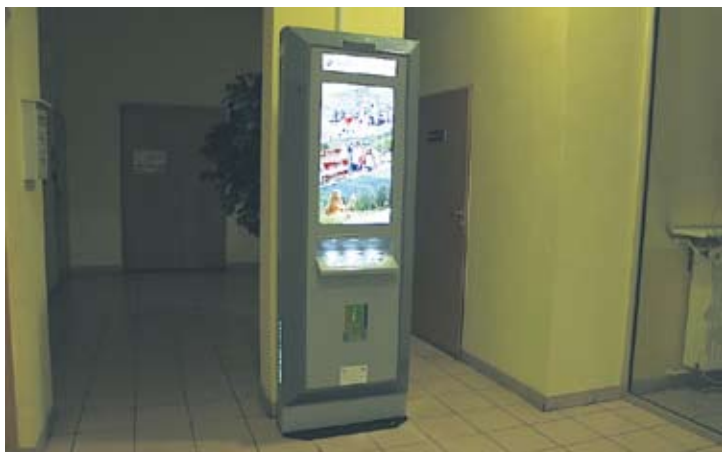
Jeden z Infokiosków stoi w MCK-u.

– Infokioski mają na celu promowanie turystyki. Można w nich zapoznać się ze szlakami turystycznymi, opracować własną trasę turystyczną lub wybrać gotową. W Infokioskach będą umieszczone atrak-