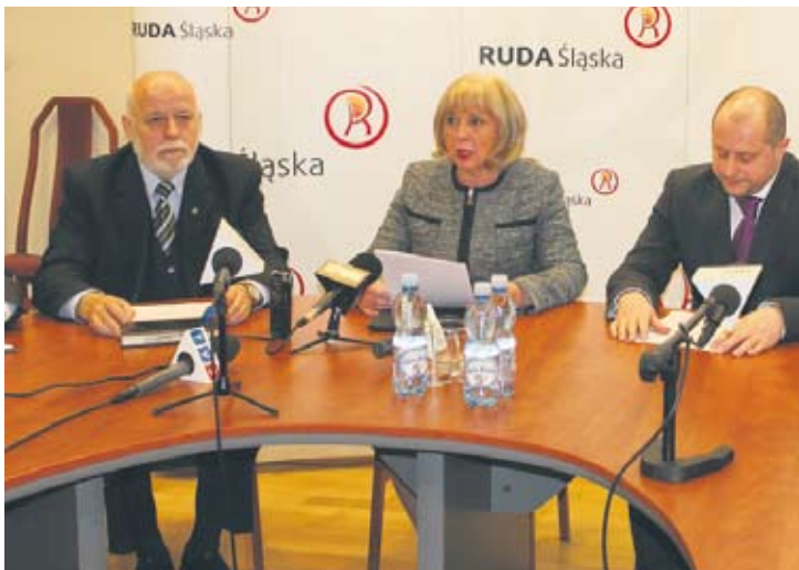
Poniedziałkowa konferencja w sprawie nieprawidłowości przy zbieraniu podpisów.

Na ślad popełnienia przestępstwa władze miasta wpadły po otrzymaniu od jednego z mieszkańców miasta informacji o nakłanianiu go przez osobę popierającą referendum do naruszenia prawa. Stwierdził on, że był nakłaniany do udostępniania numerów PESEL mieszkańców Rudy Śląskiej. Władze miasta postanowiły sprawdzić, czy przy zbieraniu podpisów ktoś nie skorzystał z bazy danych rudzkiego magistratu. W wyniku przeprowadzonej kontroli odkryto, że jeden