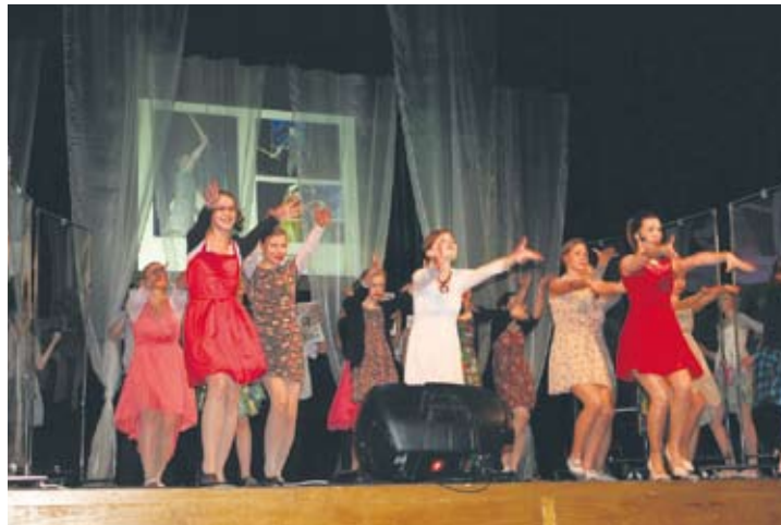
Jubileuszowe spotkanie było okazją do przypomnienia fragmentów musicali.