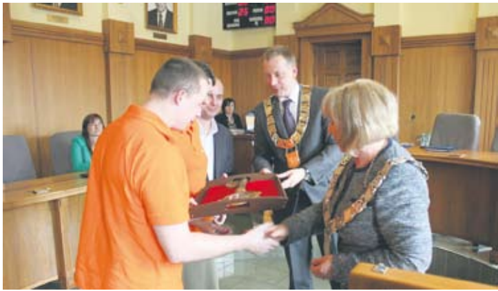
Uroczyste przekazanie kluczy.