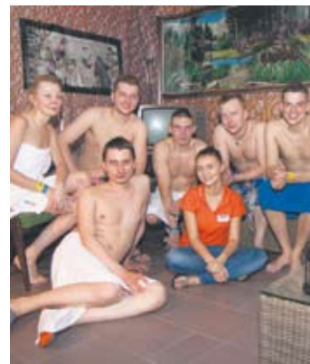
W Saunarium zawitały śląskie klimaty.

– Regularnie odwiedzamy sauny. Wcześniej musieliśmy jeździć do Dą-