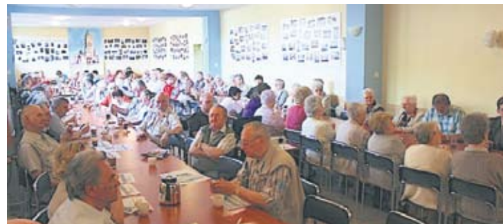
Emeryci i renciści licznie uczestniczą w organizowanych spotkaniach.