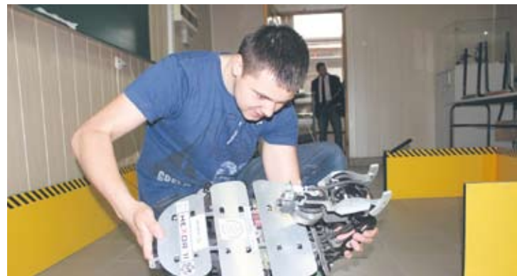
Dzień Otwarty w „Tołstoju”.