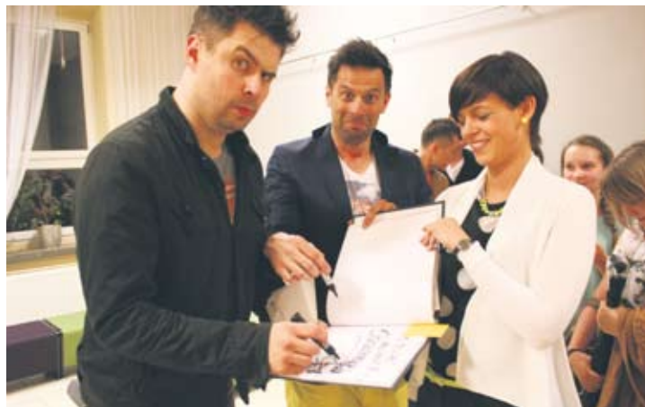
Fani kabaretu ustawiali się w kolejce po autografy.