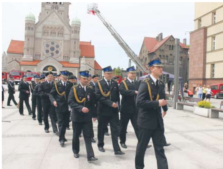
Z okazji Dnia Strażaka na placu Jana Pawła II odbył się uroczysty apel.

Sandra Hajduk – sandra.hajduk@wiadomoscirudzkie.pl