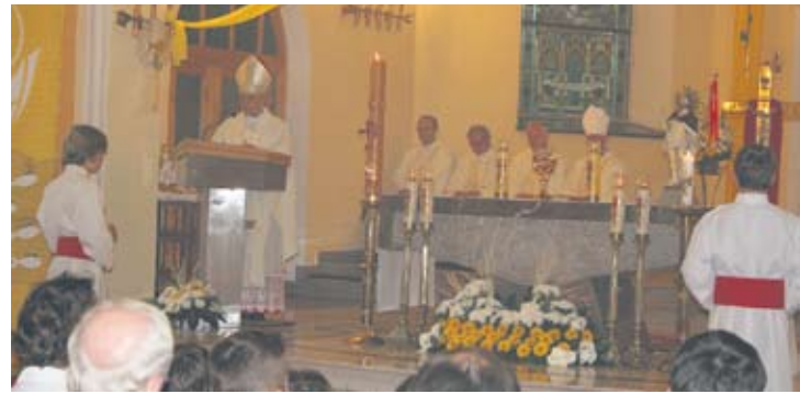
Uroczysta msza odbyła się o godz. 10.00 w Bielszowicach.