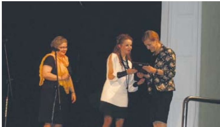
Wyróżnienie dla redakcji „Wiadomości Rudzkich” odebrała sekretarz redakcji „WR”.

– Pięć lat temu, kiedy nasz teatr powstawał, nie przypuszczaliśmy że urośnie do tak dużej grupy i maszyny, która napędza się cały czas. Pracujemy z inną grupą młodzieży, bo pracujemy przy liceum – uczniowie odchodzą, przychodzą nowi, a niektórzy absolwenci z nami wciąż grają. Są i