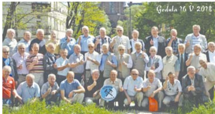
Na fotografii byli działacze i zawodnicy nieistniejącego już klubu.