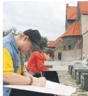
Uczestnicy pleneru docenili walory nowobytomskiego rynku.

– To, co dziś robimy, jest uzupełnieniem naszych działań prowadzonych w ramach zajęć Warsztatów Terapii Zajęciowej. Jest to także próba pokazania tego, że wokół nas