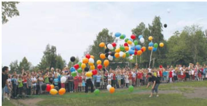
Setka balonów wypuszczona przed szkołą zrobiła na uczniach duże wrażenie.