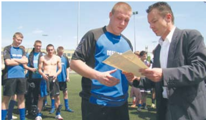
Rudzianom niewiele zabrakło, by awansować do dalszej części rozgrywek.

W środę 15 maja szkolna drużyna ZS nr 5 reprezentująca Rudę Śląską rozegrała turniej półfi-