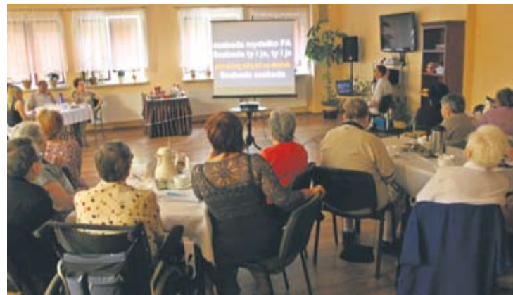
Uczestnicy z biegiem czasu coraz śmielej bawili się podczas imprezy.