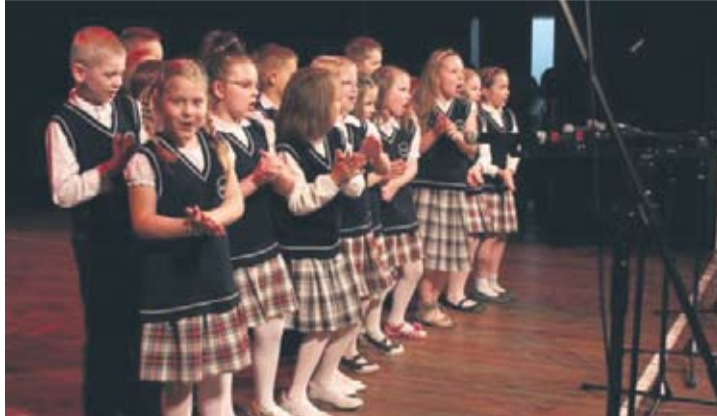
Dzieci zaprezentowały na scenie przeróżne talenty.

– Jestem bardzo pozytywnie zaskoczona występami dzieci. Moje dziecko maluje i jestem dumna z te-