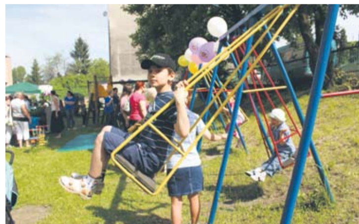
Najcenniejszy widok to uśmiechnięte twarze dzieci.