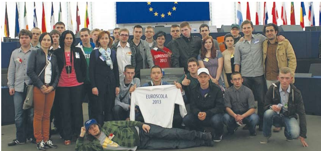
Wyjazd do Parlamentu Europejskiego był dla uczniów nagrodą w konkursie „Euroscola”.