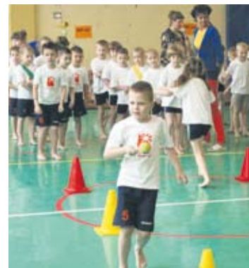
Imprezie towarzyszyła atmosfera prawdziwych igrzysk.

– Każde przedszkole będzie reprezentować ośmiu uczestników. Są to zawody sportowe, a więc będą konkurencje takie jak rzuty czy bieg