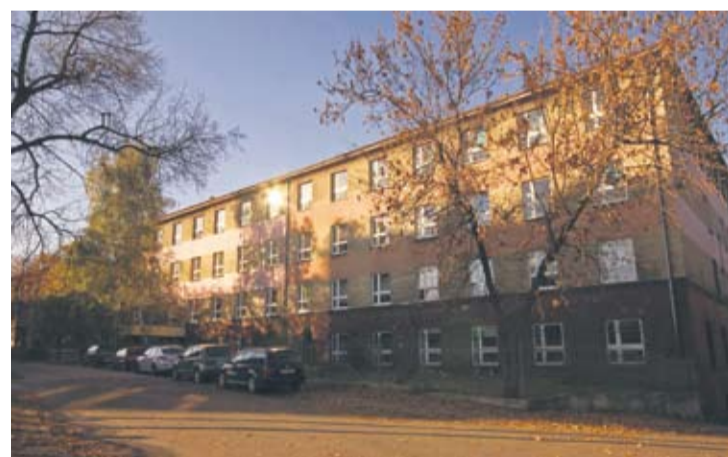
ZSP nr 4 im. Piotra Latoski na Czarnym Lesie.

– To zawód bardzo nowoczesny. Na polskim rynku jest nauczany od ośmiu lat. Mechatronik łączy w sobie mechanikę oraz elektroniczne układy programowalne sterujące danym urządzeniem. Każdy nowoczesny zakład przemysłowy nie obejdzie się dzisiaj bez mechatroniki. Przedmiotem działań mechatro-