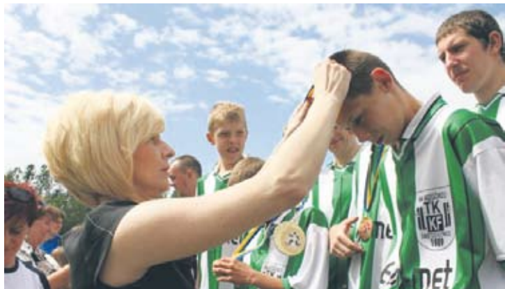
Uczestnicy turnieju dostali pamiątkowe medale.