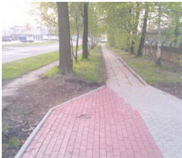
Droga rowerowa przebiegająca wzdłuż ulicy Kokotek znikająca się kończy.