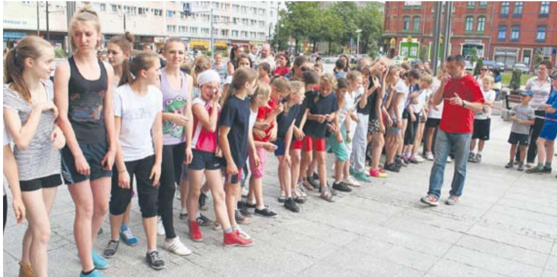
Tydzień Profilaktyki rozpoczął się od Biegu Radości.