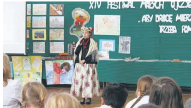
Zakończenie festiwalu uświetnili swoim występem zdobywcy najwyższych miejsc.