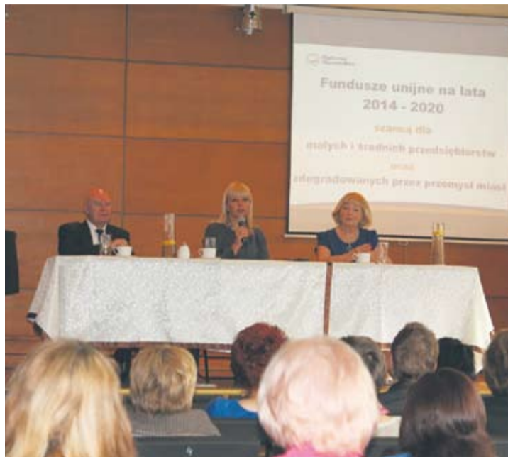
Spotkanie odbyło się w poniedziałek na Nowym Bytomiu.