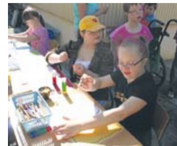
Uczniowie ZSS nr 3 wzięli udział w konkursach plastycznych i sportowych.

– Staramy się, aby dzieci czuły się docenione w tym dniu. To jest ich