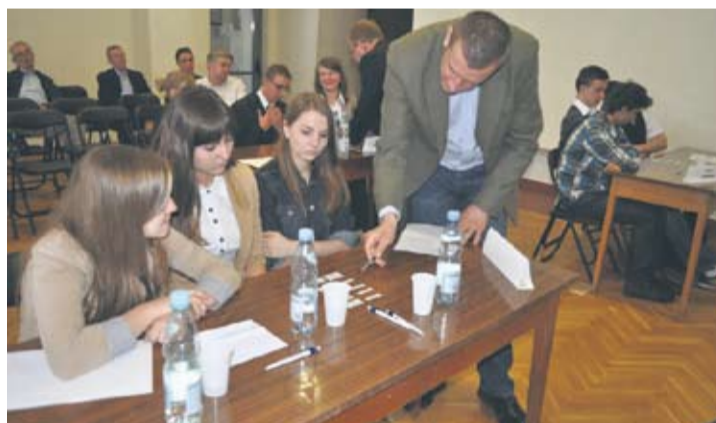
Uczniowie rywalizowali w trzyosobowych drużynach.