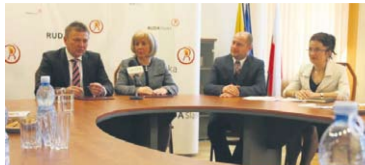
Ruda Śląska jest pierwszym miastem Metropolii Śląska, które w pełni sfinalizowało „przetarg śmieciowy”.