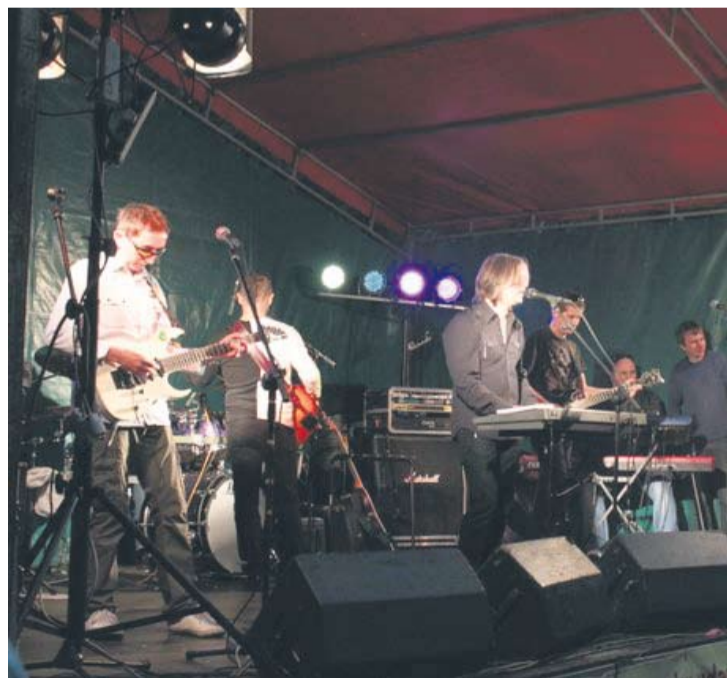
W trakcie festynu odbywały się różnego rodzaju występy.