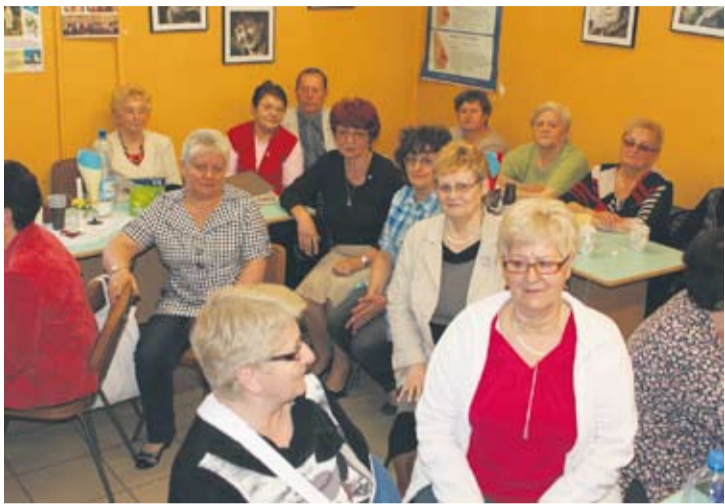
Rudzkie amazonki w swojej siedzibie przy ul. Oddział Młodzieży Powstańczej 12 w Kochłowicach.

W ramach Tygodnia Godności Osób Niepełnosprawnych w siedzibie rudzkiego Stowarzyszenia