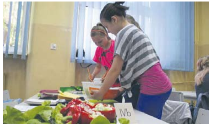
Robienie sałatek było dla dzieci połączeniem dobrej zabawy ze zdobywaniem wiedzy.