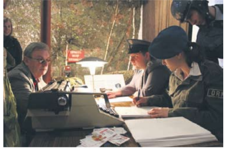
Tej nocy na zwiedzających muzea czekało wiele atrakcji.