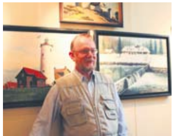
Rudzki artysta nie wyobraża sobie życia bez malowania.

– Pamięta Pan początki swojej przygody z malarstwem?