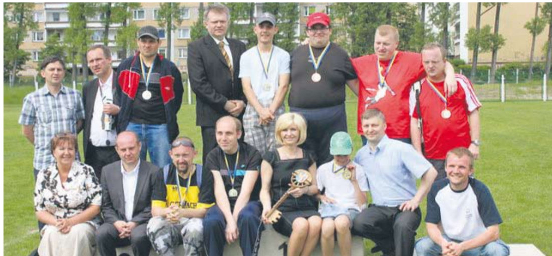
W poniedziałek niepełnosprawni zwrócili klucz do bram miasta.

– W zależności od charakteru, każdy z naszych sportowców inaczej podchodzi do tego typu turnieju. Dla niektórych jest to nawet sposób na życie. Oni żyją od zawodów do zawodów. Bardzo się starają, a przede wszystkim trenują, bo zawody to zwieńczenie całego cyklu