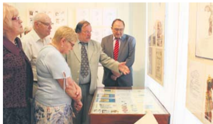
Na jubileuszowej wystawie pojawiło się wielu gości.