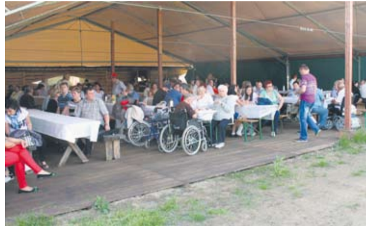
Uczestnicy festynu świetnie się bawili.