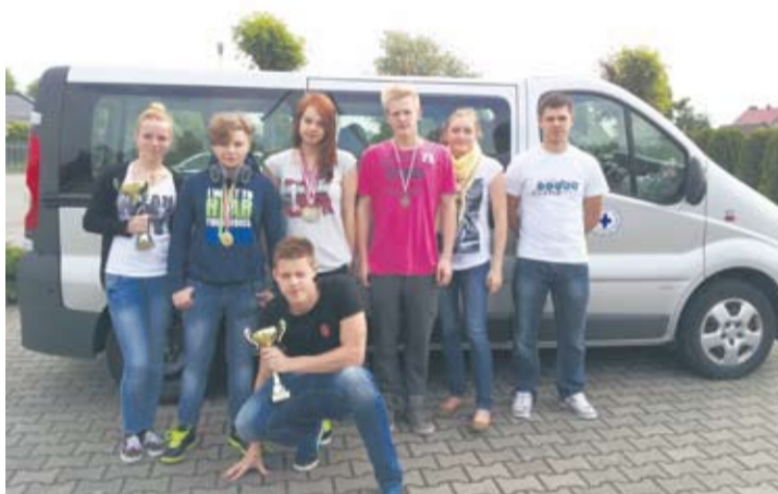
II runda Grand Prix Polski w Ratownictwie Wodnym okazała się być lepsza dla rudzkich ratowników niż I runda.

18 maja w Świdwinie odbyła się II runda Grand Prix Polski w Ratownictwie Wodnym.