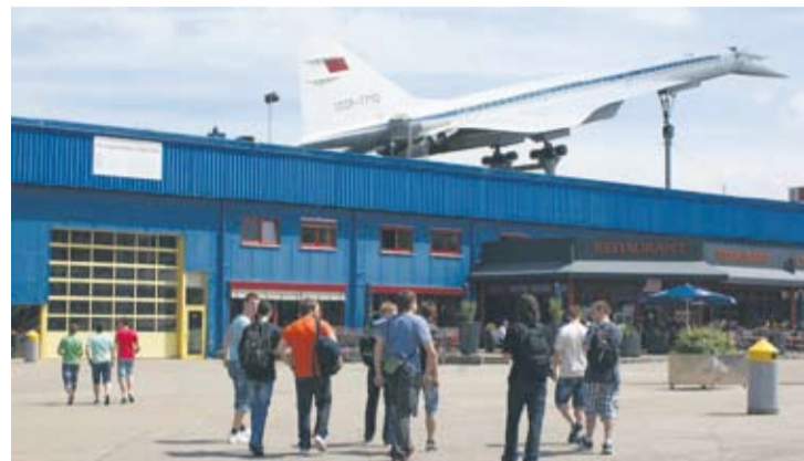
W niemieckim muzeum każdy mógł wejść do francuskiego samolotu Concorde.