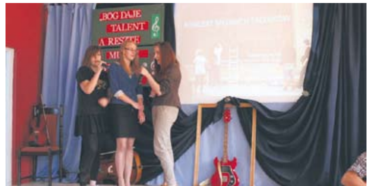
Spotkaniu towarzyszyły słowa piosenki Anny Marii Jopek „Bóg daje talent, a resztę musisz wygrać sam”.

Sala pełna rodziców, gości, uczniów i pracowników Gimnazjum nr 11 na Nowym Bytomiu, a na scenie same talenty. W murach szkoły w miniony piątek już po raz 11 odbył się doroczny Koncert Młodych Talentów.