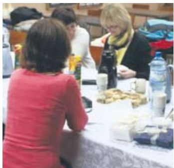
Program był okazją do wymiany doświadczeń.

– Młodzi ludzie, którzy przyjeżdżają do nas zostają u rodzin, więc poznają kulturę od podszewki. Zwiedzają także ciekawe miejsca. Mieli okazję przejechać się kolejką wąskotorową w kopalni srebra w Tarnowskich Górach, zobaczyli Kraków i zwiedzili Auschwitz. Wzięli także udział w zajęciach re-