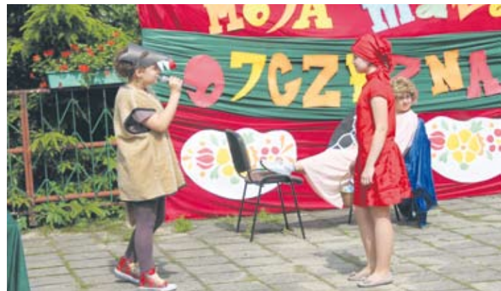
Pogoda sprzyjała organizacji rodzinnego święta.