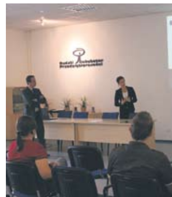
Szkolenia odbyły się w Rudzkim Inkubatorze Przedsiębiorczości.

– To szkolenia dla doświadczonych przedsiębiorców, którzy prowadzą już działalność gospodarczą dłużej niż trzy lata i mogliby przyjąć do siebie na staż młodych przedsiębiorców z Europy i przybliżyć im temat prowadzenia swojej działalności gospodarczej w branży. Druga grupa, do której adresowane jest szkolenie, to młodzi przedsiębiorcy,