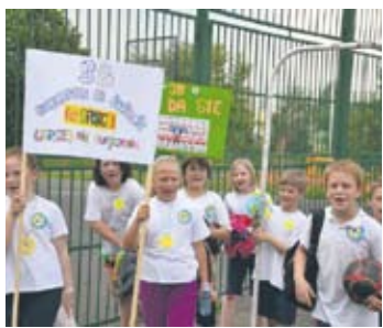
Dzieci przygotowały transparenty i wzajemnie się dopingowały.

– Hasło przewodnie dzisiejszego Dnia Sportu brzmi „Kibicujemy kulturalnie”. W związku z tym dzieci musiały wcześniej przygotować plakaty oraz