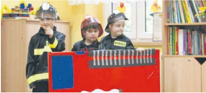
Przedszkolaki wystawiły przedstawienie o strażakach.

Przedszkolaki z MP nr 47 wystąpiły w środę z przedstawieniem pt. „Czemu Handzik chciał zostać fojermanym” napisanym przez Moni-