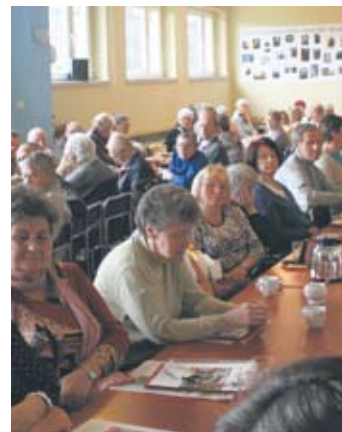
Seniorzy podczas spotkania na Nowym Bytomiu.

Na spotkaniu pojawili się przedstawiciele Klubu Inteligencji Katolickiej, Klub Gazety Polskiej oraz grupa wspierająca Telewizję TRWAM i Radio Maryja w Rudzie Śląskiej.