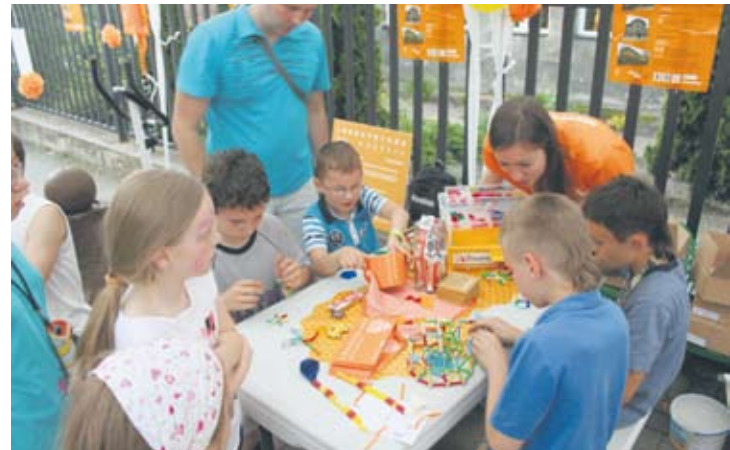
Dzieci świetnie się bawiły poznając tajniki energii.

– Staramy się pokazywać dzieciom, że za pomocą rzeczy, które mają w domu oraz skromnego zaplecza chemicznego, są w stanie zrobić coś interesującego. Pokazu-