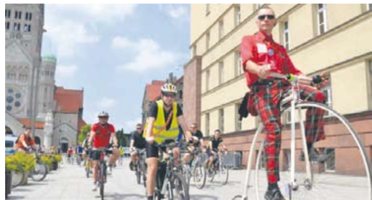
Śląski Spęd Rowerowy cieszył się dużym zainteresowaniem miłośników dwóch kółek.

Rowerzyści wyruszyli z Katowic. Przejechali przez Chorzów, Świętochłowice, Rudę Śląską, Bytom i Zabrze. Meta przejazdu znajdowała się pod radiostacją w Gliwicach. Tam odbył się piknik rodzinny.