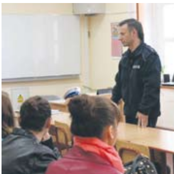
Uczniowie ZSP nr 1 mieli okazję zapoznać się z zasadami ruchu drogowego.