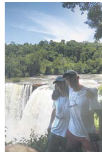
Rowerzyści zobaczyli podczas podróży wiele malowniczych miejsc.

– Zmęczenie nas nie zaskoczyło, we znaki dały nam się jednak brazylijskie upały. Często tak się zdarzało, że odczuwaliśmy wstępne objawy udaru. Towarzyszyły nam tam wahania temperatur – od śnieżyc, poprzez wilgotne deszcze i upały. Przez pierwsze dwa tygodnie trudno było znieść takie warunki – tłumaczy rowerzysta.