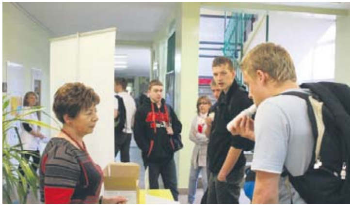
W trakcie festynu młodzież mogła między innymi sprawdzić wydolność płuc.