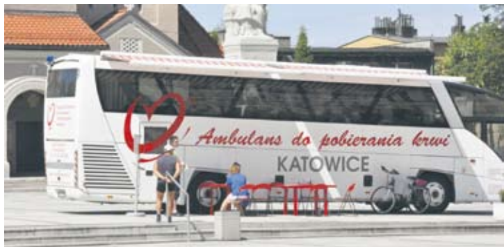
Ambulans na placu Jana Pawła II.