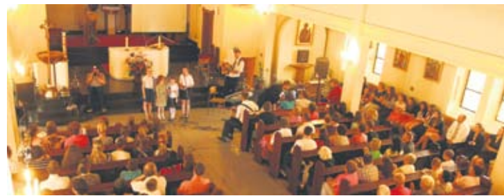
W kościele pojawiło się wielu chętnych do pomocy.