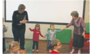
Podczas zajęć dzieci bawiły się razem ze swoimi babkami i dziadkami.