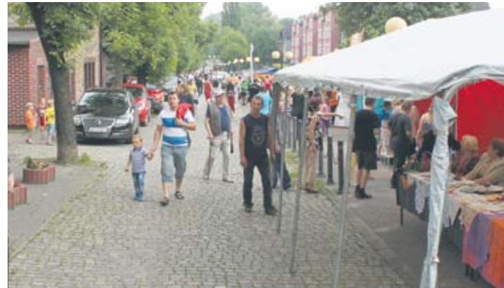
Deptak przy osiedlu „Ficinus” pękał w szwach.

Nie lada gratka na miłośników techniki czekała przy szybie „Mikołaj”, w którym została urucho-