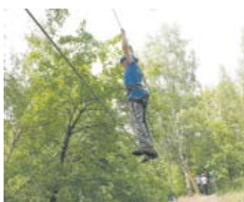
Przeprawa na linie była jedną z trudniejszych konkurencji.

– Uczestniczę w grze pierwszy raz, ale bardzo mi się podoba. W jednej konkurencji musieliśmy skonstruować telegraf i wysłać kod alfabetem MORSE’A,