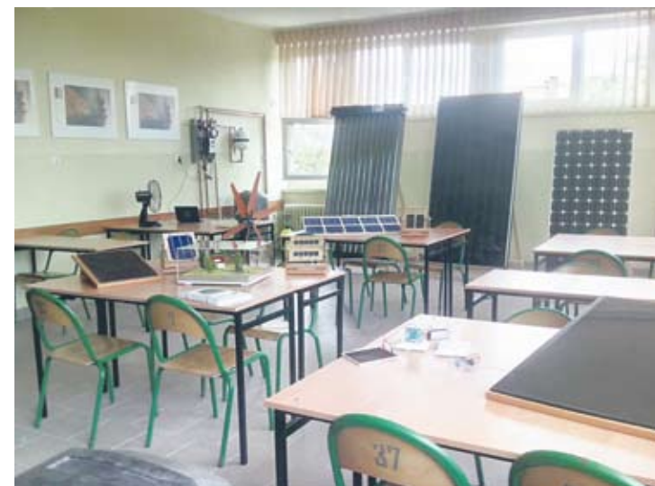
W przyszłym roku szkolnym uczniowie nowego kierunku w Zespole Szkół Ponadgimnazjalnych nr 6 będą mogli korzystać z nowoczesnej pracowni energetyki odnawialnej. Część z zajęć odbywać się będzie również w pracowniach Politechniki Śląskiej.

– Dzisiejszy rynek pracy potrzebuje fachowców, dlatego z roku na rok coraz więcej młodych ludzi wybiera technikum lub szkołę zawodową. Chcemy, żeby kontynuowali oni naukę w Rudzie Śląskiej. Od tego roku szkolnego w mieście funkcjonuje nowa szkoła górnicza, a już od września w trzech szkołach uruchomione zostaną cztery nowe kierunki kształcenia – podkreśla prezydent Grażyna Dziedzic. – Nowoczesna baza dydaktyczna, praktyki w znanych i cenionych firmach oraz możliwość nauki języków obcych sprawiają, że przed absolwentami rudzkich szkół ponadgimnazjalnych stoją otworem również i zagraniczne rynki pracy – dodaje prezydent.