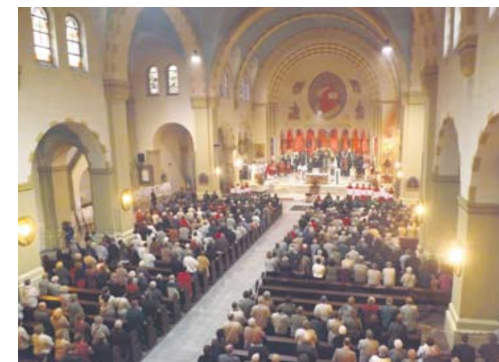
Uroczystości uświetniła msza święta z udziałem władz samorządowych i mieszkańców miasta.

Ostatecznie problem rudzkiego herbu powrócił w 1996 roku, kiedy to Rada Miejska wyraziła wolę