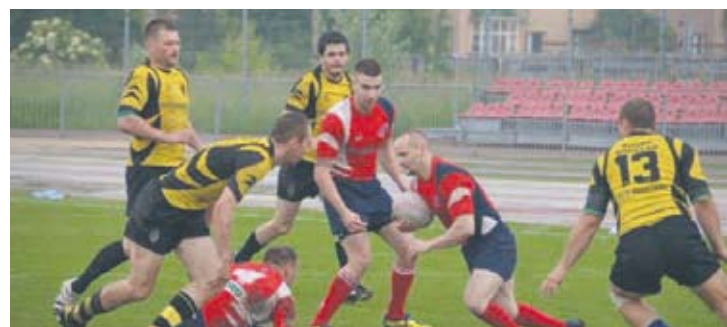
W turnieju w Lubinie zagrały dwie drużyny Igloo RC Ruda Śląska.

W rozgrywkach grupowych IGLOO RC I pokonało Gentlemen's Rugby Club Łódź 34:0 i drugi zespół gospodarzy Miedziowych Lubin 31:0. Z kolei IGLOO RC II w swojej