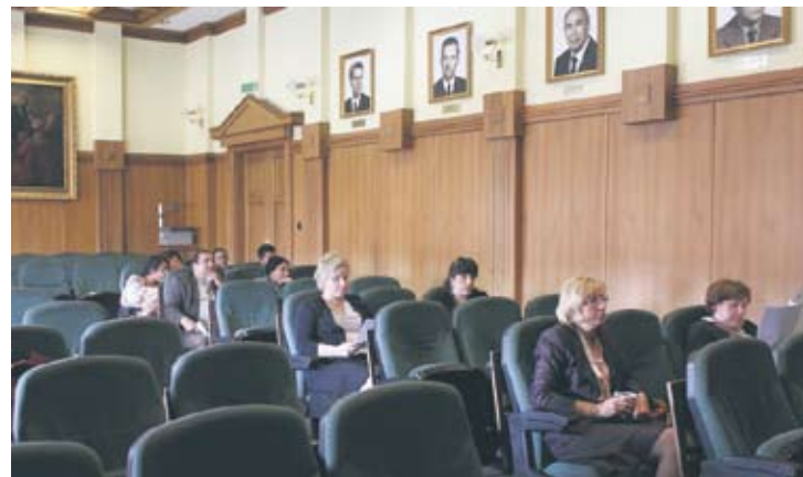
W piątek w Rudzie Śląskiej odbyła się inauguracja projektu aktywizacji śląskich Romów.