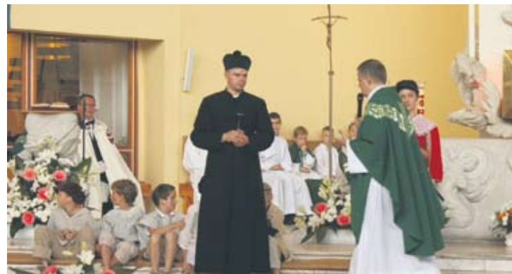
Podczas kazania ksiądz przybliżył postać św. Filipa.