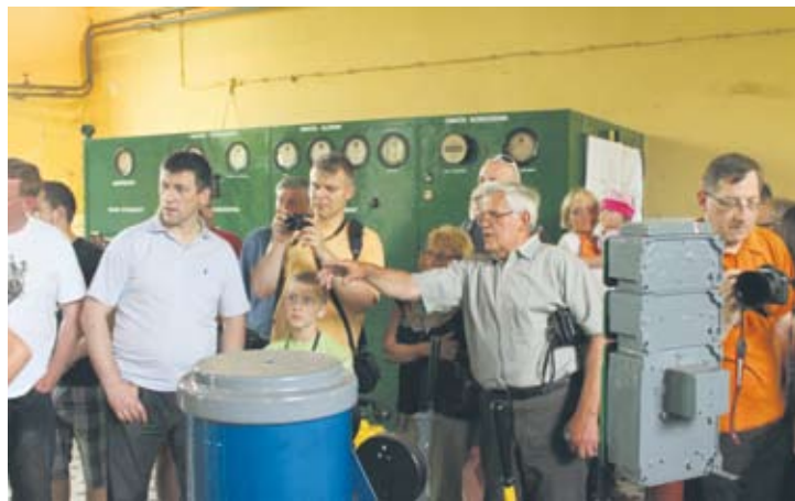
Maszyna wyciągowa szybu „Mikołaj” zachwycała uczestników Industriady.

– Takie obiekty to jest to, co warto promować. Impreza przyciąga coraz większe rzesze ludzi i o to chodzi! – podsumowuje pan Adam, uczestnik imprezy.