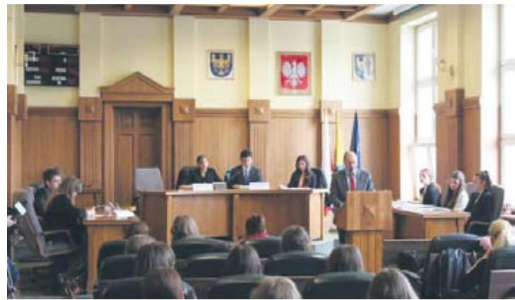
Debata przebiegała bardzo burzliwie.