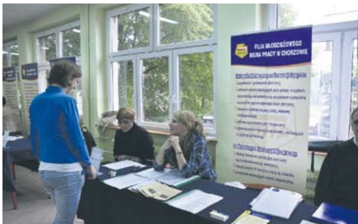
Targi pracy odbyły się w ubiegły czwartek w ZSP nr 6 na Wirku.

– Zapraszałyśmy wszystkie szkoły ponadgimnazjalne, choć niektóre nie odpowiedziały na naszą propozycję. Ale wielu uczniów przyszło pojedynczo z poszczególnych