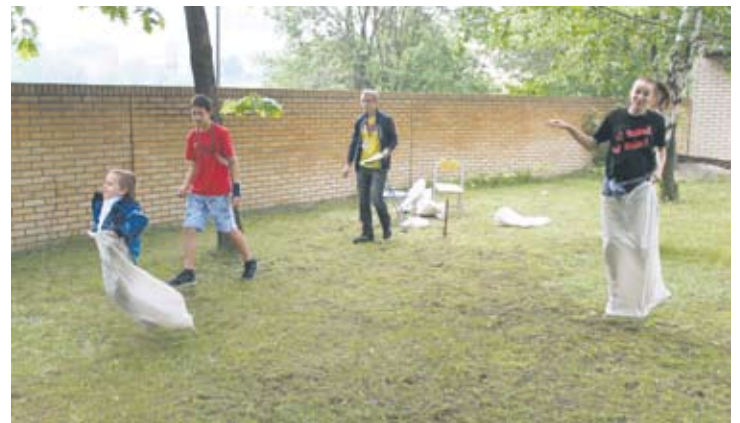
Najmłodsi parafianie bawili się podczas gier sportowych.