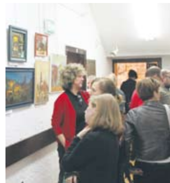
Na wernisażu wystawy pojawiło się mnóstwo gości.