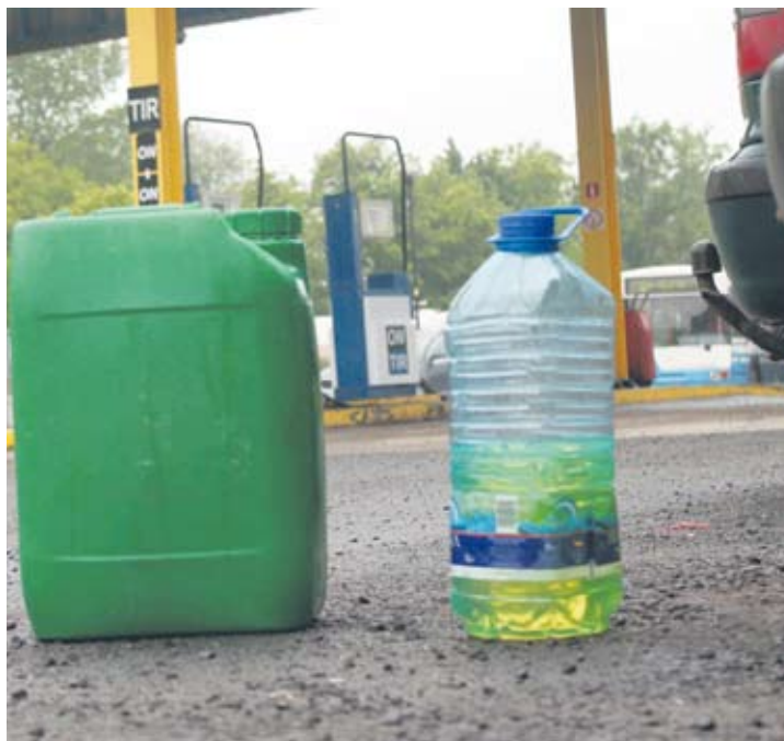
Policja pobrała próbki do analizy.

– Będziemy prowadzili postępowanie w tej sprawie. Z moich informacji wynika, że próbki paliwa zostały pobrane. Następnie zostaną one najpewniej przebadane – za-