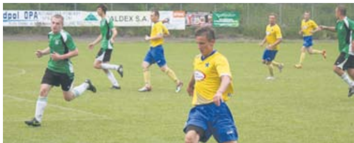
Mimo prowadzenia, Slavii nie udało się wygrać sobotniego meczu.