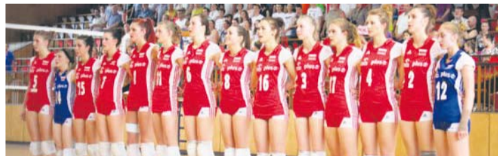
Reprezentacja Polski bardzo dobrze zaprezentowała się i wygrała trudne spotkanie.

Reprezentacja Polski kadetek przygotowuje się do mistrzostw świata, które na przełomie lipca i sierpnia odbędą się w Tajlandii. Przed wyjazdem dziewczyny rozegrają kilka spotkań towarzy-