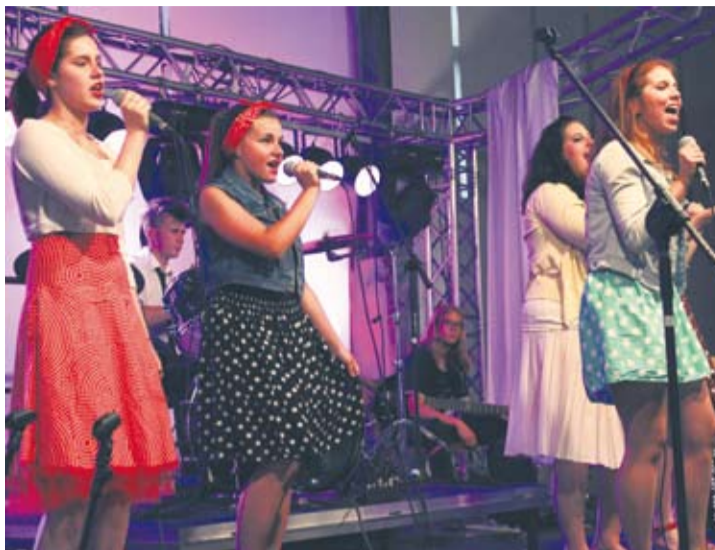
Teatr Bezpański nie tylko rozbawiał, ale i porywał do tańca.