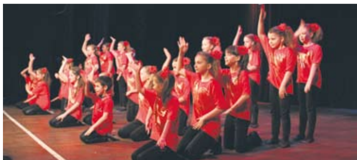
Zespół Diament z Miejskiego Centrum Kultury im. Henryka Bisty.