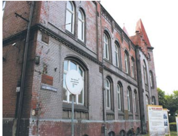
Wyższa Szkoła Nauk Stosowanych najprawdopodobniej wejdzie w posiadanie ratusza.

– Budynek był w fatalnym stanie. W miarę możliwości staraliśmy się odtworzyć klimat dawnych czasów – opowiada Jerzy Kasperk, jeden z inicjatorów przedsięwzięcia. W najbliższym czasie okaże się, czy mieszkańcy Orzegowa docenią cały trud.