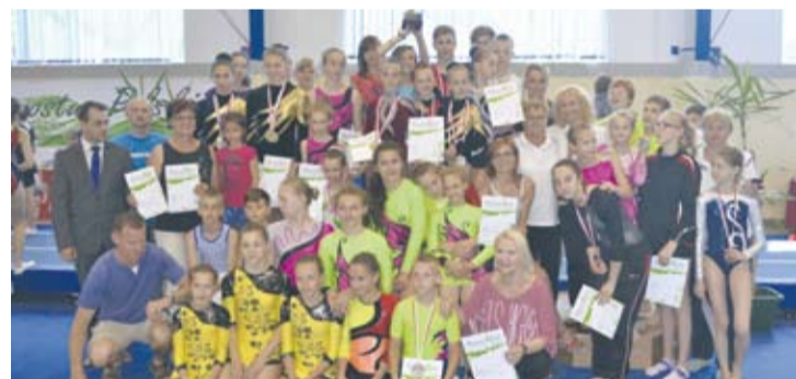
Mistrzostwa Polski Juniorów Młodszych okazały się być owocne dla rudzkich akrobatów.