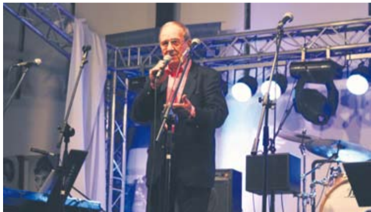
Utwory Andrzeja Dąbrowskiego znają starsi i młodzi.

Jak na prywatkę przystało, rozbrzmiały najbardziej znane polskie przeboje tamtych lat, które nucone są do dzisiaj – gwiazdą wieczoru był Andrzej Dąbrowski, znany wo-