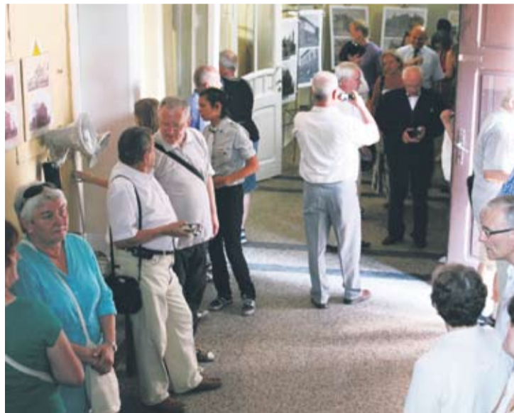
Dobrze zagospodarowany ratusz może ożywić dzielnicę.