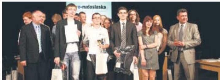
Finaliści konkursu „Z demokracją na Ty – Polska, Europa, Świat”.