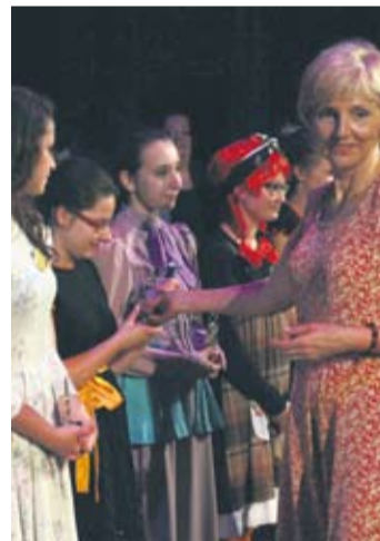
Dziesięć laureatek zostało wyróżnionych statuetkami Złotego Pierrota.

Kiedyś były to pogańskie obrzędy związane z letnim przesileniem słońca, które później stały się elementem obchodów wigilii św. Jana Chrzyciela i są z nami do dziś. W minioną sobotę w Bielszowicach hucznie obchodzono Noc Świętojańską. Zabawa trwała do późnych godzin nocnych.