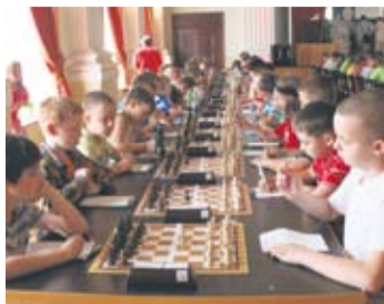
Zmagania młodych szachistów trwają będą pięć dni.

Mistrzostwa Śląska zostaną wyłonieni z grup dziewcząt i chłopców w kategoriach wiekowych do