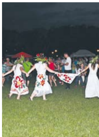
Do tańca porywały dziewczyny z Teatru „Moklandia”.