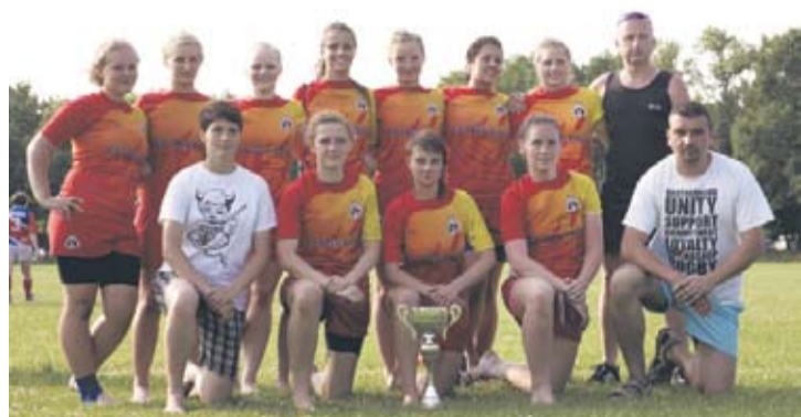
Wicemistrzyni Polski sporo natrudziły się by odnieść taki sukces.

W półfinale Tygrysyce trafiły na Black Roses, a Diablice musiały się zmierzyć z faworytem do złota, niepokonanymi w tym sezonie Ladies Lechia Gdańsk. Jednak mimo zaciętej walki, mecz nie udało się wygrać. Spotkanie zakończyło się stanem 7:10.