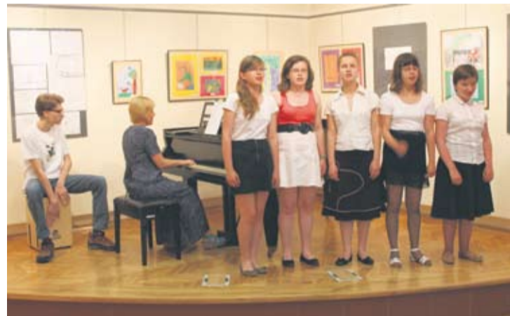
Wernisaż uatrakcyjnił występ muzyczny młodzieży z krakowskiego ośrodka.