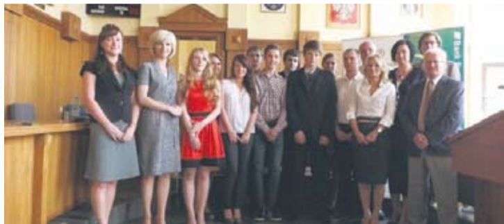
Uczestnicy i organizatorzy konkursu podczas posiedzenia Komisji Oświaty.