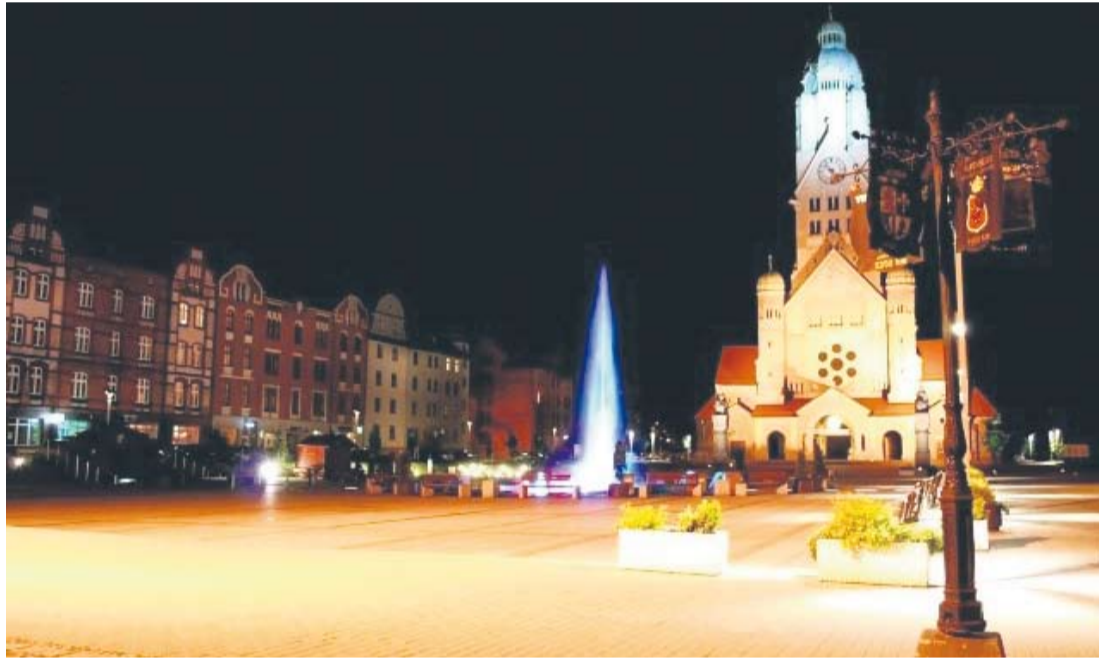
Plac Jana Pawła II to jedna z dwóch inwestycji zrealizowanych ze środków unijnych, która zainspirowała Katarzynę Trzcińską.

Koncert jest nagrodą w konkursie „Europa to my!”. Jego uczestnicy mieli za zadanie zrobienie zdjęć przedstawiających miejsca, które zmieniły się dzięki unijnym dotacjom. Z nadesłanych zgłoszeń wybrano dziesięć najciekawszych. Wśród nich znalazły się fotografie wykonane przez Katarzynę Trzcińską, która zainspirowała się rudzkim rynkiem i trasą N-S.