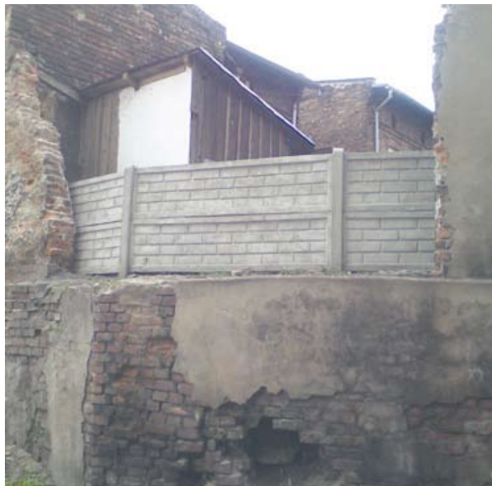
Plac z problematycznym murem nie wygląda zbyt estetycznie.

Wygląda na to, że problem ten za niedługo ma zostać rozwiązany, jednak samo załatwienie ubytków to nie wszystko, obiekt ten z pewnością wymaga dalszego remontu.