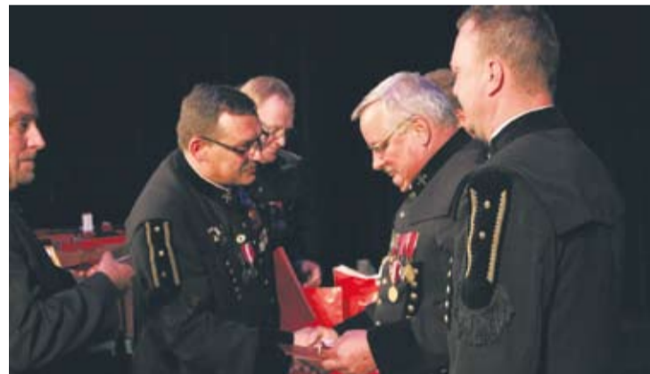
W trakcie uroczystej akademii wręczono wyróżnienia.