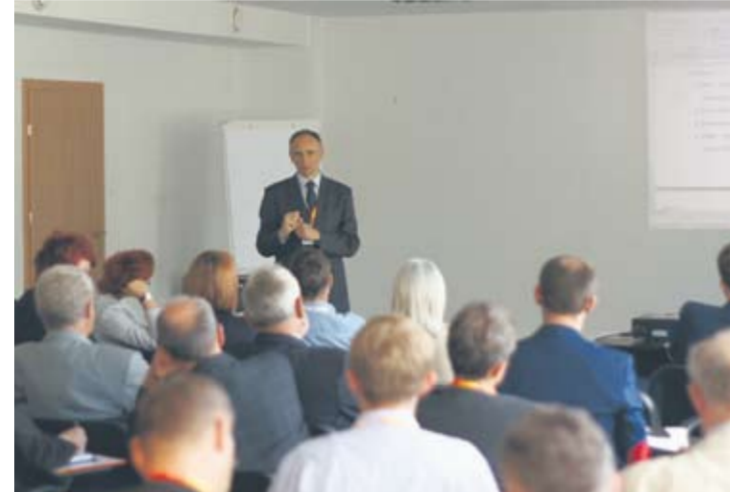
Uczestnicy warsztatów podzieleni zostali na trzy grupy: ds. społecznych, ds. zasobów i potencjałów miasta oraz ds. gospodarczych i promocji miasta.

Diagnoza ujawnia m.in., że choć trendy demograficzne w Rudy Śląskiej w większości pokrywają się z tymi ogólnopolskimi, to miasto odznacza się jednocześnie nieznacznie „młodszym społeczeństwem”, niż porównywalne miasta na prawach powiatu. Dane zawarte w diagnozie pokazują też, że Ruda Śląska posiada dobre zaplecze edukacyjne, a w szkołach systematycznie rośnie liczba etatów nauczycieli o najwyższym stopniu awansu (nauczycieli dyplomowanych). Zgodnie z danymi statystycznymi Ruda Śląska charakteryzuje się też jedną z najniższych