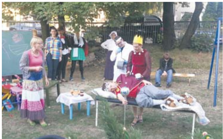
Dla najmłodszych przygotowano między innymi przedstawienia.