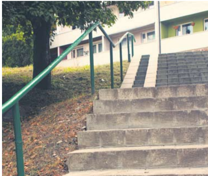
Na tych schodach wózkiem można zjechać tylko do ich połowy.

Ze strony miasta otrzymaliśmy zapewnienie o rychłym zajęciu się poręczą: – W tej sprawie przeprowadzone zostały oględziny w terenie. Poręcze nie spełniają wymogów Rozporządzenia Ministra Infrastruktury w sprawie warunków technicznych, jakim powinny odpo-