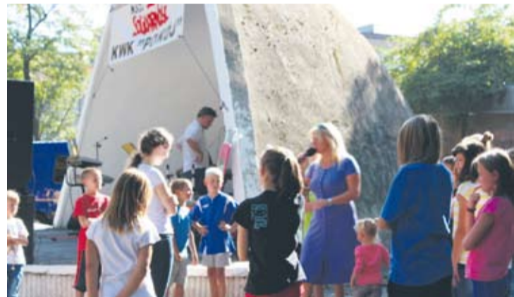
W konkursach zarówno dzieci jak i dorośli mogli wygrać atrakcyjne nagrody.