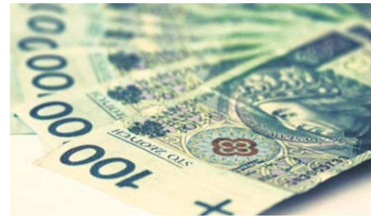
W przyszłym roku na budżet obywatelski wydzielona zostanie pula 2 mln zł.

wali mieszkańcy Bykowiny. Część z nich chciałaby, żeby takie miejsce powstało na południe od ul. Górnośląskiej. Inna grupa mieszkańców tej dzielnicy jako potencjalne miejsce realizacji takiej inwestycji wskazała teren pomiędzy ul. Gwarecką i Górnośląską. Jeden ze złożonych wniosków dotyczył także zagospodarowania dawnego basenu w Bykownie w pobliżu ul. Plebiscytowej i Potyki.