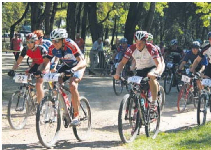
Zawodnicy dobrze radzili sobie na wymagającej trasie