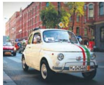
Przejeżdżające ulicami Rudy Śląskiej pojazdy zabytkowe zrobiły furorę.

Mercedes z 1932 roku, Opel Kadett z 1938, MG z 1950 czy autobus Skoda