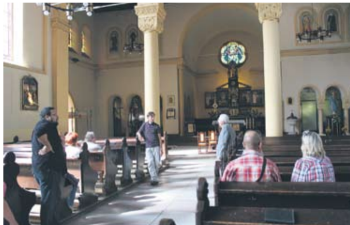
Uczestnicy spaceru mieli okazję poznać historię kościoła pw. św. Michała Archanioła.

– Ten spacer jest okazją do tego by zapoznać się z nieznaną i niedocenianą historią Rudy Śląskiej. Staram się czytać na temat historii miasta, ale gdy tylko jest taka okazja to chętnie biorę udział w historycznych spacerach. Warto znać miejsce, w którym się mieszka –