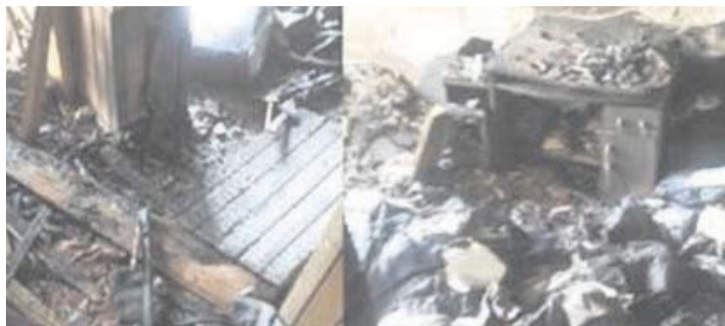
W wyniku pożaru mieszkanie doszczętnie spłonęło.