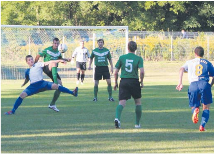
Slavia ma na swoim koncie cztery remisy i dwie porażki.

Z meczu na mecz coraz gorzej wygląda sytuacja Slavii Ruda Śląska. Rudzianom przyszło zmierzyć się w sobotę z beniaminkiem – Concordią Knurów. Nie mogą jednak oni zaliczyć tego spotkania do udanych. Po słabej grze musieli uznać wyższość przyjezdnych, przegrywając 1:3.