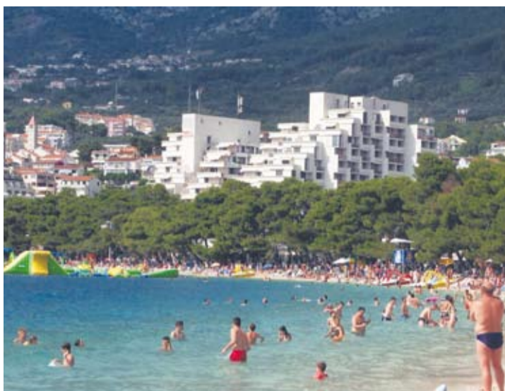
Wymarzone wakacje często mogą sprawić wiele problemów.

– Zwykle są to zgłoszenia związane z samym pobytem na miejscu, gdy konsument zastał warunki, które nie odpowiadają ofercie handlo-