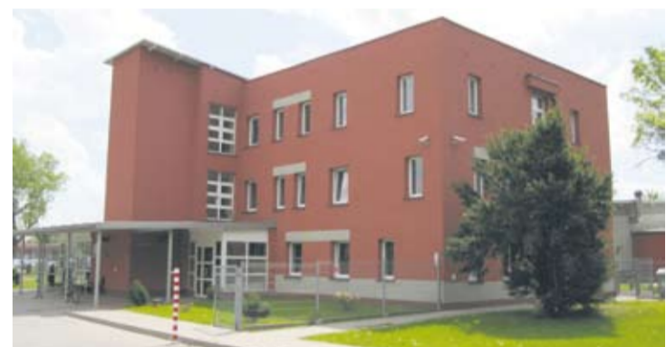
Rudzki Inkubator Przedsiębiorczości wspiera rozwój przedsiębiorczości i innowacji w regionie.

W ramach RIP działa nowatorska w skali regionu Akademia Innowacji. Celem jej istnienia jest zaktywizowanie młodych osób do kreatywnego działania, stworzenie możliwości sprawdzenia się w biznesie, promowanie postaw przedsiębiorczych.