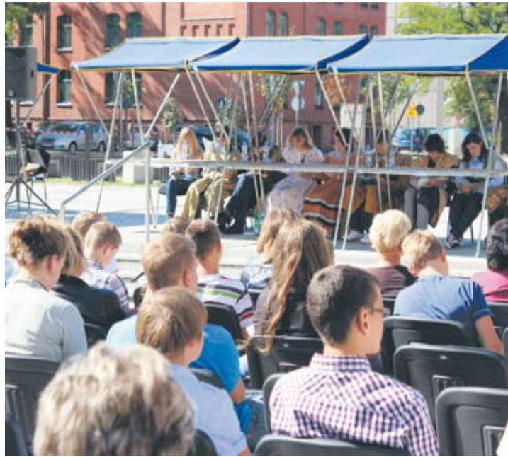
Młodzież licznie zebrała się na rynku, by wysłuchać „Zemsty”.

– Wiedziałem, że dzisiaj odbędzie się czytanie „Zemsty” na rynku i postanowiłem zrobić sobie wycieczkę.