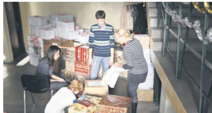
Każdy z wolontariuszy podkreśla, że Szlachetna Paczka daje wiele satysfakcji.