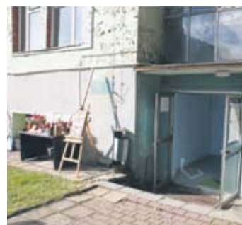
Dzień Otwarty odbył się w środę 18 września.