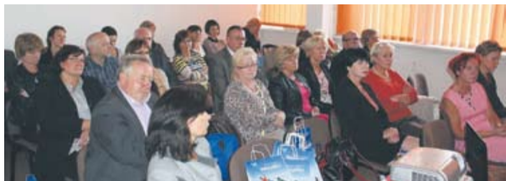
Warsztaty medyczne dla lekarzy z Rudy Śląskiej.