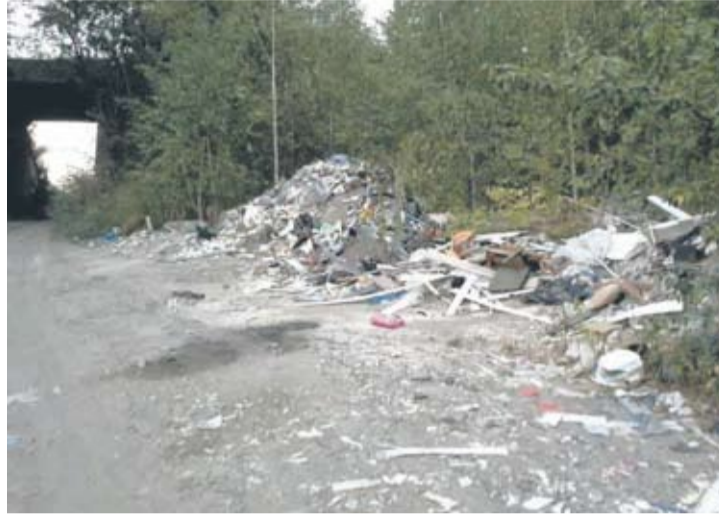
W rejonie ulicy Stalowej znajdowała się góra śmieci.

Sprawę zgłosiliśmy do rudzkiego magistratu: – W związku z przesłaną dokumentacją zdjęciową ilustrującą poszczególne miejsca „dzikich wysypisk” w rejonie ulicy Stalowej, przeprowadzono oględziny w terenie w celu zlokalizowania wskazanych miejsc oraz stwierdzenia stanu faktycznego. Ustalono, że wysypisko oznaczone na przekazanej dokumentacji nr 1 znajduje się na granicy miast Ruda Śląska i Świętochłowice, natomiast wysypisko nr 2 mieści się na terenie miasta Świętochłowice. (...) Sprawa tzw. wysypiska nr 2 została przekazana właściwemu organom miasta Świętochłowice. Jednocześnie informuję, że dzikie wysypiska zlokalizowane w rejonie ulicy Stalowej, na terenie miasta Ruda Śląska zostały ujęte do jednorazowego uporządkowania w miarę możliwości finansowych budżetu miasta – tłumaczy Jacek Morek, zastępca prezydenta miasta Ruda Śląska i dodaje: – W zakresie propozycji utworzenia w omawianym rejonie parku, informuję, że na terenie Rudy Śląskiej zlo-