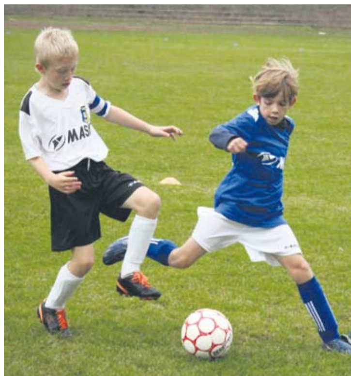
Zawodnicy chociaż mieli osiem lat albo i mniej, ambitnie walczyli na boisku.

Chociaż mają zaledwie osiem lat albo i mniej, to nie można im zarzucić braku waleczności i umiejętności. Dzieci z rocznika 2005 i młodsze rywalizowały ze sobą w piłkarskim turnieju rozgrywanym w ramach ligi maluchów. Rywalizacja odbyła się w piątek a jej gospodarzem był klub MKS Pogoń Ruda Śląska.