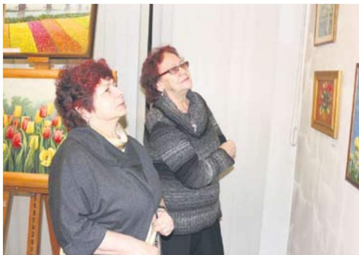
Koło Plastyków Rudzkiego Uniwersytetu Trzeciego Wieku.