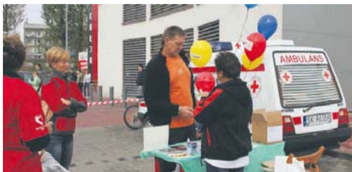
Akcja krwiodawstwa odbyła się przy sklepie Intermarké w Halembie