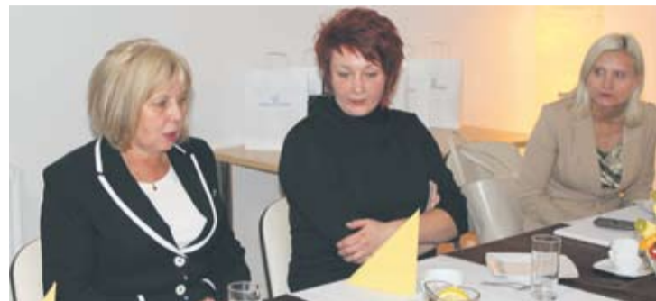
Ambasada zrzesza rudzkie kobiety biznesu.