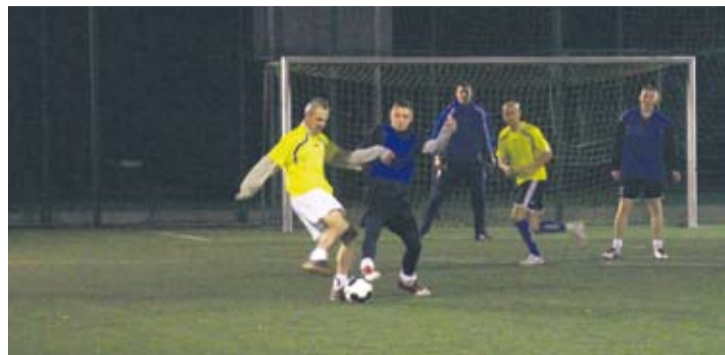
Przy sztucznym oświetleniu gracze mogli poczuć się jak prawdziwi zawodowcy.