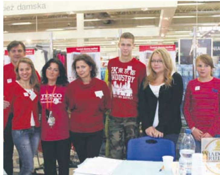
Wolontariusze weekendowej akcji.