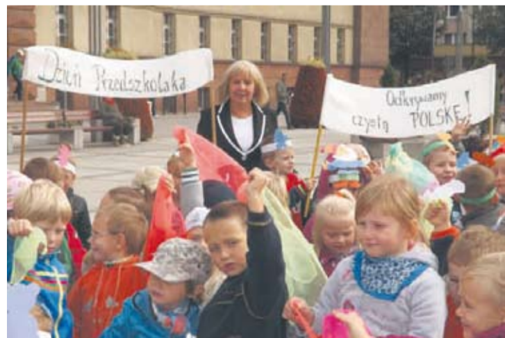
Przedszkolaki na rynku spotkały się z Prezydent Miasta.