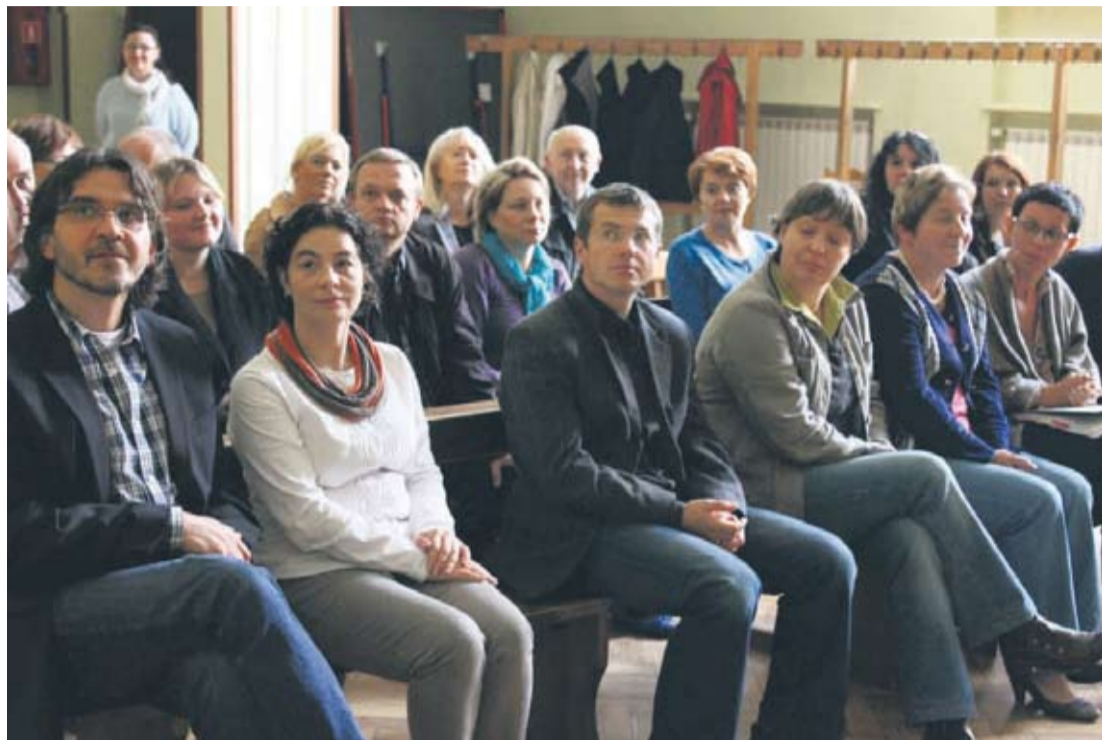
Na widowni zasiadły osoby zajmujące się na co dzień profilaktyką.

– Praca stowarzyszenia i jego podległych placówek jest wysoko ceniona. Dowodem na