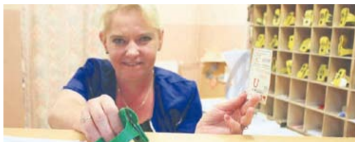
W niedzielę bilet autobusowy był przepustką do darmowej kąpieli.