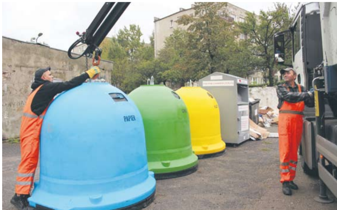
PUK ustawił na terenie Rudy Śląskiej setki nowych pojemników na odpady.

czętku obecnego roku, szybko okazało się, że jest ich po prostu za mało! – Obserwujemy sygnały świadczące o tym, że sytuacja w Rudzie Śląskiej po wprowadzeniu ustawy śmieciowej wreszcie ulega stabilizacji. Przede wszystkim zauważamy coraz mniejszą liczbę zgłaszanych interwencji – mówi prezes PUK. –