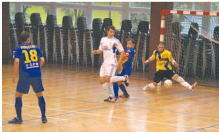
Choć rudzianie przez większość spotkania prowadzili, to nie zdołali dowieźć zwycięstwa do końca meczu.

nad minutę po gwizdku rozpoczynającym spotkanie Gwiazda objęła prowadzenie – na strzał z dystansu zdecydował się Piasecki i otworzył wynik meczu. Trzy minuty później do pierwszej groźnej akcji doszli goście i wykorzystali ją – po indywidualnym wyjściu położył Lasika Rynduch i umieścił piłkę w siatce, doprowadzając do remisu. Choć obie strony stwarzały sobie okazje, na prowadzenie wyszła w końcu Gwiazda. W dziesiątej minucie Piasecki wycofał piłkę do Grudnia,