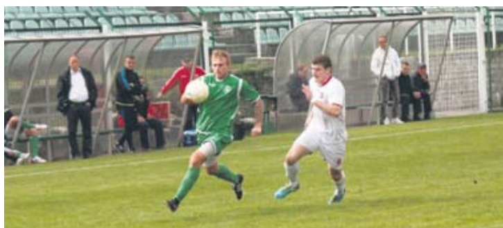
Drużyna Sarmacji okazała się bardzo wymagającym przeciwnikiem.