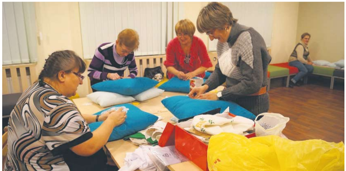
Uczestniczki zajęć w bykowieńskim CIS-ie.

- Niestety na wiele z tych zajęć nie ma już wolnych miejsc, dlatego szukamy wolontariuszy do pomocy. Emerytowany wuefista umożliwiłby