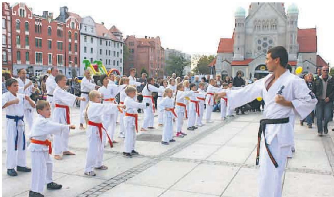
Podczas spotkania można było podziwiać pokaz walk karate.