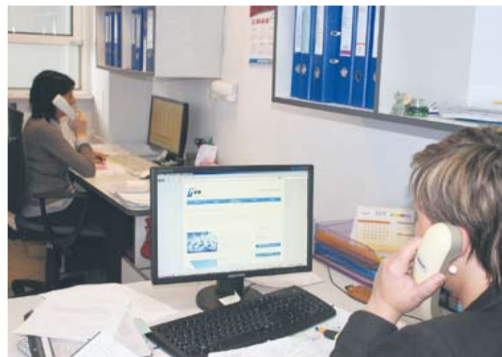
Biuro Obsługi Klienta przyjmuje na bieżąco wszystkie informacje.

A te, które się pojawiają, dotyczą bardziej złożonych przypadków niż brak pojemnika, czy też harmonogramu. Na przykład mieszkaniec podaje w deklaracji adres, pod którym powinniśmy go obsłużyć, ale w oficjalnych dokumentach go nie ma i pojawia się olbrzymi problem z ustaleniem tego adresu – wyjaśnia.