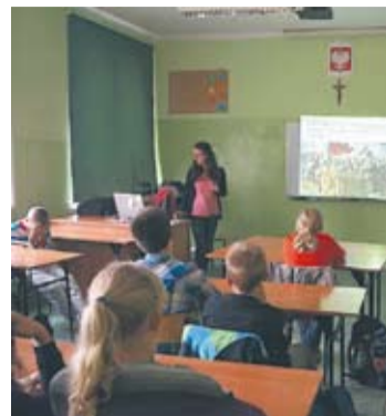
Lekcje z wolontariuszami to okazja dla uczniów, by uczyć się języka w praktyce.

– Jest to dla mnie nowe i bardzo ciekawe przeżycie, bo dzięki temu mogę poznać kulturę i języki innych narodów. Dodatkowo w ten sposób