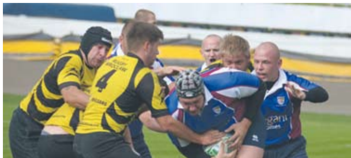
Rudzianie odnieśli drugie zwycięstwo w tym sezonie.