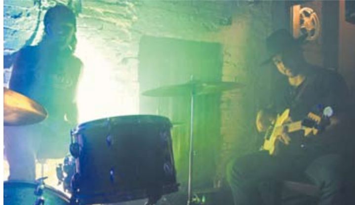
Muzyczna strona „Patrii” – Trio „Lipiny Transfusion”.

Jedną z głównych zmian, które obecnie towarzyszą „Patrii”, jest cyfryzacja,