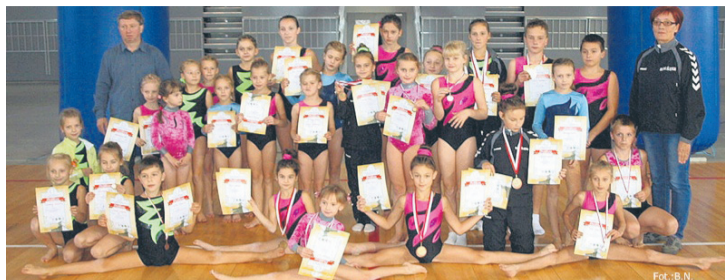
Zawody rozegrane w Bielsku-Białej akrobacji KPKS-u „Halemba” mogą zaliczyć do udanych.

Szereg dobrych występów odnotowali akrobaci KPKS-u „Halemba”.