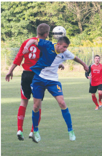
Piłkarzom Slavii zabrakło pomysłu na wykończenie akcji.