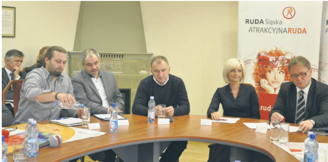
O Rudzkiej Jesieni Kulturalnej w rudzkim magistracie.