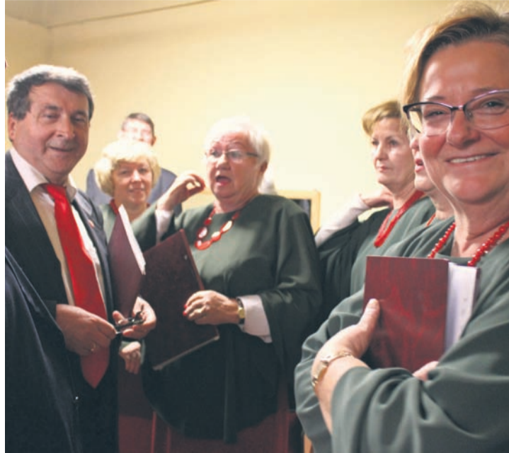
Śląsk ma głęboko zakorzoną tradycję chóralną. Na zdjęciu członkowie chóru rudzkiego UTW.

Udział w działalności RUTW to sposób na seniorskie życie i lek na samotność – wymagania nie są szczególnie: warunkiem jest wpłacenie 20 zł wpisowego oraz symbolicznej kwoty 40 zł za semestr. Zapisy trwają do końca października. MS