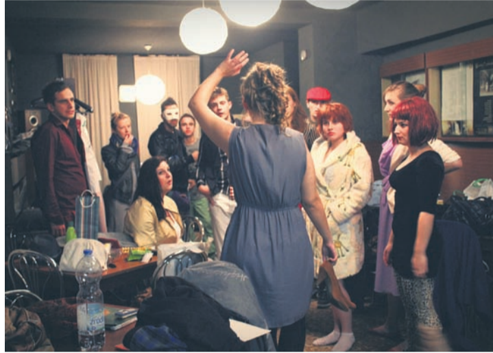
Teatr Bezpański swoje urodziny świętował w kinie „Patria”.

– To mój pierwszy występ i kiedy czuję dzisiejszą atmosferę,