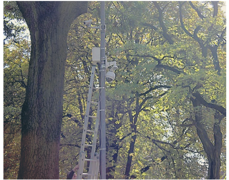
Jedna z kamer monitoringu w mieście znajduje się w Nowym Bytomiu.

– Wszystkie zastosowane w systemie urzędzenia zostały zaprojektowane tak, aby centrum monitoringu