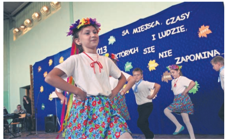
Szkoła to nie tylko budynek – to także tworzący ją ludzie.