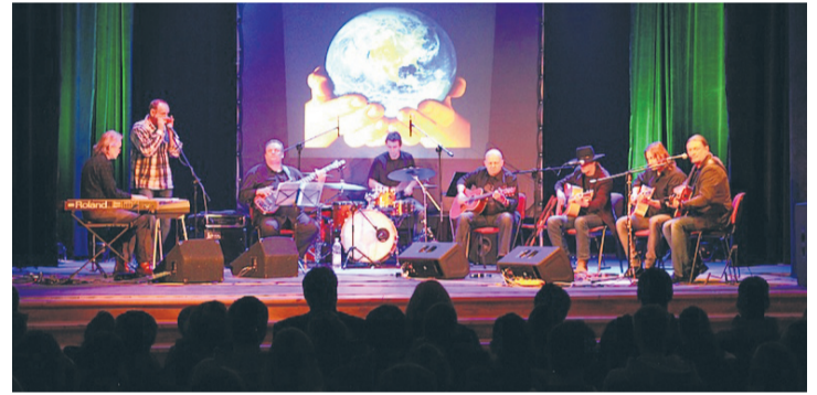
Muzycy na scenie.