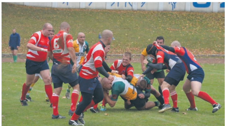
Rudzianie zdominowali to spotkanie.