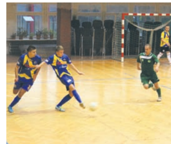
Piłkarze Gwiazdy odnieśli kolejne zwycięstwo.

Po przerwie rudzianie wyszli na parkiet jeszcze bardziej zmotywowani. W ciągu czterech minut zdobyli oni cztery bramki, a na listę strzelców wpisywali się kolejno: Wawrzyczek, Łuszczek, Siadul i Krzymiński. W 32 minucie drugą bramkę strzelili przyjezdni. 13 sekund później prowadzenie Gwiazdy na 8:2 podwyższył Białek. W końcówce przyjezdni wykorzystali przedłużony rzut karny i ustalili wynik spotkania na 8:3.