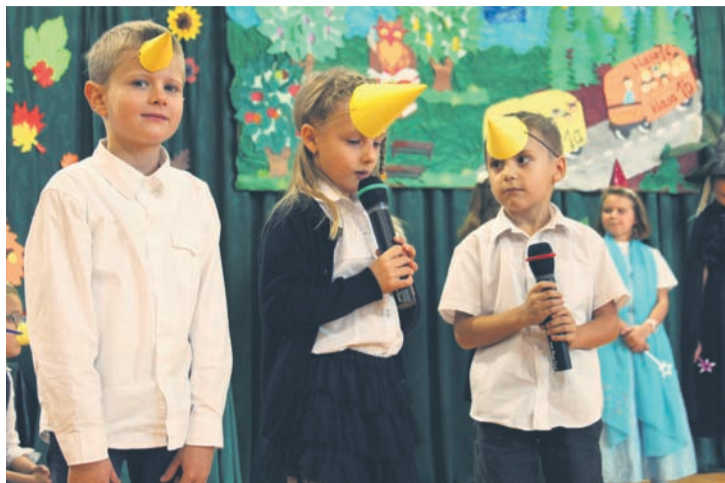
Przy okazji pasowania SP nr 18 obchodziła swoje święto.