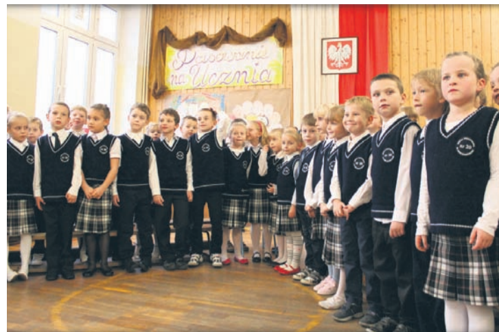
Najmłodszy nie krył radości z faktu, że został oficjalnie uczniem.