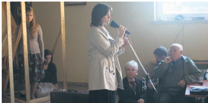
Spektakl wywołał wśród widzów wiele emocji.