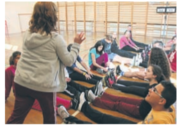
Grupa z Turcji uczyła gry ulicznej, typowej dla dzieciaków z tych rejonów Europy.

– Dzisiaj przebywamy w szkole – tu uczestnicy biorą udział w specjalnie przygotowanych konkurencjach sportowych i muzycznych. Wczoraj byliśmy w Krakowie i Wieliczce – naszymi przyjaciółmi bardzo spodobały się miasta. Chcemy także, by poznali najbliższe okolice. Jutro