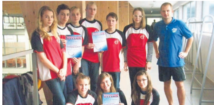
Debiutancki występ rudzian w lidze można uznać za udany.