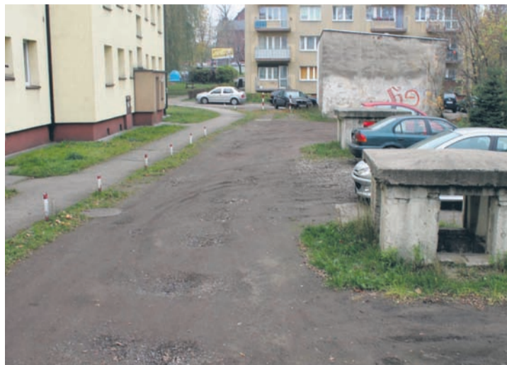
Plac gospodarczy w trakcie opadów deszczu zamienia się w wielką kałużę.

– Murowane „kominy”, o których Pani pisze, to wyloty wentylacji ze znajdujących się tam schronów i faktycznie nie można ich usunąć. Faktem jest, że podwórko nie jest wybrukowane. Wykonanie zagospo-