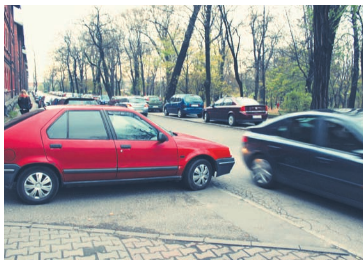
Wyjazd na ulicę stanowi spore zagrożenie.