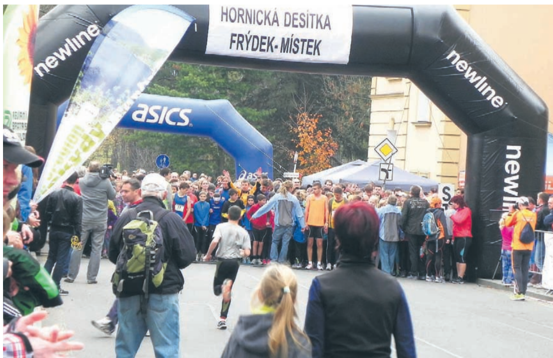
Na starcie biegu stanęło w sumie 969 biegaczy.