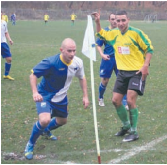
Slavia nadal nie potrafi wygrać na własnym boisku.