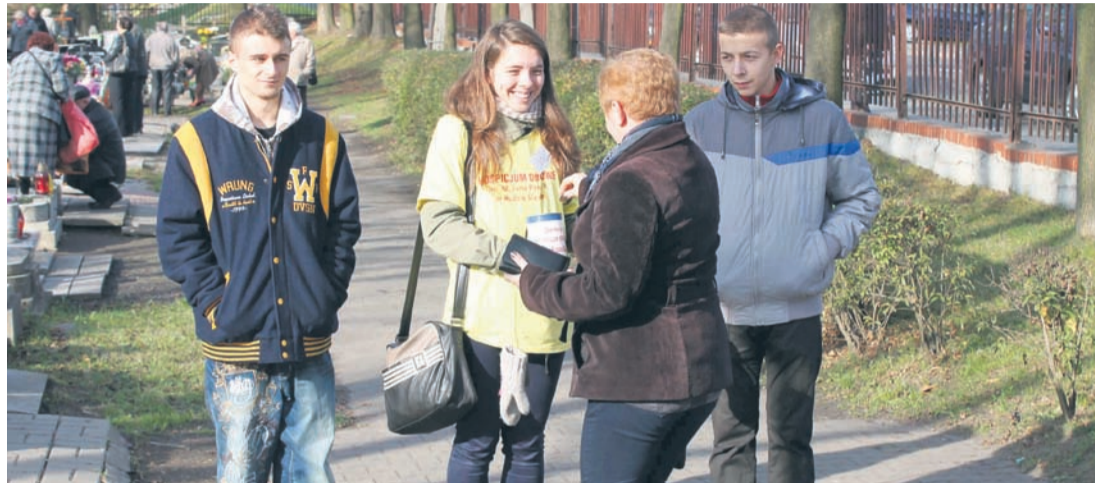
Wolontariuszy można było zobaczyć przy wejściach na rudzkie cmentarze.

Robert Polzoń – robert.polzon@wiadomoscirudzkie.pl