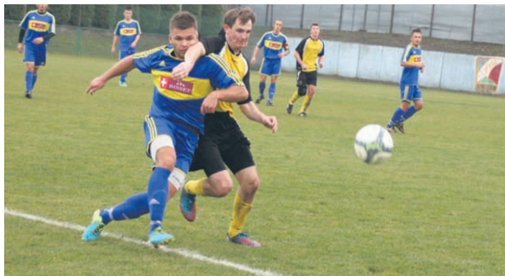
Urania odniosła kolejne wysokie zwycięstwo.

Ostatni mecz rundy jesiennej w własnym boisku piłkarze Uranii rozegrali z zespołem Sokół Wola. Gospodarze