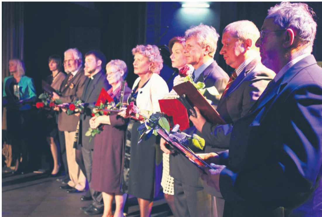
Nagrodzeni Kryształami Profilaktyki.