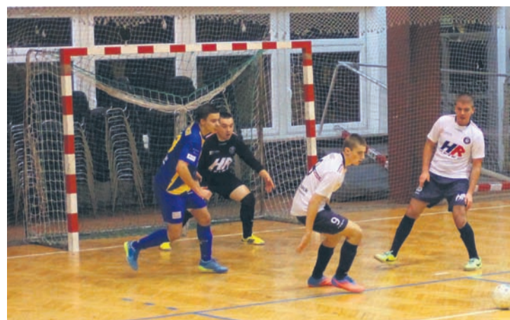
Rudzianie odnieśli wysokie zwycięstwo.

Kibice Gwiazdy Ruda Śląska mogli czuć niepokój tylko w trakcie pierwszego kwadransu meczu z drużyną RAF Heiro Rzeszów. Z upływem kolejnych minut rudzianie grali coraz swobodniej, co w efekcie przyniosło gospodarzom zwycięstwo w wymiarze 14:3.