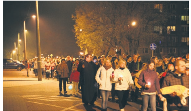
Uczniowie wzięli udział w uroczystym pochodzie spod szkoły do kościoła pw. św. Wawrzyńca i św. Antoniego.