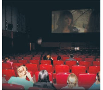
Z okazji „Wieczoru z duchami” kino „Patria” zmieniło odrobinę scenografię.

Chętnych do tego, by poczuć dreszczyk emocji, nie brakowało.