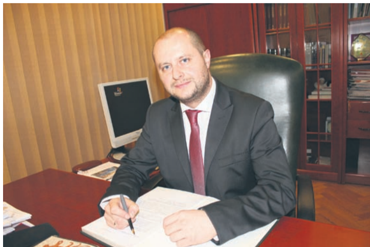
Wiceprezydent Michał Pierończyk.