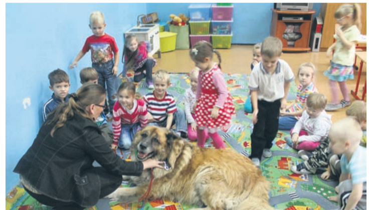
Uczniowie SP nr 4 przekonali się, że warto opiekować się zwierzętami.