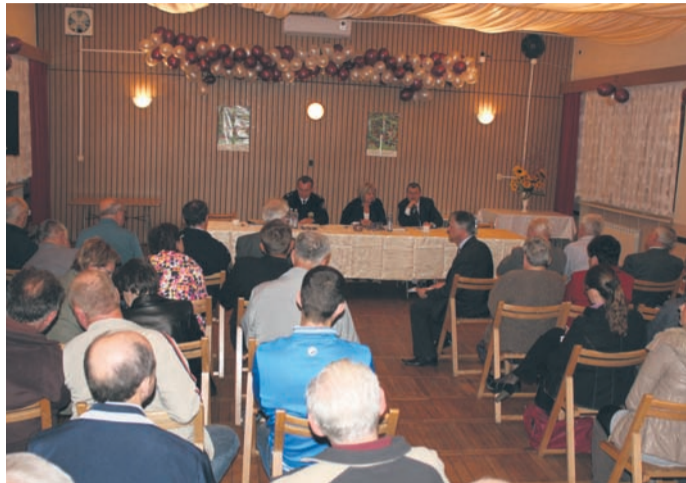
Spotkanie w SP nr 8 w Wirku.

Kolejne pytanie dotyczyło niedostatecznego dofinansowania z Państwowego Funduszu Rehabilitacji Osób Niepełnosprawnych do likwidacji barier architektonicznych. Jak się okazuje, tylko trzy osoby otrzymały taką pomoc.