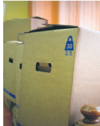
Chociaż zebrano już dużo, to nadal można pomagać.

– Mamy bardzo dużo ubranek, wózek i łóżeczko. Teraz najbardziej potrzebne jest mleko, bo dziecko