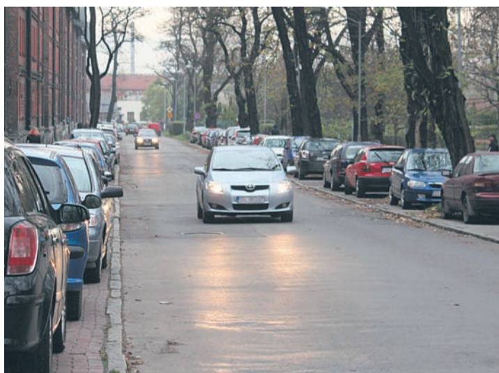
Na ulicy Parkowej można parkować z dwóch stron.

Problem w rudzkim magistracie jest już znany i częściowo rozwiązany. Na bardziej rady-