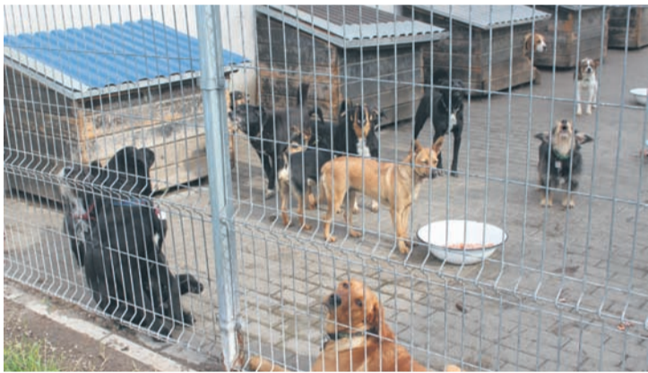
Zima to szczególnie okres dla bezdomnych zwierząt, bo schroniska są przepelnione.