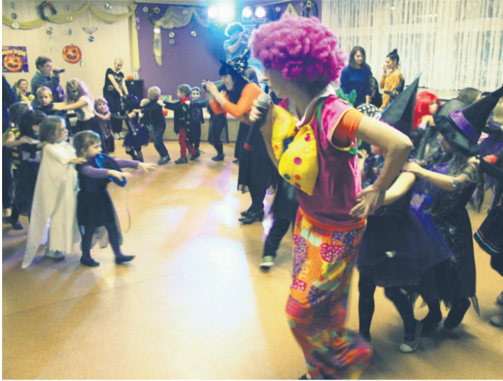
Dzieci wraz z rodzicami licznie stawili się na „Familijne Święto Dyni”.

Na twarzach licznie zgromadzonych najmłodszych widniały uśmiechy, będące najlepszą recenzją imprezy.