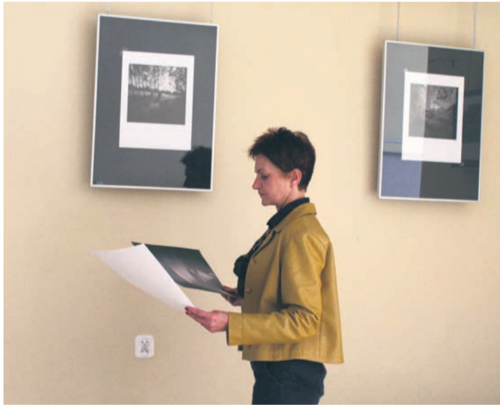
Obraz otrzymany za pomocą camera obscura potrafi przekazać wiele emocji.