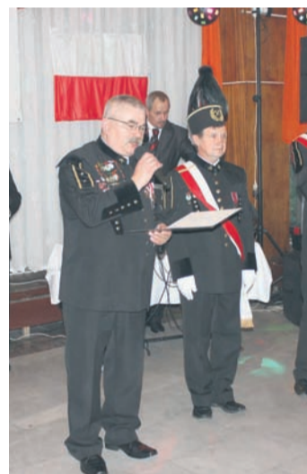
Uroczysta akademія klubu HDK przy KWK Halemba.