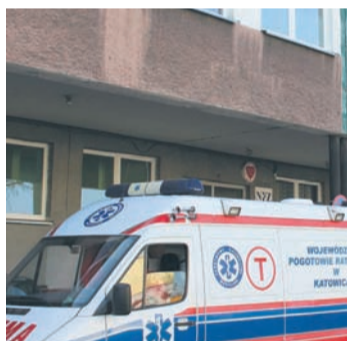
Na moment w szpitalu profilaktycznie wzmocniono reżim epidemiologiczny.