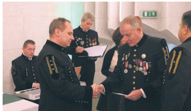
Zasłużeni pracownicy odebrali podczas biesiady odznaczenia i stopnie.