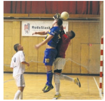
W drugiej połowie meczu gości ratował słupek.

Rozmowa z trenerem dobrze zadziałała na rudzian. Po przerwie bramka ekipy z Wieliczki była bowiem pod ciągłym obstrzałem. Piłka jednak ni-