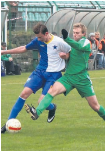
Podobnie jak poprzednio, derby zakończyły się remisem 1:1.