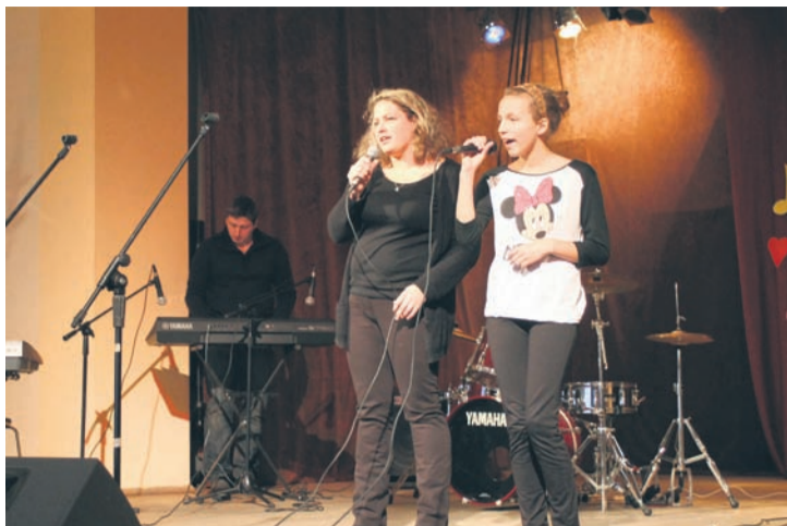
W konkursie postawiono na współpracę rodziców z dziećmi.

Liczba dzieci biorących udział w konkursie przerosła najmielsze