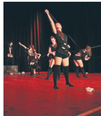
Widzowie mieli okazję zobaczyć wiele ciekawych występów.

Na scenie zaprezentowały się także rudzkie zespoły taneczne. W kategorii dziecięcej bezkonkurencyjne okazały się być Promyczki z ODK RSM „Matecznik”. Drugie miejsce zajął zespół Gwiazdy I, a wyróżnienie przyznano