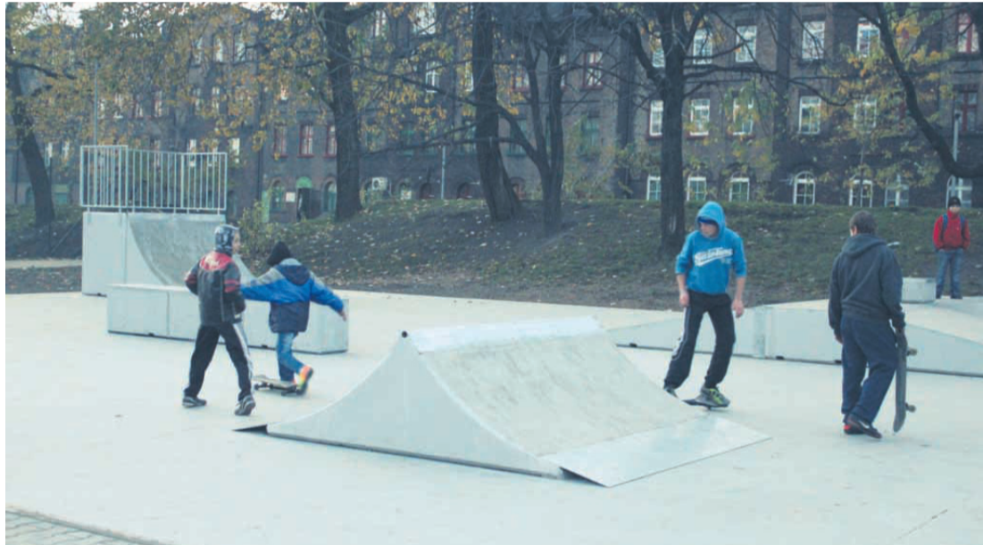
Krótko po otwarciu w skateparku pojawili się pierwsi miłośnicy jazdy na deskorolce i rolkach.