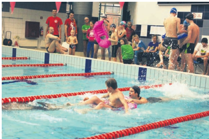
Najwięcej emocji wśród uczestników i widzów wzbudziła sztafeta rodzinna.