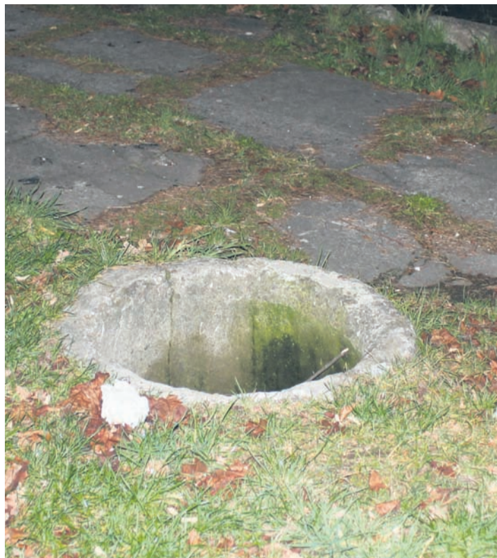
Późnym wieczorem studzienka jest zupełnie niewidoczna.

– Odpowiadając na interwencję w sprawie niezabezpieczonego betonowego otworu w ziemi w pobliżu basenu w Parku Sobieskiego