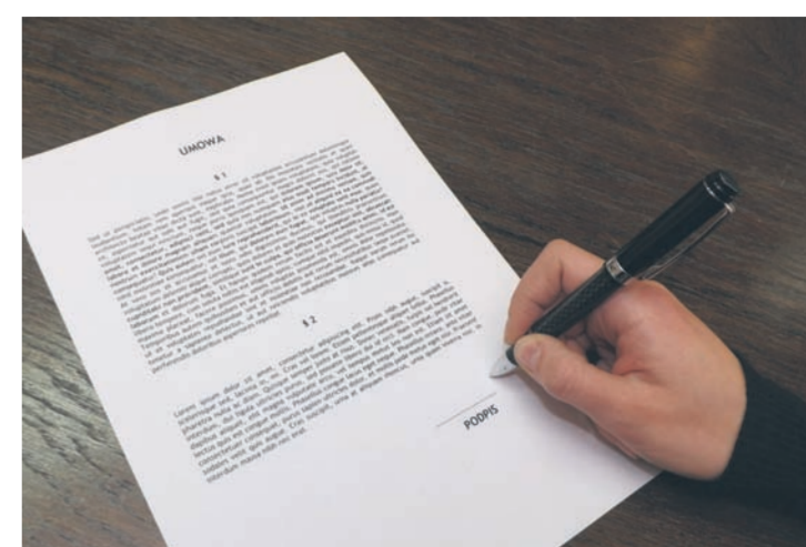
Przed niekorzystnymi skutkami zawieranych umów chroni ich rozwazne czytanie.

Kolejnymi umowami zawieranimi w charakterze sprzedaży bezpośredniej (np. w domu konsumenta) są te dotyczące sprzedaży usług w zakresie dostępu do telewizji satelitarnej, jak również związane z montażem sprzętu do jej odbioru. – Niestety, klienci bardzo często wyrażają pisemną zgodę na dokonanie instalacji zestawu satelitarnej przed upływem 10 dni uprawniających konsumenta do odstąpienia od umowy – mówi Wioletta Stec-Grzeškowiak. W takim przypadku umowę uznaje się za wykonaną, a co za tym idzie, nie można od niej skutecznie odstąpić, ponieważ należy wtedy zwrócić sprzęt w stanie niezmiennym, co po dokonaniu montażu anteny jest niemożliwe, gdyż sprzęt nosi ślady użytkowania. Jeżeli chcemy rozwiązać umowę, musimy złożyć dwa oświadczenia: jedno w zakresie świadczenia usług telewizyjnej i kierujemy je na adres operatora, natomiast drugie oświadczenie – dotyczące instalacji sprzętu (w przypadku, gdy do wykona-