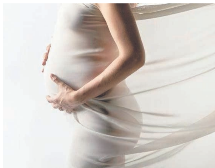
Ujednolicona śląska karta ciąży ma zapewnić bezpieczeństwo zarówno przyszłym matkom, jak i dzieciom.