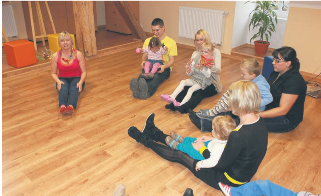
Zajęcia z muzykoterapii podczas Dnia Wcześniaka.

Monika Herman-Sopniewska – monika.herman@wiadomoscirudzkie.pl