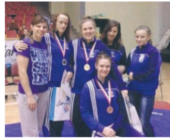
Zawodniczki ZKS-u Slavia Ruda Śląska wywalczyły w Pucharze Polski Juniorek i Kadetek trzy medale.

Szereg sukcesów odnieśli w miniony weekend zapaśnicy ZKS-u SLAVIA Ruda Śląska.