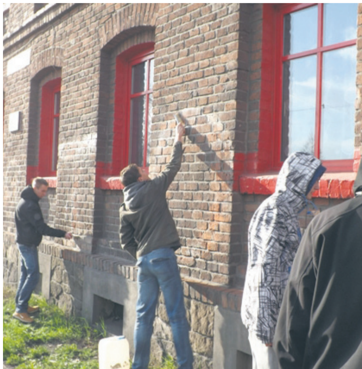
Ruda Śląska rozpoczęła walkę z graffiti.