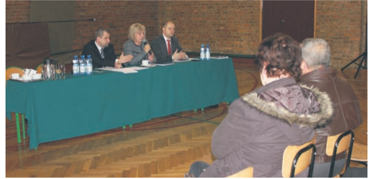
Spotkanie w Halembie w SP nr 24.

– W przyszłorocznym budżecie także planujemy środki na remonty,