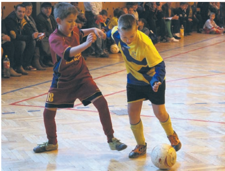
Najmłodsi ambitnie walczyli w turnieju.

Narodowy Dzień Niepodległości stał się okazją do tego, by młodzi adepci piłki nożnej – trampkarze z rocznika 2003 i młodszy, wybiegli na halę przy ulicy Tunkla 147 a. Z myślą o nich bowiem stowarzyszenie Razem dla Rudy Śląskiej wraz z klubami piłkarskimi uczestniczącymi w rozgrywkach Rudzkiej Ligi Szkół zorganizowało dla nich specjalny turniej. Zawody rozegrano w sobotę 16 listopada.