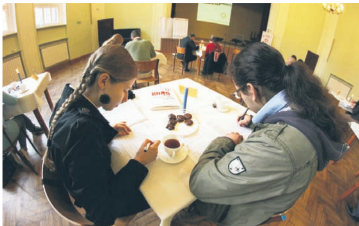
Narzeczeni podczas spotkania.

Kurs prowadzony jest głównie przez małżonków. W jego trakcie narzeczeni siedzą przy osobnych stolikach i w świetle świec, niczym