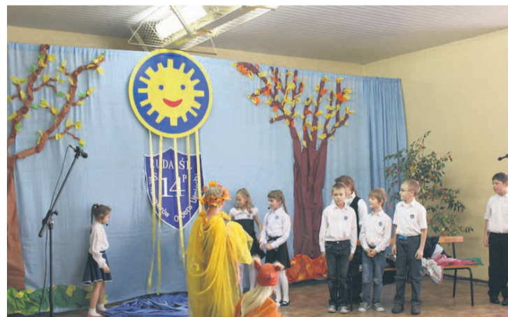
Uczniowie szkoły przygotowali na tę okazję specjalne przedstawienie.