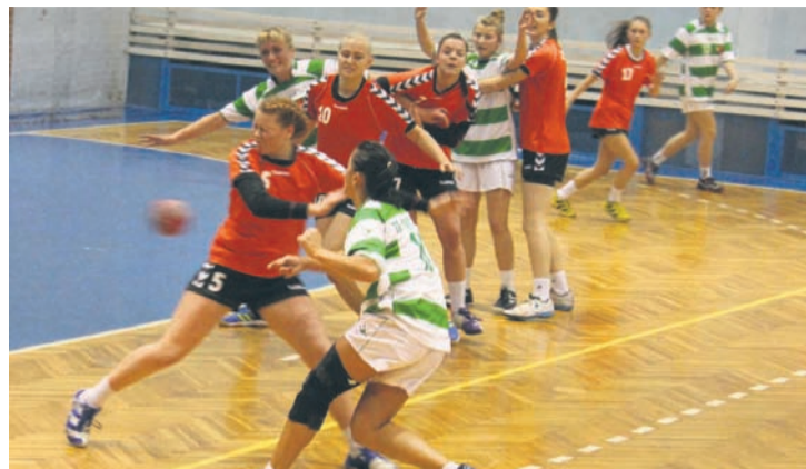
Bielszowiczanki razily nieskutecznością w grze z kontrataku.

Wynikiem 15:21 zakończył się sobotni pojedynek Zgody Ruda Śląska z MTS-em Żory. Mecz upłynął pod znakiem niewykorzystanych kontr bielszowiczanki.