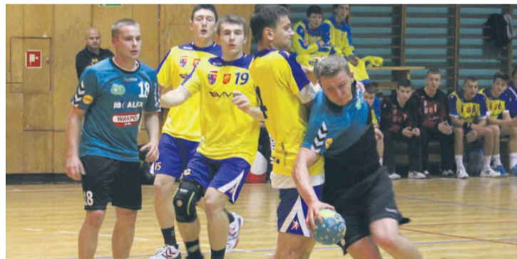
Halembianie od ósmej minuty rządzą na parkiecie.

Dwunastobramkowe zwycięstwo odnieśli szczyornistki SPR-u Grunwald w środowym pojedynku z KS Vive II Kielce. Halembianie w ósmej minucie wyszli na prowadzenie i stopniowo powiększali je w trakcie meczu, by ostatecznie wygrać 42:30.