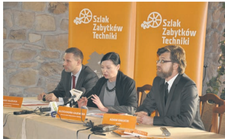
Konferencja informująca o szczegółach projektu.