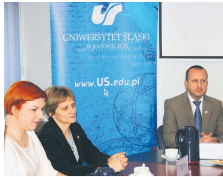
W ramach umowy uczniowie będą korzystać z pracowni oraz laboratoriów uczelni.

Zadowolona z podpisania umowy nie kryje władze Rudy Śląskiej. – Cały czas staramy się i dbamy