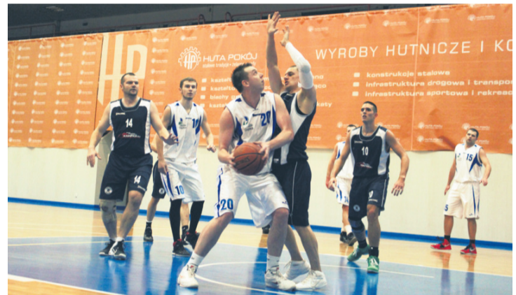
Przed zawodnikami Pogoni bardzo ważny mecz z liderem tabeli – Polonią Bytom.

Ze znajdującymi się w dole tabeli rezerwami MCKiS-u Jaworzno przyszło się zmierzyć w sobotę Pogoni Ruda Śląska. Rudzianie bez większych problemów wygrali to spotkanie różnicą 34 punktów.