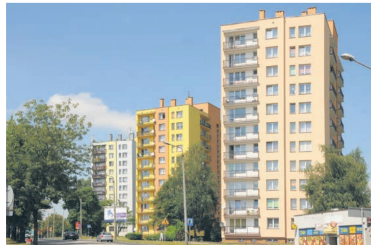
Miasto sprzedało już 4319 mieszkań lokatorom.