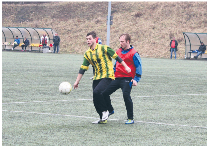
Slavia zremisowała z Tempem Paniówki 1:1.

Kolejne piłkarskie sparingi z nami. Wyniki niektórych rozegranych spotkań nie napawają jednak optymizmem.