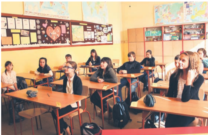
Rudzcy uczniowie mogli sprawdzić swoją wiedzę historyczną, matematyczną oraz przyrodniczą.

To najlepszy sposób na sprawdzenie swojej wiedzy oraz przygotowanie się do nauki na kolejnych poziomach. Właśnie zakończyła się IX Edycja Olimpiad Przedmiotowych Szkół Podstawowych w Rudzie Śląskiej, w której swój udział w poszczególnych konkursach zgłosiło 20 placówek z całego miasta. Olimpiada jest okazją, aby rudzcy uczniowie mogli sprawdzić swoją wiedzę z przedmiotów takich jak: historia, język angielski, język polski, matematyka, przyroda i informatyka.