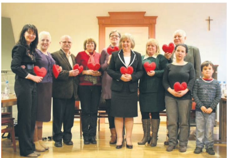
Uczestnicy konkursu z prezydent Grażyną Dziedzic.