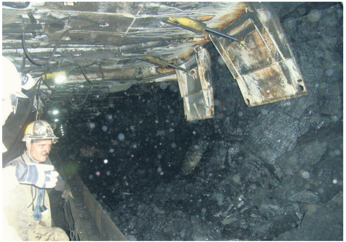
Kompania Węglowa zabrała swoim byłym pracownikom tonę węgla.