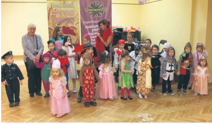
35 dzieci wzięło udział w muzealnym balu.