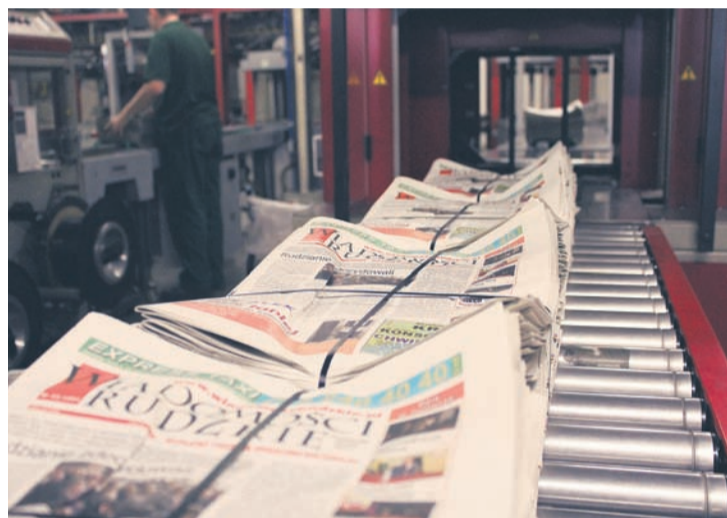
5 marca nasi Czytelnicy dostaną do swoich rąk nowy format gazety.