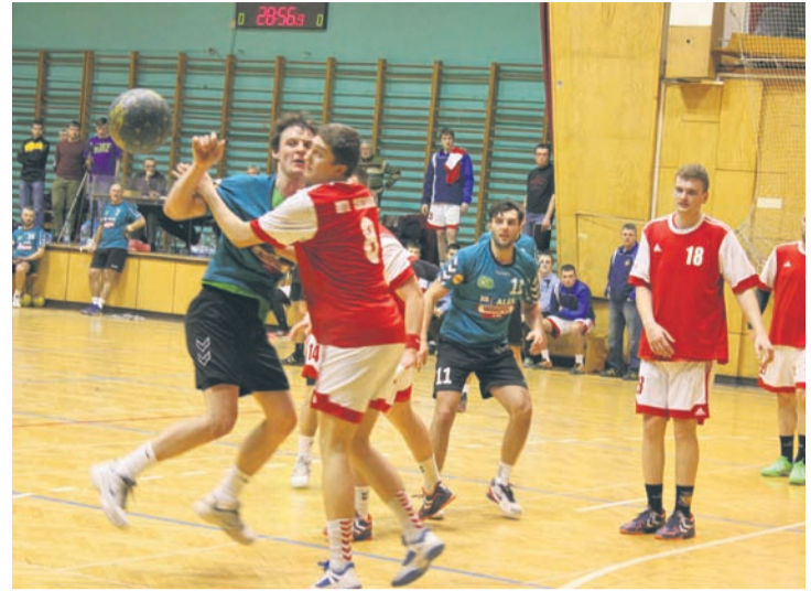
Rudzianie na początku spotkania objęli prowadzenie i ani na chwilę nie dali go sobie odebrać.