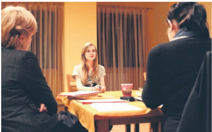
W środę, w Miejskim Centrum Kultury odbył się casting.