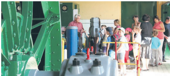
Szyb „Mikołaj” jest często odwiedzany przez różnego rodzaju wycieczki.