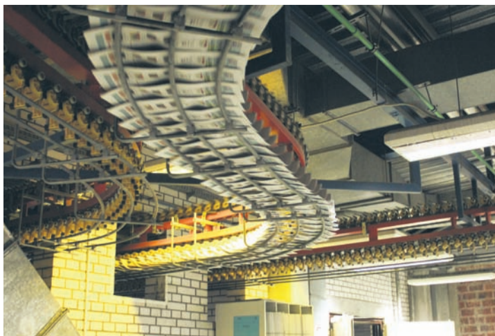
„Wiadomości Rudzkie” na rynku lokalnym pojawiły się w 1993 r.

„Wiadomości Rudzkie” po raz pierwszy pojawiły się na rynku lokalnym w 1993 roku. Od tego czasu wiele się zmieniło. Maszyny do pisania, na których tworzone teksty, dawno wyszły z mody, a zdjęcia cyfrowe wyparły tradycyjne aparaty fotograficzne. Nasza redakcja nie przestaje iść z duchem czasu i stale się zmienia. Już 5 marca w swoich rękach będą Państwo trzymać pierwsze wydanie „Wiadomości Rudzkich” w nowym formacie.