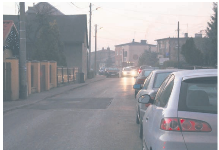
Ruch jednokierunkowy ma rozwiązać problemy na ulicy Młyńskiej i zwiększyć bezpieczeństwo.

– Jako radny dzielnicy Halemba i mieszkaniec ul. Młyńskiej nie jestem przekonany co do zaproponowanego przez Komisję rozwiązania, jednak w najbliższym czasie