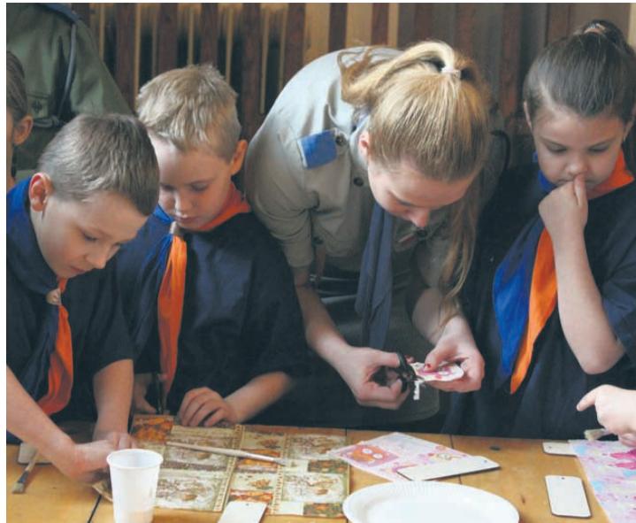
W ramach obchodów zuchy i harcerze wzięli udział w licznych grach i zabawach.

A w grach i zabawach chętnie brali udział zarówno młodszy jak i starsi harcerze. Wspólnie tworzone zakładki do książek czy specjalne