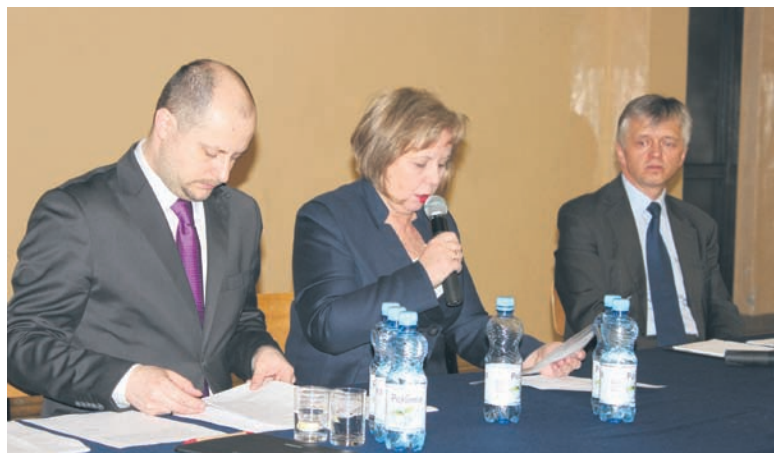
Pierwsze z wiosennych spotkań w Gimnazjum nr 5.