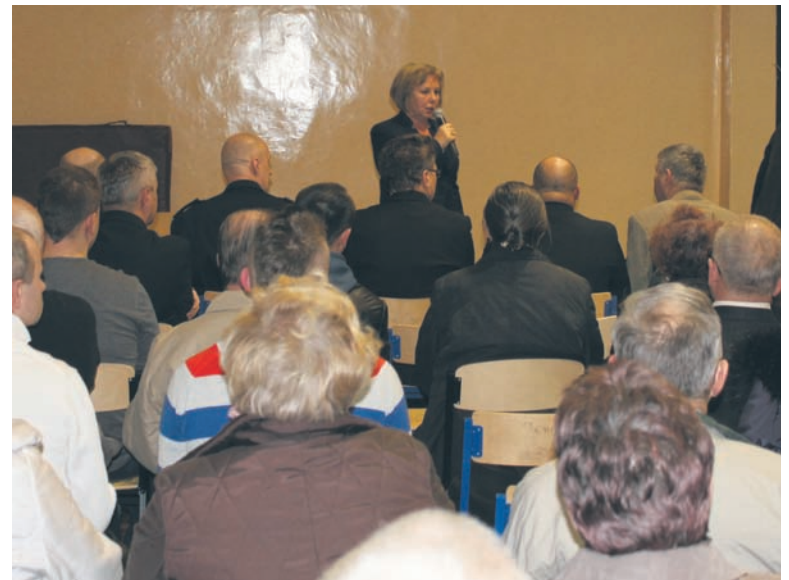
Spotkanie z mieszkańcami Goduli i Orzegowa cieszyło się ogromnym zainteresowaniem.

Prezydent miasta przypomniała o inwestycjach wykonanych w dzielnicach w ubiegłym roku i o planach na kolejne – m.in. rozpoczęcie 2-letniej inwestycji termomodernizacji budynku Zespołu Szkół Ogólnokształcących