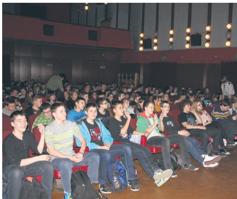
Premiera „Kamieni na szaniec” w kinie „Patria”.

W marcu na ekrany kin wszedł film „Kamienie na szaniec”, w lutym ta lektura towarzyszyła uczniom na lekcjach. Uczniowie przygotowali również wystawę „Ludzie, o których musimy pamiętać”. Podczas prezentacji wspomniano m.in. Krzysztofa Kamila Baczyńskiego, Jana Karskiego, Janusza Korczaka, Irenę Sendler, Aleksandra Kamińskiego, Karola Wojtyłę, profesora Władysława Bartoszewskiego czy