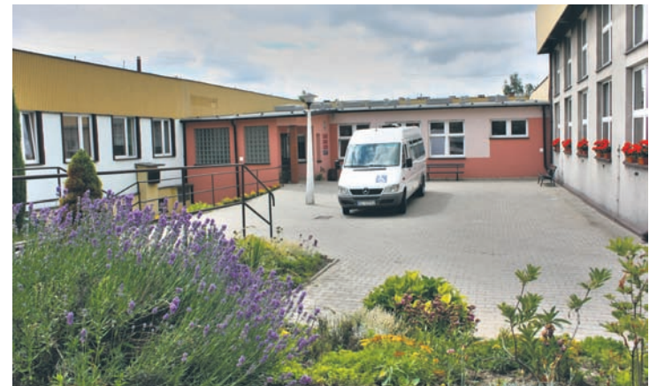
Z okazji Tygodnia Autyzmu ZSS nr 3 organizuje specjalną konferencję.