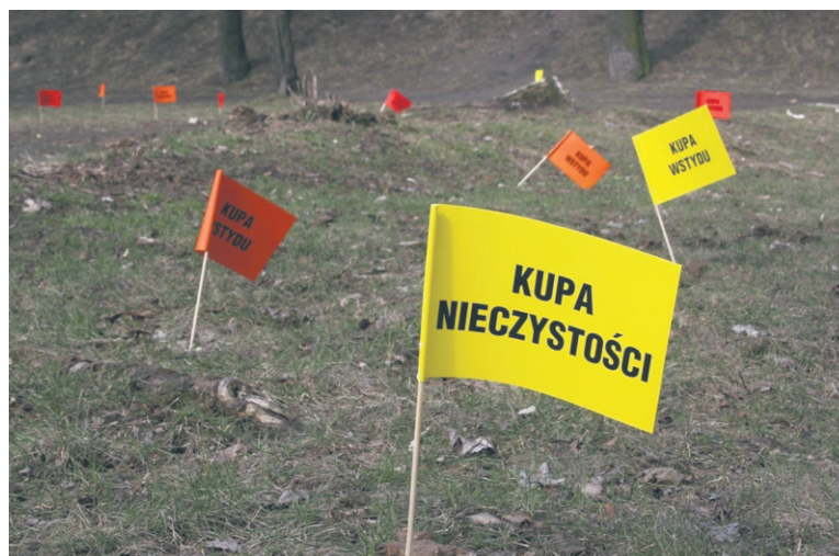
Nietypową akcją wsadzania chorągiewek w psie kupy przeprowadzono w kwietniu ub. roku.

W ubiegłym roku rudzki magistrat przeprowadził happeningi i akcje edukacyjne. Uczniowie rudzkich szkół w rudzkich parkach i zieleńcach za pomocą kolorowych chorągiewek „kupa wstydu”, „kupa nieodpowiedzialności” itp. zaznaczali psie odchody. W tym roku również planowana jest akcja pokazująca wagę tego problemu.