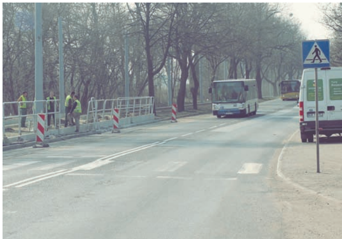
Roboty drogowe często spędzają sen z powiek kierowcom.