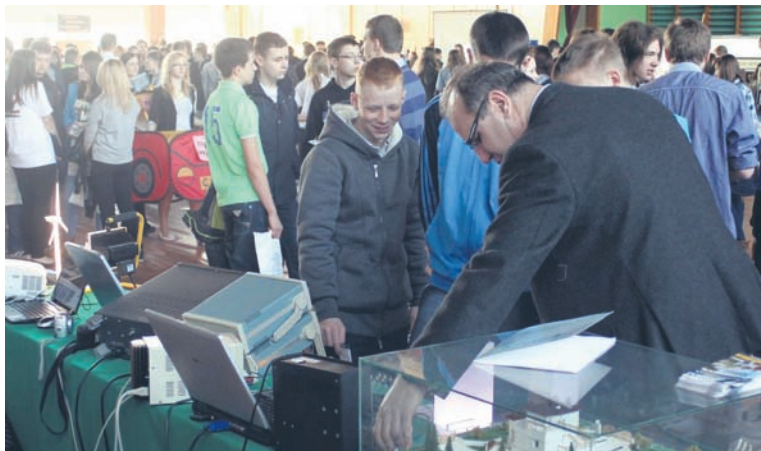
Podczas targów uczniowie mogli zobaczyć co do zaprezentowania mają ich przyszłe szkoły.