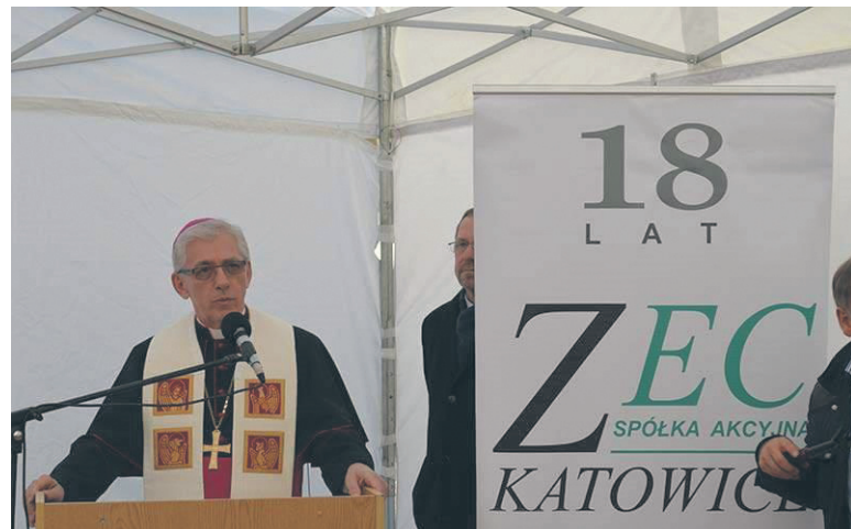
Wiktor Skworc – Arcybiskup Metropolii Katowickiej.