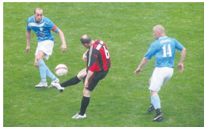
W roku 2014 w Rudzie Śląskiej powstaną cztery nowoczesne boiska ze sztucznej trawy. Miasto przeznaczy na ich budowę 2,5 mln zł.

organizowane na „Uranii” cieszą się dużym powodzeniem. Od 3 lat klub organizuje cykl turniejów piłkarskich dla dzieci i młodzieży rudzkich klubów piłkarskich oraz szkół, które spędzają ferie w domu. W czasie tegorocznych ferii udział w turniejach wzięło 720 zawodników w 5 kategoriach wiekowych z 6 klubów piłkarskich. Nowy obiekt stanie się również dodatkową bazą na zajęcia dla klas sportowych szkół podstawowych i gimnazjum, z którym współpracuje klub.