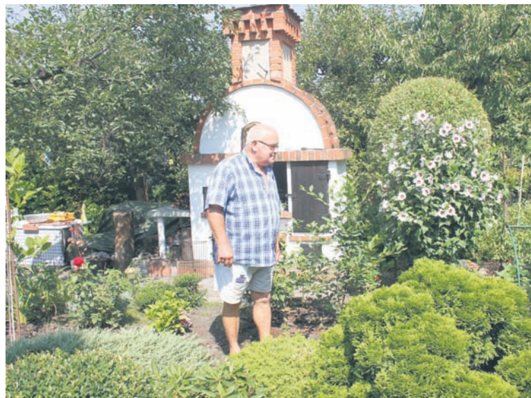
Obowiązująca od stycznia ustawa pozwala na założenie własnego stowarzyszenia i odłączenie się od Polskiego Związku Działkowców.