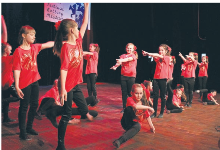
Festiwal jest świętem artystycznie uzdolnionej młodzieży.

Jeszcze do 20 marca można składać zgłoszenia w kategorii „taniec”. Konkurs będzie podzielony na cztery podkategorie: szkoły podstawowe, szkoły gimnazjalne, szkoły ponadgimnazjalne oraz placówki kulturalne czy oświatowo-wychowawcze. Finał odbędzie się 3 kwietnia w Miejskim Centrum Kultury. Do 24 marca można zgłaszać się do kategorii „muzyka”, w której wziąć udział mogą zarówno wokaliści (soliści, duety) jak i zespoły. W muzyczne efekty pracy młodzieży będzie można wsłuchać się 2 kwietnia od godziny 9.00 w Młodzieżowym Domu Kultury im. W. Janasa. Również do 24 marca można wysłać prace plastyczne – w tym roku o tematyce