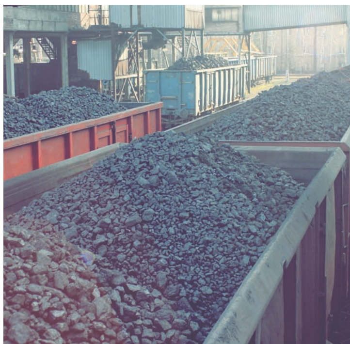
Kompania Węglowa zabrała swoim byłym pracownikom tonę węgla.