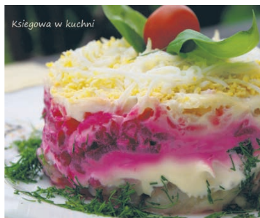
Księgowa w kuchni

Śledzie i cebule kroimy w kostkę, tylko pieprzymy, mieszamy razem i rozkładamy jako pierwszą warstwę na dnie przezroczystej salaterki. Następnie smarujemy majonezem i układamy drugą warstwę салатki, tj. buraki. Pieprzymy, solimy i smarujemy majonezem. To samo robimy z warstwą ziemniaków. Na koniec posypujemy startymi jajkami. Warstwy z jajek już nie smarujemy majonezem. Smacznego!