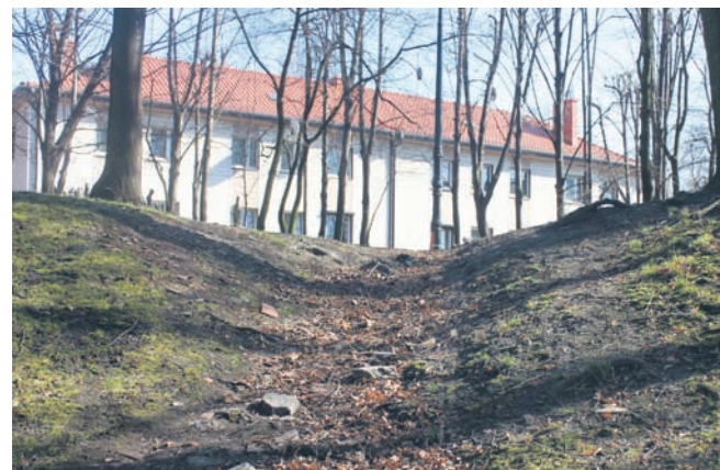
Wydeptany „śląd” stał się dla mieszkańców Rudy pełnoprawną ścieżką.