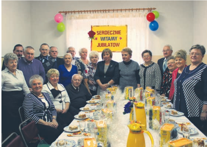
Jubilaci postanowili uwiecznić uroczystą chwilę.