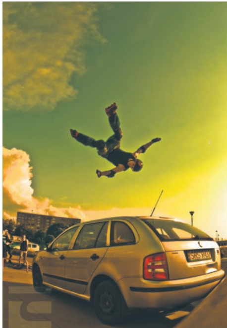
Michał Mildner (SMS o treści kurs.1 na nr 71100).

Pomóż swojemu faworytowi otrzymać kurs wspinaczkowy. Głosy w zabawie można oddawać za pomocą SMS-ów – wysyłając kod przypisany kandydatowi na nr 71100; oraz portalu społecznościowego Facebook – za pomocą kliknięć „lubię to”. Głosy sumują się. Głosowanie trwa od 19 marca od godz. 9.00 do 24 marca 2014 r. do godziny 15.00.