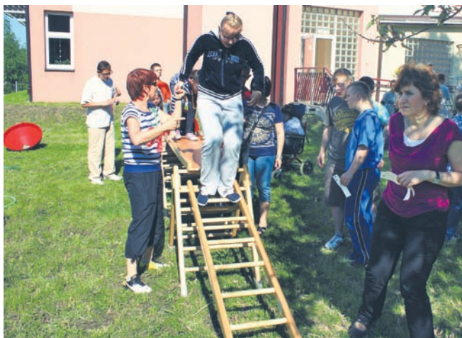
W województwie stawia się na bezpieczeństwo osób niepełnosprawnych.

Komenda Miejska Policji w Rudzie Śląskiej zaprasza do wzięcia udziału w konkursie „Pełnosprawne bezpieczeństwo”, w którym należy stworzyć spot reklamowy lub komiks promujący bezpieczeństwo niepełnosprawnych. Organizatorem wydarzenia jest Wojewoda Śląski wraz ze Śląskim Kuratorem Oświaty, Komendantem Miejskim Policji w Katowicach, Wydziałem Edukacji UM w Katowicach oraz Pałacem Młodzieży im. prof. A. Kamińskiego. Konkurs przeznaczony jest dla uczniów z terenu województwa śląskiego. Prace konkursowe należy przesłać w nieprzekraczalnym terminie do 30 kwietnia – szczegółowy regulamin zamieszczony jest na stronie www.ruda.slaska.policja.gov.pl .