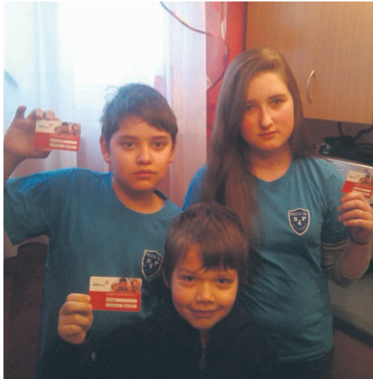
Z programu „Rudzka Karta Rodziny 3+” skorzystało już ponad 130 rodzin.

Do programu, poza miejskimi instytucjami, dołączył już „Aquadrom”, sklep z podręcznikami szkolnymi „Omega”, Ośrodek Szkolenia Kierowców „Dobra Szkoła” oraz Szkoła Języków Obcych „Bodar”. Program ma charakter otwarty, tzn. instytucje i firmy, które chcą zostać jego partnerami, mogą to uczynić na każdym etapie jego funkcjonowania. Partnerzy programu otrzymują specjalne naklejki promujące Kartę, które zamieszczają jako informację o swoim udziale w programie, w miejscu świadczenia swoich usług.