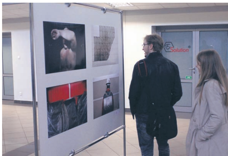
Wernisaż cieszył się dużym zainteresowaniem.