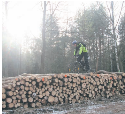
Piotr Manowski (SMS o treści kurs.3 nr na 71100).

Pomóż swojemu faworytowi otrzymać kurs wspinaczkowy. Głosy w zabawie można oddawać za pomocą SMS-ów – wysyłając kod przypisany kandydatowi na nr 71100; oraz portalu społecznościowego Facebook – za pomocą kliknięć „lubię to”. Głosy sumują się. Głosowanie trwa od 19 marca od godz. 9.00 do 24 marca 2014 r. do godziny 15.00.