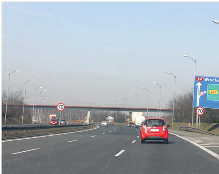
Na 327 km autostrady regularnie pojawia się uskok.

– Przyczyna powstawania tego wypiętrzenia jest złożona. Wpływ na taki stan rzeczy ma prowadzona w latach ubiegłych eksploatacja górnicza oraz złożony skład geologiczny jaki występuje w tym