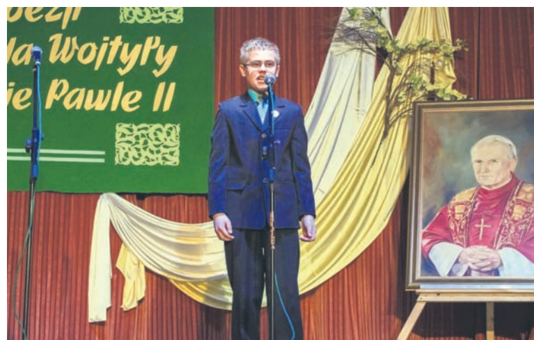
Piotrek zyskał uznanie Jury interpretacją dramatu „Brat naszego Boga”.