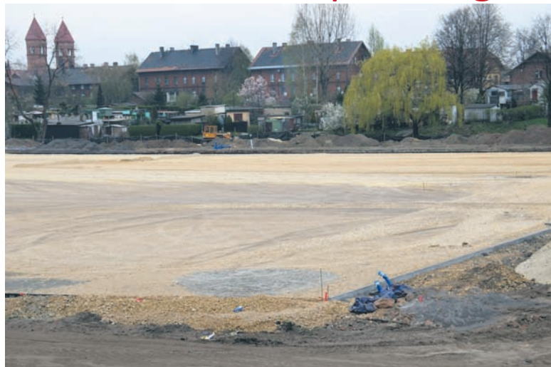
Koszt pierwszego etapu inwestycji wyniesie ok. 4,4 mln zł.

Rewitalizacja „Burlocha” trwa od października ubiegłego roku. – To duże przedsięwzięcie, które na pewno wpłynie na rozwój Orzegowa i Goduli – zaznacza prezydent Dziedzic. Pierwszy etap zaplanowany był na 90 dni, a w ramach jego realizacji powstaje boisko o nawierzchni ze sztucznej trawy przeznaczone do rugby, bieżnia betonowa do jazdy na rolkach, droga pożarowa wraz z miejscami parkingowymi, kanaliza-