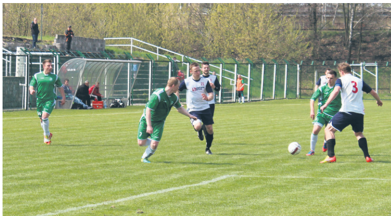
W drugiej połowie „zieloni” popisali się skutecznością.

Wynikiem 4:0 zakończył się sobotni (12.04.) pojedynek Grunwaldu Ruda Śląska z Lotem Konopiska. Autorem wszystkich bramek strzelonych dla „zielonych” był Kot.