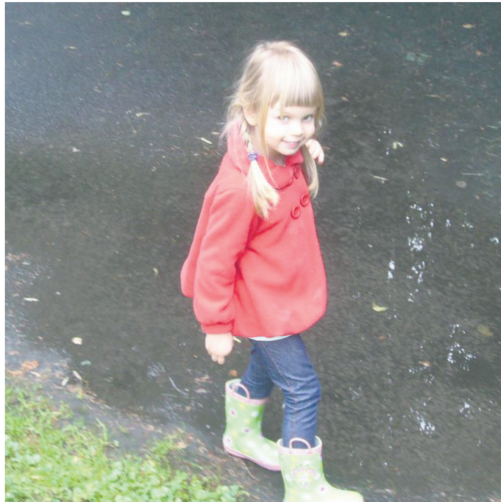
Chociaż w niektórych placówkach poproszono rodziców o dostarczenie kaloszy, to często przedszkolaki i tak w deszczową pogodę nie wychodzą z placówki.

– W praktyce nauczyciele nie organizują zajęć z dziećmi na powietrzu w warunkach atmosferycznych ku temu nie sprzyjających takich jak deszcz, silny wiatr, zbyt niska lub bardzo wysoka temperatura. Bardzo często pojawiają się sugestie ze strony rodziców, żeby dzieci nie wychodziły na podwórko ze względu na nieodpowiednią ich zdaniem aurę pogodową lub tłumaczą się tym, że ich pociecha jest po przebytej chorobie. Dlatego w takich sytuacjach nauczyciel zmuszony jest do pozostania w przedszkolu ze względu na konieczność zapewnienia bezpieczeństwa wszystkim dzieciom w grupie. Stąd nie zawsze nauczyciele są w stanie sprostać wszystkim