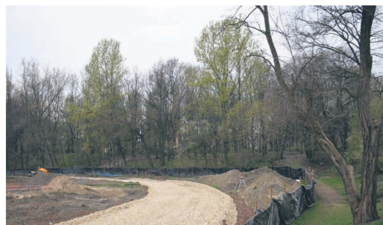
Pierwszy etap rewitalizacji „Burlocha” zakończy się w maju.

Zainteresowanie obiektem już w tej chwili jest ogromne i zdecydowanie