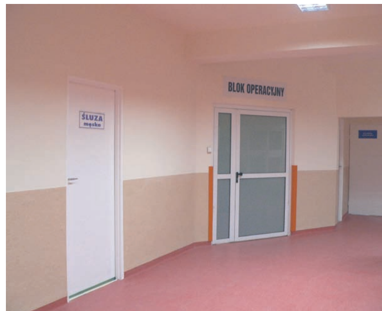
W ciągu ostatnich kilku miesięcy szpital zrealizował szereg inwestycji poprawiających funkcjonalność oddziałów oraz podnoszących ich estetykę.

Remonty przeprowadzone w Szpitalu Miejskim zostały sfinansowane ze środków przekazanych przez miasto poprzez dokapitalizowanie spółki. W 2012 i 2013 przekazano blisko 1 mln złotych