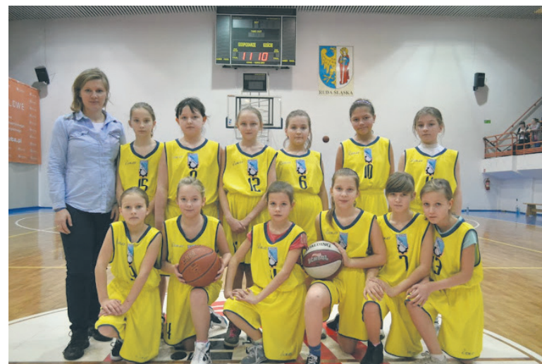
Zawodniczki Pogoni wywalczyły srebro w Pucharze Śląska.