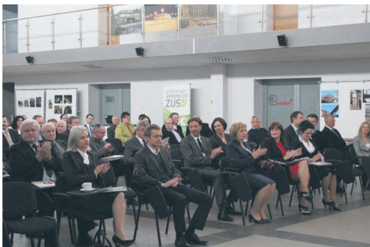
Organizatorami konferencji był m.in. UM Ruda Śląska, RAR Inwestor, ŚPPT w Rudzie Śląskiej.

Dzięki spotkaniu lokalne firmy mogły dowiedzieć się m.in. jakiego rodzaju instrumenty wsparcia oferować będzie Urząd Miasta w Rudzie Śląskiej, jakie są możliwości finansowania działalności gospodarczej za pomocą instrumentów bankowych, a przedstawiciele Urzędu Marszałkowskiego Województwa Śląskiego opowiedzieli o założeniach Regionalnego Programu Operacyjnego Województwa Śląskiego