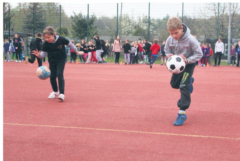
Harcerska Olimpiada Sportowa trwała trzy dni.

Około 260 osób wzięło udział w ósmej edycji Harcerskiej Olimpiady Sportowej. Od piątku do niedzieli (11-13.04.) zawodnicy rywalizowali w kilkunastu konkurencjach zespołowych i indywidualnych. Areną zmagania było boisko znajdujące się przy Szkole Podstawowej nr 15 w Rudzie Śląskiej-Halembie.