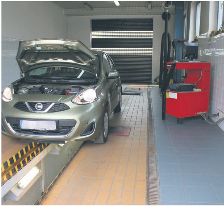
W tegorocznej akcji wzięło udział ponad 600 kierowców.