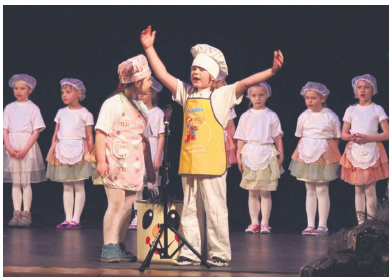
Widzowie zobaczyli na scenie plany na przyszłość małych artystów.