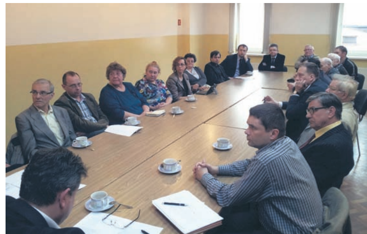
Na spotkaniu omówiono najbliższą przyszłość stowarzyszenia.