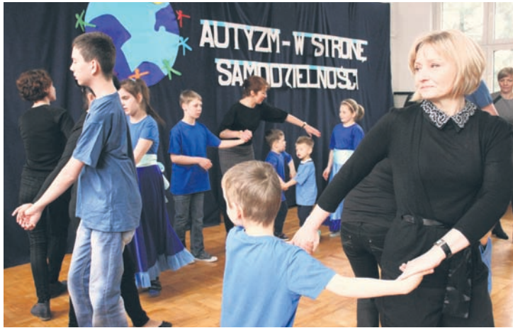
Podopieczni ZSS im. św. Łukasza przygotowali także program artystyczny, który poprzedził konferencję.

W ramach obchodów Tygodnia Autyzmu w środowy (9.04.) poranek w Zespole Szkół Specjalnych im. św. Łukasza odbyła się konferencja „Autyzm – w stronę samodzielności”. Natomiast w piątek (11.04.) w Urzędzie Miasta odbyła