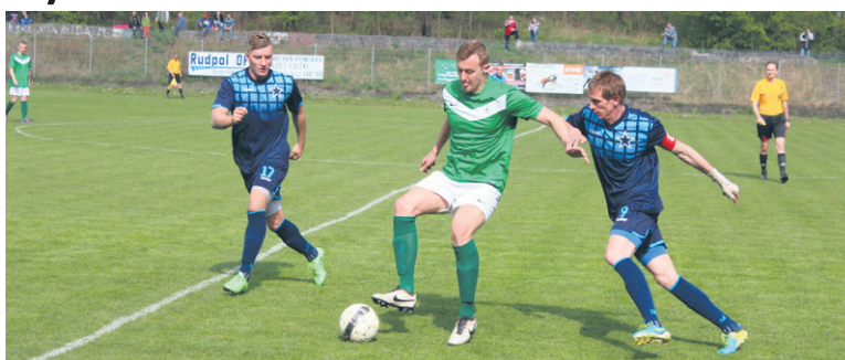
Mimo dwubramkowej przewagi po 16 minutach meczu, Slavii nie udało się odnieść zwycięstwa.

Tylko remisem zakończyło się sobotnie (12.04.) spotkanie Slavii Ruda Śląska z RKS-em Grodziec.