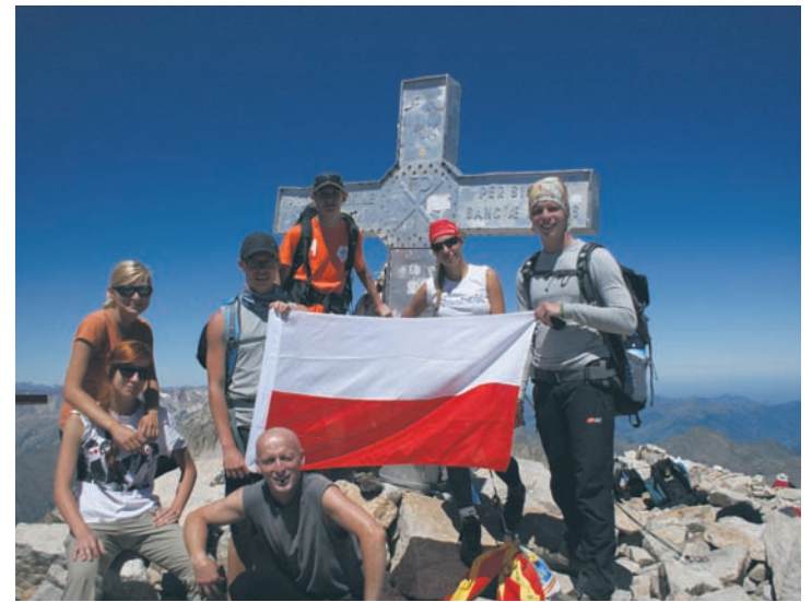
Klub Górski na Pico de Aneto - najwyższym szczyt Pirenejów.

Klub postanowił wziąć sprawy w swoje ręce i znaleźć wsparcie w działalności, w zamian proponując różne formy promocji. Sponsorzy, którzy przyczyniliby się finansowo lub rzeczowo do wyprawy na Korsykę mieliby