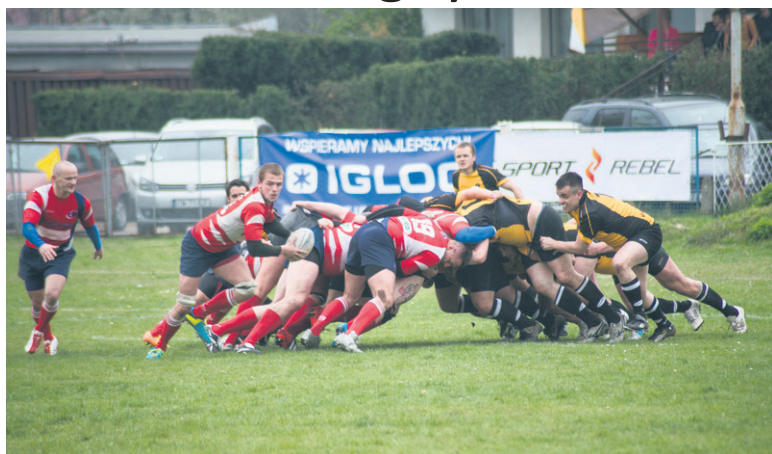
Ze względu na remont Burlocha rudzianie swoje mecze rozgrywają w Bytomiu.