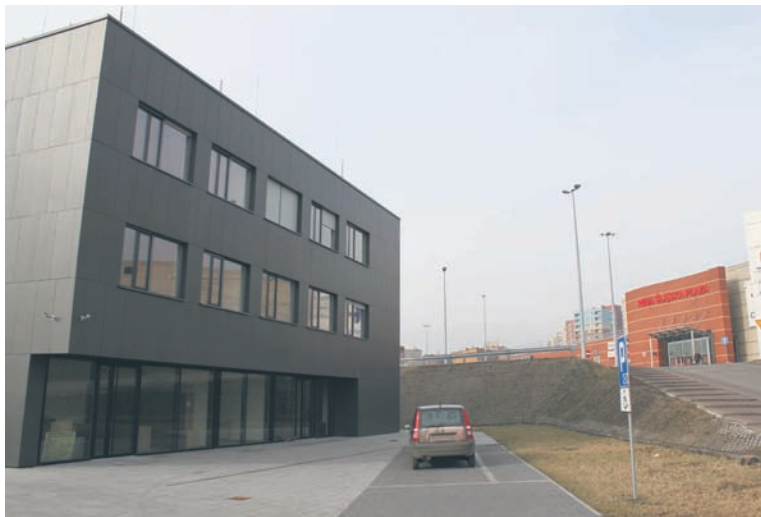
Nowe biuro znajduje się w pobliżu Centrum Handlowego Plaza.

– W czwartek będziemy rozdawać nasiona rzeżuchy jeszcze w przedświątecznym klimacie. Natomiast nasiona będą teraz u nas często rozdawane nie tylko z powodu świąt i rozpoczynającej się wiosny. Każdy Klient