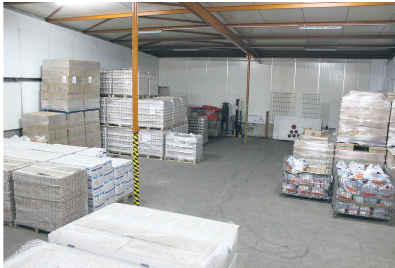
Zapasy Śląskiego Banku Żywności powoli topnieją.