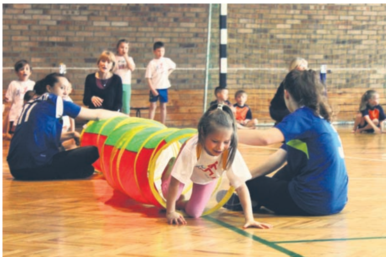
Przedszkolaki mogły poczuć w sobie ducha rywalizacji.