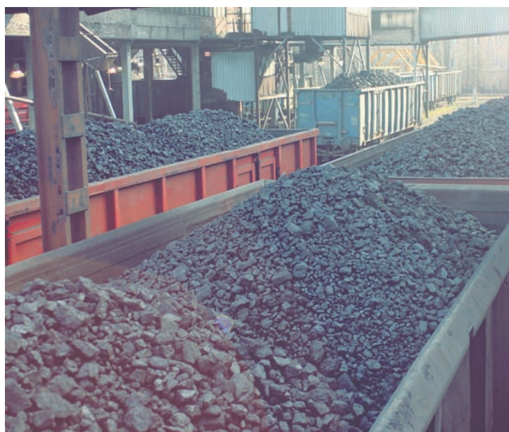
Kontrowersję wzbudziło już zabranie jednej tony węgla emerytom.