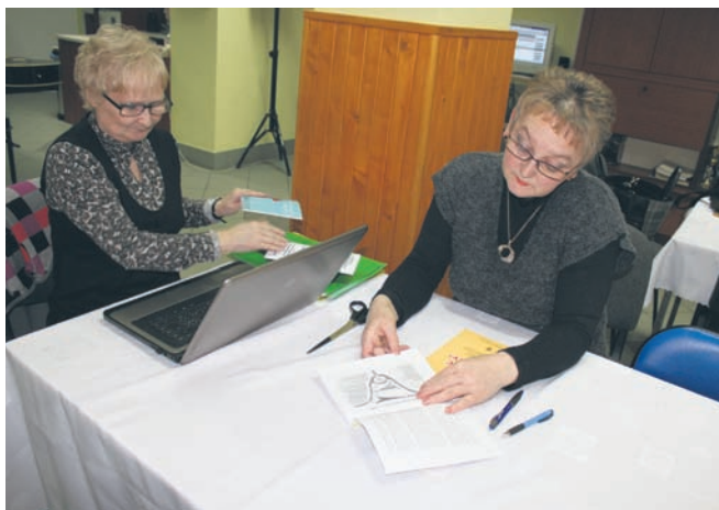
Podczas Dnia Trzeźwości można było skorzystać z konsultacji.