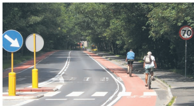
W tym roku w Rudzie Śląskiej powstanie 14 km tras i ścieżek rowerowych.