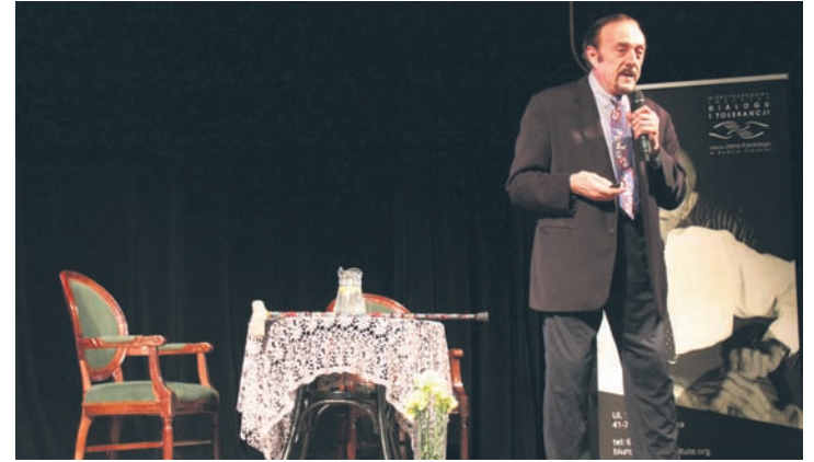
Philip Zimbardo – autor znanego na całym świecie eksperymentu więziennego.