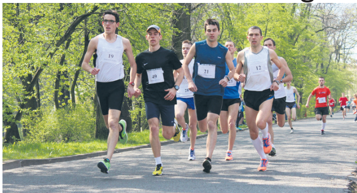
Ponad 200 biegaczy wystartowało w tegorocznej edycji memoriału.

Po raz dziesiąty miłośnicy biegania zebrali się w sobotę (12.04.) w Parku im. Augustyna