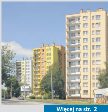
Więcej na str. 2