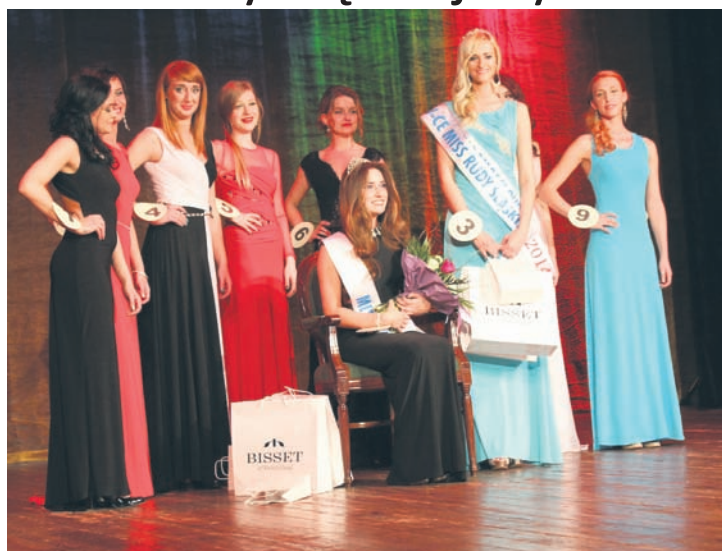
Uroczysta gala odbyła się w MCK.