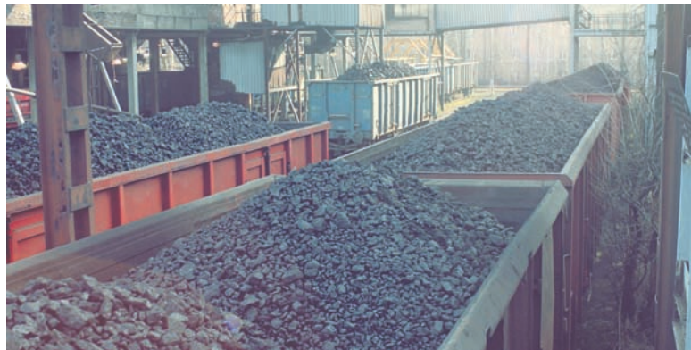
Wstrzymanie wydobycia w dziewięciu kopalniach Kompanii Węglowej to efekt problemów ze sprzedażą węgla energetycznego.