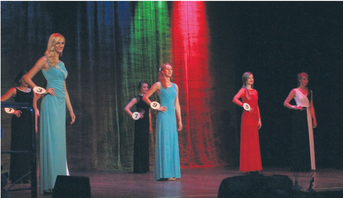
Kandydatki do tytułu Miss Rudy Śląskiej 2014 w strojach wieczorowych.