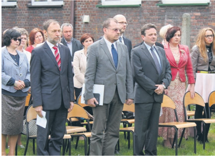
Na akademii byli obecni przedstawiciele Politechniki Śląskiej.