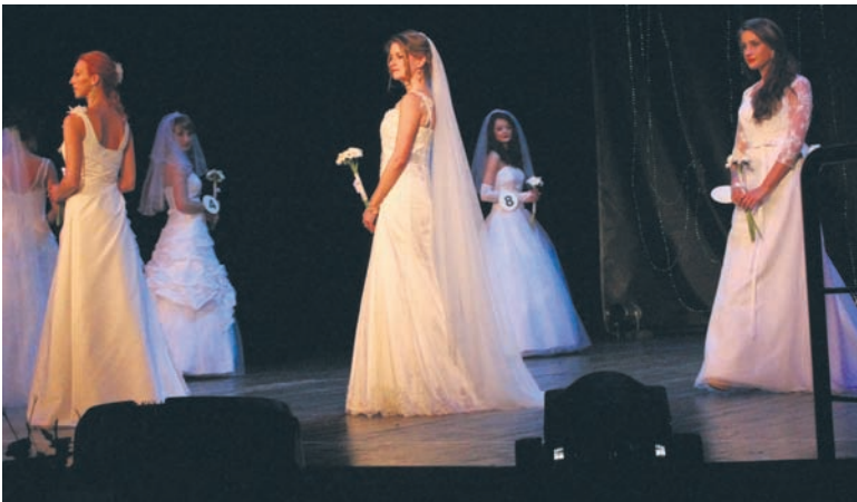
Kandydatki w sukniach ślubnych.