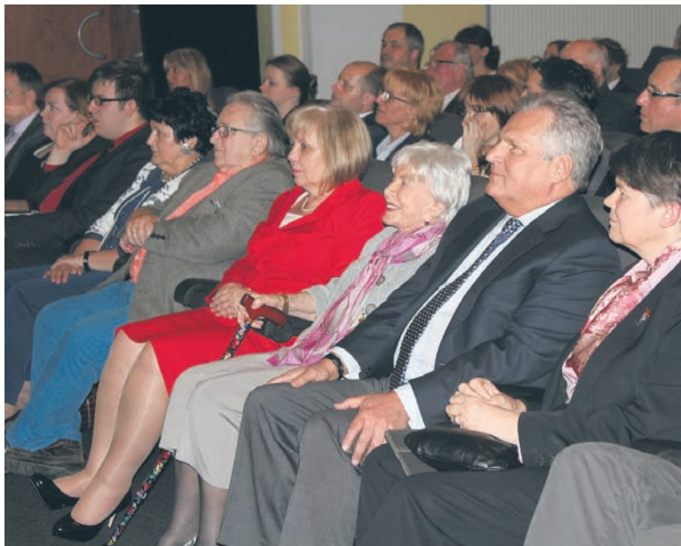
Konferencja „Dziedzictwo człowieka odwagi i prawości”.

– Dzisiejszy dzień jest bardzo ważną rocznicą, upamiętniającą wielkiego Polaka, dzięki któremu mogliśmy uświadomić całemu światu, co działo się w naszym kraju w czasie wojny i o tym, że Holokaust był prawdą –