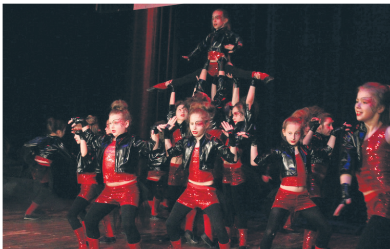
Gałę finałową uświetnili swoimi występami laureaci.