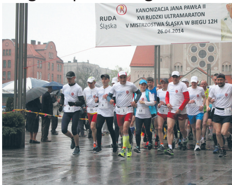
Ultramaratończycy rozpoczęli zmagania punktualnie o 7 rano.

Punktualnie o godzinie 7.00 w sobotę (26.04.) prawie 100 biegaczy stawilo się na placu Jana Pawła II, by spróbować swoich sił w 16. edycji Międzynarodowego Rudzkiego Biegu 12-godzinnego. Ta edycja imprezy miała wyjątkowy charakter. Odbyła się bowiem w przeddzień kanonizacji Jana Pawła II. By uczcić pamięć papieża Polaka, 14 uczestników biegu