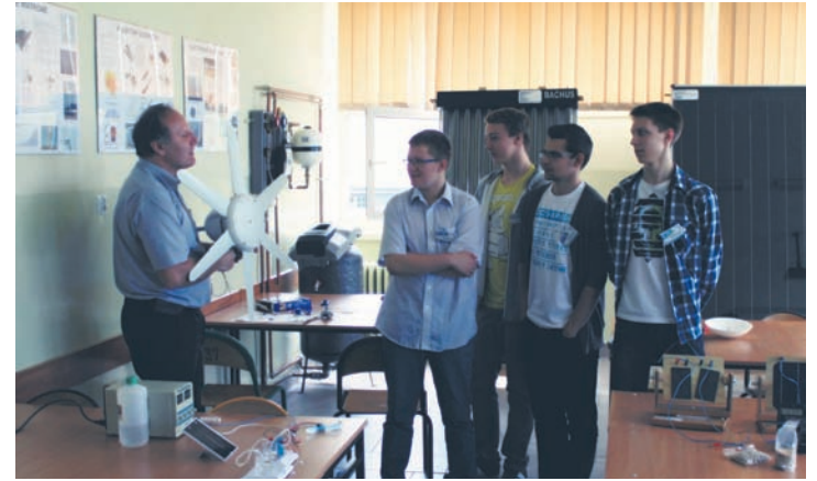
W klasach prezentowano zaplecze dydaktyczne szkół.