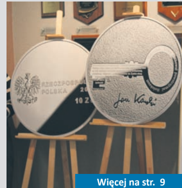
Więcej na str. 9