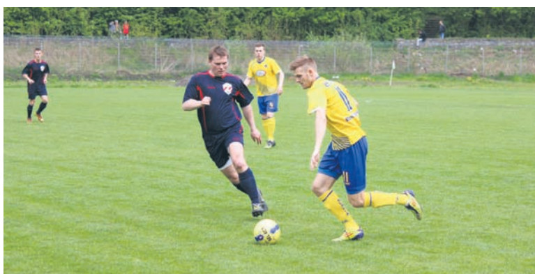
Rudzianie zajmują aktualnie piąte miejsce w tabeli.

Komplet punktów zgarnęła Slavia Ruda Śląska w sobotnim spotkaniu (26.04.) z Zagłębiakiem Dąbrowa Górnicza, wygrywając przed własną publicznością 3:2.