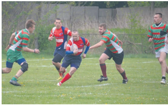
W szranki na turnieju seniorów stanęło w sumie osiem drużyn, w tym lider ligowej tabeli Husar Bolesławiec.

RUGBY Ruda Śląska swoje mecze grupowe rozpoczęło od meczu z lide-