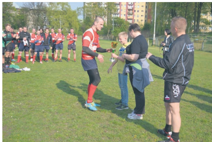
Seniorzy K. S. RUGBY w turnieju Polskiej Ligi Rugby 7 zajęli pierwsze miejsce.

Natomiast najstarsza grupa występująca w Memoriale, czyli młodzicy, zegrali już na dużym boisku, w pełnokontaktowej odmianie rugby. Ostatecznie zajęli dziewiąte miejsce w tym turnieju.