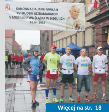
Więcej na str. 18