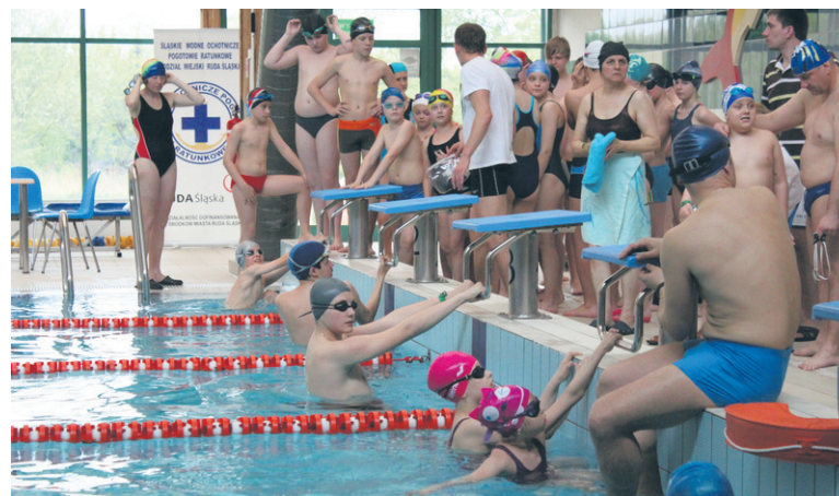
W pływackiej sztafecie wzięli udział dorośli i dzieci.

Sztafeta oficjalnie zakończyła się o godzinie 21.37, czyli w godzinie śmierci papieża Polaka.