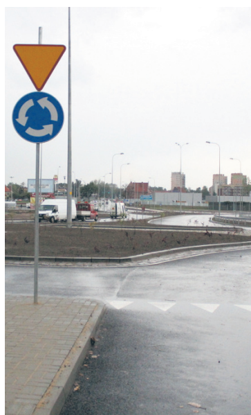
Ruda Śląska dostała refundację części kosztów za budowę tzw. rond turbinowych.

Jej opinia wywołała lawinę komentarzy, bo chociaż każda inicjatywa mająca na celu usprawnienie komunikacji jest cenna, to rodzi się pytanie, czy ingerowanie w przyznawanie unijnych dotacji leży w mocy jakiegokolwiek partii? Specjaliści nie mają co do tego wątpliwości. – Urząd Marszałkowski przekazując dotacje ze