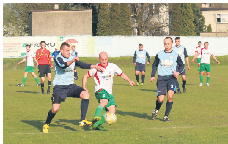
Wawel plasuje się aktualnie tuż za podium – na czwartym miejscu w tabeli.