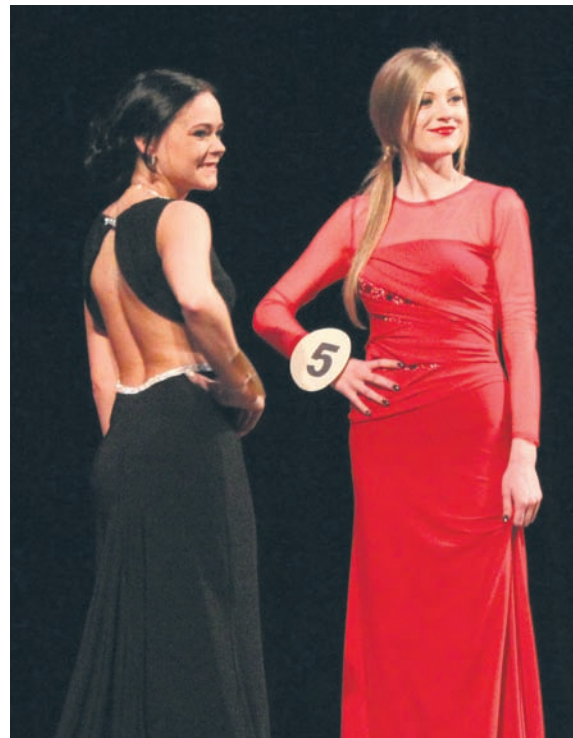
Uśmiech do widowni.