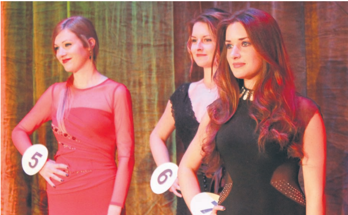
Piękne kandydatki czekają na werdykt.