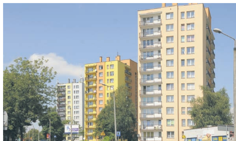
Na wykup mieszkania będzie można otrzymać nawet 65 proc. bonifikatę.

Na dodatkową bonifikatę przy wykupie mieszkania mogą liczyć natomiast lokatorzy mieszkań komunalnych, które znajdują się w budynkach wspólnot, gdzie miasto ma mniejszościowy udział. – Zależy nam, by w mieście było jak najwięcej wspólnot mieszkaniowych, w których to właściciele lokali mają 100 proc. udziałów. Dlatego też w budynkach wspólnot, gdzie miasto jest mniejszościowym udziałowcem oraz przemawiają za tym szczególne względy, takie jak ujęcie budynku w Lokalnym Programie Rewitalizacji bądź objęcie go ochroną konserwatorską, bonifikaty przy wykupie mieszkań mogą sięgnąć nawet 75 proc. – podkreśla Michał Pierończyk.