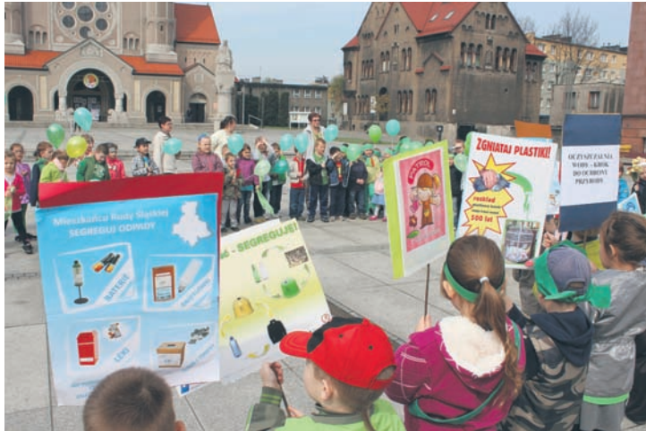
Najmłodszy wiedzą jak dbać o środowisko.