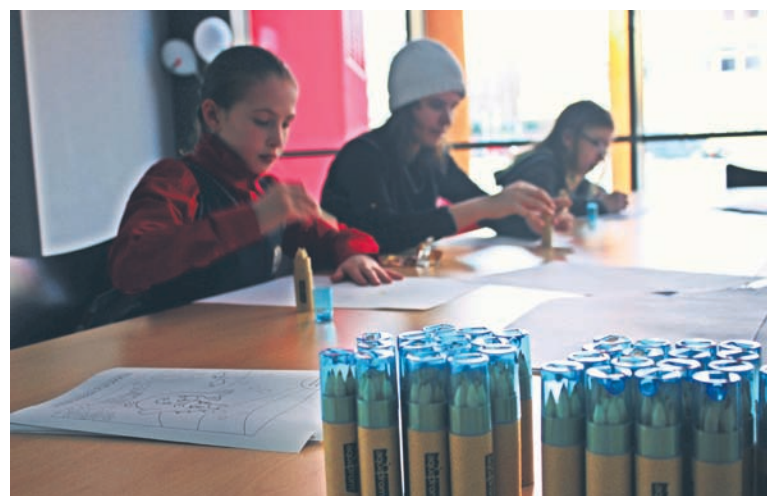
W konkursie można wygrać atrakcyjne nagrody.