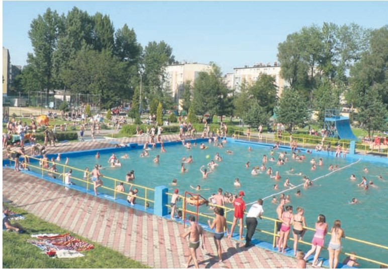
Modernizacja i rozbudowa miejskiego kąpieliska ma kosztować 13,4 mln zł.

Całkowita wartość zgłoszonych przez Rudę Śląską do konkursu projektów wynosi prawie 13,7 mln zł. Z przyznanego dofinansowania miasto chce zrealizować dwie inwestycje. Pierwsza dotyczy modernizacji i rozbudowy kompleksu rekreacyjnego przy ul. Ratowników w Nowym Bytomiu. – Planujemy wybudować w tym miejscu trzy nowe niecki basenowe ze stali nierdzewnej, wyposażać je w system uzdatniania wody basenowej oraz urządzenia do zapewnienia stałej temperatury wody – wymienia prezydent Grażyna Dziedzic. – Chcemy, by kompleks basenów przy ul. Ratowników był nowoczesny i by spełniał wszelkie wymogi stawiane ta-