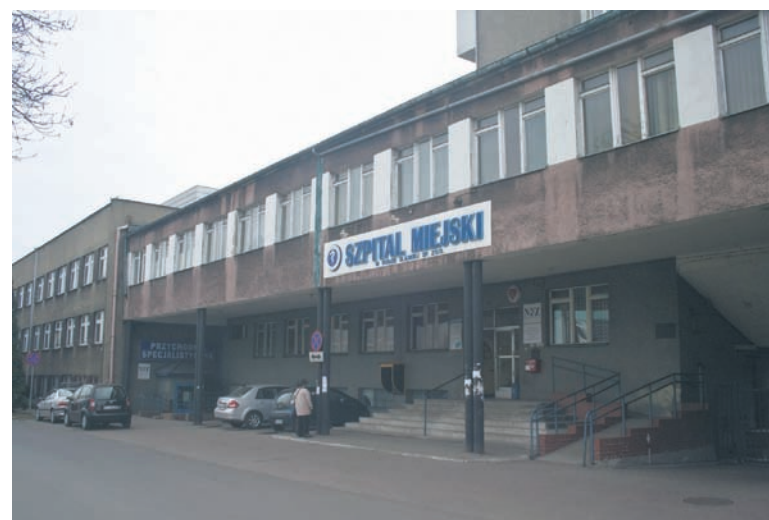
Termomodernizacja szpitala i wymiana oświetlenia będzie kosztowała 5,4 mln zł.

Złożony w sierpniu ubiegłego roku przez rudzki szpital projekt dofi-