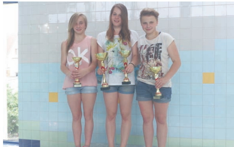
Rudzianki zdominowały klasyfikację generalną kobiet.

Rudzcy ratownicy jeszcze wielokrotnie zajmowali miejsca w czołówce zawodów, co dobrze świadczy przed zbliżającymi się mistrzostwami Polski, które rozegrane zostaną w dniach 14-15 czerwca w Szczecinie.