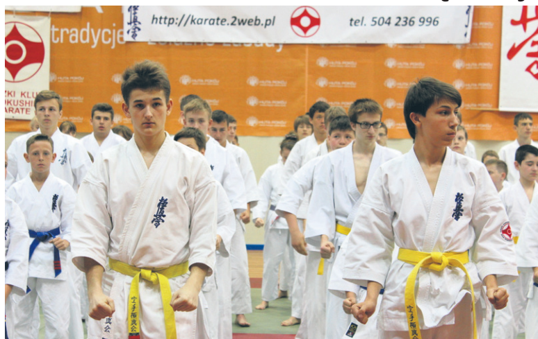
Tegoroczna edycja zawodów cieszyła się największą jak dotąd frekwencją.

220 zawodników i zawodniczek wzięło udział w rozgrywanych w niedzielę (25.05.) na hali MOSiR-u w Nowym Bytomiu Otwartych Mistrzostwach Rudy Śląskiej w Karate Kyokushin Dzieci i Młodzieży.