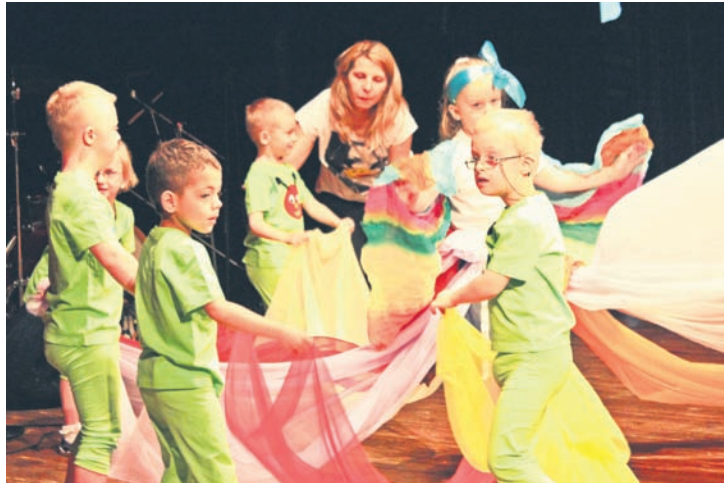
Do artystycznej zabawy przyłączyły się także placówki z Zabrza i Chorzowa.