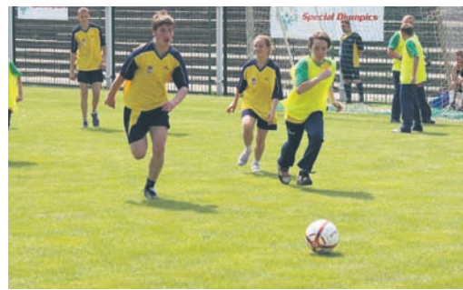
Zacięcie sportowe i silne emocje towarzyszyły turniejowi.