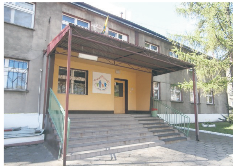
W formule PPP miasto chce poddać termomodernizacji sześć przedszkoli i jedno gimnazjum.

Z przeprowadzonych przez rudzki magistrat analiz wynika, że w czterech szkołach, które poddano termomodernizacji w ostatnich latach, średnioroczna oszczędność energii wyniosła nawet kil-