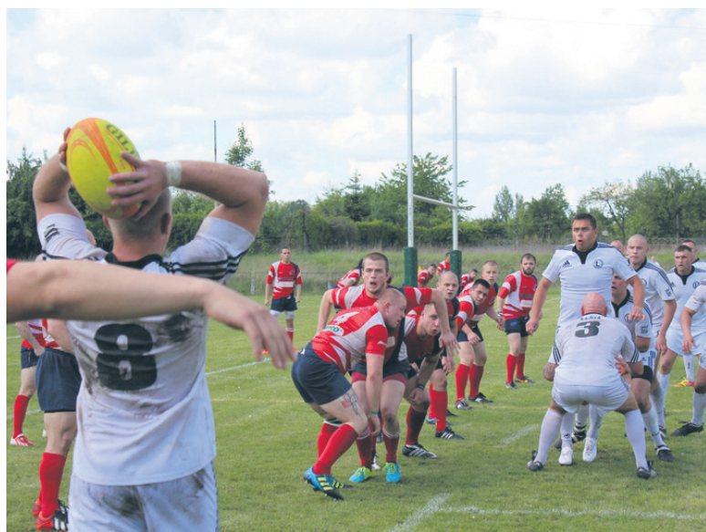
Seniorzy przegrali z Legią tylko różnicą dwóch punktów.

W niedzielę (25.05.) w decydującym o pierwszym miejscu w tabeli, ostatnim meczu rozgrywek II ligi K.S. IGLOO RUGBY Ruda Śląska przegrało z RC LEGIĄ Warszawa 24:26. Obydwie drużyny zagrały bardzo wyrównane spotkanie, a o zwycięstwie zadecydowały detale – błędy, czyli większa ich ilość.