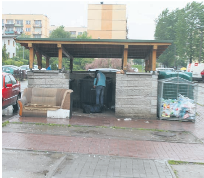
Mieszkańcy bloku przy ulicy Magnolii skarżą się, że z terenu ich posesji nie są odbierane czasem śmieci.

– Minimalną pojemność pojemników na niesegregowane (zmie-