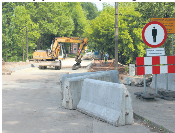
Ulica Katowicka zostanie oddana do użytkowania w lipcu.