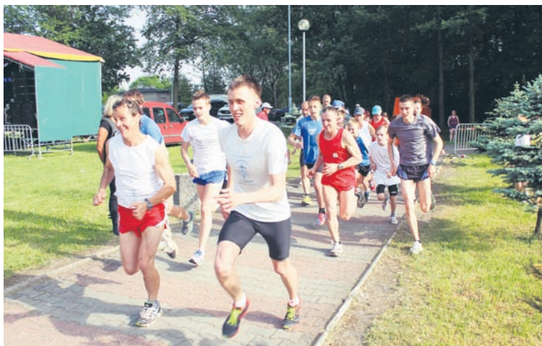
Każdy z festynów z okazji 55-lecia miasta rozpoczynają rodzinne biegi.

Mieszkańcy Bielszowic obecni na festynie mogli wspomóc także czte-