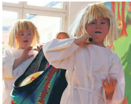
Nim rozpoczęto wspólne świętowanie, uczniowie wystawili przedstawienie o Jacku i Placku co ukradli księżyc.