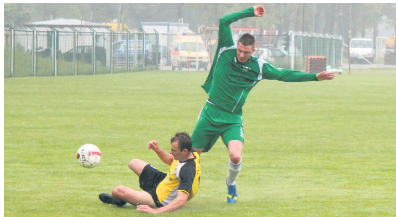
Mimo remisu Grunwald umocnił się na pozycji lidera.

Grunwald Ruda Śląska w sobotę (24.05.) podzielił się punktami z Wyzwoleniem Chorzów. „Zieloni” zremisowali na wyjeździe 1:1. Dzięki porażce Górnika Piaski „zieloni” umocnili się na pozycji lidera. Pierwszy celny strzał oddali gospodarze i miał on miej-