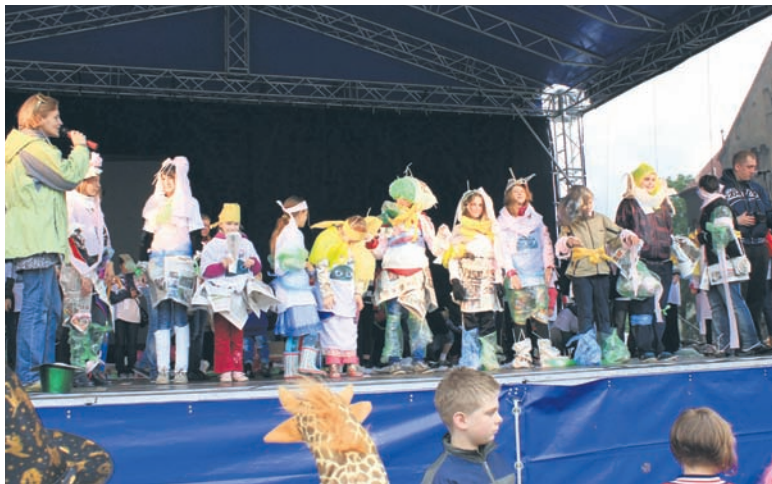
W zeszłym roku Gra Miejska dotyczyła segregacji odpadów.