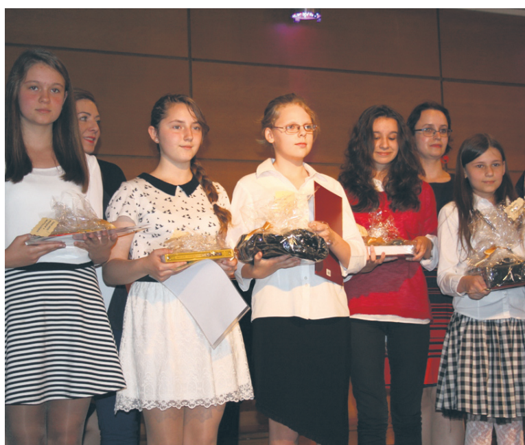
Do miejskich olimpiad przedmiotowych przystąpili uczniowie z 20 szkół podstawowych.

Uczniowie rudzkich szkół podstawowych osiągnięcia odnoszą także