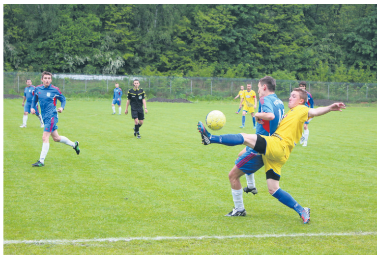
Slavia z dorobkiem 41 punktów zajmuje aktualnie siódme miejsce w tabeli.