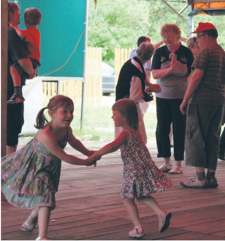
W sobotę na pikniku nie zabrakło wspólnych tańców.