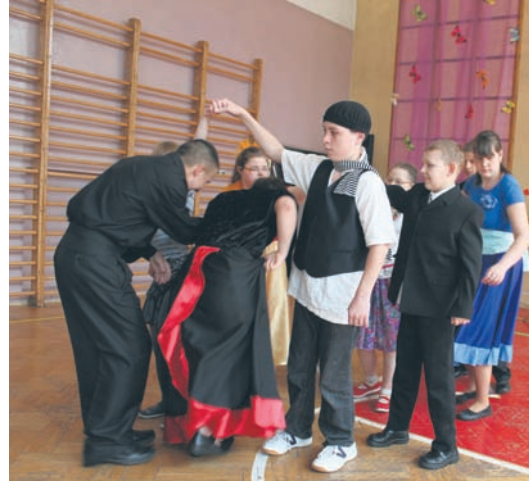
Uczniowie ZSS nr 3 prezentują własny program artystyczny.