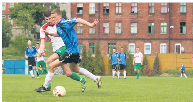
Wawel nadal plasuje się na czwartym miejscu w tabeli.

Porażki z sąsiadem z tabeli – Przemszą Siewierz doznał w sobotę (24.05.) Wawel Wirek. Rudzianie przegrali 1:3.