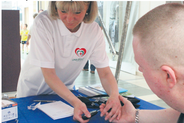
Na specjalnych stanowiskach można było zbadać ciśnienie i poziom cukru we krwi.