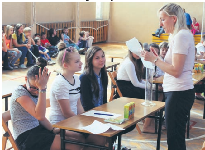
Uczniowie musieli wykazać się wiedzą o patronce Szkoły Podstawowej nr 3.