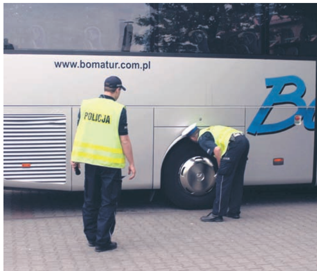
Policjanci dokładnie sprawdzają każdy autobus.

Od czerwca rudzcy policjanci przeprowadzili już dwadzieścia jeden kontroli. W dwóch przypadkach pojazd nie został dopuszczony do jazdy. W czerwcu bus wiozący dzieci na wycieczkę nie przeszedł pomyślnie kontroli z powodu braku licencji na przewóz osób. W drugim przy-