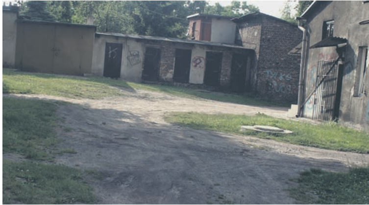
Błoto i dziury to krajobraz placu przy ulicy Powstańców.