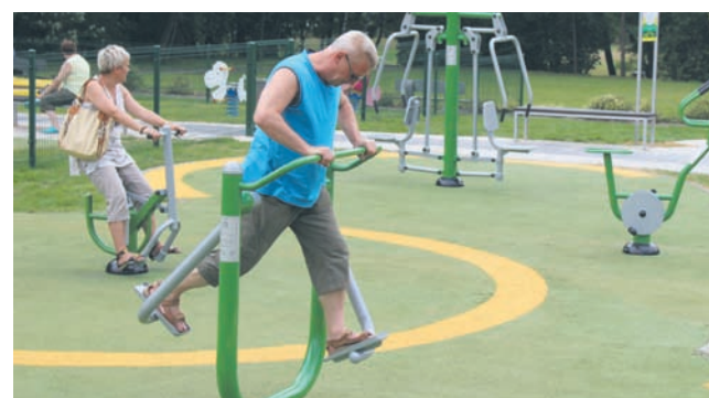
Siłownia napowietrzna jest dobrą formą aktywnego wypoczynku.

Ponad 4,3 mln zł kosztowała rewitalizacja ośrodka sportowo-rekreacyjnego Burloch w Orzegowie, z którego już korzystają mieszkańcy. 1 mln zł w tegorocznym budżecie przewidziano na odnowienie Parku im. A. Koziola w Rudzie. Nowe miejsca rekreacji powstaną także na osiedlu „Paryż” w Goduli, gdzie kosztem ponad 0,5 mln złotych powstanie plac zabaw dla dzieci oraz plac