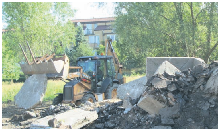
Prace przy usuwaniu odpadów.