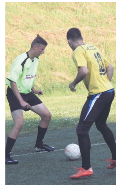
Dla obu trenerów był to wartościowy sparing.