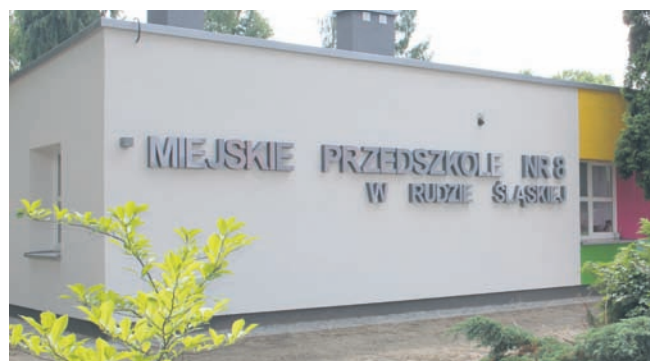
Na ten rok w Rudzie Śląskiej zaplanowano termomodernizację czterech placówek oświatowych.

– Staramy się wygospodarować jak najwięcej pieniędzy na termomodernizację szkół i przedszkoli, bo gwarantują one oszczędność energii, a to z kolei przekłada się na