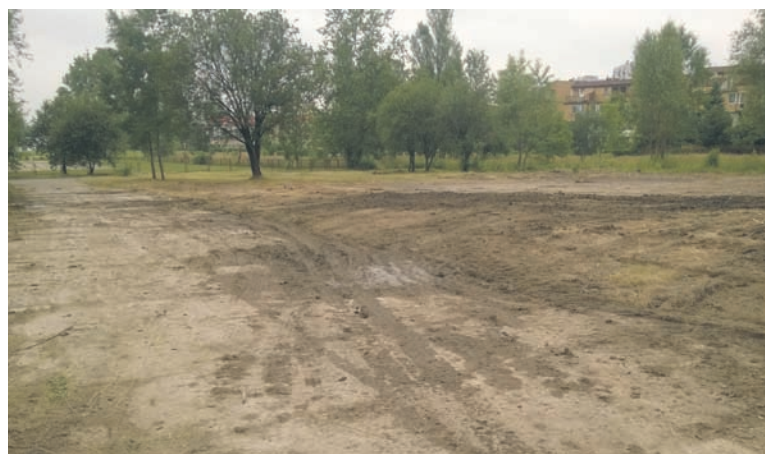
Częściowo wyczyszczony teren po dzikim wysypisku.