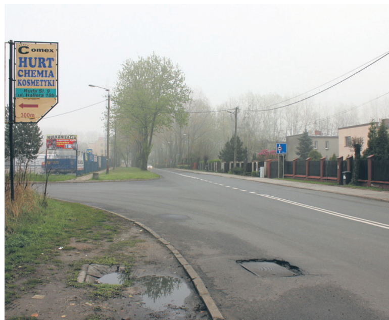
Zakład produkcji sadzy technicznej i olejów w procesie pirolizy niskotemperaturowej miał powstać przy ulicy Hallera – naprzeciw osiedla domków jednorodzinnych.

– Od początku podkreślałem, że decyzja wydana przez Panią Prezydent jest