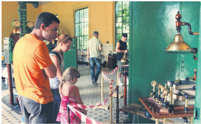
Zwiedzający wystawę mogli podziwiać niecodzienne przedmioty.