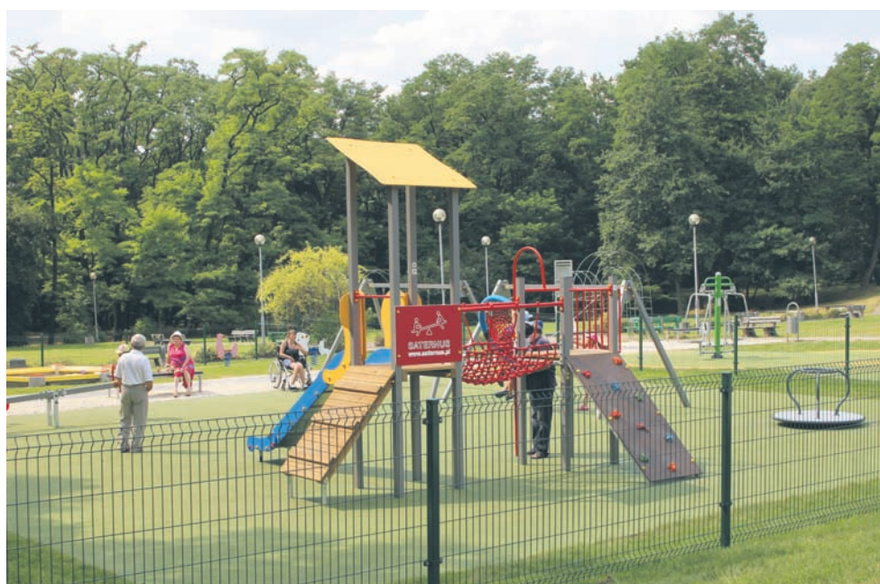
Plac zabaw w parku „Strzelnica” cieszy się dużą popularnością.

wo-rekreacyjnych zaplanowanych na ten rok w Rudzie Śląskiej. W tym roku w Bielszowicach powstanie jeszcze drugi plac zabaw przy Zespole Szkół nr 4 Specjalnych na ul. Bielszowickiej 108. Plac powstanie kosztem 140 tys. złotych w ramach programu „Radosna Szkoła”.