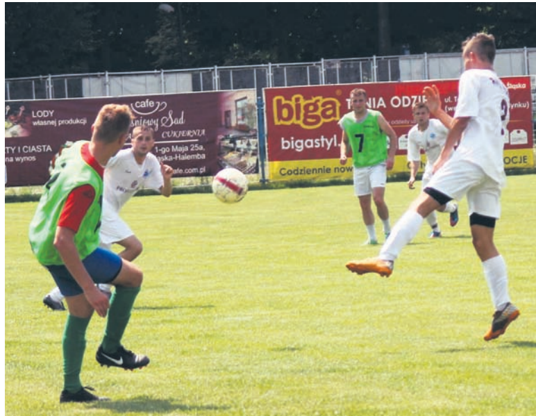
Zawodnicy Wawelu rozegrali dobre spotkanie.

Pierwszy sparing Wawelu Wirek zakończył się remisem 3:3. W sobotę (19.07.) rudzianie zmierzyli się z drużyną Wilki