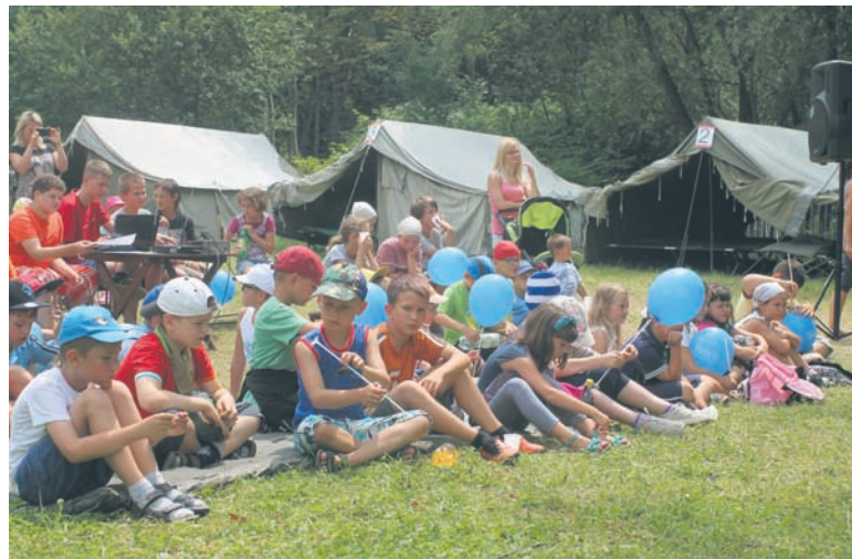
Dzieci podczas Nieobozowej Akcji Letniej spędzają czas na świeżym powietrzu.