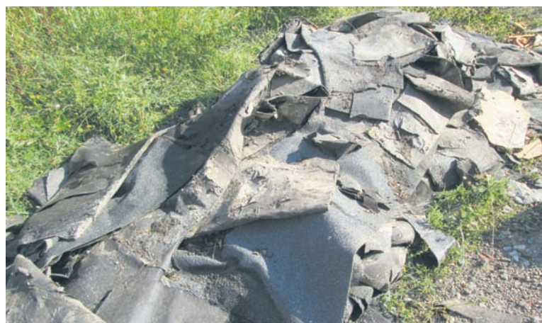
Na dzikich wysypiskach często pojawiają się odpady budowlane.

Likwidacja jednego z 13 dzikich wysypisk na terenie Mysłowic.