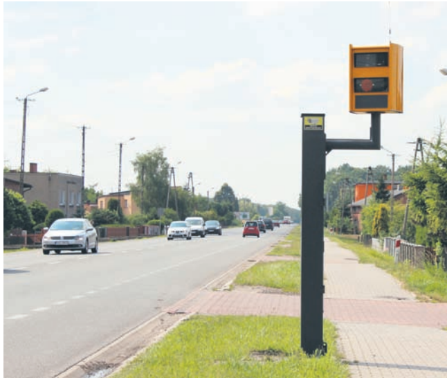
Od 1 lipca tylko żółte fotoradary mogą wykonywać zdjęcia.