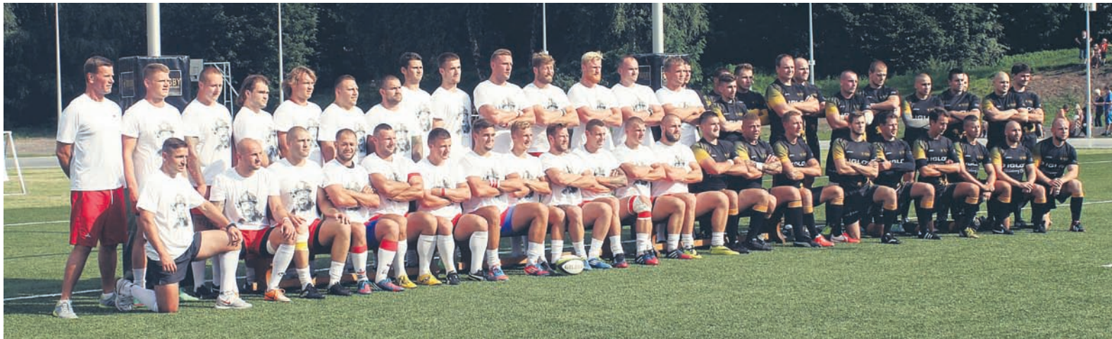
Zawodnicy zrobili sobie przed meczem wspólne zdjęcie.