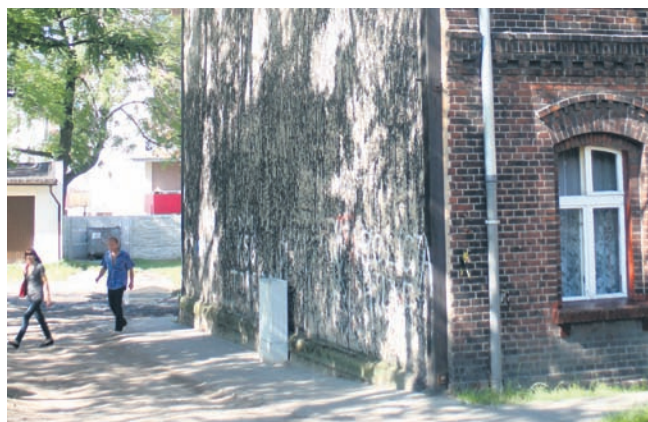
Wygląd budynku pozostawia wiele do życzenia.