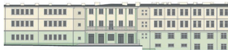
Tak po zakończonej termomodernizacji będzie się prezentowała elewacja wschodnia szkoły.

Co warto podkreślić, termomodernizacja przeprowadzona zostanie przy współudziale funduszy Wojewódzkiego Funduszu Ochrony Środowiska i Gospodarki Wodnej, które stanowić będą większą część środków potrzebnych na realizację inwestycji. – Będzie to pożyczka wraz