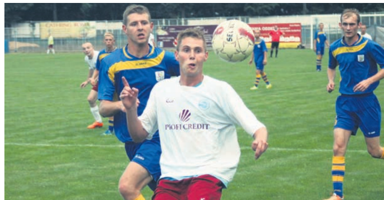
W drugiej połowie zawodnicy Wawelu poprawili swoją grę.

Wawel Wirek rozpoczął rozgrywki od wyrównanego spotkania z drużyną LKS-u Nędza. Po fatalnej pierwszej połowie, zawodnicy z Wirku zdołali uporządkować swoją grę i zremisowali mecz 1:1.