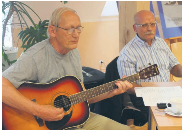
Podczas spotkania mieszkańcy mogli też śpiewać śląskie piosenki.