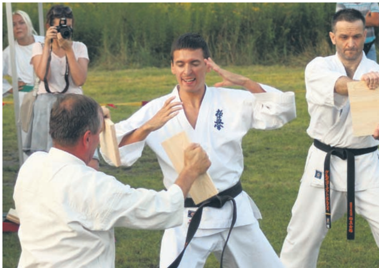
Podczas festynu mieszkańcy zobaczyli pokaz karate.