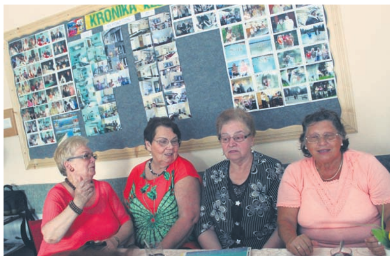
Dla seniorów śródowe zebrania są rozrywką – umożliwiają organizowanie spotkań towarzyskich.