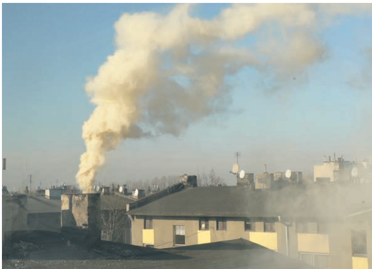
Na Śląsku koncentruje się około 40 proc. zanieczyszczeń powietrza z całego kraju.

Program będzie realizowany do 2020 roku i będzie obejmował dofinansowania do wymiany źródeł ciepła na nieemisyjne, przedsięwzięcia związane z poprawą efektywności energetycznej, ograniczaniem ilości zużywanego paliwa, termomodernizacją obiektów, przyłączeniami budynków do sieci ciepłowniczej czy wykorzystaniem odnawialnych źródeł energii. Aktualnie WFO-ŚiGW prowadzi rozeznanie, ile spółdzielni i wspólnot mieszkaniowych jest zainteresowanych dofinansowaniem w tej formule. Dlatego też zarządcy nieruchomości wielorodzinnych z terenu Rudy Śląskiej proszeni są o kontakt z Wydziałem Rozwoju Miasta w rudzkim magistracie (tel. 32 244-90-00 wew. 3062, e-mail: fundusze@rudaslaska.pl).