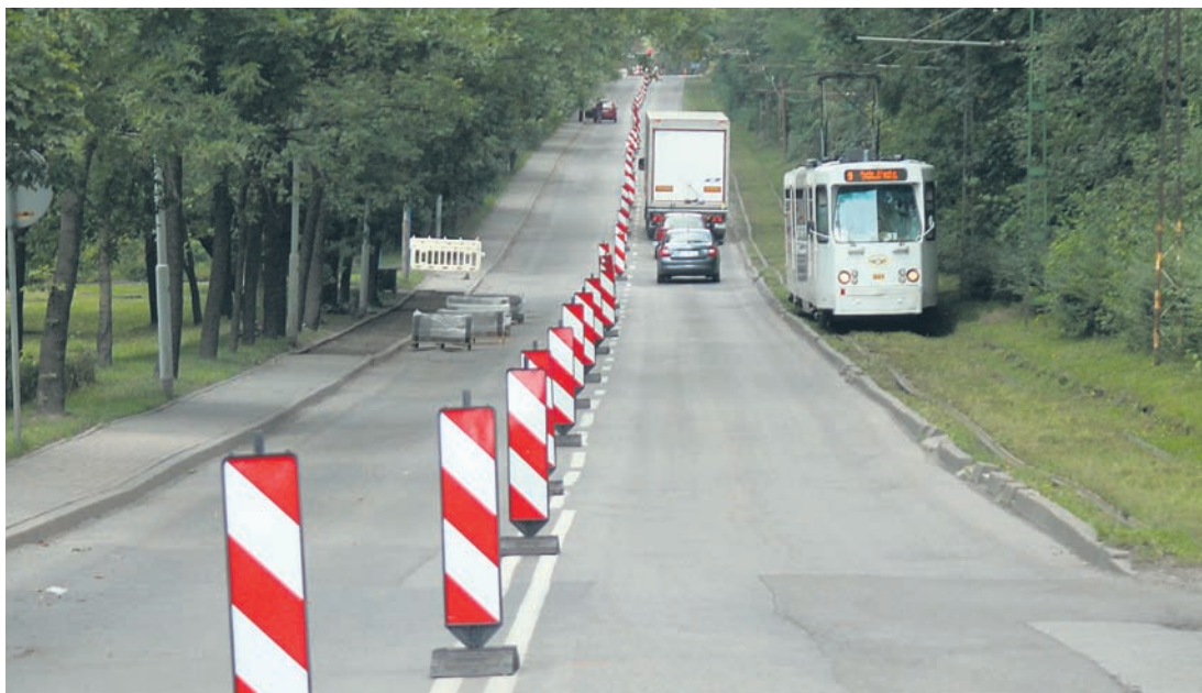
Prace przy ul. Karola Goduli potrwać mają około 3 miesięcy.