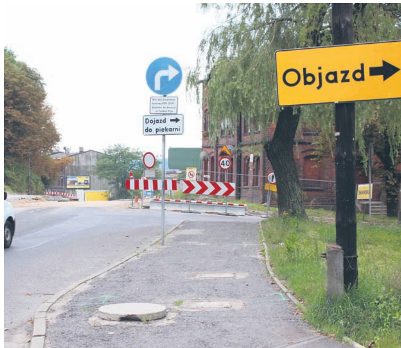
Objazd przy ulicy Tunkla będzie trwał do końca października.