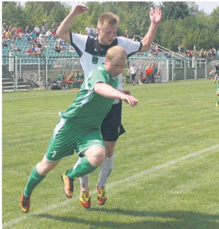
Po czterech kolejkach rudzianie zajmują pierwsze miejsce w tabeli.

(9.08.) Grunwald Ruda Śląska – 4:1 (2:1) GKS 1962 Jastrzębie