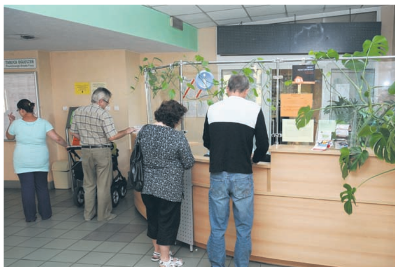
W projekcie wezmą udział 62 osoby bezrobotne między 18. a 30. rokiem życia.

gań rynku pracy. Następnie osoby biorące udział w projekcie będą uczestniczyć w szkoleniu z zakresu komunikacji i pracy w zespole. Będą one pracować nad motywacją, odpowiednim przygotowaniem do rozmów kwalifikacyjnych, opracują także swoje dokumenty aplikacyjne. – Bardzo często brak doświadczenia zawodowego jest barierą w zdobyciu pracy, szczególnie wśród osób młodych, dlatego właśnie