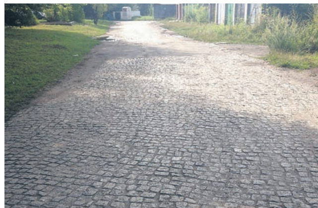
Ulica Szyb Zofii jest utrapieniem dla kierowców.