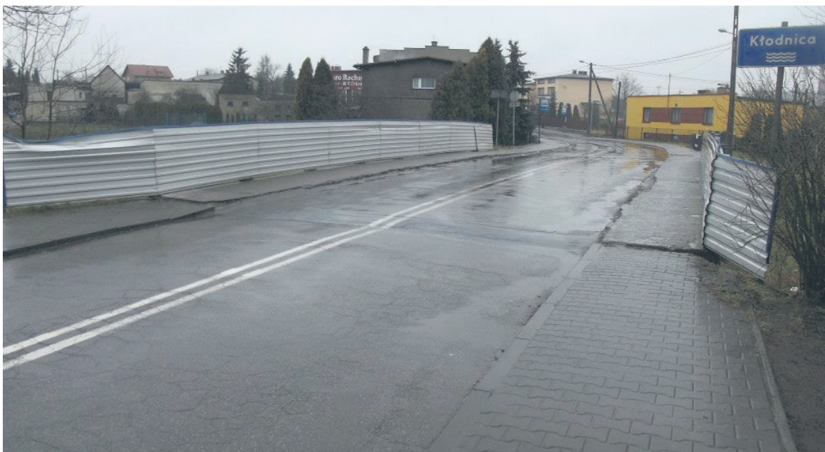
Most przy ul. Poniatowskiego był w złym stanie technicznym.

Miasto przygotowuje się też do ponownego przetargu, w którym wyłoni nowego wykonawcę mostu. Właśnie kończona jest inwentaryzacja zrealizowanych dotychczas robót. Jest ona niezbędna do opracowania dokumentacji przetargowej. Jeżeli nie wystąpią jakieś nieprzewidziane okoliczności, to wyboru wykonawcy będzie można dokonać już na przełomie września i października. Szacuje się, że na ukończenie robót potrzebne będą 3 miesiące, a to oznacza, że most może być gotowy do użytkowania na przełomie roku.