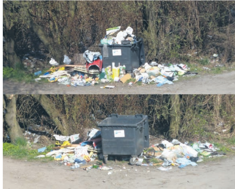
Taki był efekt sprzątnięcia kosza przy ul. Chrobrego.

Rury ciepłownicze przy ul. Solskiego w Goduli to z kolei miejsce, gdzie zmurą mieszkańców są nielegalne wysypiska. – Śmieci wyrzucają użytkownicy garaży bądź mieszkańcy dzielnicy – podjeżdżają samochodami i wyrzucają śmieci. Jest to dobre miejsce na spacer, jednak przez rosnącą stertę śmieci ładne okolice zmieniają się w śmietnik