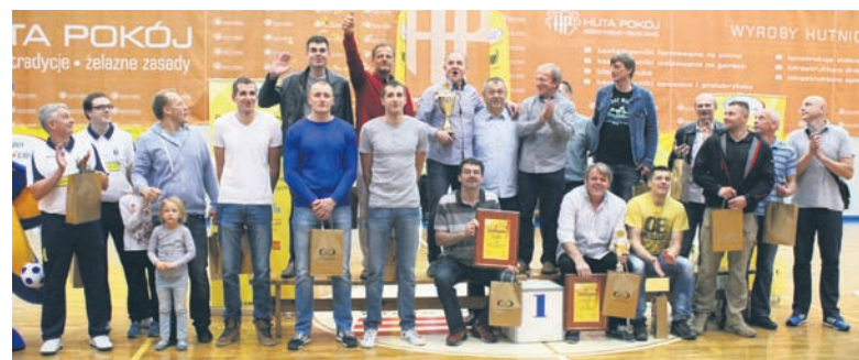
Zawodnicy po wręczeniu pucharów.