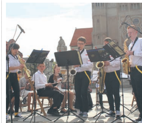
Big Sunny Band wystąpił na rynku.

Uczniowie Zespołu Szkół Muzycznych I i II stopnia w Rudzie Śląskiej podjęli kolejne wyzwanie. W piątkowe popołudnie (8.05.) zaprosili oni rudzian na występ pod hasłem „Od klasyki do jazzu”. Koncert został zorganizowany na placu Jana Pawła II w ramach Dni Otwartych Funduszy Europejskich.