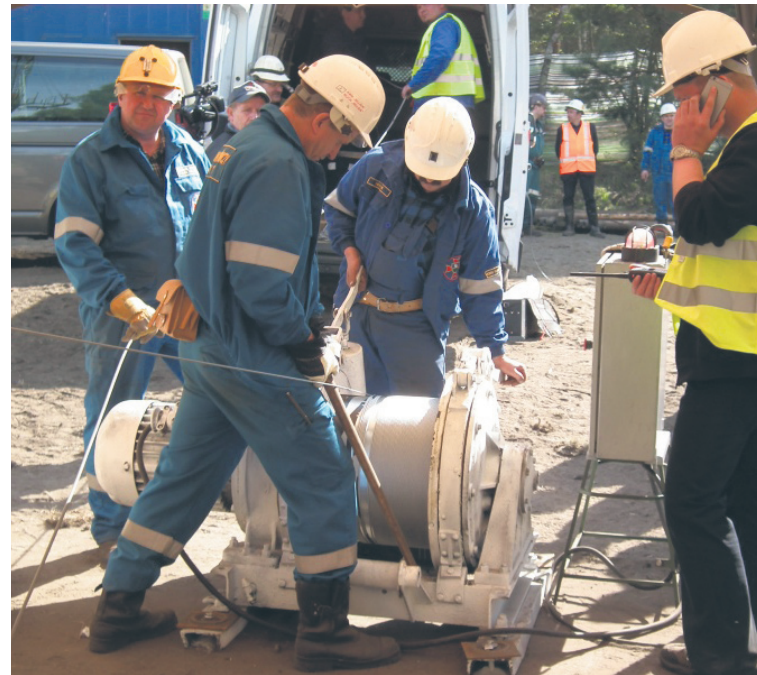
Pod ziemię opuszczono m.in. kamerę, mikrofon i głośnik.

Dalej więc drążony jest chodnik pod ziemią. To może potrwać jeszcze kilka tygodni. Bowiem wczoraj rano kombajn był na 325,5 metrze od punktu „zero”. Pozostało więc 86 metrów chodnika do przecinki „4” – kolejnego chodnika poprzecznego do jego trasy. Równocześnie prowadzone są pomiary na powierzchni – wezwania i nasłuch. Joanna Orel