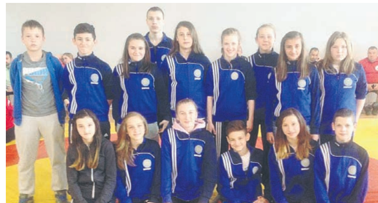
Kolejny dobry występ rudzian.

W dniach 8-9.05. w Krotoszynie rozegrany został Ogólnopolski Turniej Młodzików i Młodziczek w zapasach w stylu wolnym. W zawodach uczestniczyło 240 zawodniczek i zawodników z całego kraju. Sławię reprezentowała piętnastoosobowa ekipa – pięciu chłopców i dziesięć dziewcząt.