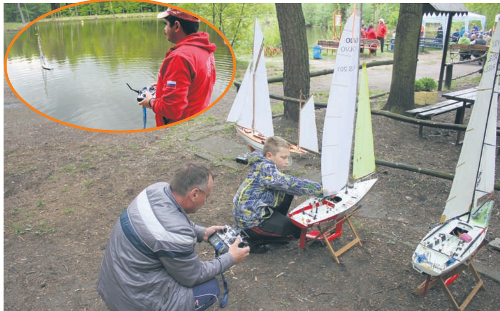
Zmaganiom towarzyszyły wielkie emocje.

Weekend w Kochłowicach zdominowali spragnieni rywalizacji modelarze. Od 8 do 10 maja odbywały się tam XXI Międzynarodowe Mistrzostwa Śląska Pływających Modeli Redukcyjnych. Małe żagłówki, statki i motorówki walczyły o miano najlepszego przy ośrodku „Przystań”.