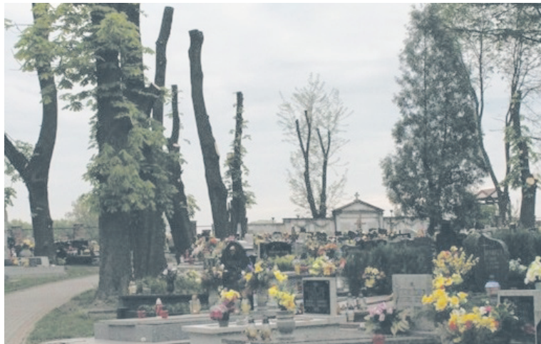
Wycinka drzew na cmentarzu w Rudzie poróżniła mieszkańców.