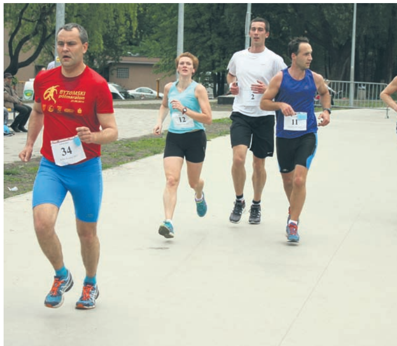
Start i meta biegu znajdowały się przy Centrum Inicjatyw Społecznych.

Kolumny sportowe zredagował Robert Połzoń