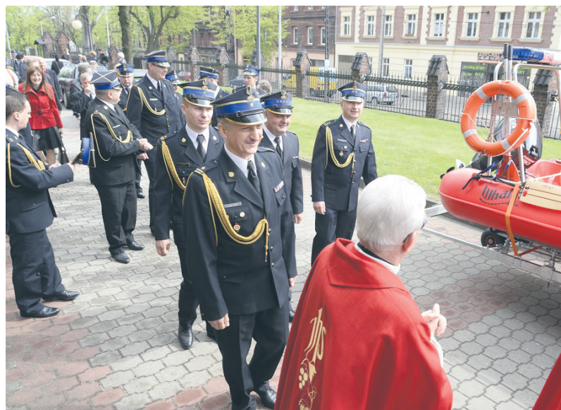
Strażacy otrzymali dwa pojazdy i łódkę.