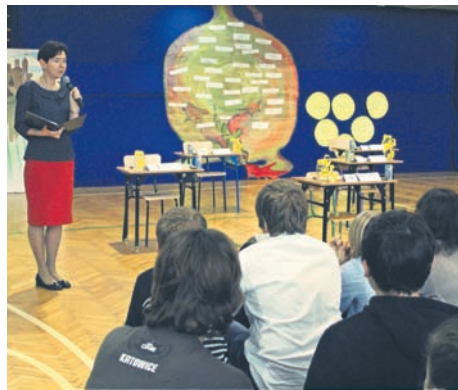
Tematyką konkursu były polskie legendy.

Ortografia to umiejętność, którą nabywa się w praktyce. Dlatego w dobie Internetu i krótkich wiadomości, została trochę zaniedbana. Jednak uczniowie z Rudy Śląskiej mają na to receptę. – Wysyłając SMS-y czy pisząc na czatach staram się nie robić błędów i stosować