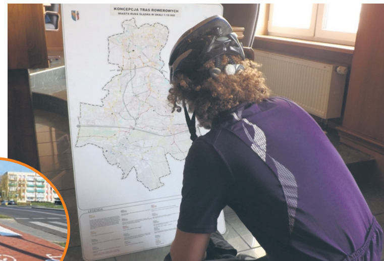
W tym roku powstaną kolejne trasy dla rowerzystów.

W związku z rozpoczynającym się sezonem rowerowym, przypominamy cyklistom o zasadach, które zapewnią im bezpieczeństwo, a zarazem pozwolą uniknąć mandatu. – Rowerem można wjechać na chodnik, tylko wtedy, gdy spełnione są trzy