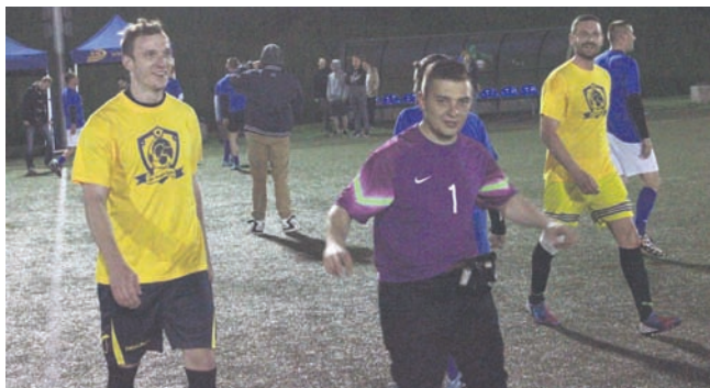
Mecz był na wysokim poziomie.

Zaraz po tym jak zakończyła się pierwsza tura wyborów prezydenckich, na nowobytomskie boisko ze sztucznym oświetleniem wbiegły drużyny Północy i Południa utwo-