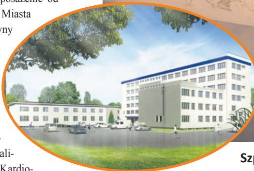
Szpital w tym roku zostanie gruntownie przebudowany.

Władze spółki chcą, by zakończenie inwestycji nastąpiło do końca listopada tego roku, a sam oddział był gotowy do uruchomienia na początku grudnia. Wszystko po to, aby móc przystąpić do kontraktowania świadczeń przez NFZ, które nastąpi najprawdopodobniej z początkiem 2016 roku. – Zgodnie z doktryną intensywnych terapii na świecie oraz w Polsce, oddziały AiIT stanowią mają m.in. bazę dla plano-