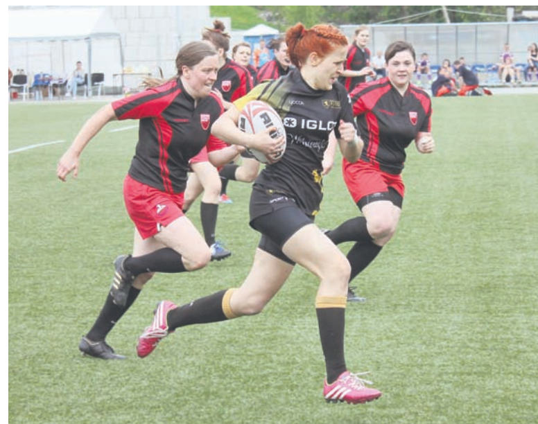
Diablice w tym turnieju łącznie zdobyły 88 punktów, straciły 43.

Turniej w Rudzie Śląskiej był przedostatnim z siedmiu decydujących o mistrzostwie kraju. Przed ostatnimi zawodami w Warszawie rudzianki, które w poprzednim sezonie zdobyły wicemistrzostwo, są na trzecim miejscu w tabeli.