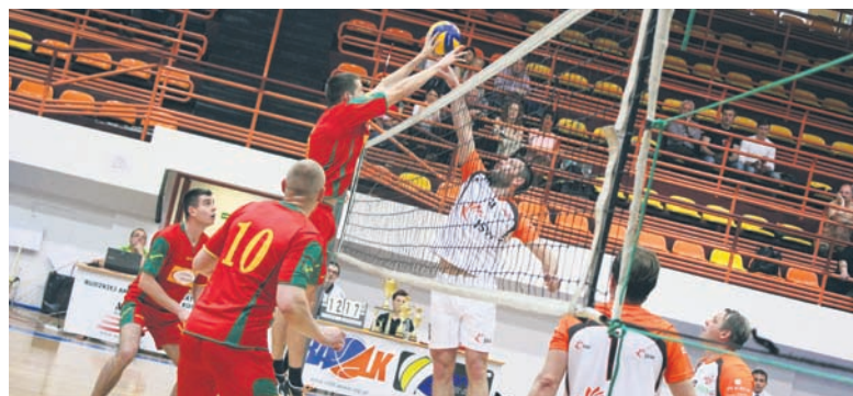
Zawodnicy zapewnili widowisko na wysokim poziomie.