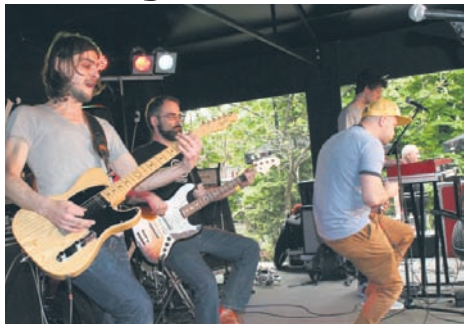
Przesłuchania odbyły się w ogrodzie MCK.

Fani Jarocińskich Rytmów Młodych zagościli w Rudzie Śląskiej. Obok Goleniowa, Warszawy, Gdańska oraz Poznania to właśnie nasze miasto w sobotę (9.05.) stało się miejscem eliminacji do muzycznego święta, jakim jest festiwal w Jarocinie. Przesłuchania odbyły się w ogrodzie Miejskiego Centrum Kultury.