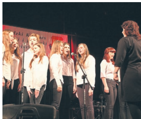
Oto uczestnicy konkursu poezji i piosenki.

To już językowa tradycja w Rudzie Śląskiej. W środę (6.05.) w Miejskim Centrum Kultury po raz kolejny wręczono nagrody laureatom XIII Rudzkiego Konkursu Poezji i Piosenki Obcojęzycznej. Wszyscy wyróżnieni oprócz tego, że popisali się ta-