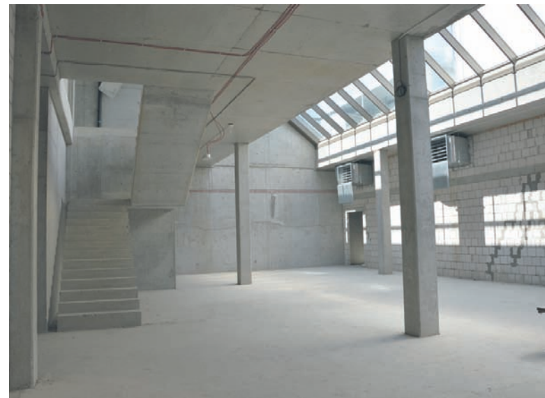
Prywatni inwestorzy chcą przejąć strefę suchą. Obecnie znajduje się ona w stanie surowym.

Budowa Aquadromu kosztowała 119 mln złotych. Obiekt w całości został wy-