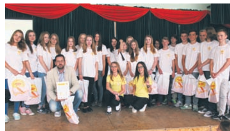
Cała klasa zmobilizowała się do akcji.