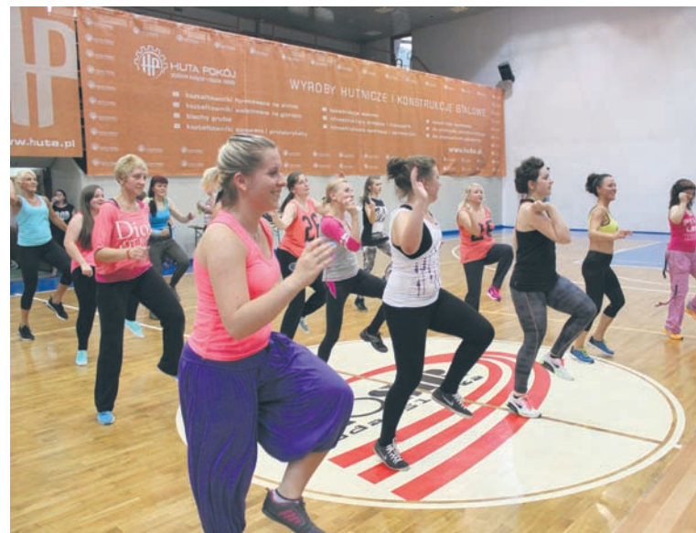
Uczestniczki maratonu nie dawały się zmęczeniu.