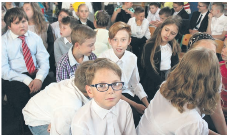
Szóstoklasiści „czwórki” już pożegnali się ze szkołą.

20 tysięcy uczniów rudzkich szkół w piątek (26.06.) zakończyło rok szkolny 2014/2015. Kształcili się oni w 70 placówkach, pod okiem prawie 2,5 tys. nauczycieli, w oddziałach sportowych, integracyjnych, dwujęzycznych, specjalnych, przysposabiających do pracy oraz w oddziale przyszpitalnym. Cała społeczność szkolna po 10 miesiącach ciężkiej pracy w końcu doczekała się letniej przerwy.