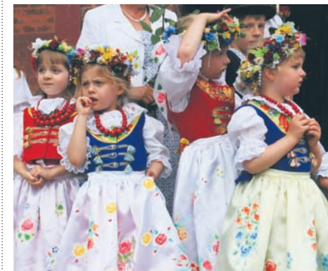
Babcie uszyły piękne śląskie stroje.

Pro Ethica działa w Bykowie już trzy lata prowadząc Centrum Pomocy i Aktywności Osób Starszych. Całoroczna praca stowarzyszenia została podsumowana w piątek (26.06.), podczas uroczystego zakończenia roku. Była śląska moda, stara fotografia, wspólna integracja, czyli kwintesencja tego, co dzieje się podczas zajęć w Centrum Inicjatyw Społecznych Stara Bykownina Miejskiej Biblioteki Publicznej.