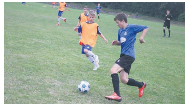
Turniej Pogoń Cup znów okazał się sporym sukcesem.

W sobotę (27.06.) zmierzyli się zawodnicy rocznika 2008, natomiast niedzielny poranek upłynął pod znakiem rozgrywek rocznika 2006. Turniej zakończył się rozgrywkami rocznika 2002.