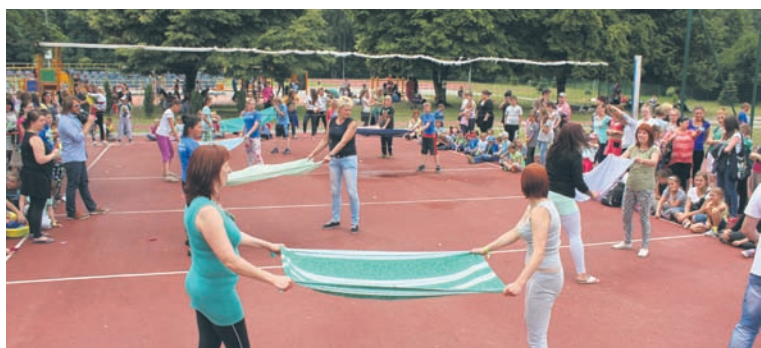
Uczestnicy Świetlandii m.in. rywalizowali, ale i bawili się na boisku.

W naszym mieście to już tradycja. Do tego bardzo piękna. W minioną sobotę (27.06.) przy Szkole Podstawowej nr 15 na Halembie odbyła się 13. edycja Świetlandii – imprezy rudzkich placówek opiekuńczo-wychowawczych.