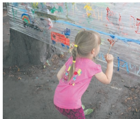
Dzieci świetnie bawiły się w ogrodzie MCK.

Podczas kolejnego Ogrodu śniadaniowego – w sobotę, 4 lipca w godzinach od 11 do 13 przy MCK także