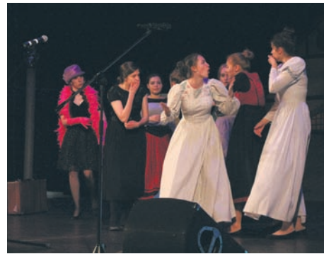
Młodzież świetnie prezentowała się na scenie.

– Od wielu lat mieliśmy potrzebę nagrodzenia tych, którzy robią dla nas coś dobrego. Rodziców, którzy czynnie wspierają naszą działalność oraz przedstawicieli instytucji, którzy bezinteresownie nam pomagają