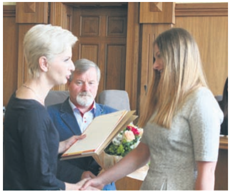
Radni zakończyli w środę (24.06.) swoje działania.

To dla nich start na samorządowej arenie. Ale jakże udany start! Członkowie Młodzieżowej Rady Miasta Ruda Śląska podsumowali dwuletnią kadencję działalności.