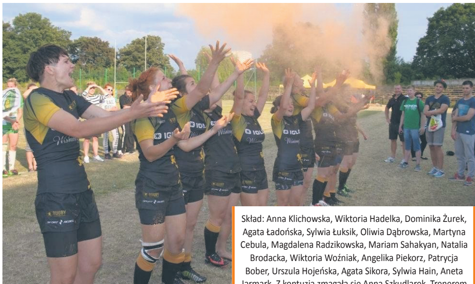
To kolejny sukces rudzkich rugbysek.

Diablice po raz kolejny potwierdziły swoją przynależność do krajowej czołówki. Przypomnijmy, że zdobyły czwarty raz z rzędu medal mistrzostw Polski. W 2012 r. był to medal brązowy, w 2013 r. i 2014 r. srebrne, teraz ponownie brązowy.