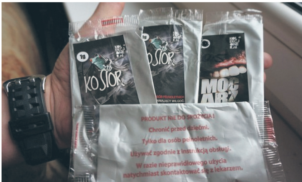
Handel dopalaczami jest zakazany.

Obecnie mamy sezon letni, jednak staramy się odwiedzać wszystkie półkolonie dla dzieci i młodzieży, by przekazywać wiedzę na temat zagrożenia związanego ze stosowaniem dopalaczy. Staramy się także włączać w większe imprezy na terenie Rudy Śląskiej. Mamy nadzieję, że kampania, którą przygotowujemy wspólnie z miastem i rudzkimi służbami, przyniesie zamierzone efekty.