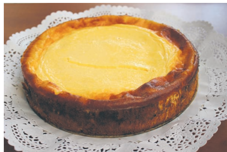
Smak lipca to lekki „Sernik Edyty”.

Przygotowanie: paprykę i cebulę pokroić w drobną kostkę, wymieszać, posolić i odstawić na 8 godzin. Wszystkie składniki sosu zagotować. Do gotującego się sosu wrzucić osączoną na sicie paprykę z cebulą. Całość gotować 10 minut, gorące prze-