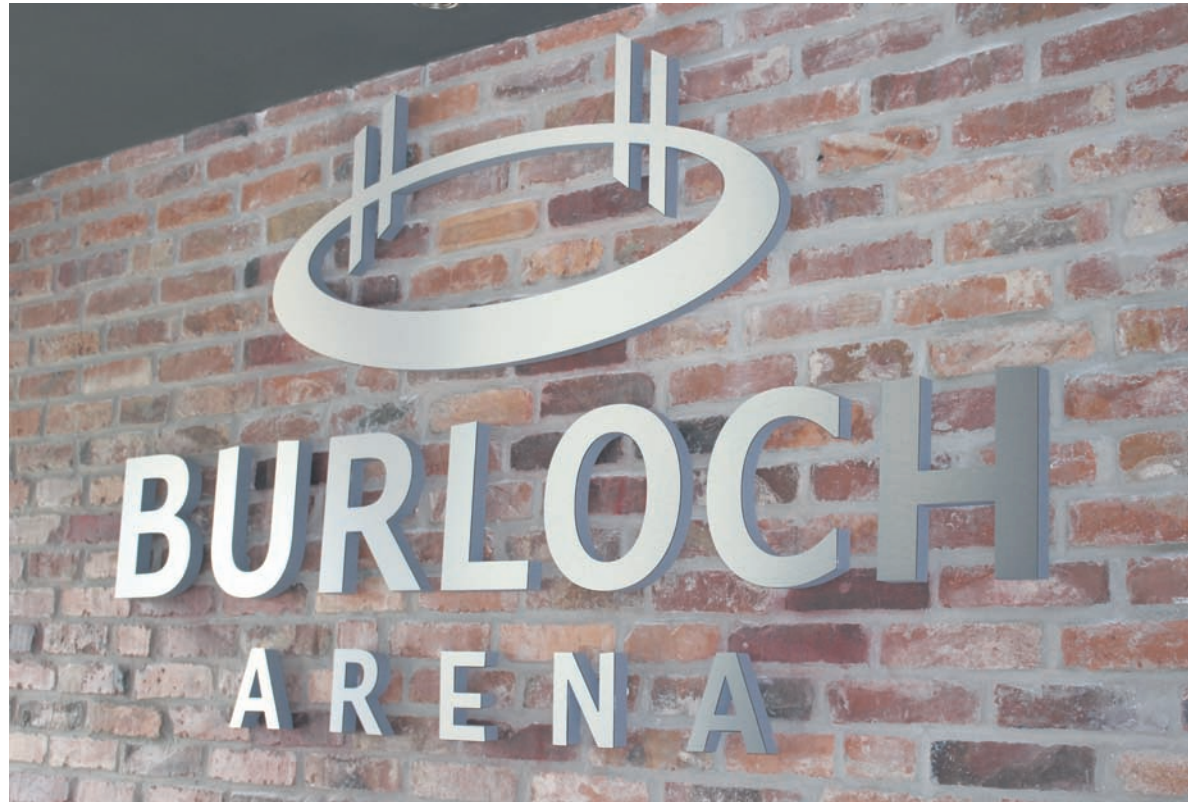
Z końcem czerwca zakończono drugi etap rewitalizacji ośrodka.

Burloch Arena to obiekt, który o każdej porze tętni życiem. Miejsce to chętnie odwiedzane jest przez mieszkańców miasta, jak i przyjezdnych. Pierwszy etap rewitalizacji ośrodka, który zakończył się w pierwszej połowie 2014 roku, kosztował 4,5 mln zł. Dzięki niemu w Rudzie Śląskiej powstało jedno z najlepszych w Polsce boisk do gry w rugby oraz unikatowy tor do jazdy na rolkach. Na przyszłe lata planowana jest dalsza rewitalizacja ośrodka. – W zależności od posiadanych środków chcemy kontynuować rewitalizację obiektu – podkreśla prezydent Dziedzic. Całość dokumentacji obejmuje jeszcze m.in. budowę skateparku, toru saneczkowego, trasy rowerowej oraz budynku gastronomicznego.