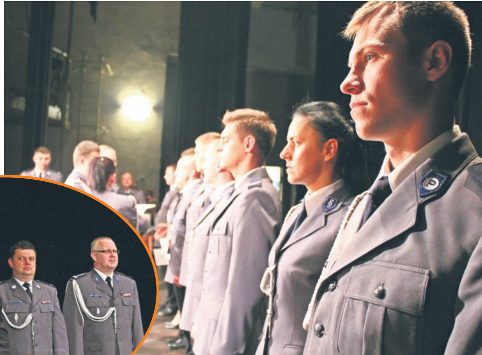
Policjanci odebrali zasłużone honory.