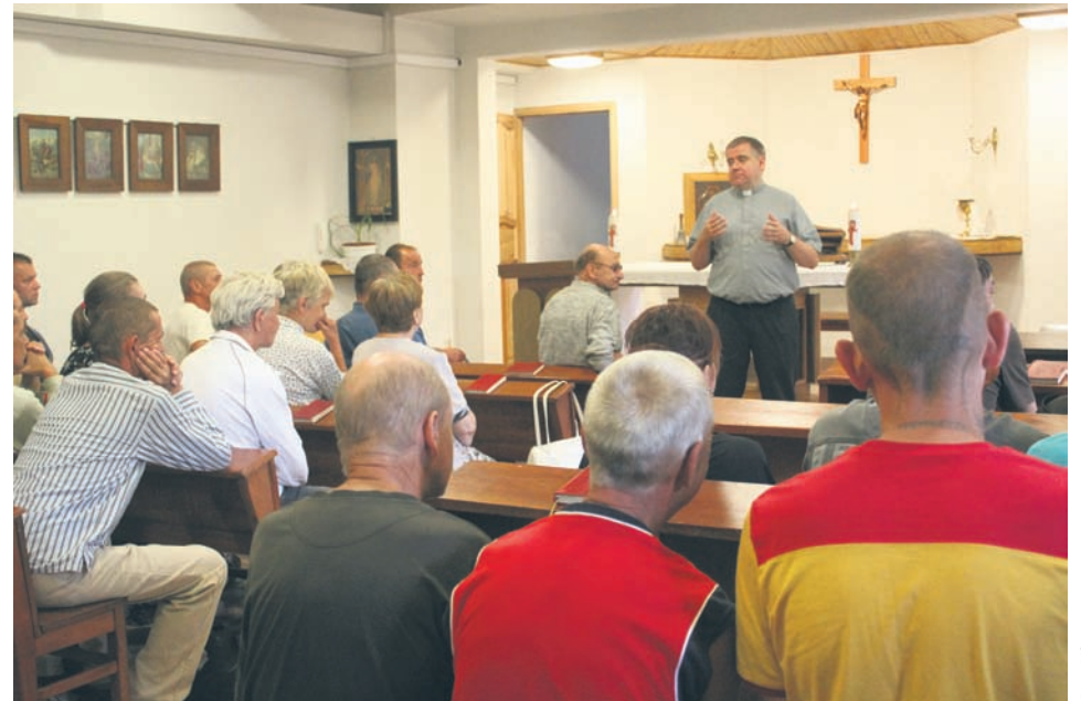
Ubodzy i bezdomni spotykają się co niedzielę na mszy świętej.

W każdą niedzielę w krypcie kościoła św. A. Boboli o godzinie 12 odprawiana jest msza święta dla osób ubogich, bezdomnych i tych co się źle mają przez uzależnienia i inne życiowe nieszczęścia. Przychodzi 50-70 osób, biorąc czynny udział: czytają, śpiewają, dają świadectwa, zawsze kilka osób idzie do spowiedzi. Później jest niedzielny obiad oraz rozmowy na życiowe tematy. Nikt nie jest tu oceniany, każdy może się zwierzyć, podzielić smutkami i radościami. Ubodzy