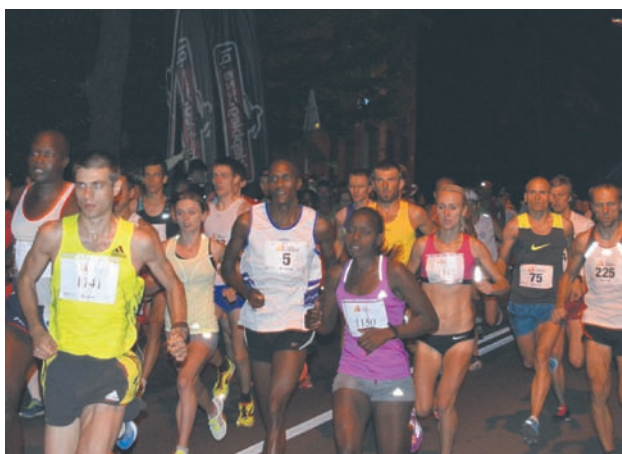
W półmaratonie wystartowały 844 osoby.