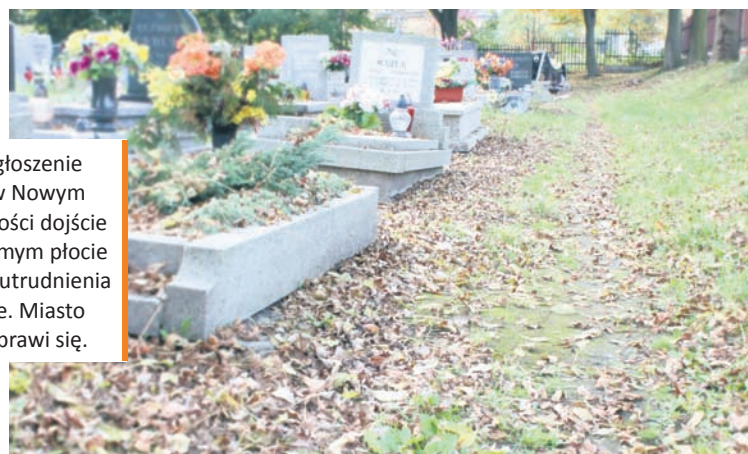
Stan cmentarnych drózek nie uległ poprawie.