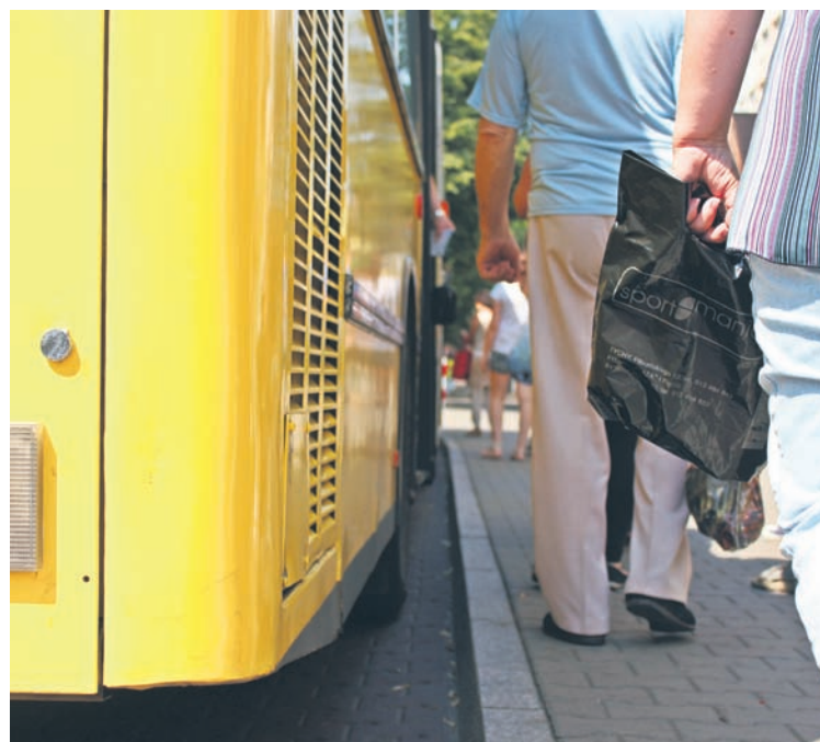
Dobrze zaparkowany autobus to duże udogodnienie dla starszych.