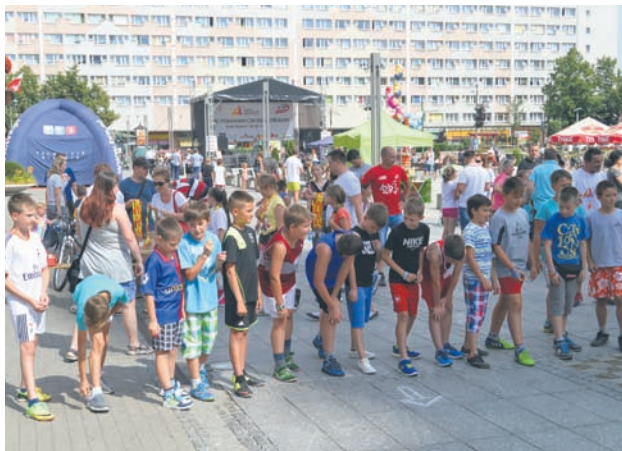
W ramach półmaratonu odbyły się biegi dla dzieci.