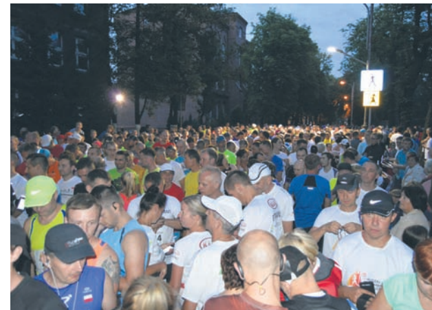
Zawodnicy na kilka minut przed startem.