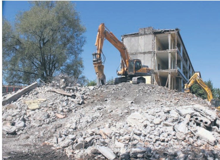
Pod koniec lipca rozpoczęła się rozbiórka budynku dawnej szkoły.

Co planuje nowy inwestor, czyli firma handlowa Frapo-Invest z Konina, która kupiła budynek za 1,5 mln zł? Wiemy jedno – zrezygnowano z adaptacji dawnego budynku szkoły na potrzeby hotelu. W ślad za tym pod koniec lipca przy ul. Kłodnickiej 91 na mocy pozwolenia wydanego 2 lipca przez rudzkich urzędników pojawiły się ekipy budowlane i rozpoczęła się sukcesywna rozbiórka obiektu.