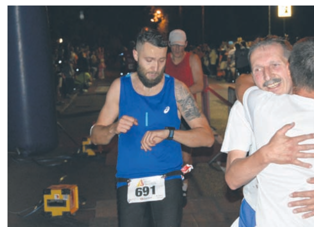
Zawodnicy kontrolowali tempo i czas.