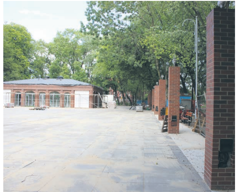
Cukiernio-kawiarnia będzie nawiązywać architekturą i detalami elewacyjnymi do kręgielni, która niegdyś funkcjonowała w parku.