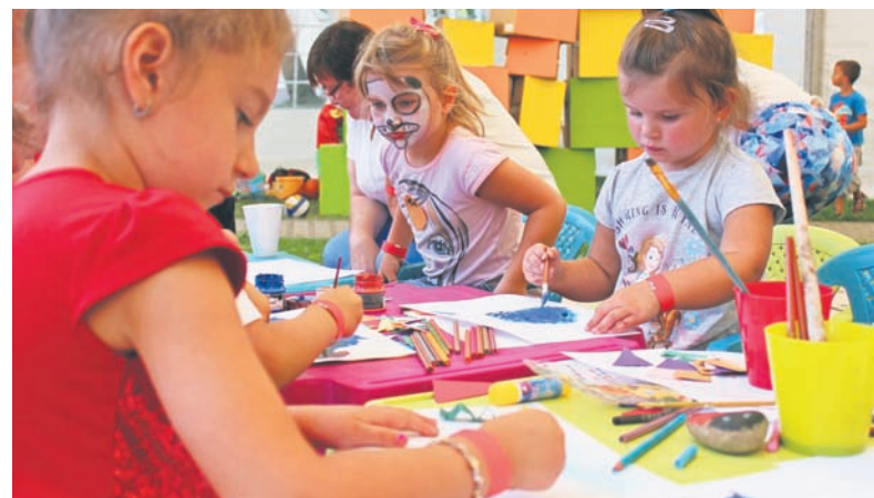
Na festyn przybyli pracownicy firmy wraz z całym rodzinami.