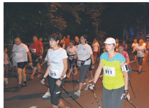
Nordic walking cieszył się dużym zainteresowaniem.