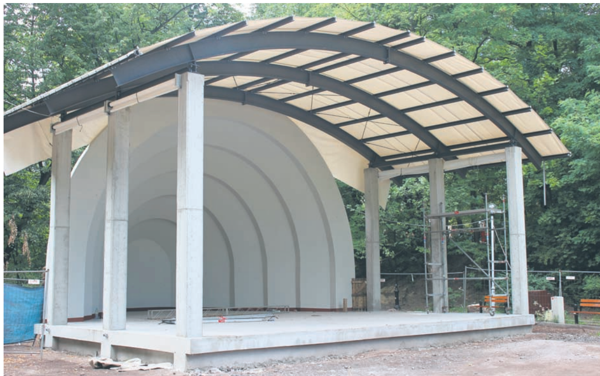
Specjalne zadaszenie muszli koncertowej pozwoli organizować imprezy niezależnie od pogody.