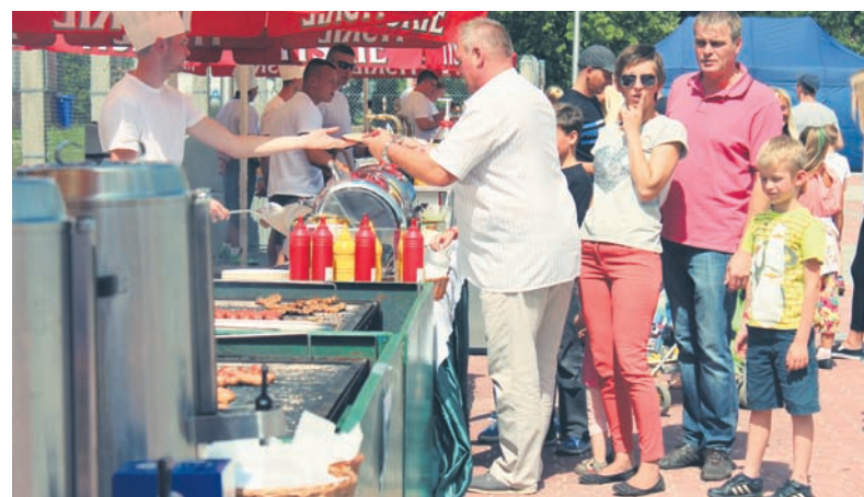
Podczas imprezy zapewniono nie tylko różnorodną rozrywkę, ale również atrakcje gastronomiczne.