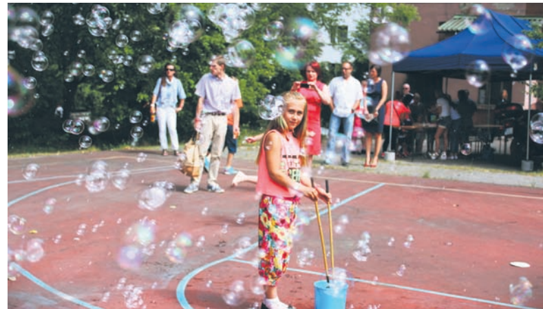
Ogromne bańki mydlane cieszyły się dużym zainteresowaniem wśród najmłodszych.