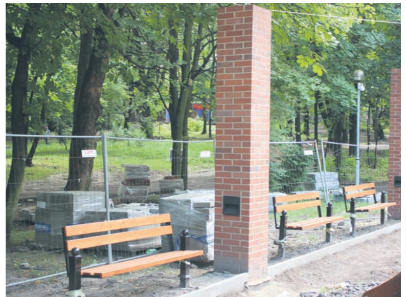
W parku ustawiane są już ławki.