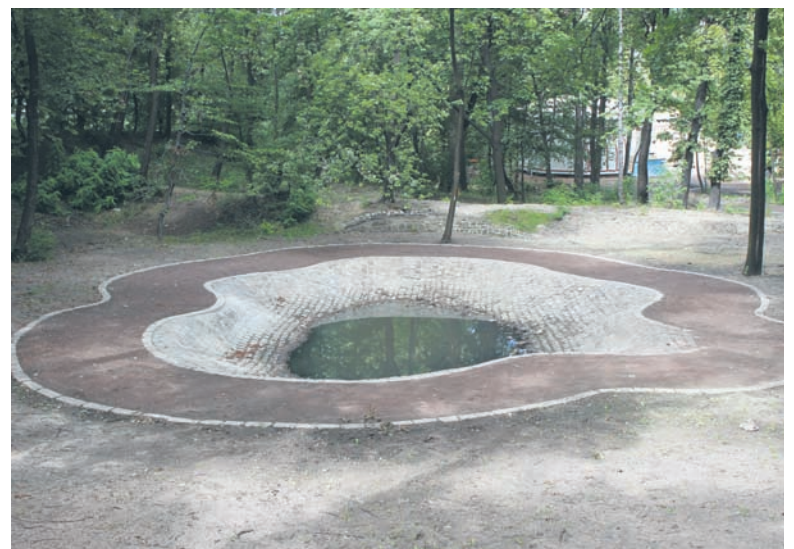
Oczko wodne jest już prawie gotowe.