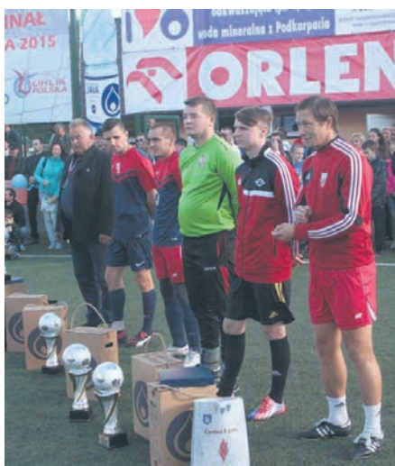
Ogromny sukces ZZRG Bielszowice.

ZZRG Bielszowice najlepszą amatorską drużyną w Polsce! Drużyna z Rudy Śląskiej brała udział w Turnieju Amatorskich Lig Orlik, który odbył się w gminie Łąck w dniach 26-27.09. Zawodnicy ZZRG Bielszowice pokonali wszystkich rywali, a w wielkim finale nie dali szans drużynie Albatrosa Ząbki. Warto zaznaczyć, że zawodnicy tej drużyny na co dzień grają w Lidze Rudzkich Orlików, której organizatorem jest MOSiR Ruda Śląska, a ich zwycięstwo cieszy tym bardziej, że potwierdza wysoki poziom sportowy naszej ligi. Serdecznie gratulujemy i życzymy dalszych sukcesów!