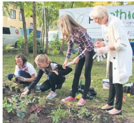
Na rabatce sadzono kwiaty, maliny i poziomki.

Projekt ma przekonać mieszkańców Bykowny, że zamiast narzekać na „nieposprzątane, niezagospodarowane, nieodśnieżone”, można się zintegrować, zadbać o okolicę przy współpracy z samorządem i zarządcami budynków, którzy mają wiele dobrej woli i możliwości. Kolejna okazja do wspólnego tworzenia ogrodu