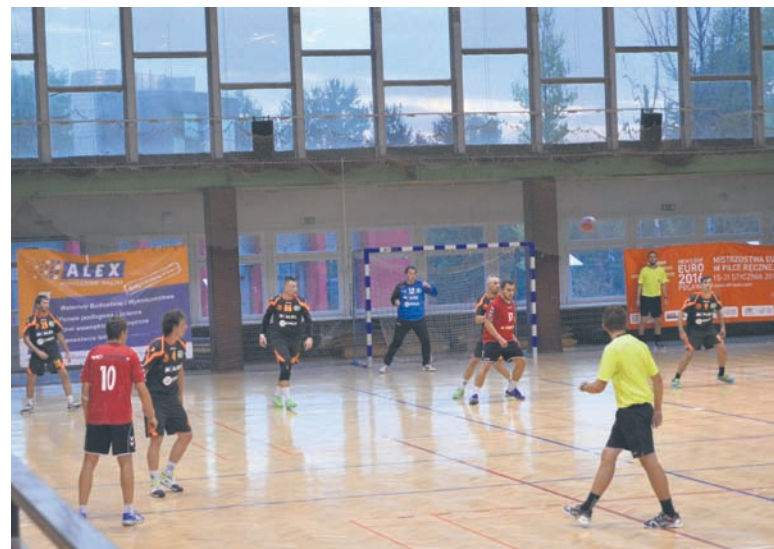
Na boisku widoczna była różnica klas.

SPR Grunwald Ruda Śląska po raz pierwszy w tym sezonie zaprezentował się przed własną publicznością i występ moż- na zaliczyć do bardzo udanych. W drugim swoim ligowym meczu podopieczni trene- ra Kąpy zaaplikowali rywalom z Przewor- ska 37 bramek tracąc jedynie 17. Zwycię- stwo mogło być jeszcze bardziej okazałe, ale gospodarze zmarnowali trzy rzuty kar- ne oraz kilka dogodnych sytuacji. Cieszy z pewnością dobra gra w obronie. Halemb- ianie po raz drugi nie stracili więcej niż 20 bramek w meczu, a to świadczy o do- brej grze w defensywie. Tylko na początku spotkania goście toczyli wyrównany poje- dynek z Grunwaldem, ale po 10 minutach zaznaczyła się kilkubramkowa przewaga, którą gospodarze z każdą minutą powięk-