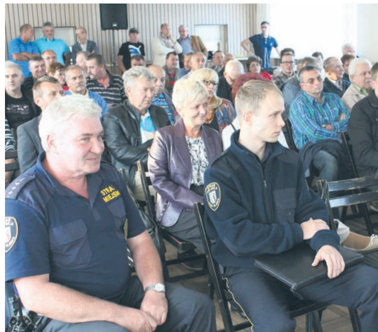
Drugie spotkanie w tej turze odbyło się w Bykowninie.