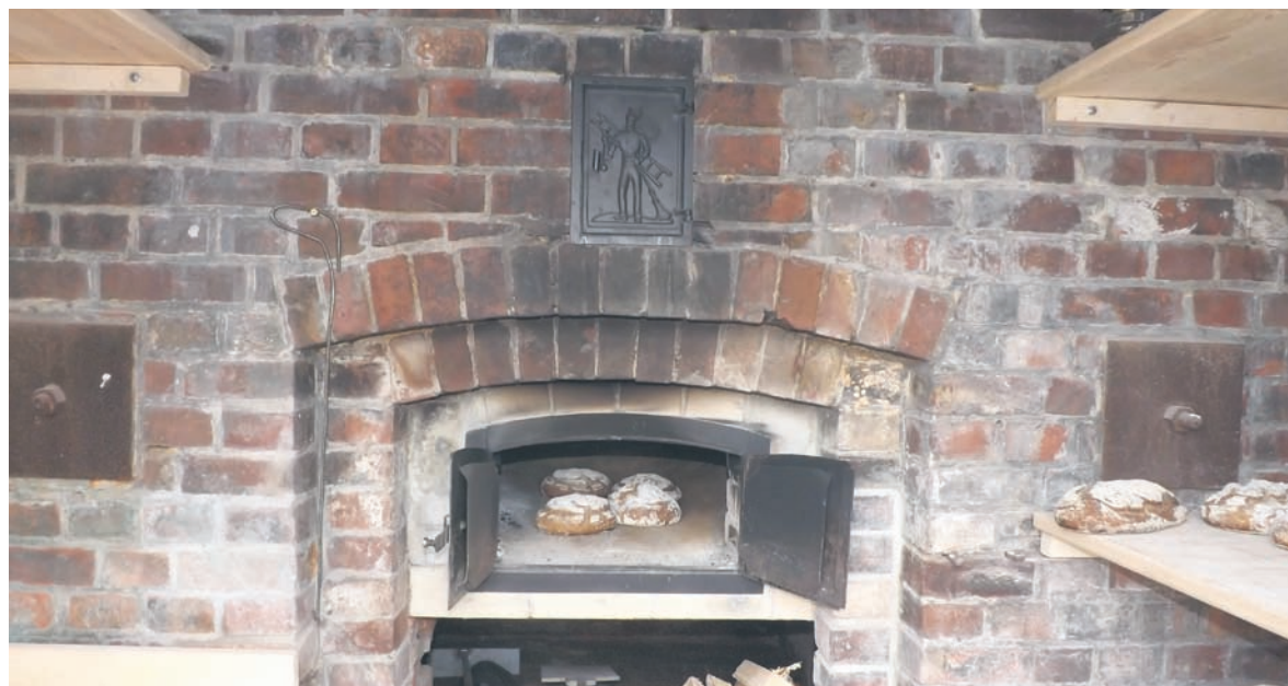
8 października rudziania powitają jesień przy piekaroku.

Kilka razy w roku rudzki magistrat wraz z piekarnią „Jakubiec” – opiekunem piekaroka – organizuje spotkania, na których można częstować się