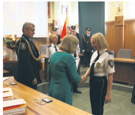
Strażnicy miejscy obchodzili swoje święto.

Straż Miejska w Rudzie Śląskiej powstała w 1991 roku. Od tego czasu liczba zadań, które leżą w kompetencji strażników, wciąż rośnie. – Jedną z naszych ostatnich akcji to znakowanie rowerów. Tylko pierwszego dnia wzięło w niej udział 50 osób. Nie jesteśmy tylko od wręczania mandatów. Wbrew obiegowej opi-