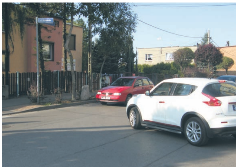
Na skrzyżowaniu widoczność jest mocno ograniczona.