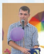
prowadzenie: Arkadiusz Wieczorek

Restauracja Wawelska Ruda Śląska - Ruda ul. Raciborska 14