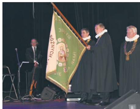
Rudzki cech otrzymał złotą odznakę.