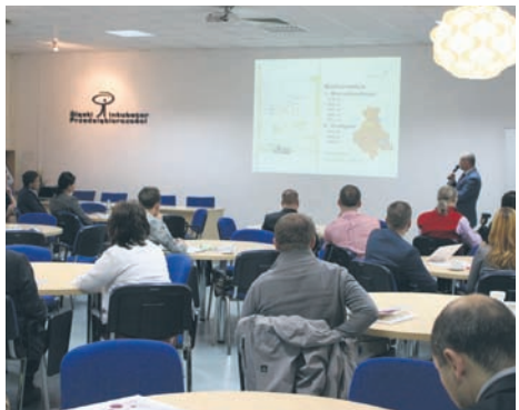
Spotkaniu towarzyszyła debata nt. budownictwa.

W Śląskim Inkubatorze Przedsiębiorczości odbyło się kolejne spotkanie biznesowe, którego założeniem jest nawiązanie kontaktów różnych środowisk biznesowo-społecznych. Wiodącym tematem spotkania było budownictwo mieszkaniowe. Mówiono m.in. o bonifikatach przy budowie domku jednorodzinne w Rudzie Śląskiej.