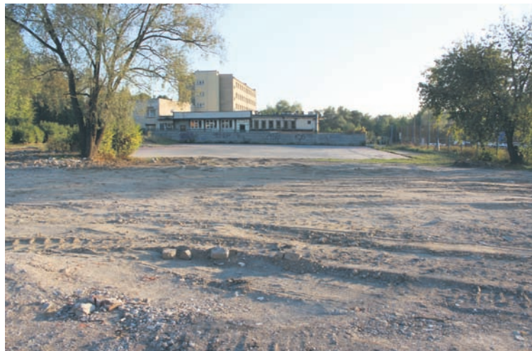
Tak wygląda teren po rozbiórce szkoły.

Miejscy urzędnicy twierdzą, że inwestor wstępnie wyraził gotowość wykonania wielofunkcyjnego boiska