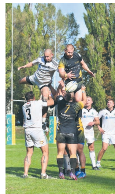
Na boisku nie brakowało emocji.

Drugi zespół Gryfów, złożony niemalże w całości z wchodzących do seniorskiej kadry zawodników, wziął udział w turnieju rugby 7 w Bytomiu.