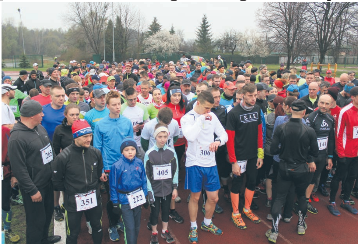
Bieg wiewiórki przyciągnął wiele osób.

Niektórzy startujący podczas biegu wiewiórki przygotowują się do Rudzkiego Półmaratonu. Już za ponad 120 dni pasjonaci biegu po raz kolejny licznie stawią się na starcie II Rudzkiego Półmaratonu Industrialnego. Już teraz trwają bezpłatne treningi biegowe oraz rozpoczynają się zajęcia z nordic walking. Więcej o nadchodzącej imprezie mogliśmy dowiedzieć się podczas konferencji prasowej zorganizowanej na Burloch Arenie. – Cieszę się, że pierwszy półmaraton odniósł taki sukces, że jest tak duże zainteresowanie kolejną edycją. Treningi biegowe do maratonu trwają już od początku lutego. Po frekwencji widać, że coraz więcej osób chce