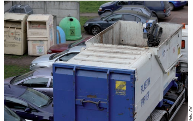
Pojemniki muszą stać w miejscach ułatwiających ich opróżnianie.

– Pojemniki na odpady segregowane ustawiane są na terenie placyków gospodarczych lub w bliskim ich sąsiedztwie w miejscach ogólnodostępnych zarówno dla mieszkańców, jak również w miejscu umożliwiającym bezproblemowe opróżnianie pojemników przez przedsiębiorcę odbierającego odpady komunalne w naszym mieście – tłumaczy