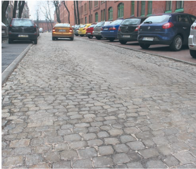
Na razie bruk odkryto na jednym odcinku.