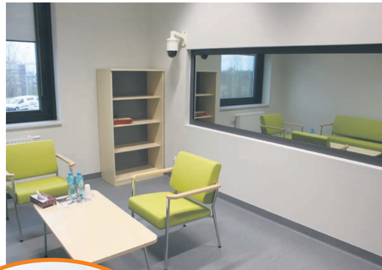
W jednej z sal przesłuchań umieszczono tzw. lustro fenickie.

Dzięki temu za ok. 50 mln zł (inwestycja sfinansowana została przez Ministerstwo Sprawiedliwości) powstał budynek o powierzchni 6,5 tys. m kw. – W starym