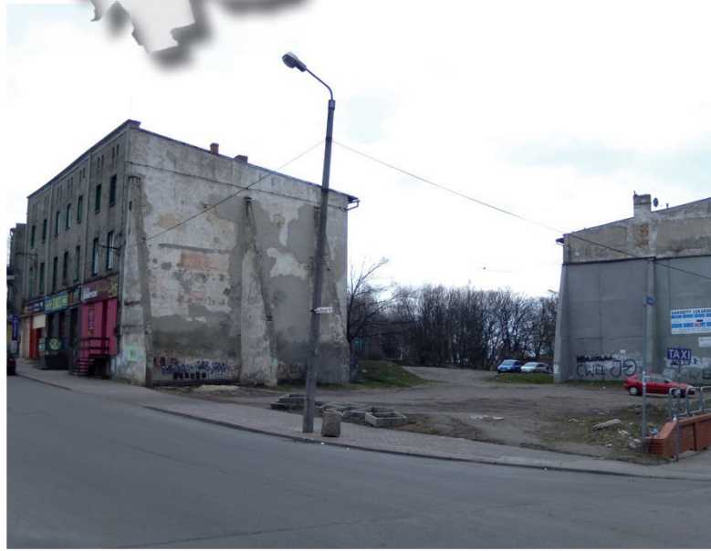
Mural ma powstać na ścianach budynków przy ul. Tuwima 8 i Sienkiewicza 3 w Wirku.