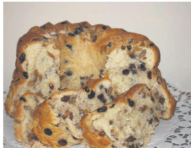
Konkurs kulinarny „Rudzkie Smaki” trwa. W kwietniu można przysłać przepisy na potrawy z kartofli.

Przygotowanie: Drożdże utrzeć z cukrem, rozprowadzić ciepłym mlekiem. Odstawić na 10 minut. Mąkę przesiać do miski, dodać sól, jajka i rozczyn drożdżowy. Wyrabiać gładkie ciasto dodając stopniowo ostudzone masło. Można wyrabiać ręcznie lub mikserem z hakiem. Odstawić w ciepłe miejsce do wyrośnięcia na około 1 – 1,5 godziny. Ponownie wyrobić dodając bakalie.