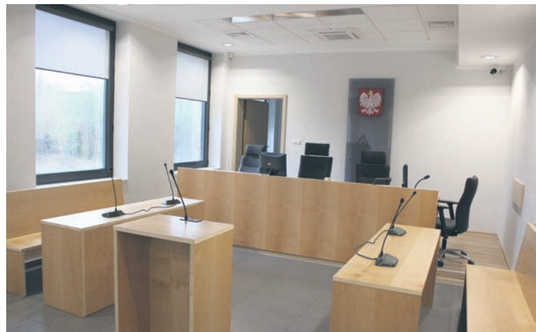
W obiekcie utworzono 16 sal rozpraw.