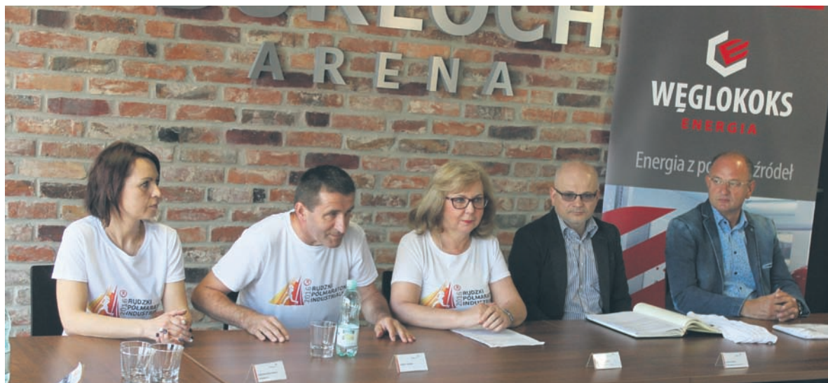
Konferencja przed półmaratonem.

II Rudzki Półmaraton Industrialny odbędzie się 6 sierpnia o godz. 21.00. Oprócz dystansu półmaratonu, na którym odbędzie się główna rywalizacja biegaczy, zawodnicy wystartują na dystansie 7 km oraz w rywalizacji nordic walking. Trasa biegu została poprowadzona na siedmiokilometrowej pętli.