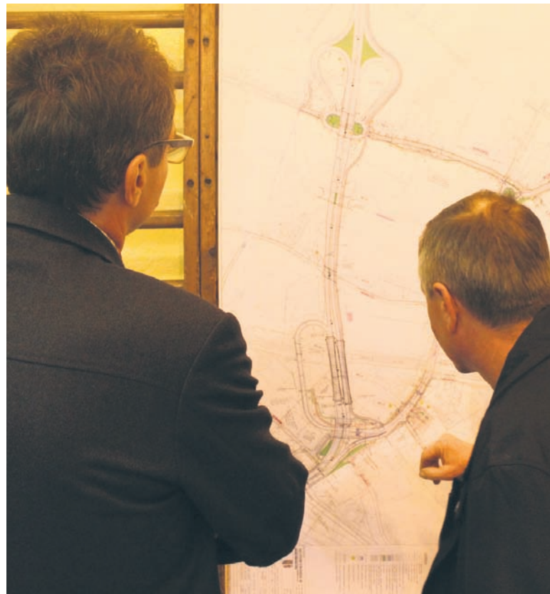
Mieszkańcy zapoznali się z planem trasy N-S.

Trasa N-S została zaprojektowana jako droga o prędkości projektowej 70 km/godz. Na całej odległości posiadać będzie dwie jezdnie o szerokości 7 m z pasem dzielącym o szerokości 4 metrów. W 2013 roku otwarto pierwszy odcinek trasy – od ul. 1 Maja do DTŚ. Obecnie budowany fragment będzie prowadził od ul. 1 Maja do ul. Bukowej. W ramach inwestycji powstanie także węzeł dwupoziomowy i odcinek drogi od ul. Bukowej, która zostanie przedłużona do ul. Ks. Niedzieli.