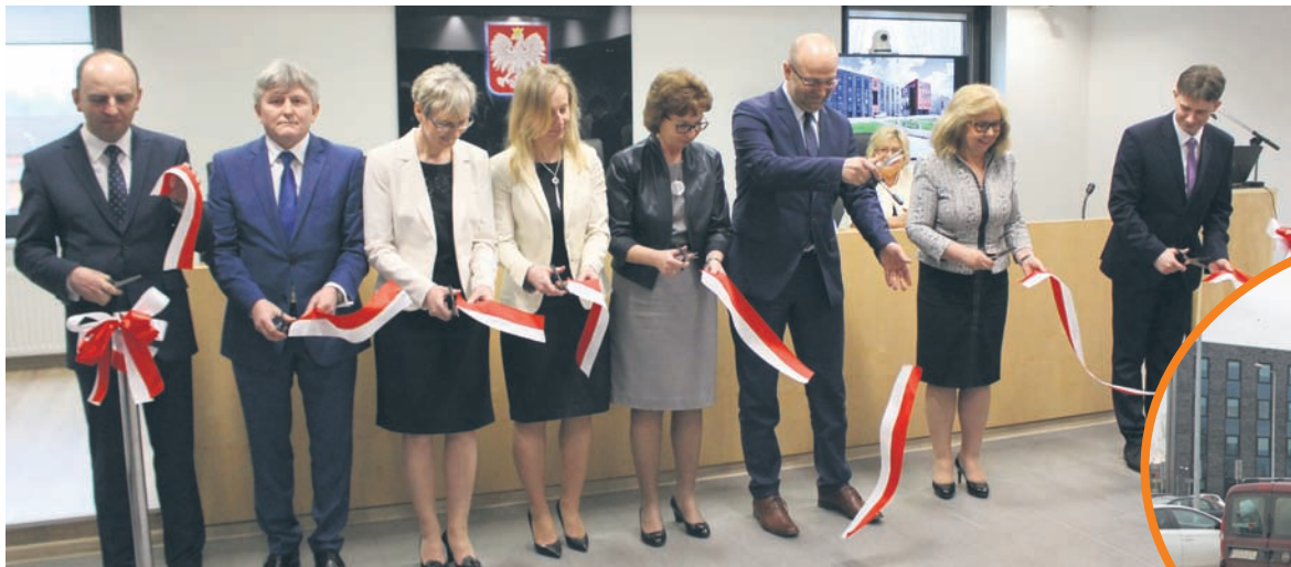
Nowy budynek Sądu Rejonowego oficjalnie został otwarty 6 kwietnia.

16 nowoczesnych sal rozpraw, ponad 200 miejsc parkingowych, sala obsługi interesanta i tzw. przyjazny pokój przesłuchań, a przede wszystkim – ponad dwukrotnie większy budynek. Sąd Rejonowy w Rudzie Śląskiej na dobre przeniósł się do nowej siedziby na Czarnym Lesie. Jego pracownicy, a zarazem także i mieszkańcy, zyskali dzięki temu nowe warunki. A to tym bardziej istotne, że rocznie w rudzkim sądzie rozpatrywanych jest ponad 40 tys. spraw.