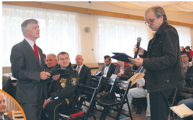
Spotkania to okazja do rozmów z mieszkańcami.