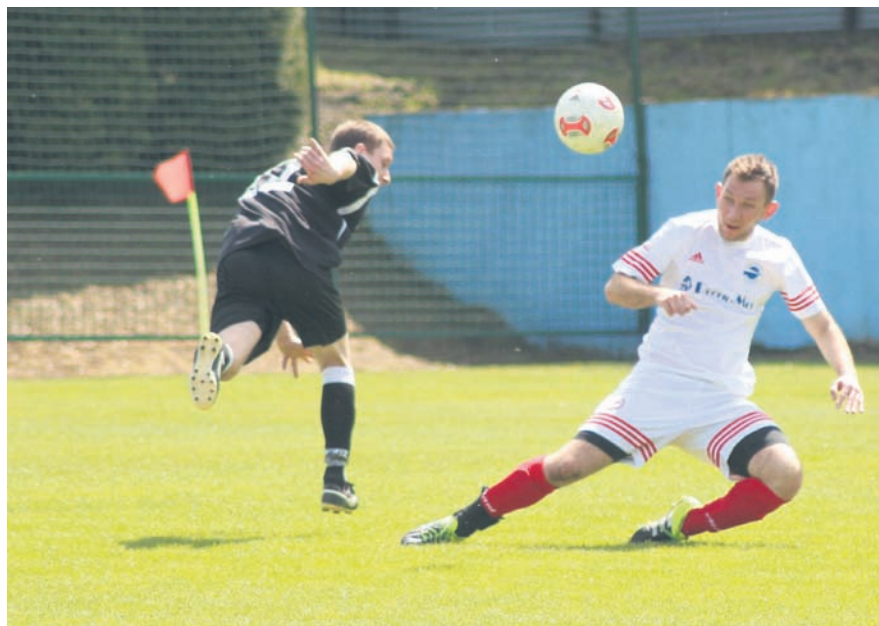
Urania zasłużyła na zwycięstwo.

URANIA RUDA ŚLĄSKA 3:0 (2:0) WAWEL WIREK