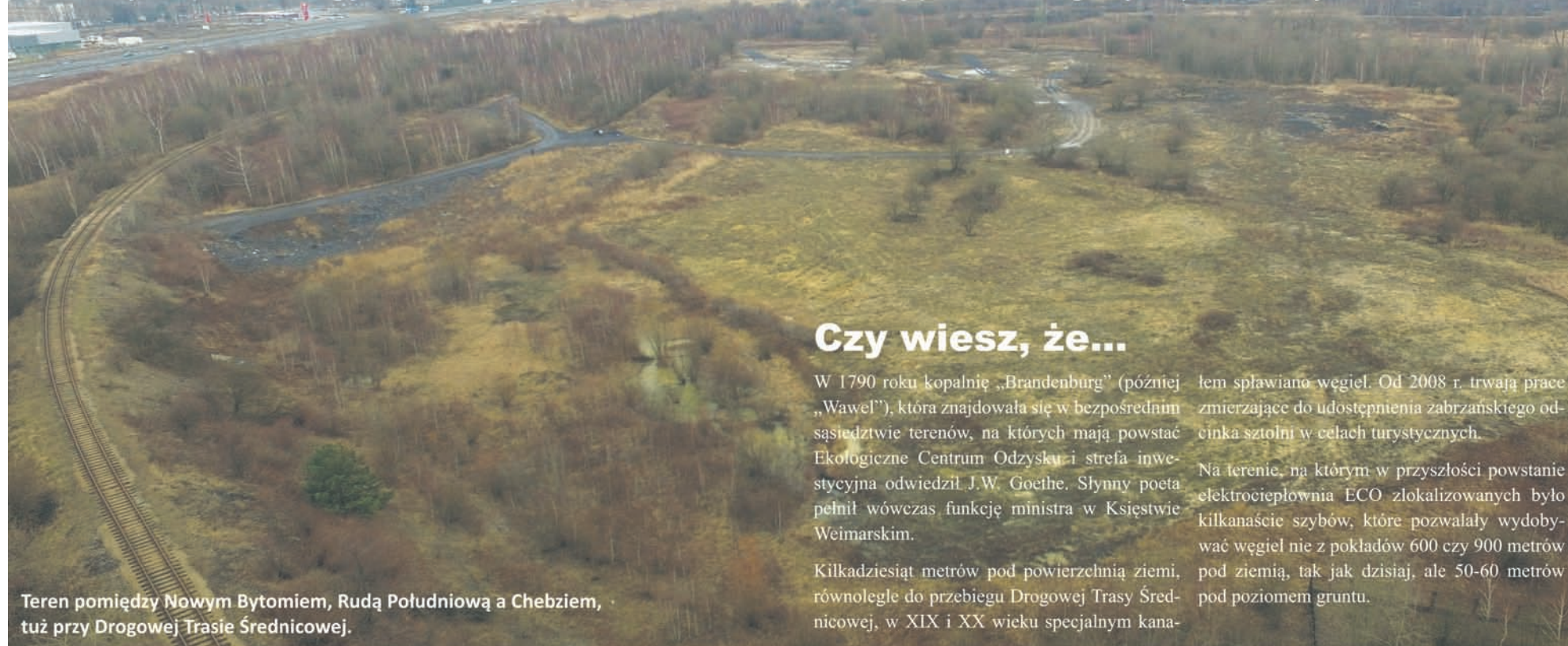
Teren pomiędzy Nowym Bytomiem, Rudą Południową a Chebziem, tuż przy Drogowej Trasie Średnicowej.

Ekologiczna elektrociepłownia, tereny inwestycyjne dla zaawansowanych technologicznie firm i strefa dla mieszkańców – to plany, które w najbliższych latach mogą zostać zrealizowane przez ENERIS na nieużytkach leżących wzdłuż Drogowej Trasy Średnicowej.