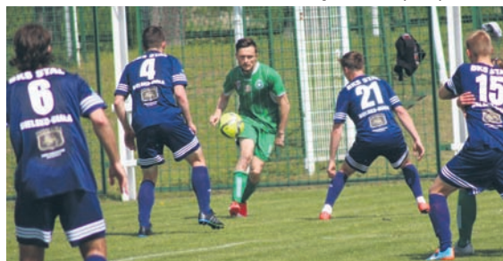
Piłkarze Grunwaldu znów odnotowali porażkę.

GRUNWALD RUDA ŚLĄSKA 0:2 (0:1) BKS STAL BIELSKO-BIAŁA