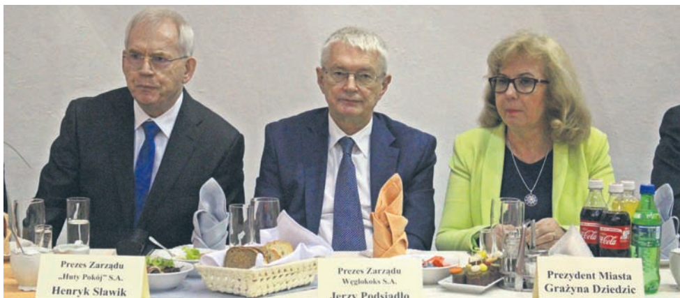
Wyróżnieni odznaką „Zasłużony Pracownik HUTY POKÓJ”.