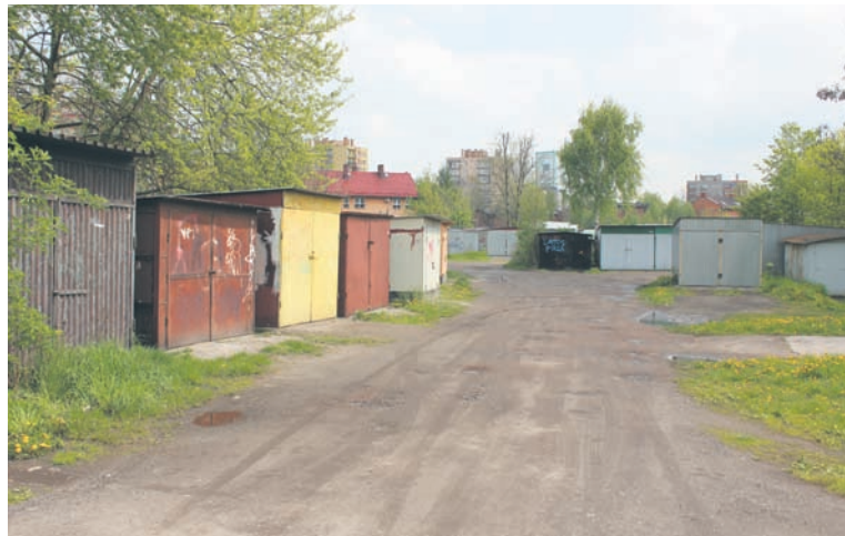
W tym miejscu powstanie ok. 200 nowych garaży.

Inwestycja ta ma obejmować przebudowę 224 garaży, a ponadto w projekcie przebudowy zaplanowano budowę zjazdów z drogi publicznej i parkingów przy ulicy Juliusza Słowackiego, stworzenie nowego oświetlenia kompleksu oraz uporządkowanie pobliskich terenów zie-