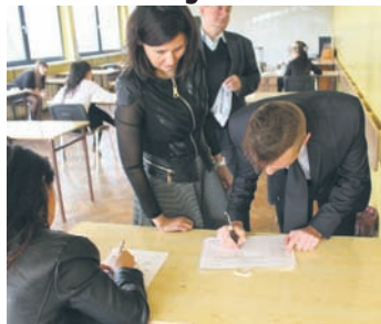
Maturę zdaje ok. 650 rudzian.

Pierwszy etap egzaminów dojrzałości już za nimi. W minionym tygodniu uczniowie klas maturalnych zdawali obowiązkowe matury z języka polskiego, matematyki oraz z języka obcego. Teraz przyszedł czas na przedmioty dodatkowe. W sumie w naszym mieście maturę zdaje ok. 650 uczniów.