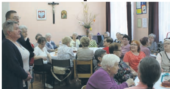
Członkowie Związku Niewidomych podsumowali działalność.

Pod hasłem „W służbie pokoleniom” Polski Związek Niewidomych koło Ruda Śląska świętowało 65-lecie istnienia organizacji. Z tej okazji członkowie koła spotkali się w swojej siedzibie. Zebranie było okazją do zaprezentowania odnowionej świetlicy i wyremontowanego zaplecza kuchennego, które służy podczas cyklicznych spotkań. Okazją do świętowania w Rudzie Śląskiej była podwójna, bowiem obchody 65-lecia zbiegły się z rocznicą powołania obecnego zarządu rudzkiej organizacji. Podczas spotkania podsumowano także wydarzenia z ostatnich tygodni, których