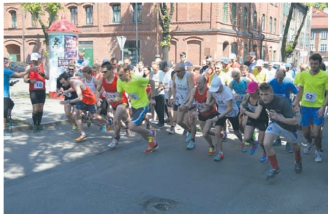
Podczas bieganina każdy świetnie się bawił.

metrów, a maksymalny czas na pokonanie dystansu nie mógł przekroczyć 50 minut. Po upływie tego limitu czasu zawodnik musiał zejść z trasy. Głównym punktem tegorocznej edycji, podobnie jak to miało miejsce w poprzednich latach, było Centrum Inicjatywy Społecznych, przy którym znajdował się start biegu.