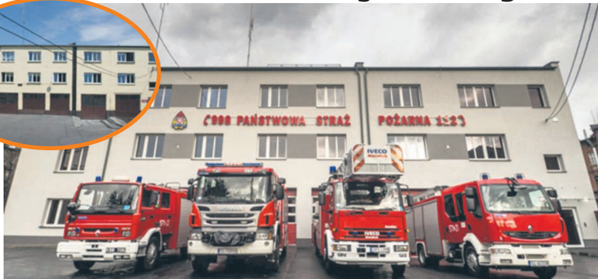
Komenda Miejska Państwowej Straży Pożarnej w Wirku po termomodernizacji.