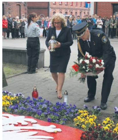
Kwiatami uczczono pamięć bohaterów.