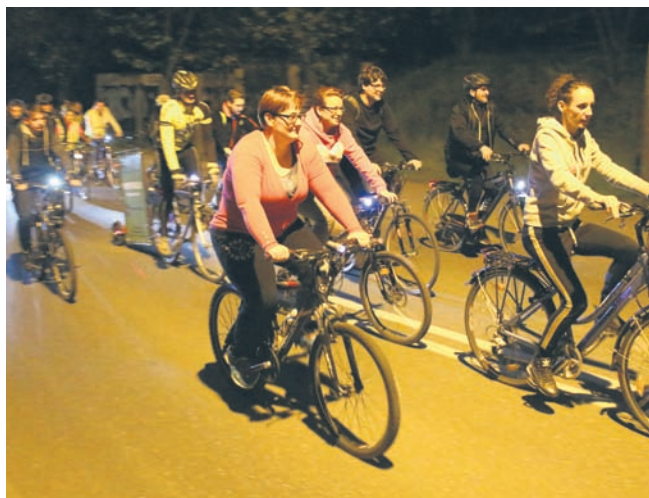
Rudzianie chętnie przyłączyli się do nocnego rajdu.

Aby nakręcić kilometry dla Rudy Śląskiej, trzeba wejść na stronę www.kreckilometry.pl i pobrać aplikację na telefon, stosując się krok po kroku do instrukcji.