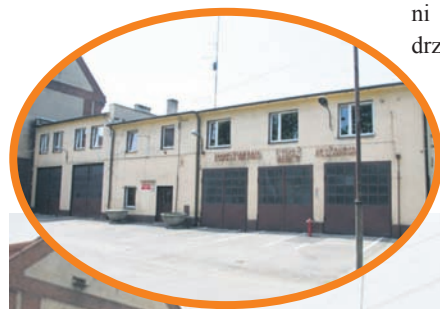
Wyremontowany budynek PSP w Orzegowie.

W ramach prac wymieniono grzejniki i instalację oraz zamontowano w pełni zautomatyzowany kocioł na pellet drzewny oraz wstawiono nowe okna, drzwi i bramy garażowe. Na budynkach zamontowano także kolektory słoneczne. – Dzięki temu nasza jednostka jest całkowicie samo-