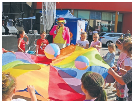
Podczas festynów zapewniono atrakcje dla dzieci.