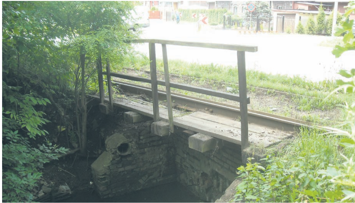
Przepust na ul. Piastowskiej jest w złym stanie technicznym.

– Wybudowany na początku XX wieku przepust jest obecnie w bardzo złym stanie technicznym, a na dodatek ma zbyt mały przekrój. To inwestycja bardzo ważna dla bezpie-