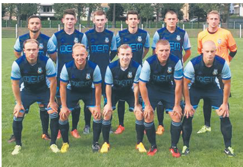
Rudzki beniaminek pokazał klasę.

Początek drugiej połowy był dość wyrównany, chociaż można było odczuć, że to Pogoń coraz mocniej napierała. Decydującego