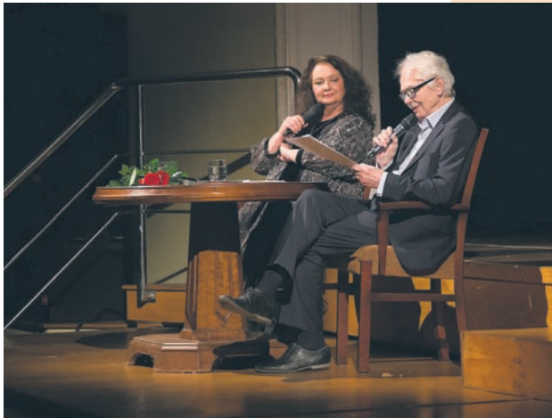
Jedną z największych nowości w MCK było otwarcie Krakowskiego Salonu Poezji.