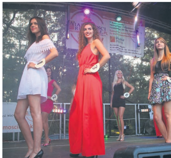
Dziewczyny zaprezentowały się także w sukienkach.