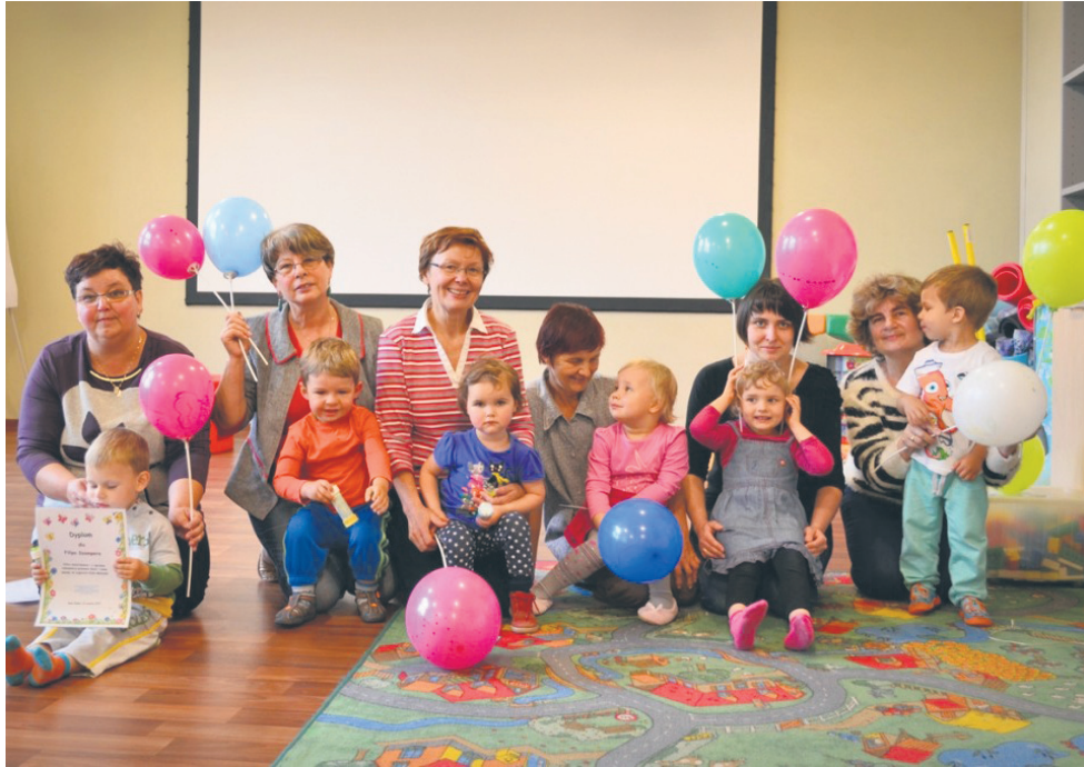
Na zajęcia można przychodzić także z wnukami.

Stowarzyszenie Pro Ethica od września po raz kolejny pozwoli emerytom „odpocząć” od wakacji. 25 sierpnia ruszają zapisy na nowe zajęcia. W zbliżającym się roku szkolnym będą organizowane zarówno w Centrum Inicjatyw Społecznych Stara Bykownina jak i w Filii nr 18 Miejskiej Biblioteki Publicznej w Halembie.