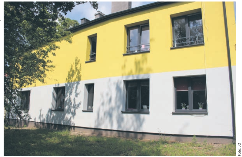
Rodziny Dom Dziecka nr 3 przeniósł się na Wirek.

Remont planowano już od 2014 roku, a 3 września, po przeprowadzeniu przetargu wyłoniony wykonawca prac mógł je rozpocząć. Przebudowa trwała do czerwca br., a było tego sporo. Między innymi częściowo rozebrano ściany i postawiono nowe, wymieniono wszystkie drzwi i okna, zamontowano nowe instalacje (wodociągową, kanalizacyjną, elektryczną, centralnego ogrzewania oraz podłączono budynek do