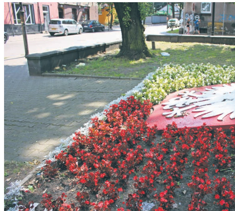
Mieszkańcy skarżą się na brak porządku przy ul. Hlonda.