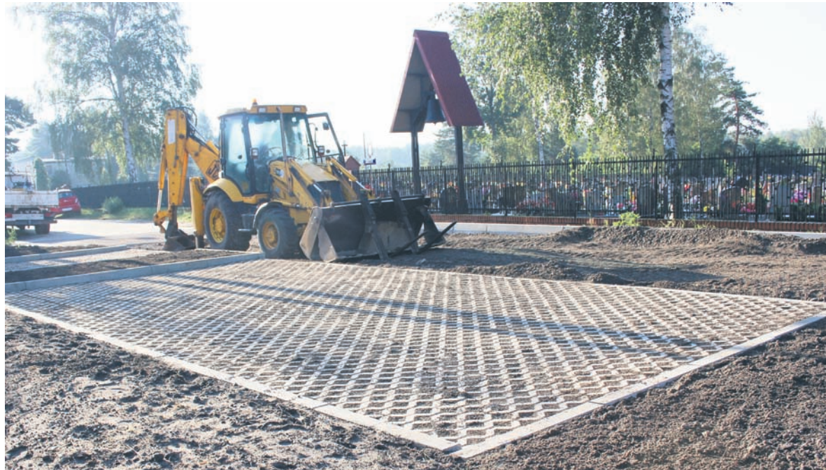
Parking przy cmentarzu w Kłodnicy powstaje w ramach tegorocznego budżetu obywatelskiego.

Od początku 2016 r. do tej pory w mieście powstało już ponad 30 miejsc parkingowych. – Wiemy, że mieszkańcy oczekują większej liczby miejsc parkingowych, szczególnie na terenach zabudowy wielorodzinnej, dlatego budujemy parkingi tam, gdzie jest to możliwe – mówi