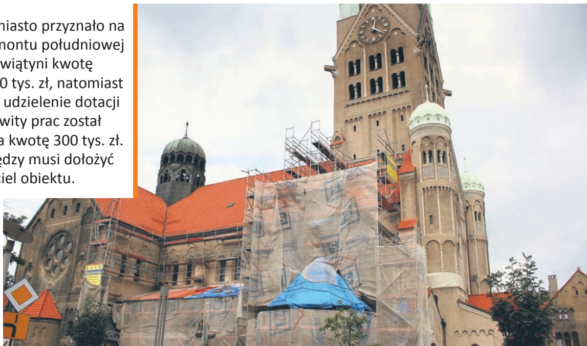
To już trzeci etap prac nad elewacją kościoła.

W 2016 roku miasto przyznało na wykonanie remontu południowej elewacji świątyni kwotę w wysokości 80 tys. zł, natomiast we wniosku o udzielenie dotacji koszt całkowity prac został oszacowany na kwotę 300 tys. zł. Resztę pieniędzy musi dołożyć właściciel obiektu.