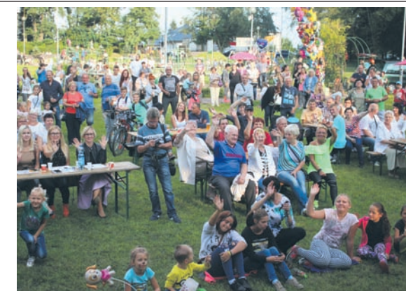
Tak bawiono się w Parku Strzelnica.