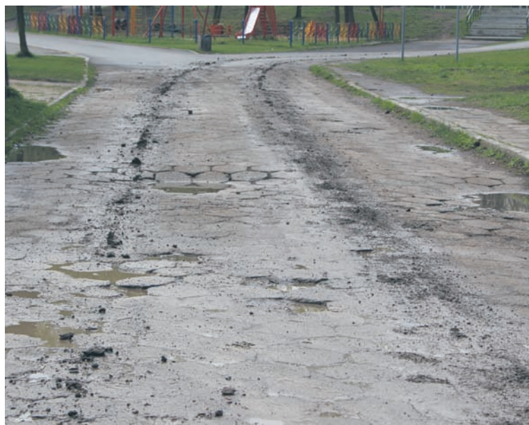
Droga dojazdowa do Burloch Areny jest w opłakanym stanie.