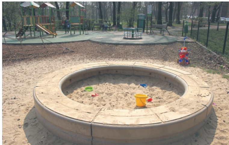
W większości piaskownice zostaną wyczyszczone w kwietniu.

Intensywne prace nad tym rozpoczynają także pozostałe spółdzielnie. MGSM „Perspektywa” piasek w piaskownicach wymieni do 28 kwietnia. – Dowóz obejmuje 72