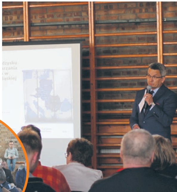
Mieszkańcy mieli sporo pytań odnośnie działania zakładu.

Mieszkańcy Kłodnicy i Starej Kuźnicy, którzy wzięli udział w spotkaniu zaznaczali, że w raporcie wiele rzeczy zostało pominiętych lub niezbyt szczegółowo omówionych. – W przetwórni odpadów znajdzie się ponad 300 różnych niebezpiecznych substancji – to między innymi rtęć, kadm, azbest – alarmowała jedna z mieszkanki. – Mówi się o tym, że zanieczyszczenia nie będą przedostawały się poza teren zakładu. Ale jaką mamy pewność co do tego? – pytała inna.