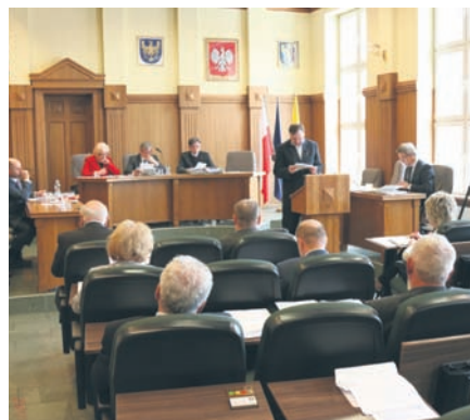
Rada Miasta przyjęła sprawozdania z działalności służb.