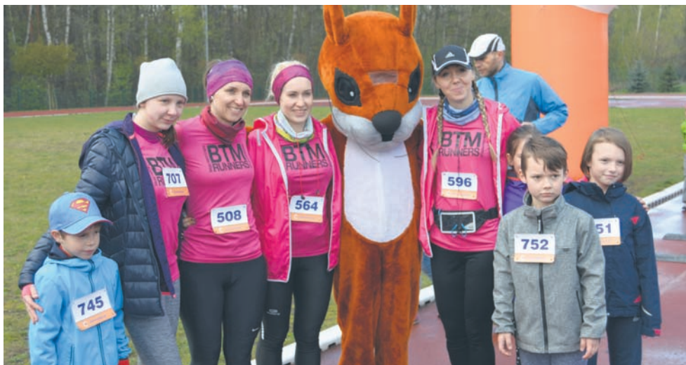
Przed biegiem każdy chce zrobić sobie pamiątkowe zdjęcie z wiewiórką.

W sobotnie przedpołudnie entuzjaści aktywnego stylu życia już po raz trzeci w tym roku wystartowali w „Biegu Wiewiórki”. Mimo kapryśnej pogody zapaleni biegacze i miłośnicy nordic walking sprawdzili swoje siły w halemskim lesie. Tradycyjnie już w biegu wzięły udział także dzieci.