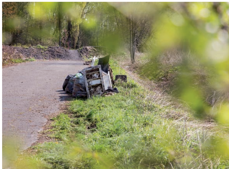
Ulica Górna w Bielszowicach to miejsce, gdzie często wywożone są śmieci.