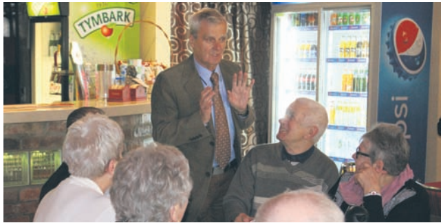
Emerycy spotykają się dwa razy w roku.

Urodziny to okazja do świętowania w każdym wieku, dlatego emeryci z nowobytomskiego koła spotykają się dwa razy w roku, żeby wspólnie cieszyć się z okrągłego jubileuszu. W miniony czwartek (20.04) urodziny obchodziło trzydzieści siedem osób.