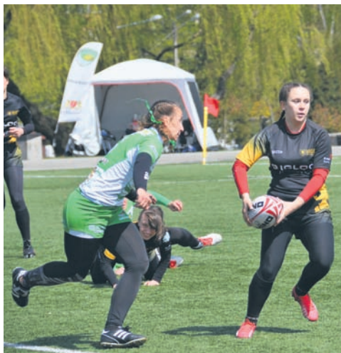
Rywalizację mistrzostw Polski rudzianki zakończyły na piątej pozycji.