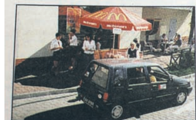
Półmetek rajdu w rudzkim McDonald'sie.