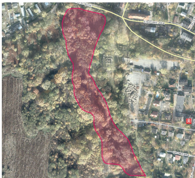
Inwestycja obejmować będzie 5 ha zielonego terenu pomiędzy ulicą Bujoczka a Kościelną.

Jak w szczegółach będą wyglądały prace przy tej ekologicznej inwestycji? W pierwszej kolejności uporządkowany zostanie teren poprzez uprzątnięcie śmieci oraz wycinkę roślin inwazyjnych. Następnie nasadzone będą nowe drzewa, krzewy i byliny. Wykonane zostaną łąki parkowe oraz zainstalowane zostaną budki lęgowe dla ptaków i owadów. Wybudowana zostanie pieszo-rowerowa ścieżka prowadząca od ul. Bujocz-