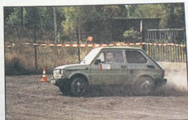
Próba sprawnościowa na trasie rajdu.

Na długiej i pełnej niespodzianek trasie w drodze po puchar można było zrobić sobie krótki odpoczynek, aby coś przekąsić („WR”, wrzesień, 1999 r.).