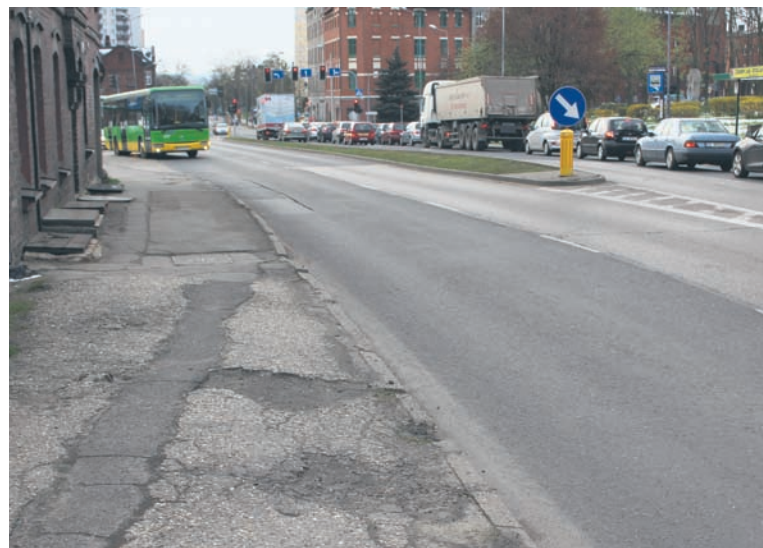
Remont chodnika planowany jest w 2018 roku.

– Inspektor Wydziału Dróg i Mostów przeprowadził oględziny chodni-