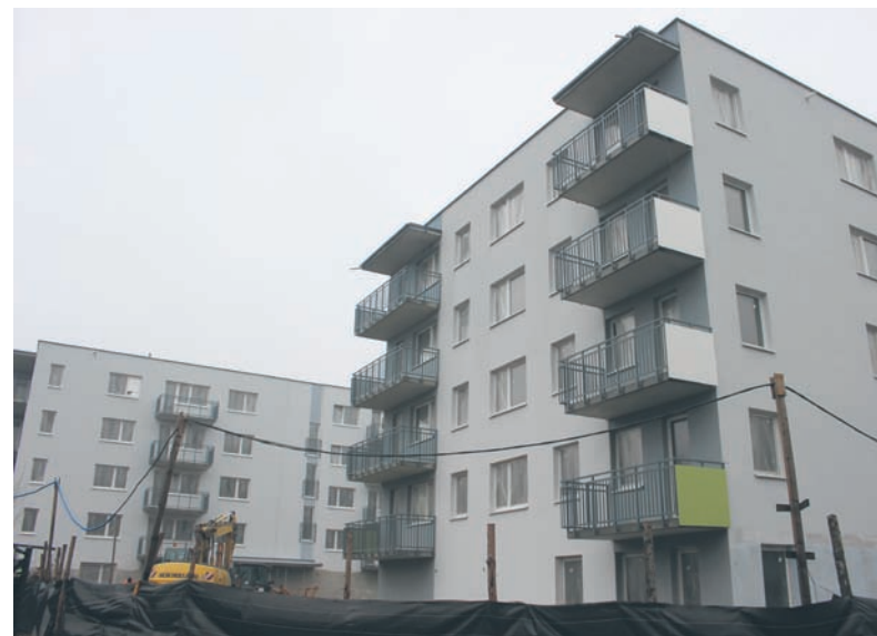
Już w lipcu ma się zakończyć budowa mieszkań przy ul. Czempieła i Kędzierzyńskiej.

Działania władz Rudy Śląskiej w zakresie gospodarki mieszkaniowej w latach 2012 – 2014 znalazły się w katalogu dobrych praktyk rewitalizacji polskich miast,