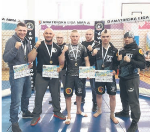
Klub KTJ MMA Team Ruda Śląska może pochwalić się utalentowanymi zawodnikami.