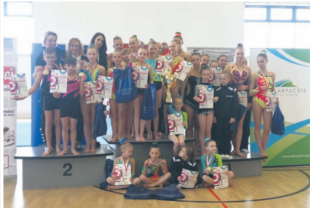
25 zawodników KPKS-u uczestniczyło w weekendowych zawodach.

Miniony weekend dla rudzkich akrobatów był niezwykle intensywny. W Rzeszowie rozgrywane były równoległe zawody w różnych kategoriach wiekowych, czyli Ogólnopolski Pierwszy Krok Sportowy w klasie trzeciej oraz Ogólnopolski Turniej w Akrobatyce Sportowej w klasie drugiej i 11-16 lat.