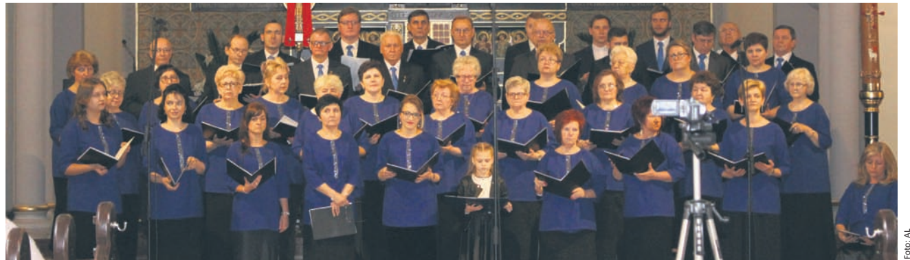
Chór Michael świętował 35-lecie działalności.

Chór mieszany Michael powstał w lutym 1982 roku. Iskrą zapalną była zbliżająca się uroczystość prymicji w orzegowskim kościele. W tym roku zespół obchodzi 35-lecie istnienia. Z tej okazji w niedzielę, 23 kwietnia, także w parafii pw. św. Michała Archanioła w Orzegowie odbył się jubileuszowy koncert chóru.