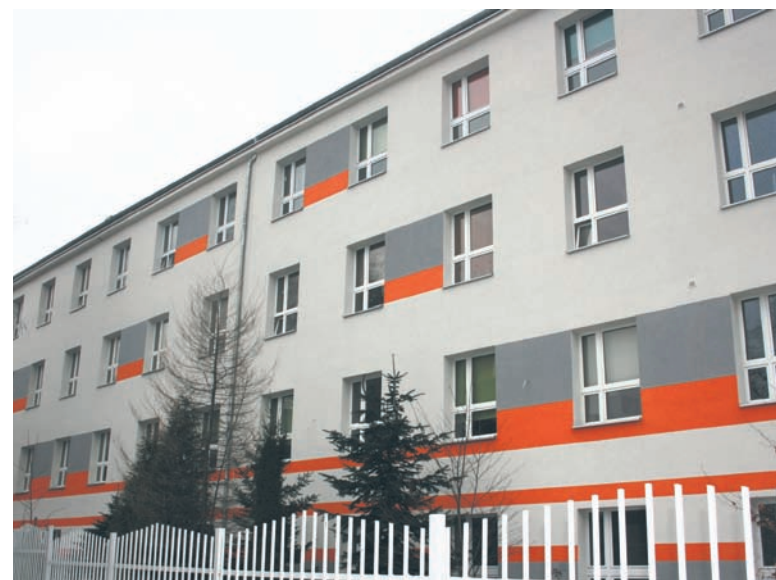
Zespół Szkół Ponadgimnazjalnych nr 4 to jedna z placówek, które już przeszły termomodernizację.

Na dwie spośród wymienionych termomodernizacji – Szkoły Podstawowej nr 13 i Gimnazjum nr 7 – miastu przyznane zostało unijne dofinansowanie. – Te dwa zadania były częścią naszego projektu, obejmującego osiem placówek oświatowych. Pozostałe sześć już się zakończyło. Były to inwestycje w Miejskich Przedszkolach nr 25, 30, 31 i 43, Zespole Szkół Ponadgimnazjalnych nr 4 oraz Zespole Szkół Specjalnych nr 4 – wylicza wiceprezydent Michał Pierończyk. – Dofinansowanie zgodnie z wnioskiem wynosi