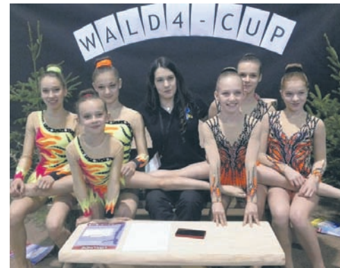
Akrobaci dobrze spisują się zarówno podczas zawodów w Polsce, jak i za granicą.