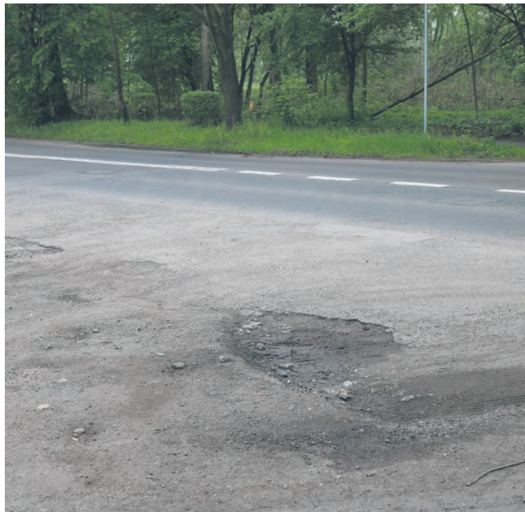
Użytkownicy garaży przy ulicy Lisiej mają problem z przejazdem.