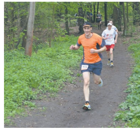
W majowym „Biegu Wiewiórki” wystartowało ponad 350 zawodników.

W biegu tradycyjnie już wystartowały dzieci, których w sobotnie przedpołudnie pobiegło aż 110 oraz 260 dorosłych startujących zarówno w biegu głównym, jak i w nordic walking. Jak zawsze uczestnicy biegu sprawdzili swoje siły na pętli o długości 4,25 km, którą, w zależności od predyspozycji, można było pokonać od jednego do pięciu razy. Limit pokonania pełnego dy-