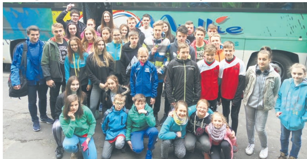
Zawodnicy mieli do pokonania dystans od 800 do 1500 metrów.

Drużyny dziewcząt i chłopców ze Szkoły Podstawowej nr 6, Gimnazjum nr 9 oraz Zespołu Szkół Ogólnokształcących nr 3 wzięły udział w finale Wojewódzkich Drużynowych Biegów Przełajowych, które odbyły się 9 maja w Mysłowicach. – Na ostatni szczebel współzawodnictwa Śląskiego SZS zakwalifikowały się najlepsze zespoły poszczególnych miast, które następnie musiały okazać się również najlepsze w rywalizacji podczas zawodów rejonowych. Dzięki wywalczonej kwalifikacji Rudę Śląską miały zaszczyt reprezentować drużyny dziewcząt i chłopców z SP nr 6, Gimnazjum nr 9 oraz ZSO nr 3. Zawodnicy mieli do pokonania dystans od 800 do