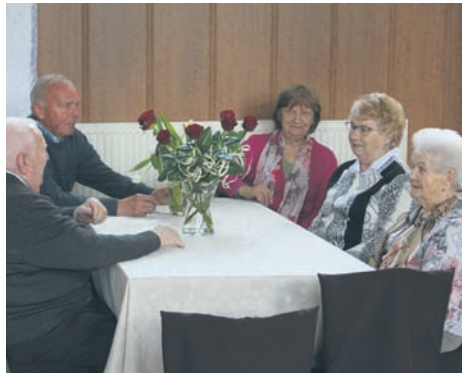
Emerycy z koła nr 10 świętowali Dzień Matki.

Zebrany przy kawie i ciastku seniorom, a w szczególności wszystkim mamom, życzenia złożyła wiceprezydent Rudy Śląskiej. – Bardzo się cieszę i dziękuję za to, że działacie w naszym mieście i tak aktywnie uczestniczycie w jego życiu. Dlatego składam wszystkim seniorom najserdeczniejsze życzenia, a szczególnie