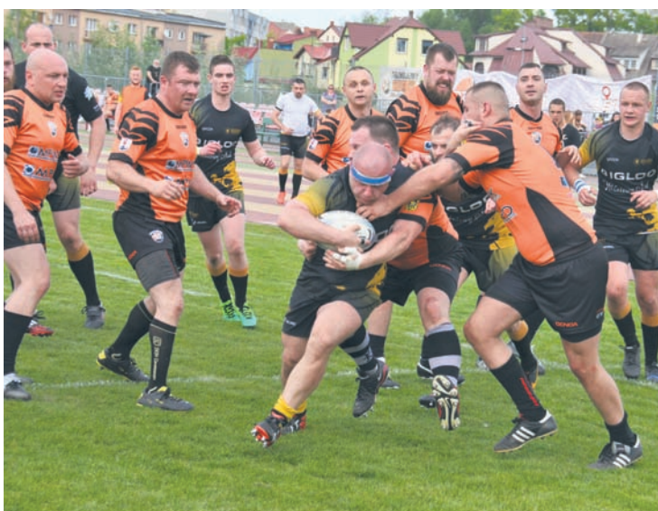
Gryfy pokonały przeciwników w Lubinie.

W miniony weekend wszystkie drużyny KS Rugby Ruda Śląska rozjechały się po Polsce, grając na wyjazdach – Gryfy w Lubinie, Diablice w Poznaniu, a Bajtle w Jarocinie. Gryfy pojechały do Lubina na swój ostatni mecz pierwszej rundy sezonu 2017 z Miedzioymi po zwycięstwo i zachowanie pozycji lidera grupy południowej drugiej ligi. – Zadanie to udało się wykonać w stu procentach, choć nie było łatwo. Bardzo zmotywowani gospodarze postawili zwłaszcza w pierwszej połowie meczu bardzo trudne warunki i przez pierwsze