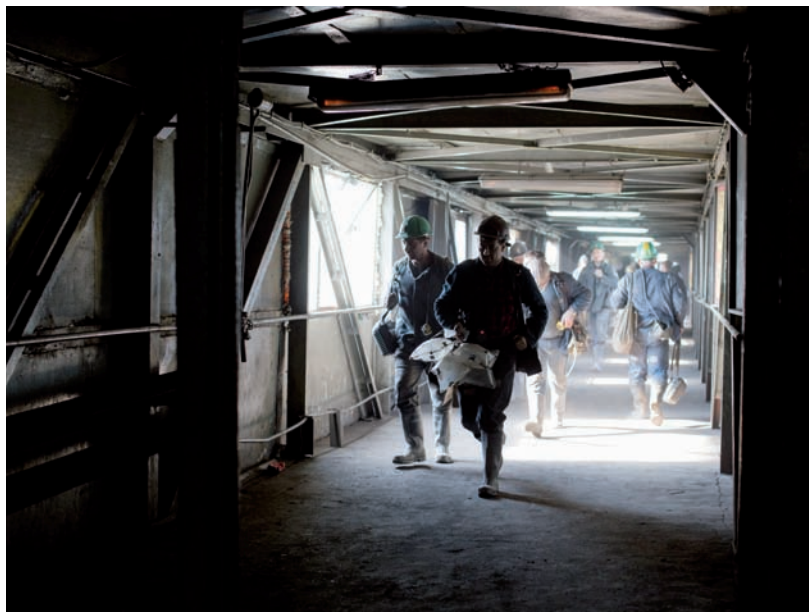
W rudzkich kopalniach pracuje prawie 6,5 tys. osób.

Jak poinformował wiceminister Grzegorz Tobiszowski, polski rząd zamierza zainwesto-