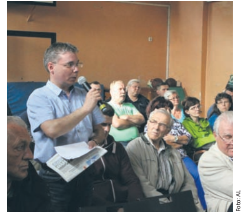
Ostatnie spotkania odbyły się w Wirku i w Orzegowie.

Z kolei najważniejsze inwestycje, jakie realizowane są w dzielnicach Godula i Orzegów, przedstawione zostały podczas poniedziałkowego (15.05) spotkania w Szkole Podstawowej nr 36. A wśród nich to: budowa parkingu przy ul. Goduli i Przedszkolnej, budowa mieszkań komunalnych przy ul. Stromej i Bytomskiej, rewitalizacja rynku w kwartale pomiędzy ul. Czapli,