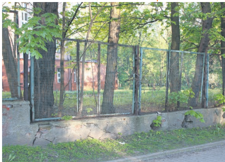
Ogrodzenie bielszowickiego szpitala jest w złym stanie.

W niektórych miejscach powyrwane są przęsła ogrodzenia, brakuje także śrub mocujących. Powstają też dziury, ponieważ znaczna część płotu została wykonana z siatki. Jego zły stan to prawdopodobnie efekt długoletniej dewastacji oraz szkód górniczych na tym terenie. Jednak jak zaznacza rzecznik prasowy, szpital dotychczas nie otrzymywał żadnych