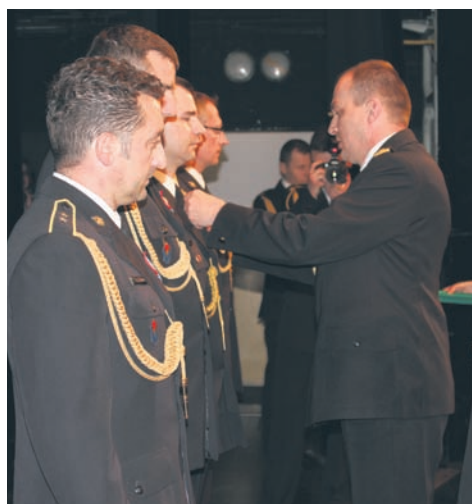
Strażacy odebrali nagrody i wyróżnienia.