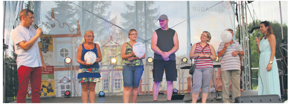
Podczas festynu nie zabrakło wielu atrakcji dla mieszkańców.