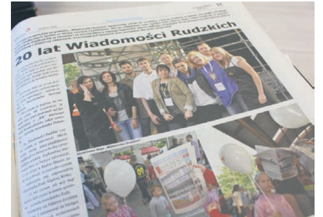
20. urodziny „Wiadomości Rudzkich” świętowaliśmy nieco wcześniej, bo w maju 2012 roku podczas Dni Rudy Śląskiej. Na terenach targowych w Wirku spotkaliśmy się z naszymi Czytelnikami, którzy razem z nami konsumowali urodzinowy tort. W tym roku będzie podobnie! („WR”, 30.05.2012 r.).

15-lecie naszej gazety było okazją do wspomnienia tego, jak przez kolejne lata funkcjonowała redakcja „Wiadomości Rudzkich” i jakie imprezy udało się zorganizować. Wśród tych pierwszych, która zresztą istnieje do dzisiaj, jest Plebiscyt „Wiadomości Rudzkich” na Sportowca i Trenera Roku. („WR”, 1.08.2007 r.).