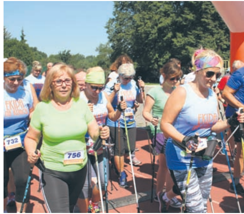
Podczas Biegu Wiewiórki rywalizowali miłośnicy nordic walking.

Upalna pogoda i palące słońce nie zniechęciły zapalonych biegaczy i miłośników nordic walking do udziału w kolejnym „Biegu Wiewiórki”. Już po raz siódmy uczestnicy biegu mogli sprawdzić swoje biegowe możliwości. Jak zawsze na starcie można było spotkać grupę dzieci, które dystans 1 km przebiegły razem z wiewiórką. Z kolei dorośli biegacze musieli pokonać pętlę o długości 4,25 km, którą, w zależności od predyspozycji, można było przebiec od jednego do pięciu razy. Limit pokonania pełnego dystansu, czyli 21 km, wynosił 2 godz. i 45 minut. Natomiast na tej samej trasie rywalizowali także wielbiciele nordic walking, dla których maksymalny dystans wynosił 12,6 km. Entuzjaści aktywnego stylu życia będą mogli sprawdzić swoje siły jeszcze 16 września, 14 października oraz 4 listopada.