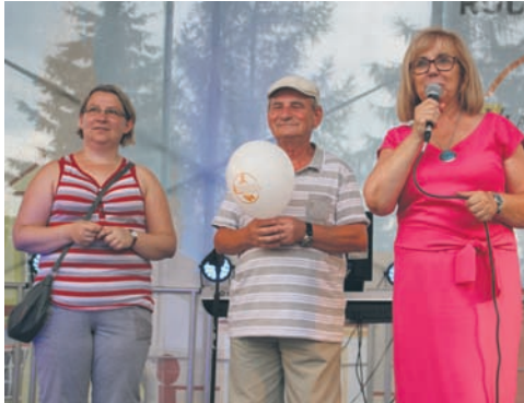
Gościem festynu „Po sąsiedzku” była prezydent Grażyna Dziedzic.