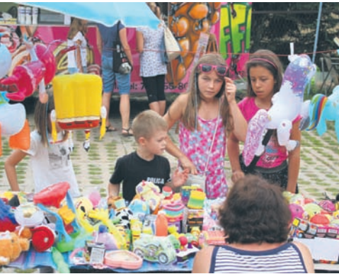
Stragany z zabawkami sprawiły frajdę dzieciakom.