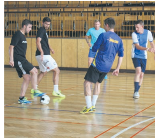
„Gwiazda” przygotowuje się do nowego sezonu.

Podczas pierwszego treningu, który odbył się we wtorek (1.08) na parkiecie spotkało się 17 zawodników. Oprócz tych, którzy grali w zespole w minionym sezonie, pojawili się także najlepsi zawodnicy z drugiego zespołu, którzy już zaliczyli kilka spotkań w końcówce rozgrywek.