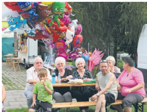
Na festynie można było spotkać młodszych i starszych mieszkańców dzielnicy.