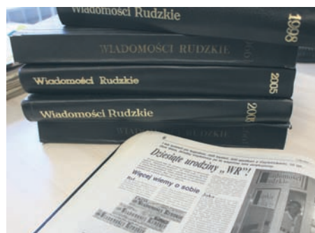
Po 10 latach istnienia „Wiadomości Rudzkich” mieliśmy na koncie 520 wydań i z pewnością o wiele więcej Czytelników. („WR”, 7.08.2002 r.).

Dokładnie 3 sierpnia 1992 roku ukazał się tzw. zerowy numer „Wiadomości Rudzkich”. Przez 25 lat staramy się być jak najbliższym Czytelników, których także włączamy do wspólnego świętowania jubileuszu naszego tygodnika. Tak było w minionych latach, a już 15 sierpnia w Halembie odbędzie się festyn z okazji ćwierćwiecza naszej gazety. Serdecznie zapraszamy! A teraz czas na sentymentalną podróż przez kolejne, jubileuszowe wydania „WR”.