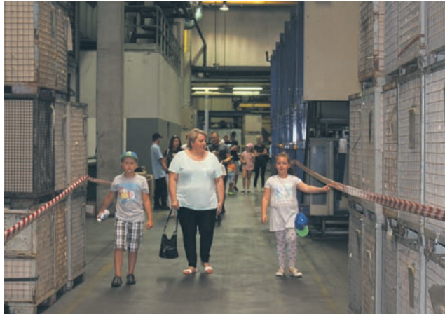
„Godziny otwarte” były wspaniałą okazją dla rodzin pracowników do zobaczenia hali i poznania procesu produkcyjnego.

Moc atrakcji czekała na pracowników firmy Leiber-Poland oraz ich rodziny podczas festynu, który odbył się sobotą 29 lipca. Na terenie przedsiębiorstwa czekały gry i zabawy dla starszych i młodszych uczestników. Była to także dobra okazja do spotkania i zintegrowania się społeczności Leiber-Poland. Poza tym podczas „godzin otwartych”, które odbyły się w czasie imprezy, można było zobaczyć hale oraz procesy produkcyjne w zakładzie.