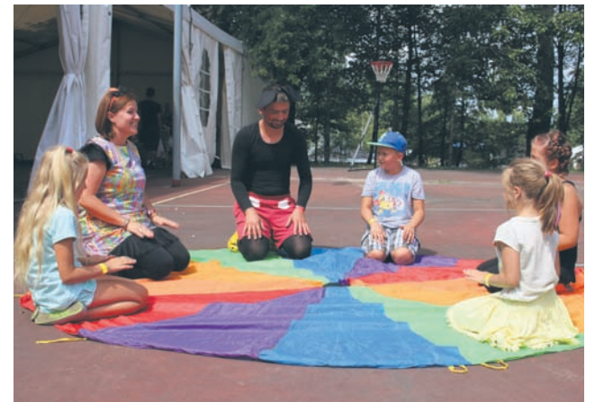
Festyn rodzinny, który odbywa się co roku, zapewnia uczestnikom moc niezapomnianych atrakcji.