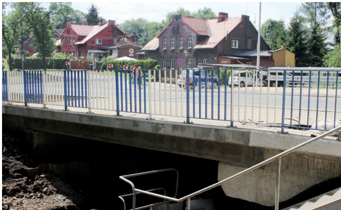
W ramach przebudowy m.in. powstał nowy most nad potokiem Julka.