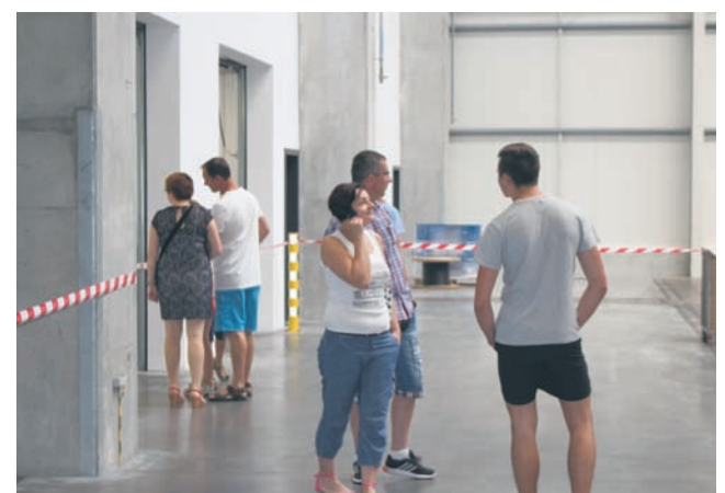
Wkrótce do użytku zostanie oddana nowa hala o powierzchni aż 3000 m kw.