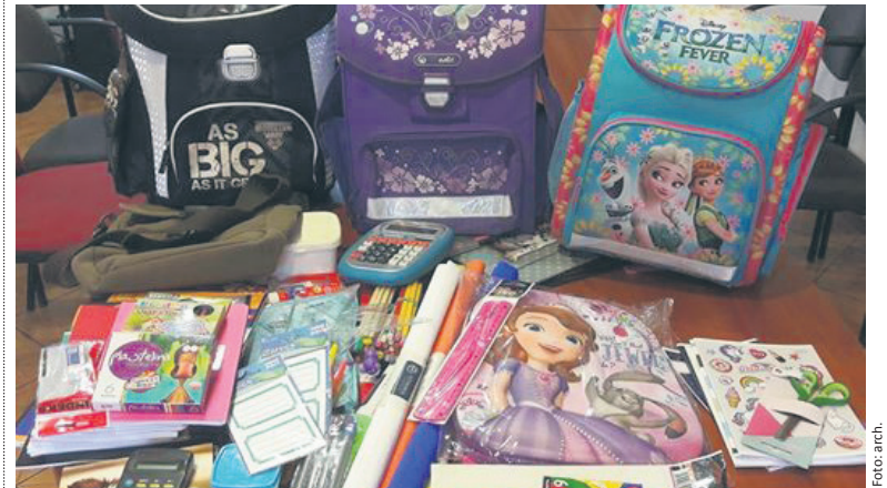
Przybory można zostawić m.in. w siedzibie MOSiR-u.

– Kochani, potrzebna Wasza pomoc w wystaniu naszych rudzkich dzieciaków do szkoły – tymi słowami Fundacja Przyjaciół Świętego Mikołaja zachęca do kolejnej organizowanej przez siebie akcji. Tym razem członkowie organizacji zbierają przybory szkolne.