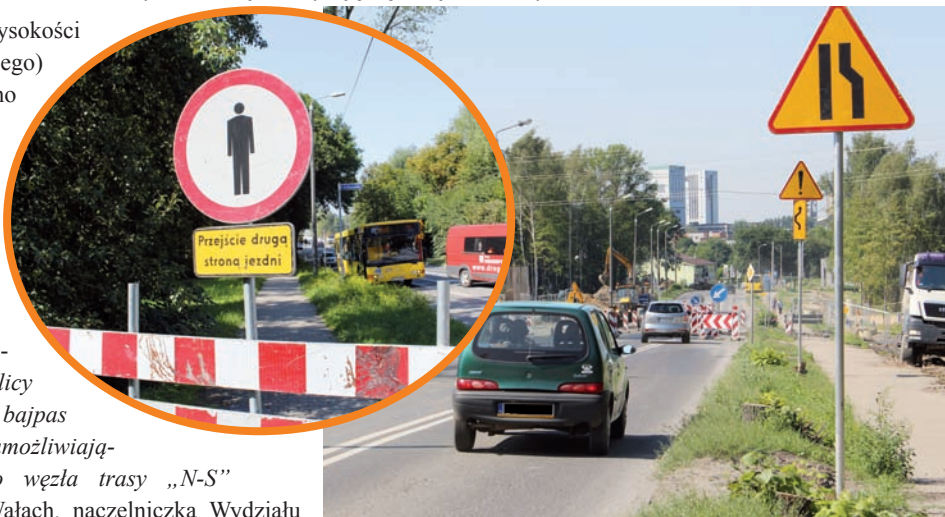
Przy ul. Kokota trzeba liczyć się z utrudnieniami.