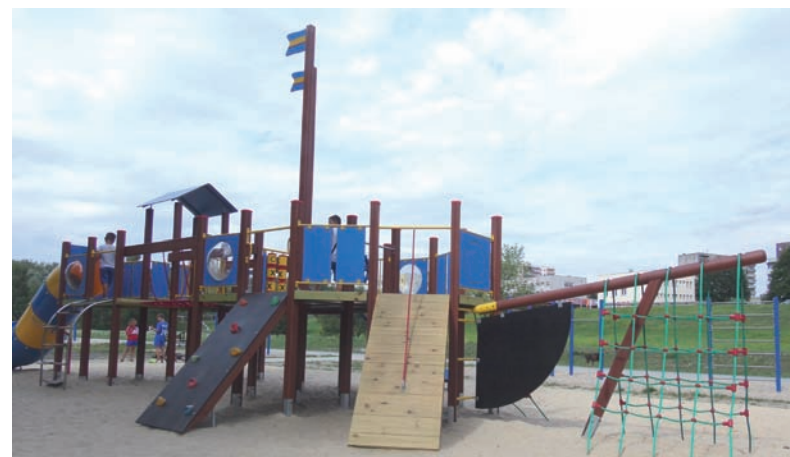
Plac zabaw typu statek w strefie aktywności w Bykowni to jedna z inwestycji w ramach budżetu obywatelskiego na 2017 rok.

W ramach tegorocznego budżetu obywatelskiego w Rudzie Śląskiej realizowanych jest 12 zadań – dwa ogólnomiejskie i dziesięć dzielnicowych. Największą inwestycją