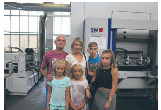
Całe rodziny wzięły udział w imprezie zorganizowanej na terenie firmy.