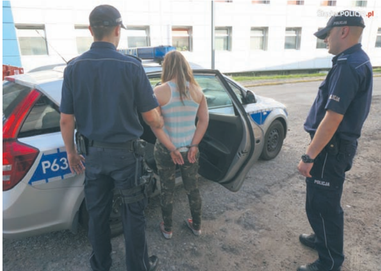
Matka czwórki dzieci została zatrzymana.

Siedmiomiesięczna dziewczynka z Rudy Śląskiej z licznymi obrażeniami trafiła do szpitala w Zabru. Dzień wcześniej matka dziewczynki zaprowadziła swoje drugie, czteroletnie dziecko do znajomych, u których zainterweniowała policja. Przyczyną interwencji była sprzeczka pary, jednak na miejscu okazało się, że rudzianie znajdują się pod wpływem alkoholu. Dlatego czteroletkę zabrano do tymczasowej rodziny zastępczej. Kiedy następnego dnia matka szukała swojego czteroletniego dziecka, pozostała trójka była pod okiem cioci, która zauważyła na ciele siedmiomiesięcznego dziecka obrażenia. Okazało się jednak, że powstały one w trakcie zabawy. Najmłodsza dziewczynka opuściła już szpital i jej zdrowiu nie zagraża niebezpieczeństwo.