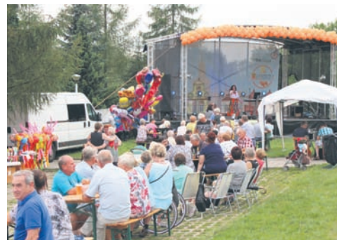
Piątkowe popołudnie było wspaniałą okazją do spędzenia czasu w gronie rodziny i znajomych.