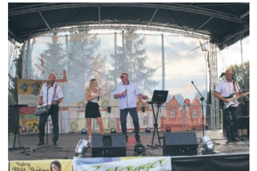
Wśród występujących muzyków pojawili się zespół Nas Troje.