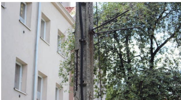
Cztery słupy przy ul. Gierałtowskiego zostaną wymienione.

Warto dodać, że w ubiegłym roku miasto zwróciło się do Tauronu z prośbą o naprawę i usunięcie zagrożeń spowodowanych stanem