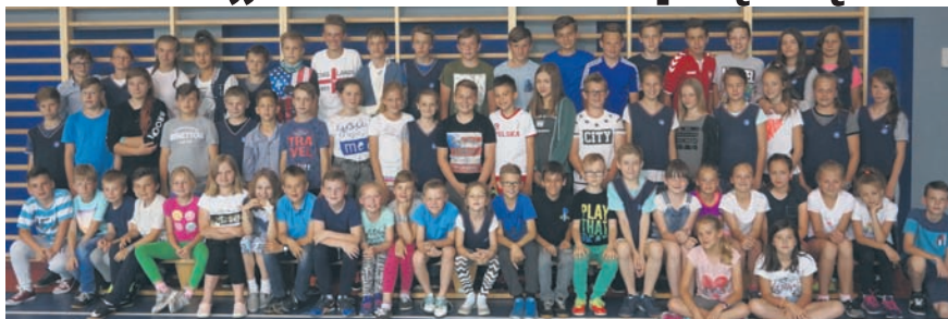
Na sukces młodzi sportowcy pracowali cały rok.

Szkoła Podstawowa nr 6 zajęła piąte miejsce w Wojewódzkich Igrzyskach Młodzieży Szkolnej o Puchar Śląskiego Kuratora Oświaty za rok szkolny 2016/2017. Orzegowska podstawówka w swojej historii może pochwycić się podobnym wynikiem, który osiągnęła dziewięć lat temu. Na tak spektakularny sukces w sporcie szkolnym młodzi sportowcy pracowali przez cały rok. Jesienią były sztafetowe biegi przełajowe, turniej gier i zabaw dla najmłodszych, szachy, tenis stołowy i piłka ręczna. Zimą był badminton, pływanie i biegi łyżwiarskie. Z kolei na wiosnę: koszykówka, siatkówka, piłka nożna, orientacja sportowa i czwórki lekkoatletyczne.