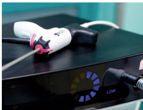
Nóż chirurgiczny znacznie usprawni operacje.

Nowoczesny sprzęt w rudzkim szpitalu wykorzystywany będzie nie tylko przez ginekologów, to także nowe narzędzie chirurgów z Goduli. – Mamy bardzo dobrze wyposażone sale operacyjne, ale na mojej osobistej liście życzeń nóż harmoniczny był w pierwszej trójce. Jest to dla nas duży krok do przodu, może nie aż „skok w nadprzestrzeń”, używając terminologii Gwiezdnych Wojen, ale poprzez zastosowanie tej no-