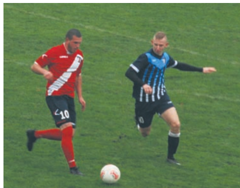
Na własnym boisku kochłowiczanie przegrali z drużyną z Mysłowic.