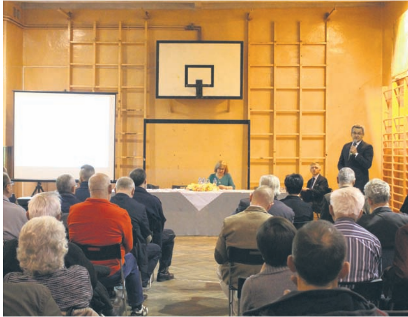
Ostatnie spotkanie odbyło się dla mieszkańców dwóch dzielnic.