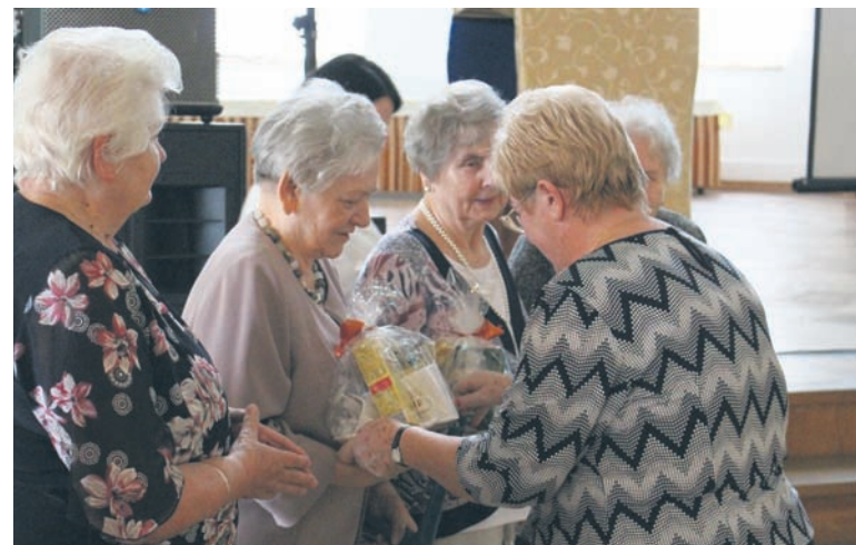
12 nauczycieli od ponad 60 lat działa w ZNP.

Okazją do wspólnego spotkania było także to środowe (25.10), kiedy to członkowie sekcji emerytów i rencistów ZNP świętowali jej 60-lecie. W trakcie spotkania uhonorowane zostały osoby, które działają w ZNP więcej niż 60 lat, osoby, które mają 50 oraz 25 lat członkostwa i osoby które właśnie odchodzą na emeryturę. Wręczono również dwie złote odznaki. – To dla nas bardzo ważne osoby, bo w swojej pracy i działaniu