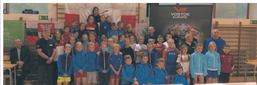
Zapaśnicy zdobyli złote, srebrne i brązowe medale.