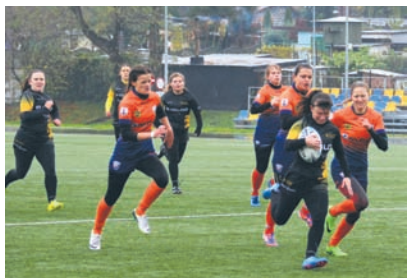
Deszczowa pogoda w sobotę nie rozpieszczała zawodników.

Ostatni mecz sezonu w Grupie Mistrzowskiej II ligi rudzcy rugbiści rozegrali w sobotę (28.10) na Burloch Arenie z Arką Rumia. Goście potrzebowali zwycięstwa z punktem bonusowym (za minimum cztery przyłożenia), aby zwyciężyć w całych rozgrywkach II ligi, natomiast gospodarze już wcześniej byli pewni zakończenia sezonu na trzecim miejscu, chcieli jednak zrewanżować się za wcześniejszą porażkę na wyjeździe. Spotkanie toczono w nieprzyjnych warunkach, przy niskiej temperaturze i deszczu, co było widoczne w tempie gry. W pierwszej połowie kibice nie byli świadkami porywającego widowiska. Gra toczyła się głównie w okolicach linii środkowej boiska, a oba zespoły popełniały wiele błędów. Jednak zdobyte przez Arkę w siódmej minucie przyłożenie po wygranej formacji autowej pozwoliło gościom grać na większym luzie. Rudzianie przed przerwą nie byli w stanie sforsować obrony rywali. W drugiej połowie spotkania oba zespoły chętniej ruszyły do ataku. Rudzianie przegrywając zaledwie pięcioma punktami ujrzeli szansę na