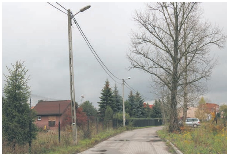
Przebudowa ul. Zjednoczenia ma potrwać osiem miesięcy.

Co więcej, podczas modernizacji nawierzchni zostanie wybudowana