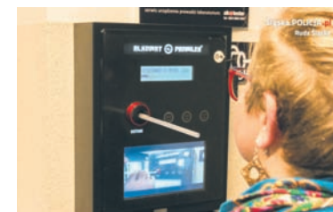
Nowe alkomaty są dostępne w pięciu komisariatach.