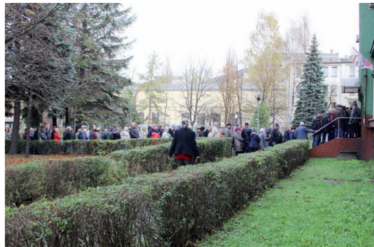
Przed kopalniami w pierwszych dniach były tłumy.

Właśnie z podpisem notariusza wniosek o wypłatę 10 tys. zł rekompensaty można wysłać pocztą. Tu jednak wśród mieszkańców pojawiają się informacje, że spotkali