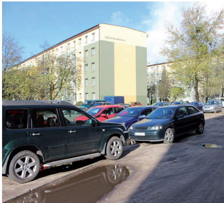
Parkowanie w tym miejscu jest dozwolone.