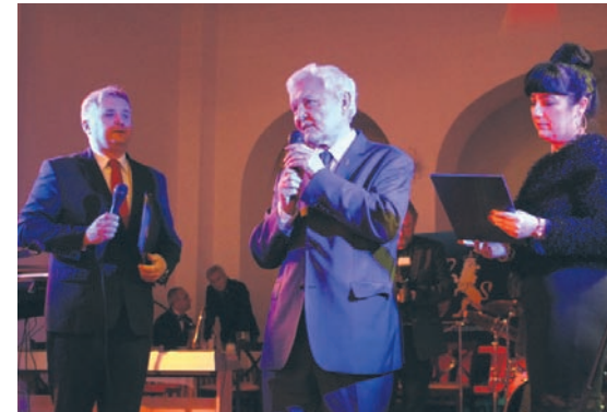
Stowarzyszenie świętowało swoje 10-lecie.

Wśród nich znalazło się także wydawanie kalendarza orzegowskiego, organizacja spacerów po Orzegowie oraz kwest w okresie Wszystkich Świętych, powstał także album orzegowski, a dwa lata temu w dzielnicy świętowano jej 710-lecie. Ubiegły rok przebiegał z kolei pod hasłem Rok Sportu Orzegowskiego, a ten poświęcony jest muzyce w Orzegowie. Życie w dzielnicy zaczęło