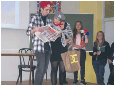
Uczniowie poznali kulturę krajów europejskich.

W tym roku w rudzkiej „dwójce” zorganizowano m.in. konkurs na najlepszy skecz oraz dyktando z poezji. Szczególną popularnością cieszyła się olimpiada z języka angielskiego. Nie zabrakło także prezentacji na temat krajów europejskich i warsztatów ekonomicznych w języku angielskim.