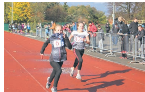
W biegu wystartowały dzieci i młodzież z całego województwa.

W zawodach wystartowało szesnaście sztafet po sześciu uczestników z kilkudziesięciu miast województwa śląskiego. Osobno pobiegły dziewczyny oraz chłopcy. – To zawody, które są organizowane zgodnie z kalendarzem ogólnopolskim Szkolnego Związku Sportowego, czyli odbywają się we wszystkich województwach Polski. Jest to złożony system,