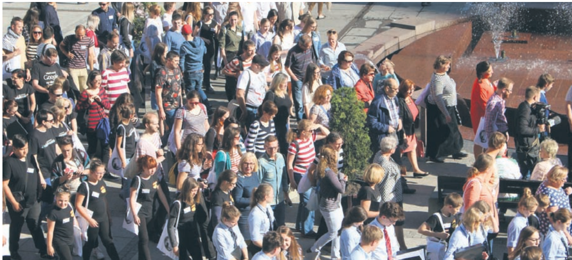
Noc Chórów rozpoczęła Rozśpiewany Rynek.

Imprezę wsparli: Zespół Szkół Muzycznych I i II st., Miejski Ośrodek Sportu i Rekreacji oraz Miejskie Centrum Kultury w Rudzie Śląskiej, Aquadrom, Druid Pub, firmy: „Jakubiec”, „Kuś”, „Lambertz” oraz dronpro – fly&cam. Patronat medialny objął portal społecznościowy chórzystów „Chórtownia”. AS