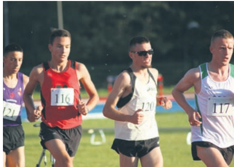
Tego typu zawody pierwszy raz odbyły się na rudzkim stadionie.

Sobotnie zawody w Rudzie Śląskiej odbyły się pod auspicjami Polskiego Związku Lekkiej Atletyki, a swoje siły sprawdzili biegacze urodzeni w latach 1996-1998. W zawodach gościnnie wziął także udział jeden