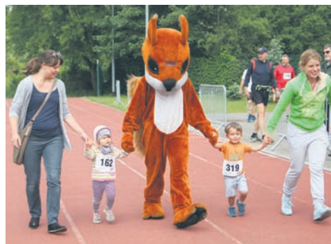
Razem z wiewiórką pobiegły całe rodziny.

Zapisy do biegu prowadzone są internetowo. W przypadku wcześniejszego zgłoszenia online opłata za bieg główny oraz nordic walking wynosi 15 zł. Osoby zapisujące się na miejscu, w dniu imprezy, płacą 25 zł. Wysockość wpisowego za dzieci niezależnie od sposobu