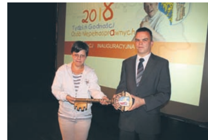
Uroczyste przekazanie kluczy odbyło się podczas gali w MCK-u.