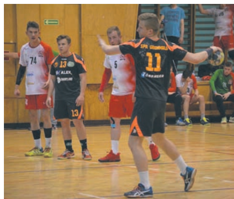
SPR Grunwald odniósł dwa zwycięstwa.

Kolejny sukces dla Grunwaldu nadszedł we wtorek (15.05). Zieloni zakończyli sezon zwycięstwem nad drużyną z Sosnowca. – Pierwsze minuty spotkania były wyrównane. Widać było, że goście chcieli zrewanżować się naszemu zespołowi za porażkę w pierwszym meczu. Grunwald wypracował jednak kilkubramkową przewagę pod koniec pierwszej połowy. W drugiej części spo-