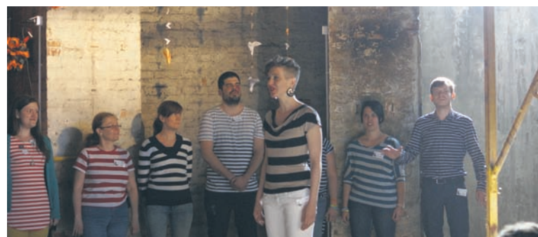
Goście z Budapesztu, czyli Chór Csikszerdá, zaczarował publiczność w zabytkowej wieży wodnej.