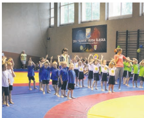
W olimpiadzie wystartowały dzieci z ośmiu przedszkoli.

Dzieci sprawdziły swoje siły w różnych rywalizacjach. – Mamy trzy konkurencje sportowe i trzy elementy z programu „Mały ratownik medyczny”, który jest realizowany w naszym przedszkolu. Dzieci wykazały się znajomością apteczki, ułożyły puzzle z numerów alarmowych i zaprezentowały pozycję boczną ustaloną