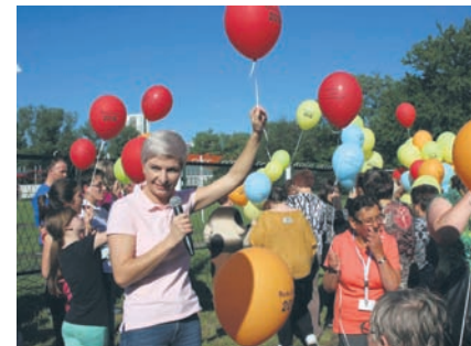
Podczas pikniku 500 kolorowych balonów poleciało do nieba.