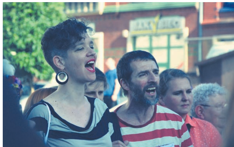
Spotkali się ludzie, dla których muzyka jest prawdziwą pasją.