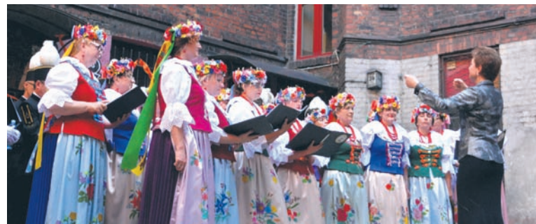
Chór Polonia Harmonia z Piekar Śląskich prezentował się imponująco.