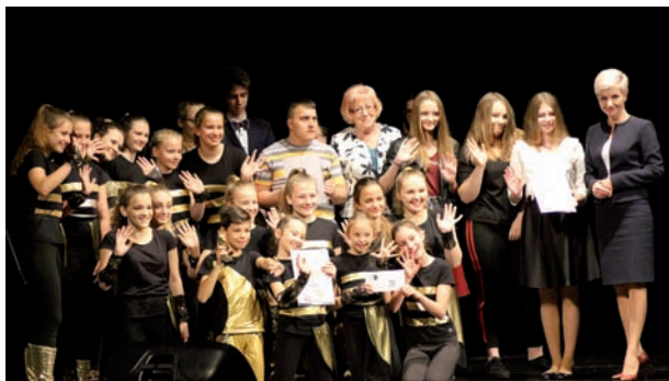
Uczestnicy festiwalu otrzymali nagrody i wyróżnienia.

– Jestem dumna, że mamy w mieście tak wiele młodych talentów! Dzisiejsza uroczystość była okazją, aby pogratulować uczniom wybitnych zdolności artystycznych, a także, by podziękować opiekunom i nauczycielom, którzy pomagają swoim podopiecznym