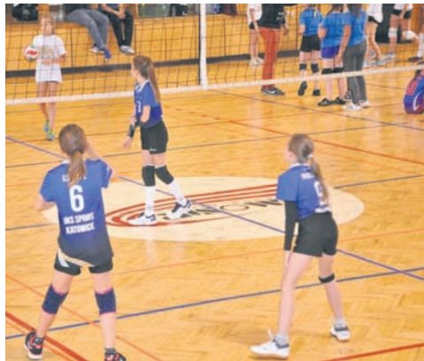
Podczas turnieju spotkały się drużyny z całej Polski.

Każdego roku organizatorem zawodów jest Katolicki Parafialny Klub Sportowy „Halemba”. W tym roku po