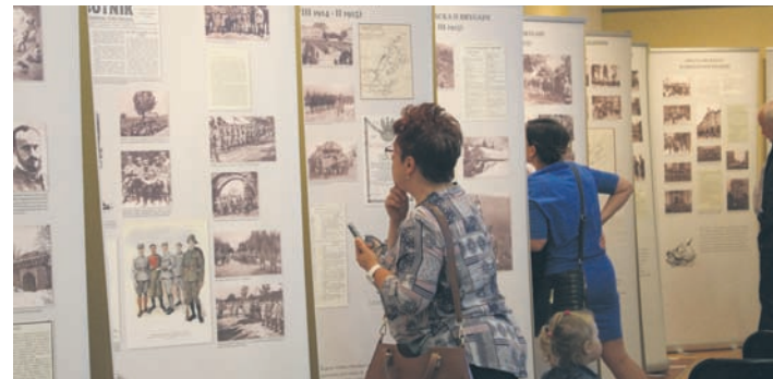
Muzeum po raz 10. włączyło się w Noc Muzeów.

Pod hasłem „Niepodległość” przebiegła tegoroczna Noc Muzeów w Rudzie Śląskiej. Już po raz dziesiąty rudzkie Muzeum Miejskie im. Maksymiliana Chroboka włączyło się w obchody Europejskiej Nocy Muzeów i otworzyło swoje podwoje dla zwiedzających.