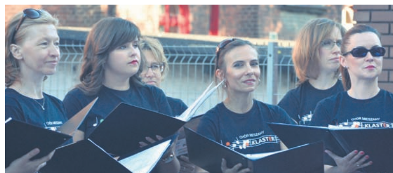
Chór Klaster śpiewał m.in. na parkingu przy Zespole Szkół Muzycznych I i II st. w Rudzie Śląskiej.