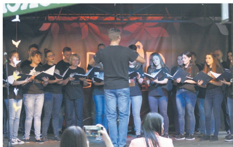
Scena Pubu Druid gościła m.in. Chór Uniwersytetu Ekonomicznego.