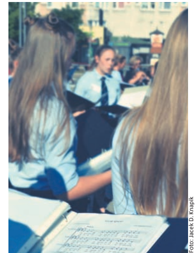
11 chórów w 7 różnych miejscach, 700 minut śpiewania i mnóstwo artystycznych doznań.