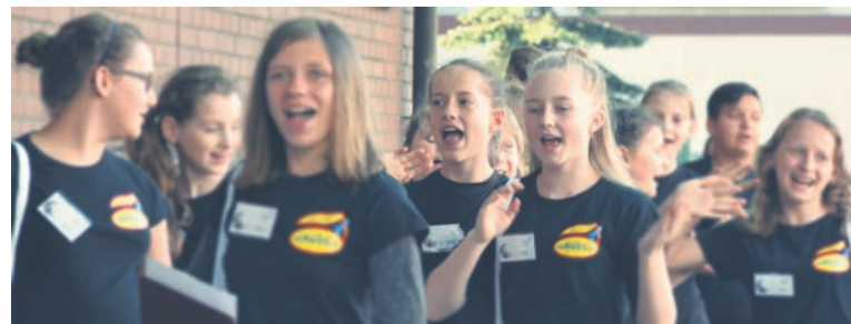
Chór Gaudeo ze Świerklan zarażał swoją radością.