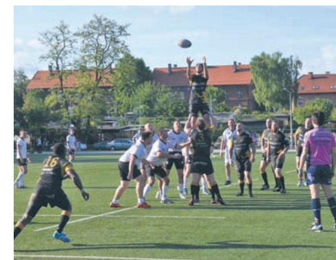
Rudzkie Gryfy pokonały rugbyistów z Warszawy.

Już po sześciu minutach Gryfy prowadziły, po serii mocnych wejść młynem na polu punktowym zameldo-