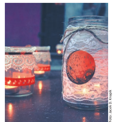
Wolontariusze przygotowali piękne dekoracje.