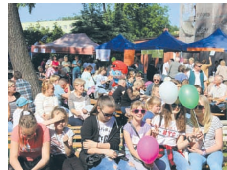
Festyn przy parafii cieszył się dużym zainteresowaniem.