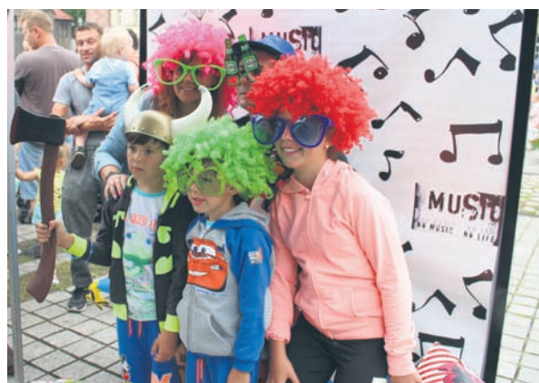
Na rynku stanęła fotobudka.