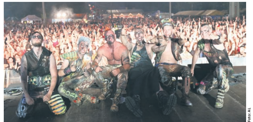
Oberschlesien niemalże rozniósł scenę swoją niesamowitą energią.