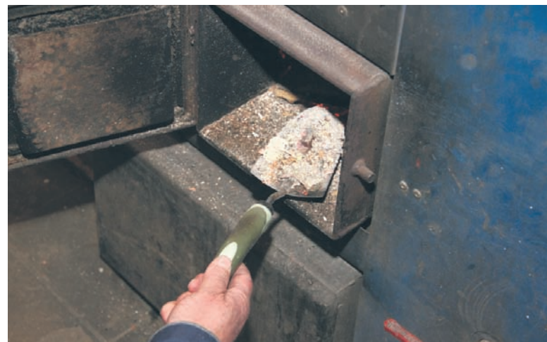
Od 2019 roku popiół i żużel trafią do osobnego pojemnika.

W 2017 roku w Rudzie Śląskiej zebrano prawie ponad 55,6 tys. ton śmieci, w tym ponad 39 tys. ton odpadów zmieszanych. W tym okresie wysegre-