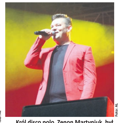
Król disco polo, Zenon Martyniuk, był gwiazdą trzeciego dnia koncertów.