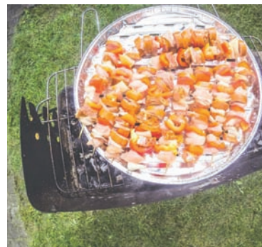
Zasady grillowania wynikają głównie z dobrego obyczaju.

Szczególną ostrożność należy zachować, paląc ognisko w pobliżu terenów leśnych. Grilla możemy postawić w odległości ok. 100 m od granicy lasu. Jeżeli natomiast