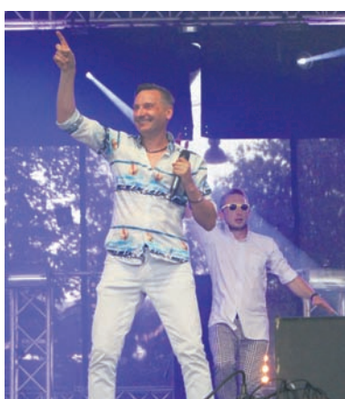
Zespół Skaner zabrał nas w świat hitów sprzed lat.