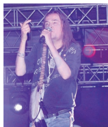
Zespół Wilki zagrał podczas finału sobotnich koncertów.