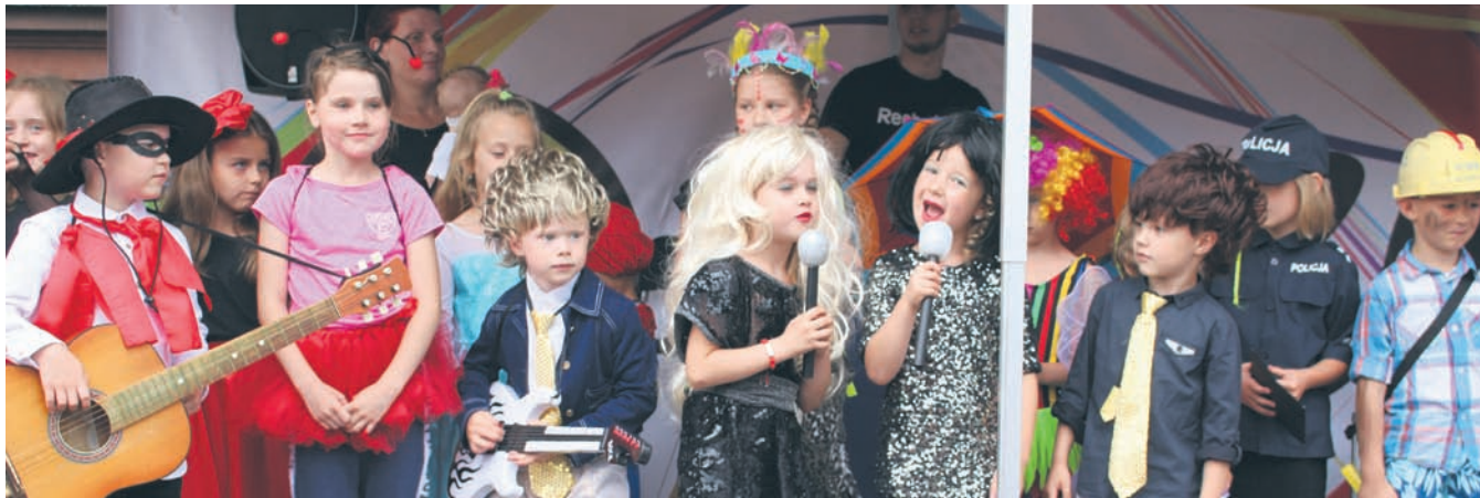
Na scenie można było zobaczyć przeróżne kreacje.

Moc wrażeń czekała na dzieci w sobotę (2.06) na rynku w Nowym Bytomiu. Najmłodszy mieszkańcy naszego miasta wzięli udział w zabawach i konkursach, zorganizowanych z okazji Dnia Dziecka. Występ najmłodszych i ich rodziców, przedstawienie interaktywne, pokazy tańca oraz sztuk walki, konkurs na najpiękniejsze przebranie, a także ekogra miejska zorganizowana przez „Wiadomości Rudzkie” to tylko niektóre atrakcje. Głównym organizatorem imprezy był Miejski Ośrodek Sportu i Rekreacji.