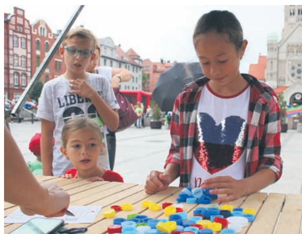
Jedną z atrakcji była ekogra organizowana przez „Wiadomości Rudzkie”.