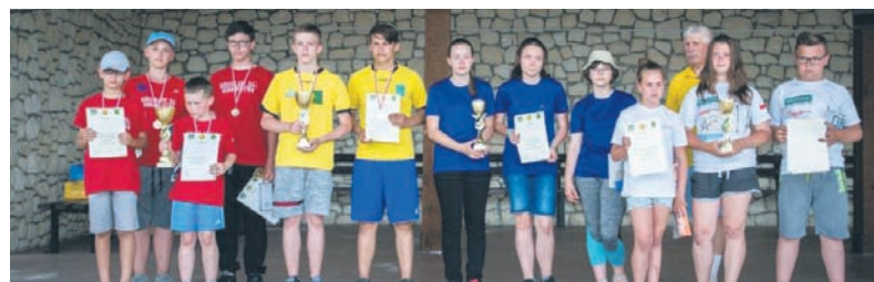
Rudzcy łucznicy zdobyli osiem medali indywidualnie i pierwsze miejsce drużynowo.

Osem medali zdobyło trzynastu rudzkich łuczników podczas Wojewódzkich Zawodów Łuczniczych w miejscowości Kije w województwie świętokrzyskim. Młodzi zawodnicy wystrzelali cztery złote, dwa srebrne i dwa brązowe medale, a także pierwsze miejsce w klasyfikacji drużynowej.