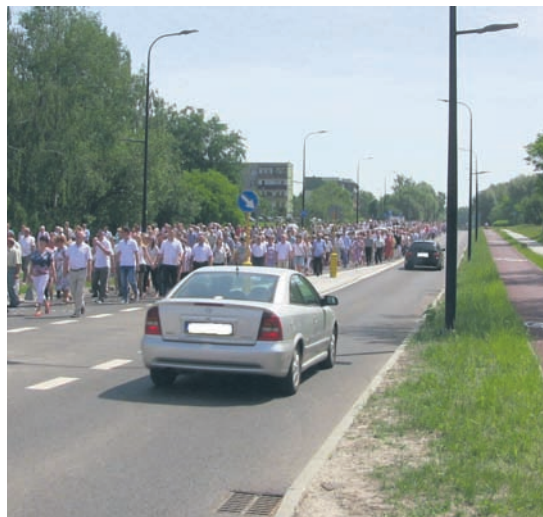
Zdjęcie ul. Górnośląskiej nadstawiane przez Czytelnika.

Tak było m.in. w przypadku ulicy 1 Maja, gdzie po jednej stronie drogi umieszczony był ołtarz, ale cień padał na drugą stronę