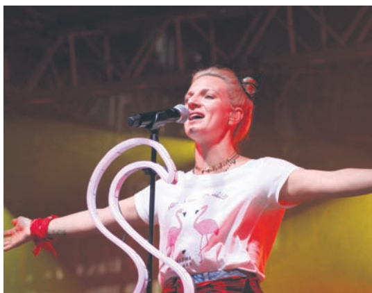
Widzowie byli pod wrażeniem sobotniego występu Sarsy.