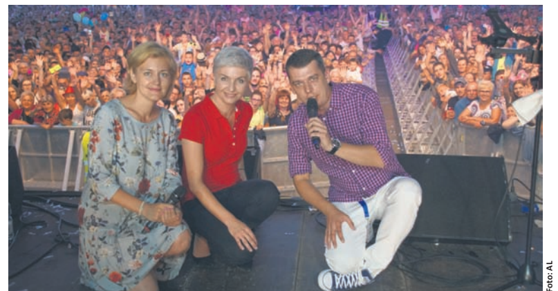
W tegorocznych Dniach Rudy Śląskiej wzięły udział tłumy publiczności.