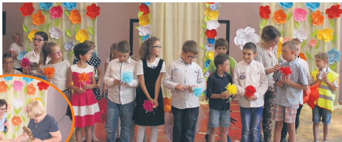
Na finał TGON przygotowano występy artystyczne.

W ramach święta niepełnosprawnych odbyły się m.in.: Olimpiada Radości, Turniej Bowlingowy, Śląski Turniej Piłki Nożnej, Pochód Godności, piknik sportowy w Szkole Podstawowej nr 15 Sportowej, konkurs karaoke, piknik ro-