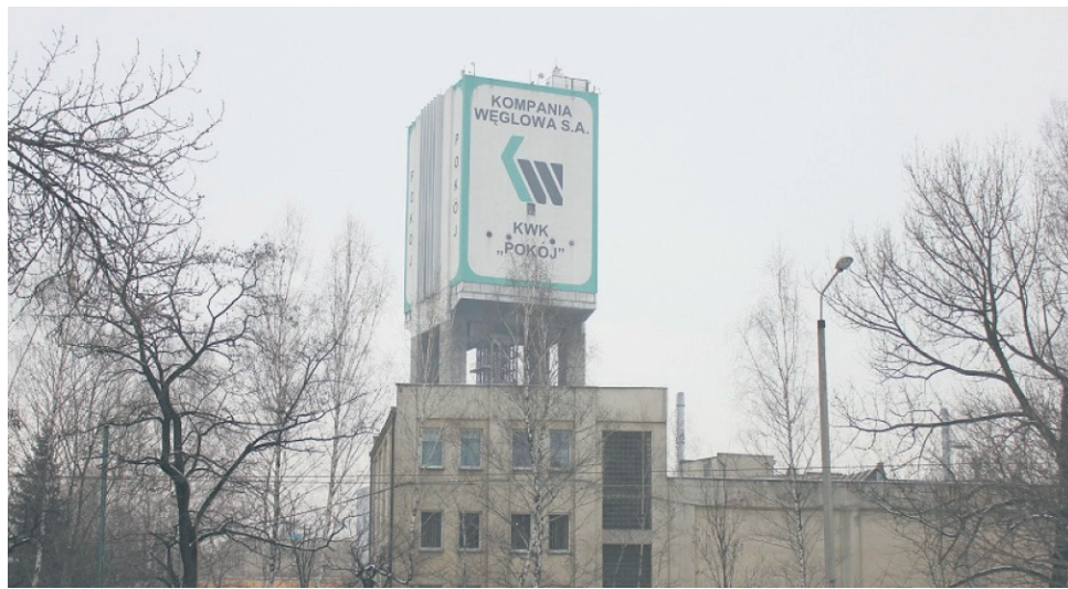
Wątpliwości władz miasta dotyczą wydobycia pod Wirkiem.

Jesienią ubiegłego roku władze Rudy Śląskiej miały sporo zastrzeżeń odnośnie planów fedrowania pod dzielnicą Wirek. Jednak 13 lipca Komisja ds. Ochrony Powierzchni Wyższego Urzędu Górniczego pozytywnie zaopiniowała program eksploatacji górniczej. Stało się tak po kompromisie pomiędzy zarządem miasta i Polską Grupą Górniczą, który udało się osiągnąć po wprowadzeniu do planów oczekiwanych przez miasto zmian. Teraz jedna i druga strona czekają na decyzję ze strony Okręgowego Urzędu Górniczego w Katowicach.