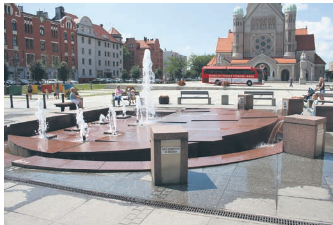
Przy fontannie na placu Jana Pawła II umieszczona jest informacja o zakazie kąpieli.