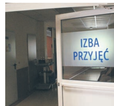
Od początku wakacji w rudzkiej Izbie Przyjęć przyjęto ok. 3 tys. pacjentów.