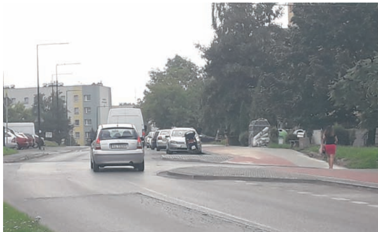
Kierowcy narzekają na zwężenie jezdni przez wysepkę.

Już niedługo ruch na ul. Obrońców Westerplatte będzie znowu sprawnie przebiegał, ponieważ wysepka zostanie zmniejszona, co z kolei wpłynie na poszerzenie jezdni. Przebudowa wysepki przy