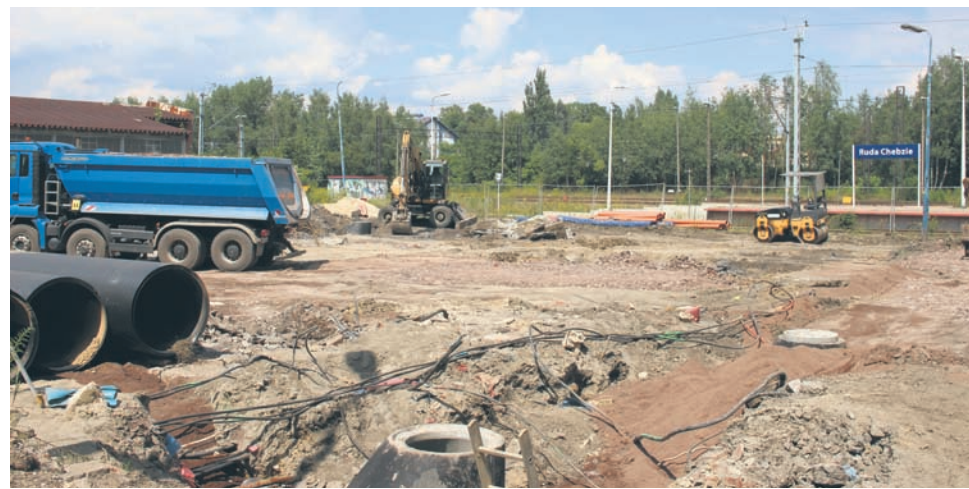
Obecnie trwa budowa parkingu przy ul. Przedtorze (za budynkiem dworca kolejowego).

Wielkie zmiany w Chebziu. Trwa tam nie tylko przebudowa dworca kolejowego na centralę Miejskiej Biblioteki Publicznej, ale również rozpoczęły się prace nad stworzeniem centrum przesiadkowego. Inwestycja, warta ok. 13 mln zł, ma ułatwić pasażerom przemieszczanie się pomiędzy poszczególnymi środkami transportu.