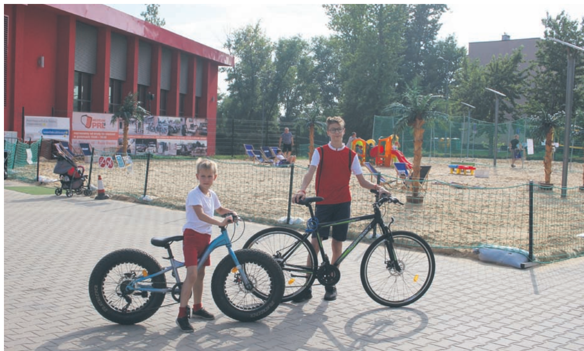
Podczas pikniku rowerowego nie zabraknie atrakcji dla dzieci.