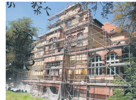
Prace prowadzone są także na zewnątrz Florianki.

Oprócz remontu Florianki przy ul. Niedurnego 73 równocześnie trwa przebudowa budynku przy