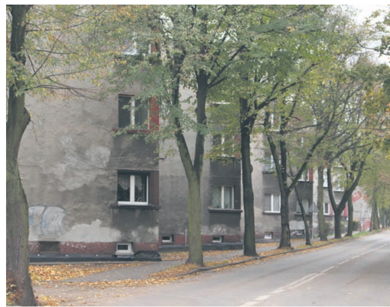
W najbliższym czasie termomodernizowane będą budynki przy ul. Matejki 2-12.

W październiku br. zakończyły się inwestycje dotyczące budynków przy ul. Dąbrowskiego 9a, Wita Stwosza 3, Różyckiego 19 oraz Kubiny 31. Trzy ostatnie budynki zostały podłączone także do sieci c.o. Na te zadania oraz prace przy ul. Matejki miasto pozyskało środki unijne w wysokości ok. 8,5 mln zł. To nie koniec starań rudzkich samorządowców o zewnętrzne fundusze na poprawę efektywności energetycznej budynków komunalnych. – Złożyliśmy już wnioski na blisko 1,5 mln