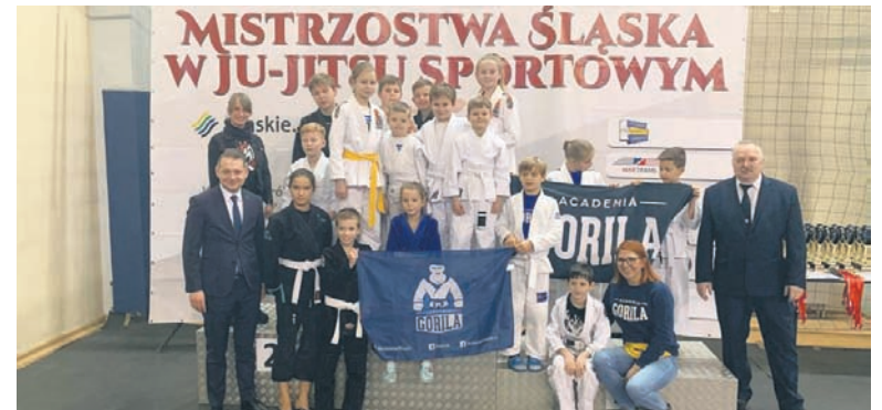
Minione dwa tygodnie były owocne dla najmłodszych zawodników Akademii Gorila.