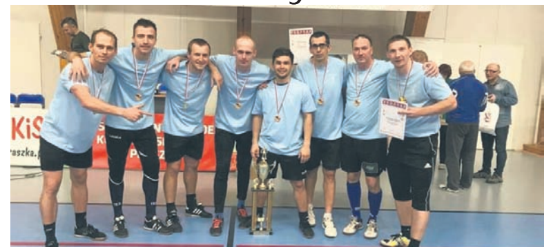
Pierwsze miejsce w Praszce zajęła drużyna składająca się z rudzkich nauczycieli.

W turnieju wzięło udział siedem drużyn reprezentujących Nysę, Włoszczowę, Wołczyn, Turek, Praszkę, Rybnik i Rudę Śląską. Mecze rozgrywano na hali sportowej „Kotwica” w Praszce systemem każdy z każdym po 15 minut. Tytułu z poprzedniego roku miała zamiar obronić drużyna z Włoszczowy. Jednak w efekcie uległa zawodnikom z Rudy Śląskiej, którzy zdobyli mistrzostwo. Ruzdzanie pokonali kolejno: Turek (2:1), Włoszczowę (3:1), Rybnik (5:0), Praszkę (2:1) i Wołczyn (2:0), dzięki czemu już przed ostatnim meczem zapewnili sobie tytuł mistrzowski. Być może świadomość, że nikt nie jest w stanie odebrać im pucharu, spowodowała rozluźnienie u zawodników, ponieważ