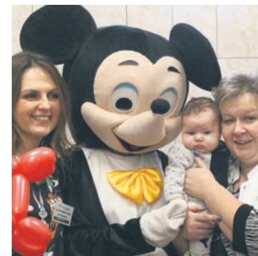
Wigilia wcześniaka odbyła się po raz szósty.

W rudzkim szpitalu ratowane są dzieci od 26. tygodnia ciąży, jednak były także przypadki uratowania wcześniaczek z 23. tygodnia ciąży. Od sześciu lat część z nich spotyka się podczas wigilii wcześniaka w Szpitalu Miejskim w Goduli. – To fantastyczny moment, kiedy możemy zobaczyć maluszki, które do nas wracają. Mamy