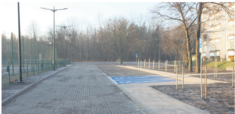
Przy Szkole Podstawowej nr 27 w Halembie pojawiły się nowe miejsca parkingowe.

Zakończyła się budowa parkingu na 60 miejsc przy Szkole Podstawowej nr 27 w rejonie ulic Modrzewiowej oraz Grabowej w dzielnicy Halemba. Zadanie objęło wykonanie jezdni manewrowej, odwodnienia oraz oświetlenia. Całkowity koszt inwestycji wyniósł 615 tys. zł.