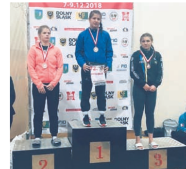
Zapaśniczki Slavii po raz kolejny pokazały, że stać je na wiele.

– Dla niektórych zawodników były to pierwsze kroki stawiane na zapaśniczych matach i z pewnością w pokonaniu stresu przedstartowego pomógł im doping oraz wsparcie ze strony sporej liczby zgromadzonych na trybunach kibiców. Jak przystało na Turniej Mikołajkowy, nie mogło zabraknąć prezentów, a każdy z uczestników został hojnie obdarowany przez Mikołaja w którego rolę tym razem