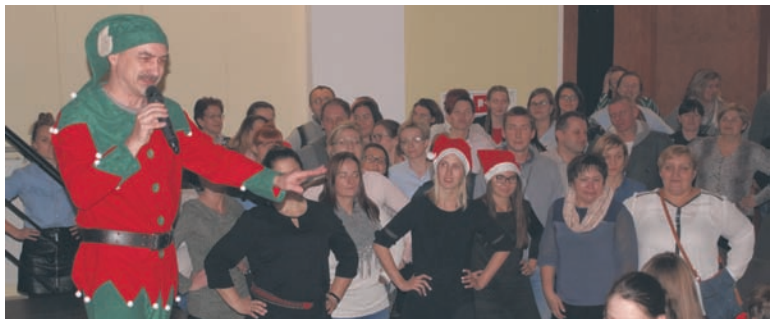
Podczas koncertu nie brakowało atrakcji.