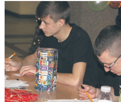
Wolontariusze ze sztabu w MCK-u do późnych godzin przeliczali kwotę, jaką udało się zbierać w Rudzie Śląskiej.

Dodajmy, że w tym roku podczas finału WOŚP zbierano pieniądze na zakup nowoczesnego sprzętu medycznego dla specjalistycznych szpitali dziecięcych z oddziałami o drugim lub trzecim stopniu referencyjności. Ruda Śląska gra z orkiestrą od samego początku. Oddział Neonatologiczny w Rudzie Śląskiej otrzymał od WOŚP m.in. respirator oscylacyjny, aparaty do nieinwazyjnego wspomaganie oddychania u noworodków, ultrasonograf, inkubatory, laktatory, podgrzewacze do mleka, urządzenia