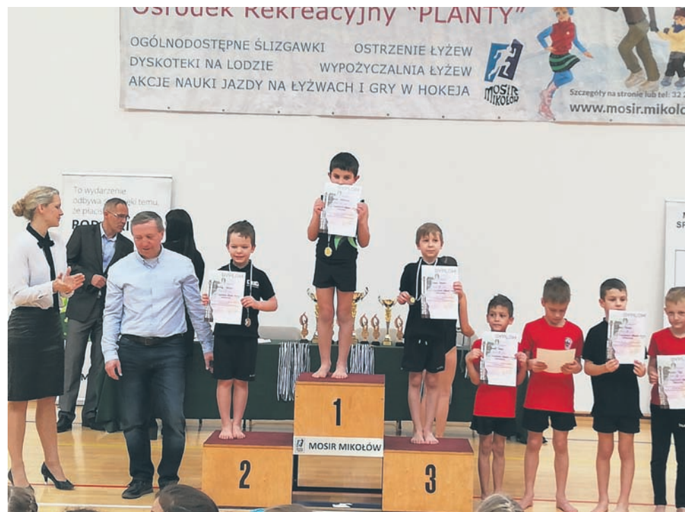
Rudzcy akrobaci mogą popisać się kolejnymi sukcesami.