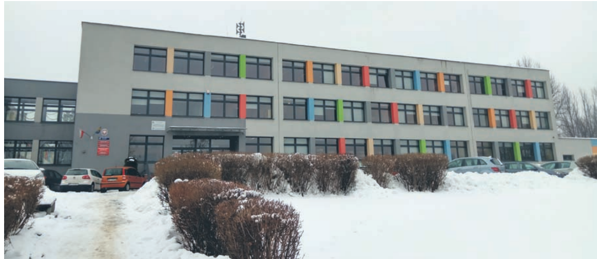
Walka z nieprzyjemnymi zapachami trwa w szkole od roku.

Natomiast na ten rok w budżecie miasta zarezerwowano 100 tys. zł na wykonanie kolejnych zadań. – Jeżeli chodzi o prace, jakie zamierzamy wykonać w Zespole Szkół Ponadgimnazjalnych nr 2 przy ul. Glinianej 2 to