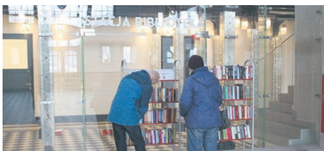
Od niedawna w Chebziu działa również bookcrossing.