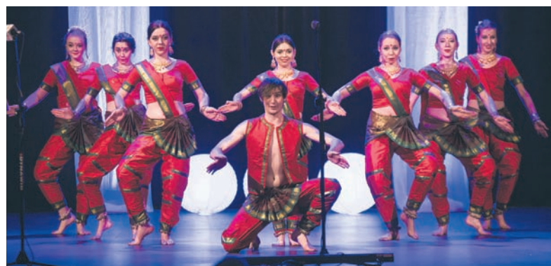
Na gali nie brakuje niezapomnianych występów artystycznych.

Ruszył Plebiscyt na Sportowca i Trenera 2018 Roku, który już po raz 26. organizuje redakcja „Wiadomości Rudzkich”. W tym roku znowu wspólnie z Wami wybierzemy najlepszych sportowców z Rudy Śląskiej. Czekamy na zgłoszenia kandydatów do 25 stycznia.