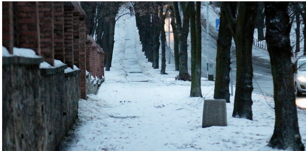
Mieszkańcy mają trudności z przejściem po chodniku przy ulicy Nowary.