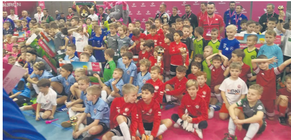
Młodzi zawodnicy pokazali, że są w dobrej formie.

W piątek (11.01) młodzi zawodnicy Grunwaldu z rocznika 2011 sprawdzili swoje siły w turnieju finałowym Tauron Energetyczny Junior Cup, do którego wywalczyli awans w październikowych eliminacjach. W finale, który odbył się w Krakowie, zagrały 24 drużyny z południowej Polski. Finałowe zmagania toczyły się w trzech kategoriach wiekowych – roczniki 2009 (dziewięć drużyn), 2010 (osiem drużyn) i 2011 (siedem drużyn).