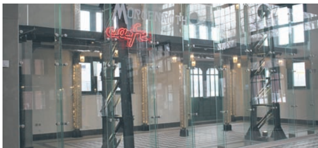
Na Stacji Biblioteka będzie działała także kawiarnia.