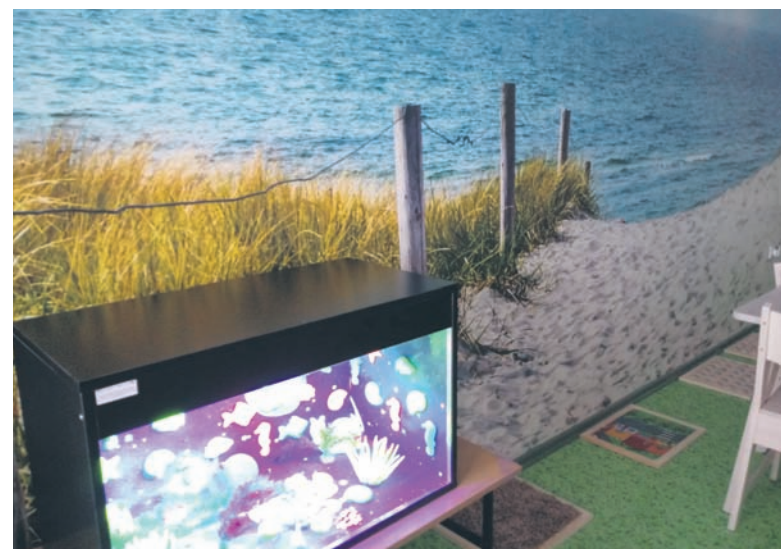
Ze środków unijnych SP nr 16 wyposażono m.in. w salę sensoryczną.

Z kolei nauczyciele w ramach programu doskonalą umiejętności zawodowe w zakresie indywidualizacji pracy z uczniem oraz efektywnego stosowania metod w kształtowaniu u uczniów kompetencji niezbędnych na rynku pracy. – Zajęcia dotyczą m.in. planowania i modyfikowania procesów edukacyjnych oraz opracowania modelu wspierania uczniów w nabywaniu umiejętności