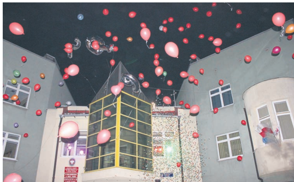
W Kochłowicach wypuszczono światelko do nieba w różnych odśłonach. Było kolorowo i radośnie, a wszystko to w atmosferze pomagania.