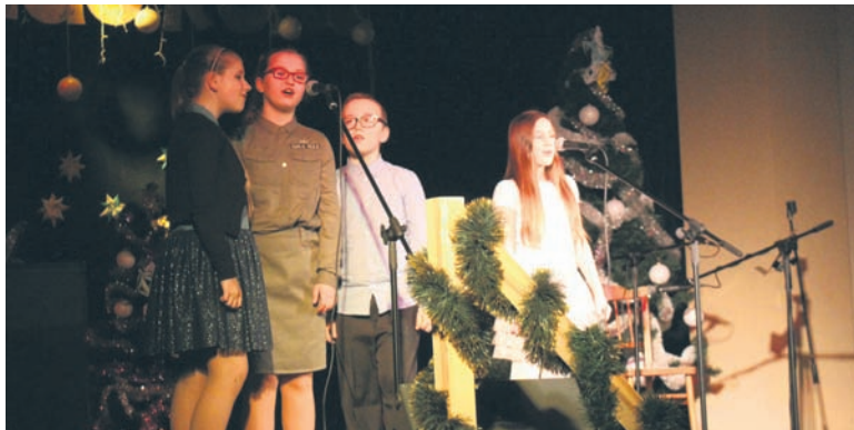
Podczas koncertu zaprezentowali się m.in. wychowankowie Młodzieżowego Domu Kultury nr 1 w Bytomiu.