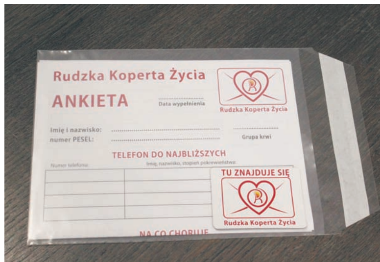
Rudzka Kopertę Życia przechowuje się w lodówce. Znajduje się w niej informacja o stanie zdrowia, zażywanych lekach oraz kontakt do najbliższych.