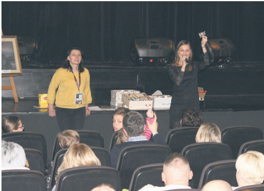
W przerwach pomiędzy koncertami odbyły się licytacje przedmiotów.

Już po raz 27. Ruda Śląska włączyła się w Wielką Orkiestrę Świątecznej Pomocy. Około 450 wolontariuszy na zakup nowoczesnego sprzętu medycznego dla specjalistycznych szpitali dziecięcych zebrało ponad 200 tys. zł. W ramach 27. finału WOŚP w miniony weekend w Zespole Szkół Ogólnokształcących nr 3 odbył się Koncert Młodych Talentów, wielka aukcja fantów i światelko do nieba. W akcję włączył się także Zespół Szkół Ogólnokształcących nr 4 im. H.C. Hoovera, który zorganizował m.in. koncerty oraz licytacje w Miejskim Centrum Kultury.