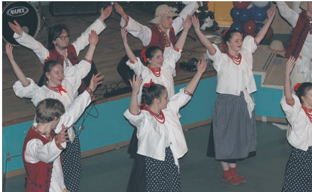
Koncert Młodych Talentów cieszył się dużym zainteresowaniem publiczności.