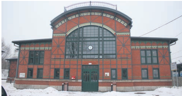
Na zewnątrz budynek zachował swój historyczny wygląd.

Z popadającego w coraz większą ruinę budynku zmienił się w nowoczesny obiekt, którego mogą nam pozazdrościć mieszkańcy pozostałych części kraju. Mowa o budynku dworca PKP w Chebziu, który przeszedł gruntowną renowację. Konstrukcja jest już gotowa i można ją podziwiać. Teraz czas na przetarg i wyposażenie nowej centralnej siedziby Miejskiej Biblioteki Publicznej w Rudzie Śląskiej.