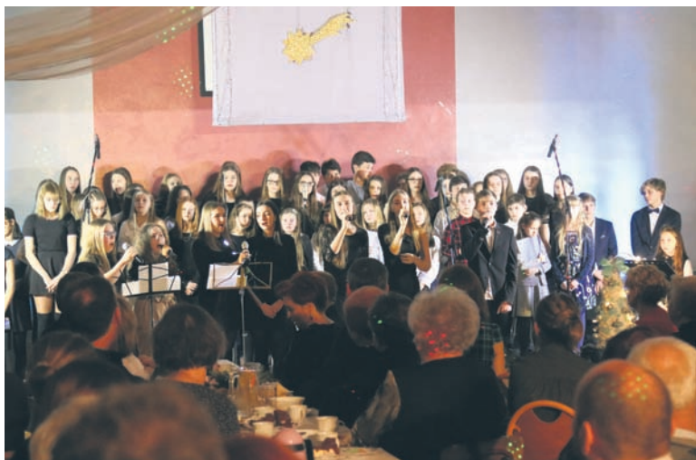
Uczniowie SP nr 24 wystąpili dla swoich najbliższych.