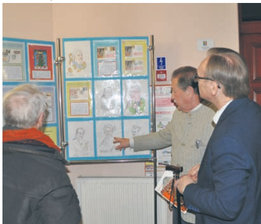
Wystawę w MBP nr 18 można oglądać do końca stycznia.