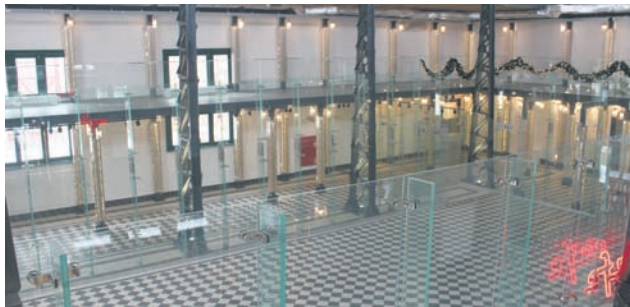
Natomiast w środku została utworzona nowoczesna, przeszklona biblioteka.