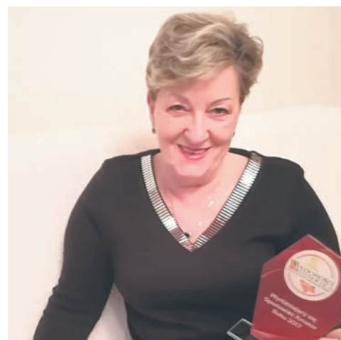
Pływaczka otrzymała statuetkę podczas zeszłorocznego plebiscytu.

– Jedno z moich największych marzeń udało mi się już zrealizować. Przepłynęłam Wisłę w pław. Coś, co na początku wydawało się niemożliwe, stało się prawdą. Uważam to za sukces życia i jestem z tego dumna. Teraz też mam w głowie wiele innych marzeń i planów na przyszłość.