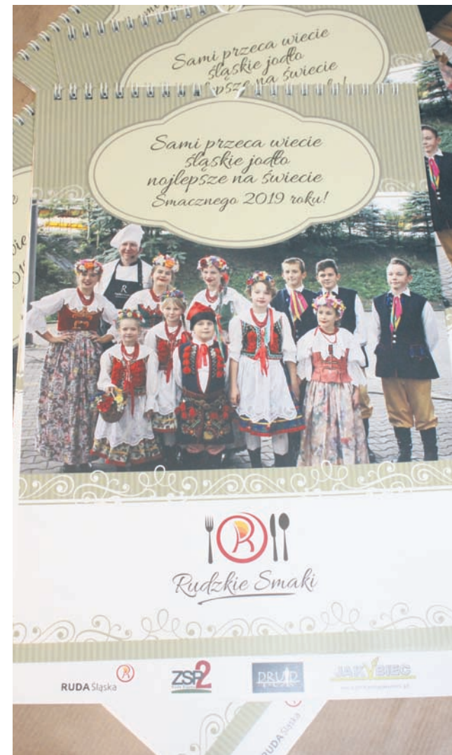
Podsumowaniem konkursu jest kalendarz z przepisami laureatów.

Kalendarz „Rudzkie Smaki” to wyjątkowa publikacja, składająca się z przepisów nadesłanych przez mieszkańców. Uczestnicy konkursu dzielą się recepturami na swoje sprawdzone dania i smakołyki. Często są to przepisy przekazywane z pokolenia na pokolenie. Co miesiąc najlepsze propozycje są nagradzane i to właśnie one są prezentowane w kalendarzu.