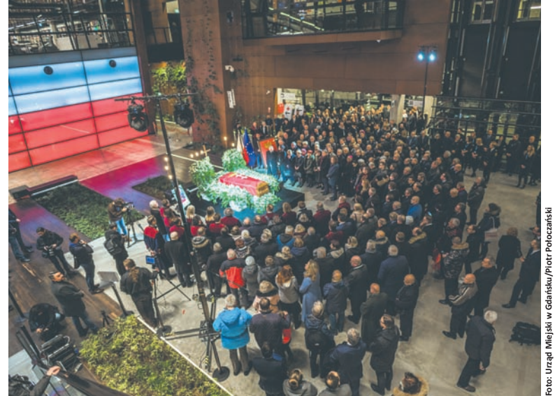
Gdańszczanie tłumnie żegnali swojego prezydenta.

Podczas pogrzebu homilię wygłosił metropolita gdański arcybiskup Sławoj Leszek Głódź, który mówił m.in. o tym, jak wiele prezydent Paweł Adamowicz zrobił dla Gdańska, a także dla kościoła. Nawiązał również do tragicznych wydarzeń z 13-14 stycznia. – Potrzeba nam budowniczych pokoju i braterstwa. Śmierć naszego brata Pawła wstrząsnęła wspólnotą narodu. Ku naszemu miastu i ojczyźnie nadbiegło pytanie Boga, skierowane ku Kainowi: „Cóż uczynił? Krew brata twego woła do mnie głośno z głębi ziemi?” Przez wielu ta tragedia zabrzmiała niczym dzwon na trwogę. Wezwanie do przemiany naszego życia. Do definitywnego wyrugowania z polskiej polityki języka pogardy, poniżania, deprecjonowania, odzierania ze czci i godności naszych braci, bliskich, niedawnych przyjaciół. Tak być nie może. Mówimy stop. Włosi mówią „basta”. To pycha buduje mury osobności, niezdolna do refleksji. Trzeba nam braterstwa serc, dłoni otwar-