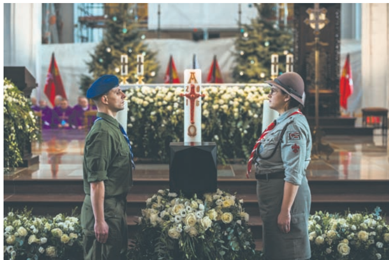
W uroczystościach pogrzebowych Pawła Adamowicza uczestniczyło ok. 3,5 tys. osób.