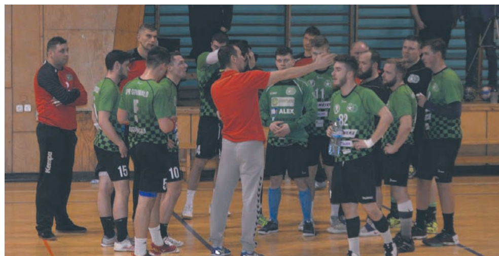
Ostatni mecz dał szczypiornistom Grunwaldu powód do radości.

Rudzcy szczypiornisiści po raz kolejny pokazali, że stać ich na wiele. W rozgrywanym awansem spotkaniu II ligi mężczyzn piłkarze ręczni Grunwaldu bez problemu pokonali młodych zawodników drugiej drużyny Stali Mielec. Przed spotkaniem nietrudno było wskazać faworyta meczu. Pozycja w tabeli wskazywała, iż to gospodarze powinni poradzić sobie bez problemów ze Stalą Mielec i zainkasować kolejne trzy punkty. Co prawda to goście zdobyli pierwszą bramkę, ale było to ich ostatnie prowadzenie w tym meczu. Z minuty na