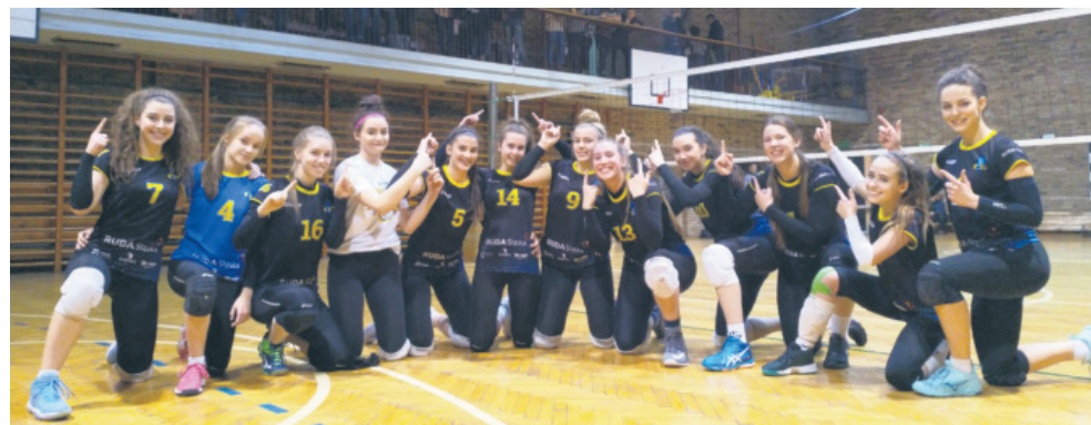
Siatkarki nie dały szans swoim przeciwnikom.

W szkolnych salach sportowych w Rudzie Śląskiej odbył się turniej 1/4 Mistrzostw Śląska Juniorek, którego stawką był awans do półfinałów tych rozgrywek i znalezienie się w grupie ośmiu najlepszych zespołów w województwie. W rezultacie to ruzdzianki pokonały swoich przeciwników.