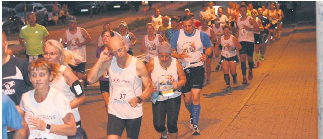
Ubiegłoroczna edycja Rudzkiego Półmaratonu Industrialnego zgromadziła na starcie blisko 1000 biegaczy.