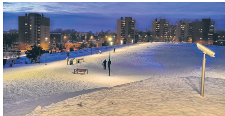
Mieszkańcy, w tym zwłaszcza dzieci, mogą już korzystać z atrakcji na terenie hałdy.

Te dwa odcinki to tak naprawdę środkowa część Traktu Rudzkiego. Będzie on