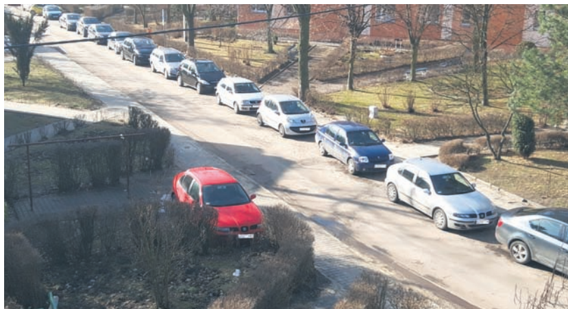
Przy ulicy Brodzińskiego trudno o wolne miejsce parkingowe.

Mieszkańcy ulicy Brodzińskiego w Halembie dobrze wiedzą, jak dużym problemem jest znalezienie miejsca parkingowego w godzinach popołudniowych. W końcu pojawiła się szansa na uporządkowanie sprawy parkowania i powstanie nowych miejsc parkingowych. Po konsultacjach okazało się jednak, że większość mieszkańców dodatkowego parkingu... nie chce.