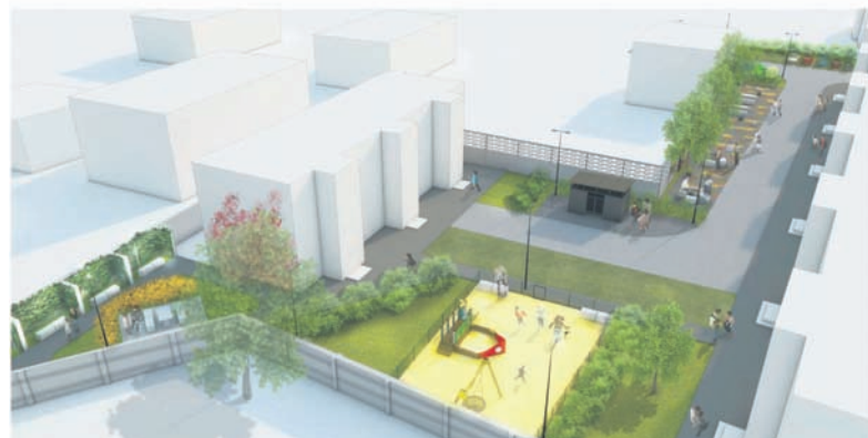
Wizualizacja renowacji podwórka przy ulicy Strażackiej 12/Kaśusa 18-28 w Wirku.

– Przy rewitalizacji podwórek chcemy wykorzystywać potencjał mieszkańców, którzy uczestniczą w tym procesie. Istnieje bowiem pewna prawidłowość, że im bliżej miejsca zamieszkania znajduje się dane przedsięwzięcie, tym nasze zaangażowanie jest większe – podkreśla prezydent Grażyna Dziedzic. To właśnie aktywizacja i zaangażowanie samych mieszkańców jest wyróżnikiem rudzkiego