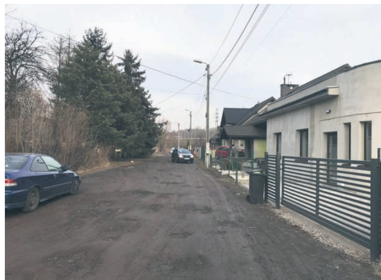
Gruntowa ulica Kossaka zostanie całkowicie przebudowana. Powstanie m.in. nowa jezdnia z chodnikiem.

W tym roku w budżecie Rudy Śląskiej zaplanowano także blisko 5 mln zł na przebudowę dróg dojazdowych do zbyt wielu przez miasto nieruchomości. Tu, podobnie jak w przypadku dróg gruntowych, kolejność realizacji inwestycji uzależniona jest od harmonogramu i realizacji robót kanalizacyjnych. Miasto posiada już gotowe dokumentacje do przebudowy następujących ulic: Głogowej, Kwapulińskiej, Akacjowej, Leszczyńskiej, Pluty i Górnej. W trakcie realizacji są opracowania dla przebudowy ul. Kaszubskiej, Rogozińskiego i Noblistów Śląskich.