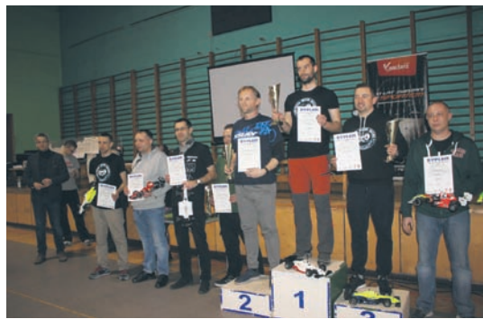
Zawody na hali odbyły się po raz pierwszy.

Eliminacje i finały Halowych Mistrzostw Polski Samochodów Zdalnie Sterowanych On-Road odbyły się w weekend (9-10.03) w hali Miejskiego Ośrodka Sportu i Rekreacji w Halembie. W imprezie wzięło udział kilkudziesięciu zawodników z całej Polski. Wyścigi zostały rozegrane w klasach: E-10 Formuła, E-10 GT, E-10 Kadet, E-10 TC Spec 13.5, E-10 TC Spec 17.5, E-12 oraz E-14 Rally. Halowe zawody w Rudzie Śląskiej rozegrane zostały po raz pierwszy na hali. Do tej pory odbywały się na torze przy ul. Kolberga.