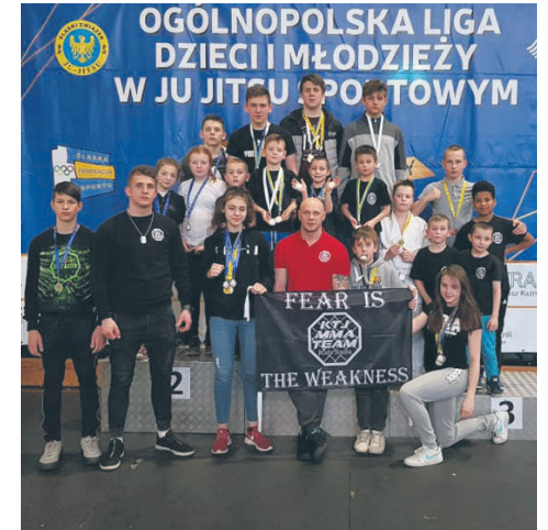
Młodzi zawodnicy dobrze spisali się na zawodach w Mysłowicach.