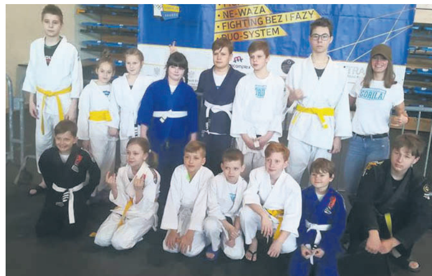
Najmłodszy zawodnicy Akademii Gorilla przywieźli z zawodów siedem medali.

W miniony weekend dobrze spisali się najmłodszy zawodnicy Akademii Gorilla, którzy wywalczyli siedem medali w Ogólnopolskiej Lidze Dzieci i Młodzieży w Ju-Jitsu Sportowym. Dzieciaki swoim startem udowodniły, że z turnieju na turniej nabierają coraz większe-