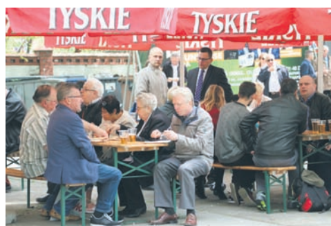
Festyn tradycyjnie odbył się w ogrodach MCK-u.