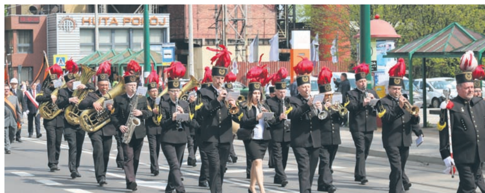
Tradycyjnie hutnikom towarzyszyła orkiestra dęta „Pokój”.