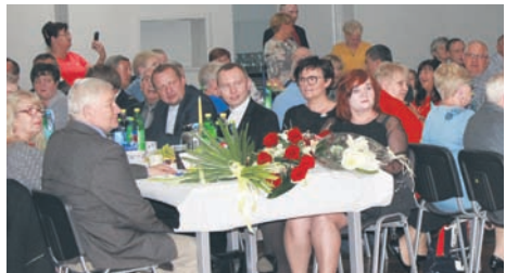
Stowarzyszenie działa w Rudzie Śląskiej już 25 lat.

Rudzkie Stowarzyszenie Rodzin Abstynenckich „Zdrowe Życie” pomaga osobom uzależnionym po przebytej terapii oraz rodzinom osób uzależnionych. Celem jego działalności jest przede wszystkim niesienie