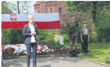
Również w Orzegowie uczczono ważne dla regionu wydarzenia.

chrześcijańskie, takie jak praworządność czy równość, pozwoliły zjednoczyć polski naród – zauważyła. – Dziś oddajemy również hołd naszym przodkom, którzy 98 lat temu wzięli udział w III Powstaniu Śląskim. Jesteśmy im winni pamięć i szacunek, bo to dzięki powstańcom przetrwaliśmy i mamy dziś wolny, niepodległy kraj – mówiła wiceprezydent.