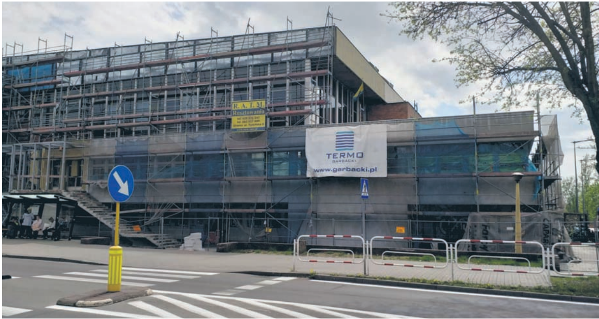
Termomodernizacja hali sportowej w Halembie wsparta została środkami z Metropolii.

– Pieniądze z Metropolitalnego Funduszu Solidarności przeznaczone są na konkretne zadania, które po realizacji są dla mieszkańców widoczne gołym okiem. Przypomnę, że w ubiegłym roku z tych środków mogliśmy w części sfinansować budowę