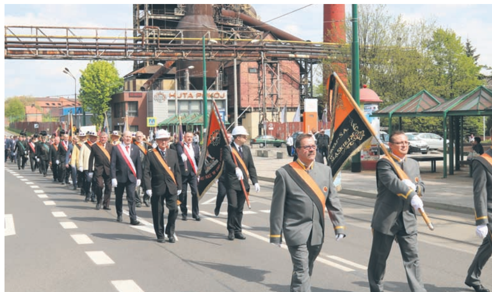
Przemarsz wyruszył sprzed głównej bramy Huty Pokój.

Uroczysty festyn rozpoczął się tradycyjnie życzeniami skierowanymi do wszystkich pracowników Grupy Kapitałowej Huty Pokój, w których to Zarząd podziękował za dotychczasową współpracę i trud włożony w dalszy rozwój Spółki. Po części oficjalnej, w rytmie dobrej muzyki i przy smacznej kiełbasce, pracownicy wraz ze swoimi bliskimi świętowali tegoroczny Dzień Hutnika.