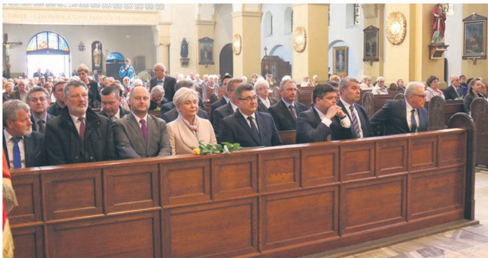
Msza św. w intencji hutników odbyła się w kościele pw. św. Pawła.