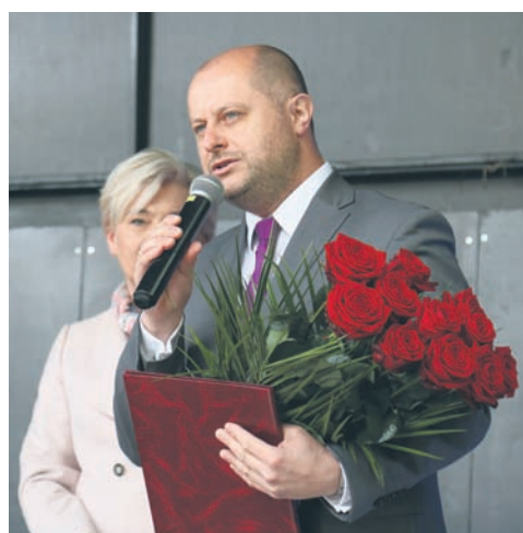
Nie brakowało życzeń i podziękowań.