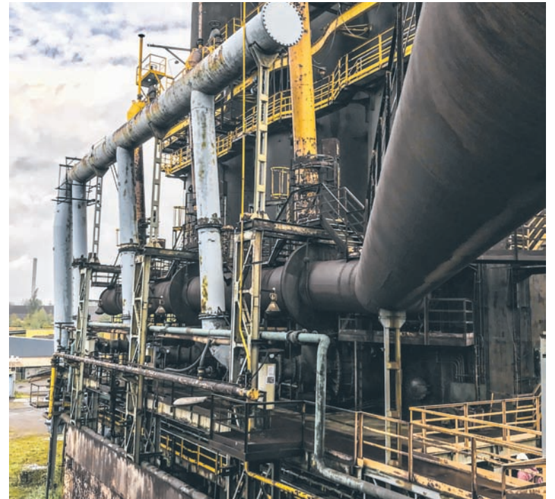
Do końca roku wyłoniony zostanie zwycięzca konkursu na koncepcję zagospodarowania Wielkiego Pieca.

Przypomnijmy, że miasto stało się formalnym właścicielem Wielkiego Pieca pod koniec 2018 r. Wtedy nastąpiła zamiana nieruchomości ze spółką Stalmag, która otrzymała prawo użytkowania wieczystego gruntu wraz z prawem własności budynku Bramy II, czyli byłej portierni Huty „Pokój”. W zamian, na takich samych zasadach, miasto nabyło obiekt Wielkiego Pieca wraz z całą infrastrukturą towarzyszącą.