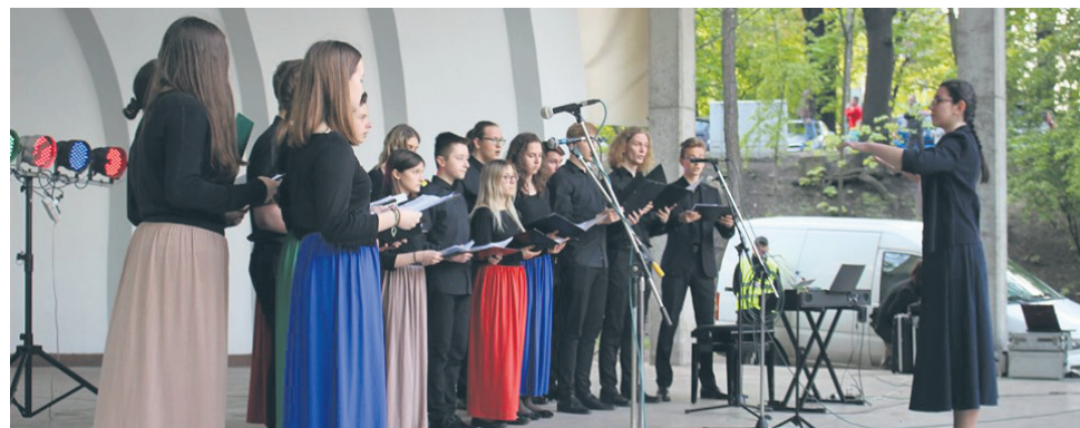
Młodzi muzycy wystąpili m.in. podczas festynu w Parku Koziół.

Uczniowie oraz pedagodzy Zespołu Szkół Muzycznych I i II stopnia uświetnili w ostatnich dniach dwa jubileusze – muzyczny i unijsny. 1 maja w Parku Koziół zorganizowany został festyn z okazji 15-lecia wstąpienia Polski do Unii Europejskiej. Natomiast w poniedziałek, 6 maja w Miejskim Centrum Kultury odbył się koncert „Stanisław Moniuszko – mistrz melodii naszych”.