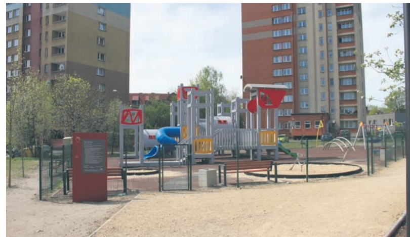
Plac zabaw na hałdzie został odnowiony.

Ponadto zostały już naprawiona luneta, tablica informacyjna oraz okoliczne ławki i kosze, które także zniszczono. – Szacunkowy koszt prac, które wykonano w ramach