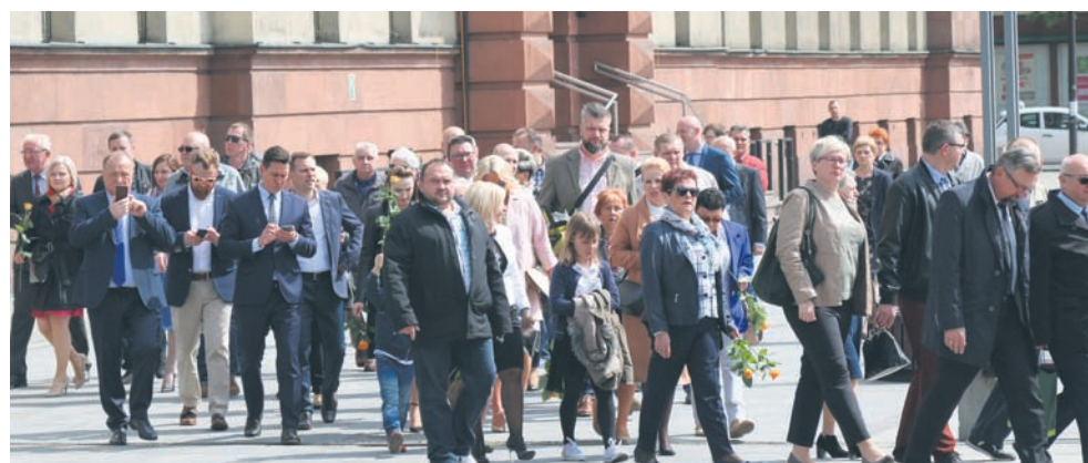
W obchodach brali udział pracownicy i ich rodziny.