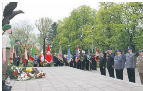
3 maja przed Pomnikiem Powstańców Śląskich w Kochłowicach złożono kwiaty.