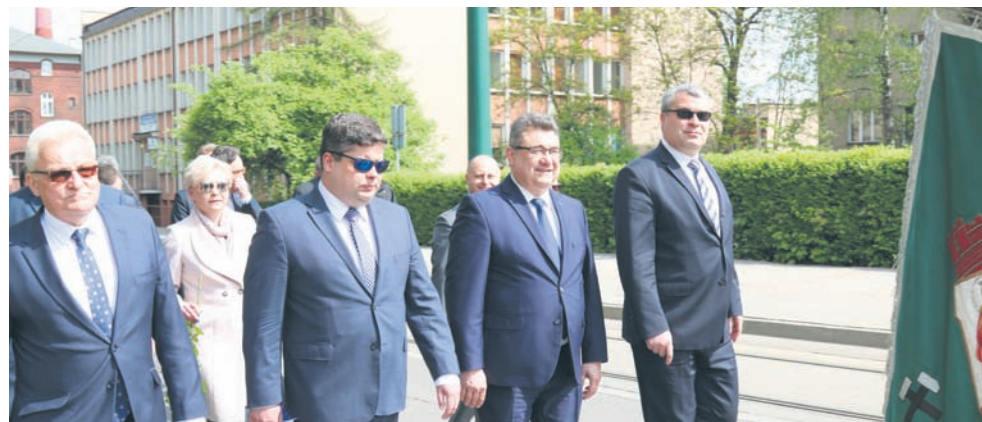
Zarząd i goście przeszli ulicami Nowego Bytomia.