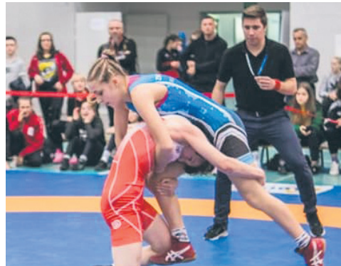
W ostatnich tygodniach rudzcy zapaśnicy zdobyli wiele złotych, srebrnych i brązowych medali.