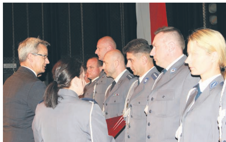
Wiceprezydent Krzysztof Mejer podziękował rudzkim policjantom za zaangażowanie i efektywną służbę.

Rudzka komenda policji może liczyć na owocną współpracę z miastem. Tylko w ubiegłym roku jej działania zostały dofinansowane kwotą blisko 400 tys. zł. Z puli tej 150 tys. zł przekazano na remont i modernizację Komisariatu nr V, 130 tys. zł na