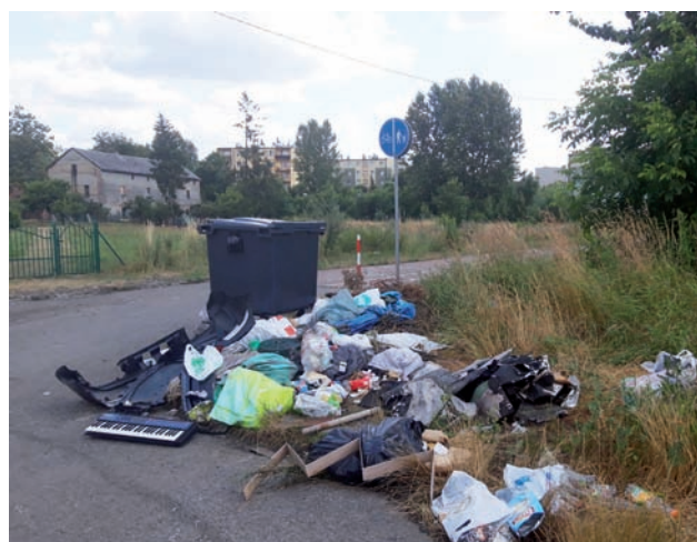
Śmieci wokół kontenerów powinien uprzątnąć zarządca terenu.

Dodajmy, że jeżeli chodzi o kontener, o którym pisze nasz Czytelnik, a który znajduje się przy przejściu z halembkiego targowiska w stronę ulicy Młyńskiej, jest on przeznaczony na