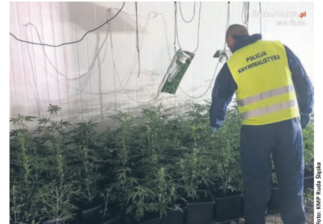
W ubiegłym tygodniu rudzcy policjanci zlikwidowali plantację marihuany.

Uprawa znajdowała się na granicy Chebzia i Rudy w jednej z hal magazynowych. Kryminalni zabezpieczyli 391 krzewów konopi oraz profesjonalny sprzęt do uprawy. Obecnie śledzą z rudzkiej komendy wyjaśniając okoliczności tej sprawy. Sprawdzają m.in., gdzie trafiały środki odurzające. Zatrzymano 35-letniego właściciela plantacji, który decyzją sądu został tymczasowo aresztowany.