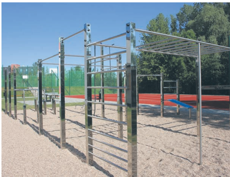
Przy ZSP nr 2 oprócz boisk powstała także strefa street workout.

Z kolei w przypadku zadania przy Zespole Szkół Ponadgimnazjalnych nr 6 przy ul. Kałusa 4 zakres inwestycji