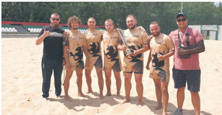
Brązowy medal Gryfy przywiozły z Sosnowca.

Rugbiści seniorzy KS Rugby Ruda Śląska wrócili z brązowymi medalami za trzecie miejsce w turnieju rugby na plaży. W sobotę (6.07) wzięli oni udział w Otwartych Mistrzostwach Śląska i Zagłębia w rugby plażowym, które odbyły się na Stadionie Ludowym w Sosnowcu. Trzecie miejsce wywal-