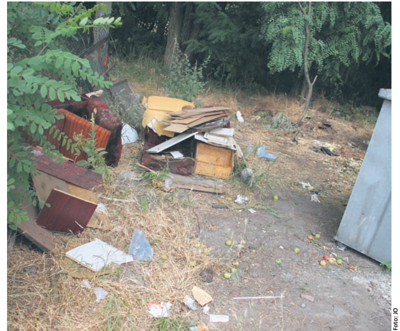
Problem polega na tym, że na śmietniki przy ROD-ach trafia prawie wszystko – także m.in. gabaryty.

Ponadto wiosną przyszłego roku podczas walnych spotkań przedstawicieli Rodzinnych Ogródków Działkowych wiceprezydent Mejer ma spotkać się z działkowcami, by przypomnieć im o zasadach gospodarowania odpadami. – Działkowcy powinni mieć większą świadomość odnośnie tego, że wyrzucając śmieci bez uprzedniej segregacji, robią krzywdę nie tylko sobie, ale wszystkim. Ponieważ to przekłada się później na koszty funkcjo-