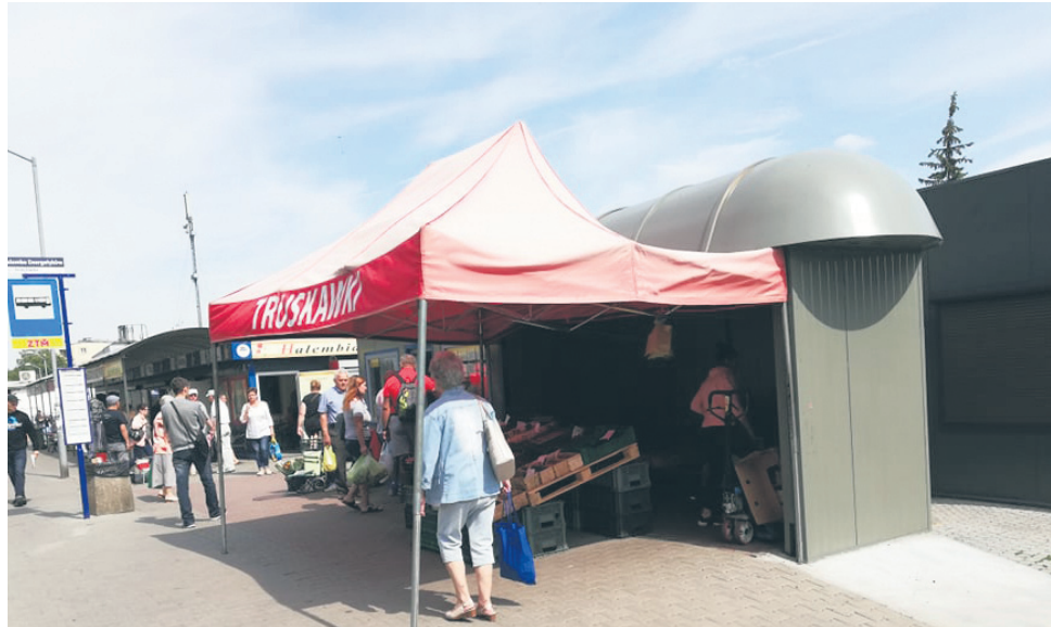
Z wiaty przystankowej przy ul. Solidarności mogą korzystać zarówno pasażerowie, jak i sprzedawcy.

Tłumaczy on także, że do targowiska od lat dba o wygląd wiaty. – W ubiegłym miesiącu zakończyliśmy remont obiektu (wiaty i kiosku), który kosztował całościowo ok. 25 tys. zł, w ramach czego m.in. przystanek został odmalowany. Myśle-