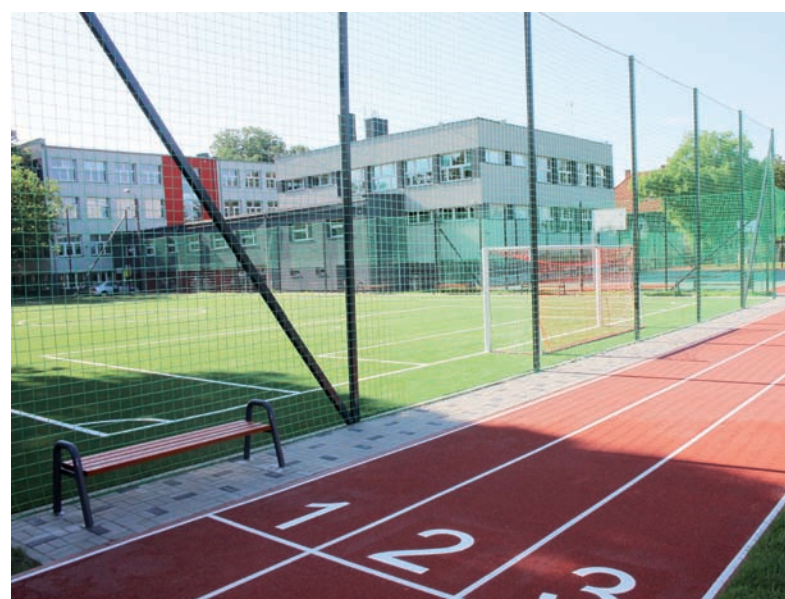
Kompleks boisk oraz bieżnia przy Zespole Szkół Ponadgimnazjalnych nr 6.

W obydwu lokalizacjach zostały zamontowane piłkochwyty, ławki, kosze na śmieci i tablice informacyjne. W obu przypadkach teren został uporządkowany, obsiany trawą i wyznaczone zostały ciągi komunikacyjne. Wykonano także ogrodzenie, rozbudowano oświetlenie terenu oraz monitoring wizyjny.