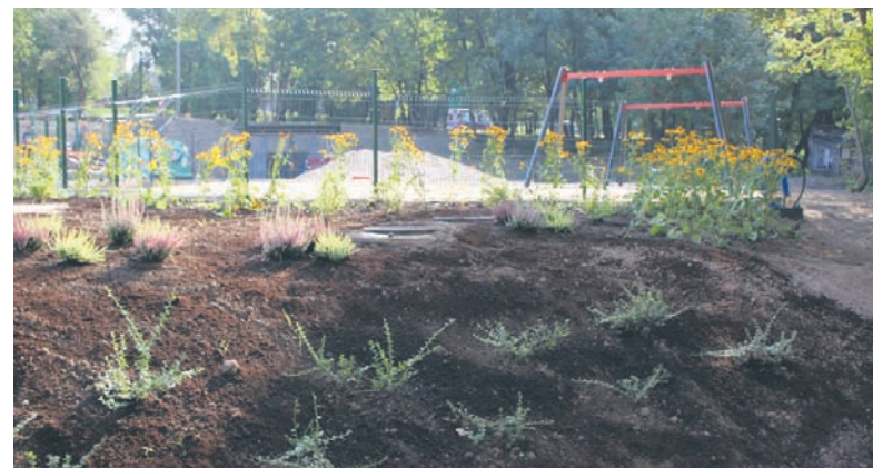
Podwórko w Wirku.

W ramach inwestycji przebudowano sieć kanalizacyjną i deszczową, wyznaczone zostały przestrzenie dla samochodów oraz dojścia dla pieszych. W ramach nowego zagospodarowania terenu powstało 37 miejsc parkingowych, wybudowany został także plac zabaw, wybudowany został także stojak na rowery oraz słupy oświetleniowe. Zamontowano plac zabaw dla młodszych dzieci i urządzenia sprawn-