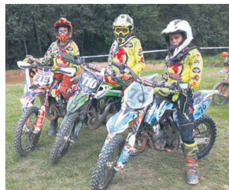
Zawody w Czechach pokazały, że młodych zawodników stać na wiele.