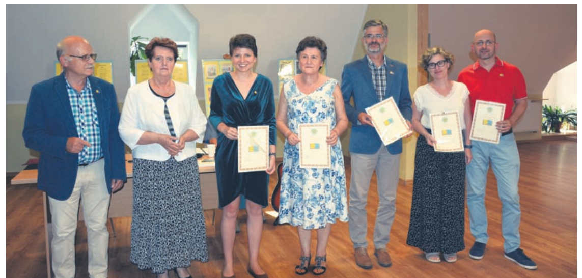
Oto tegoroczni „Pszocieli Ślōnski Godki”.