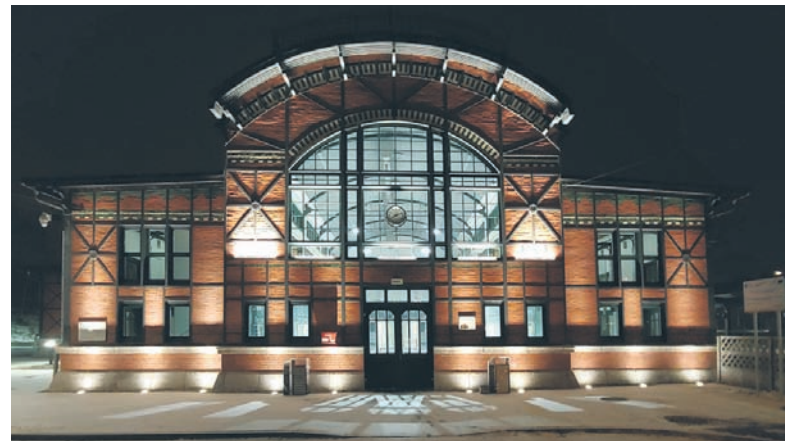
Dworzec w Chebzie.

Czwartą inwestycją na liście konkursowej jest zrewitalizowane podwórko w Wirku. Przedmiotem projektu było zagospodarowanie przestrzeni miejskiej, polegające na renowacji i rewitalizacji podwórka przy ulicach Juliana Tuwima i Odrodzenia. Celem tego przedsięwzięcia było podniesienie jakości przestrzeni wspólnej i aktywizacja społeczności lokalnej. Zakres prac obejmował roboty dotyczące utwardzenia i odwodnienia terenu, budowy dojazdów, dojazdów, chodników, miejsc spotkań mieszkańców i placów zabaw z elementami małej architektury, oświetlenia terenu oraz adaptacji i uzupełnienia istniejącej zieleni.