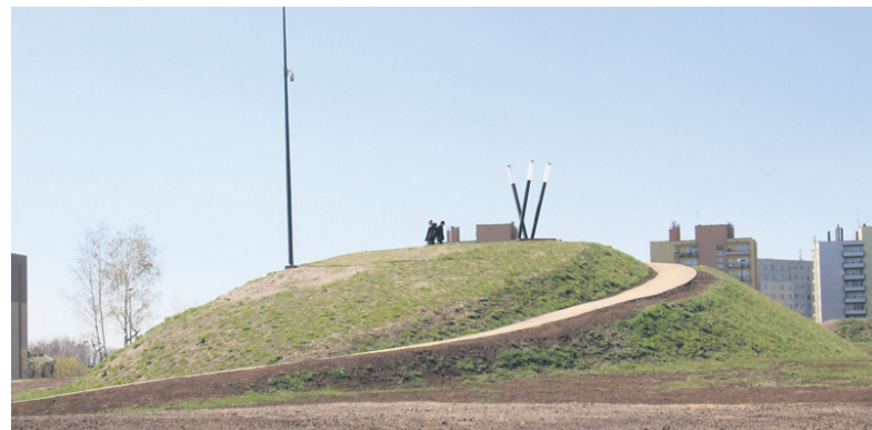
Hałda w Wirku.