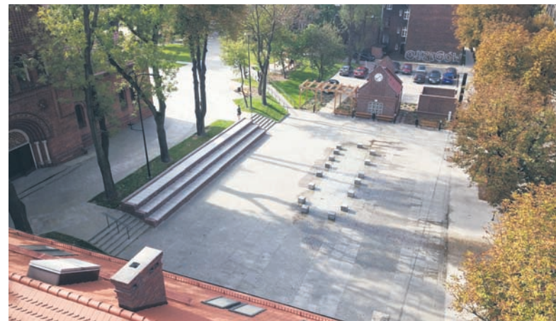
Rynek w Orzegowie.