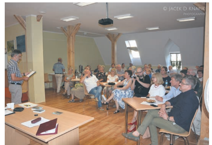
Wręczenie nagród odbyło się w Pałacyku Donnersmarcków.