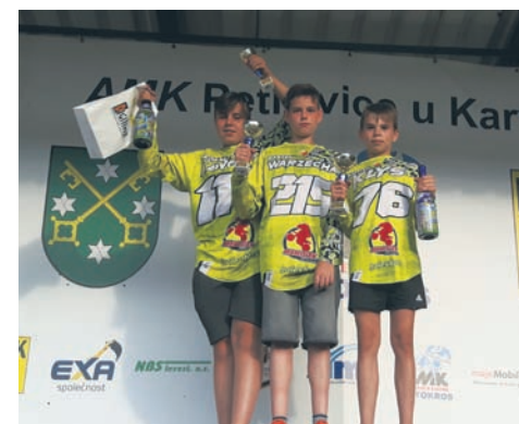
Trzej rudzianie mogą cieszyć się z kolejnych sukcesów.

Trzej młodzi rudzianie odnieśli kolejny sukces w Czechach. W sobotę (10.08) w czeskich Petrovicach odbyła się IV runda Top Amator Cup w Motocrossie.