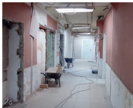
Remont Izby Przyjęć trwa od początku września.