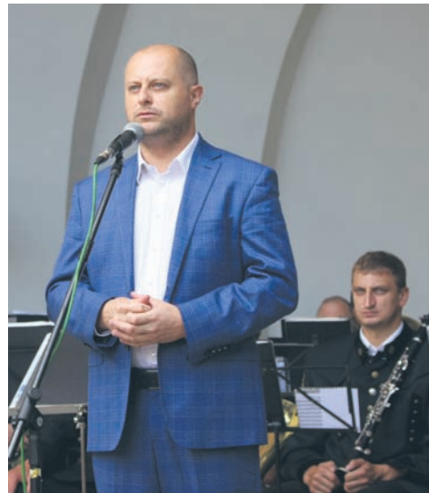
Wiceprezydent Michał Pierończyk oficjalnie otworzył festiwal.