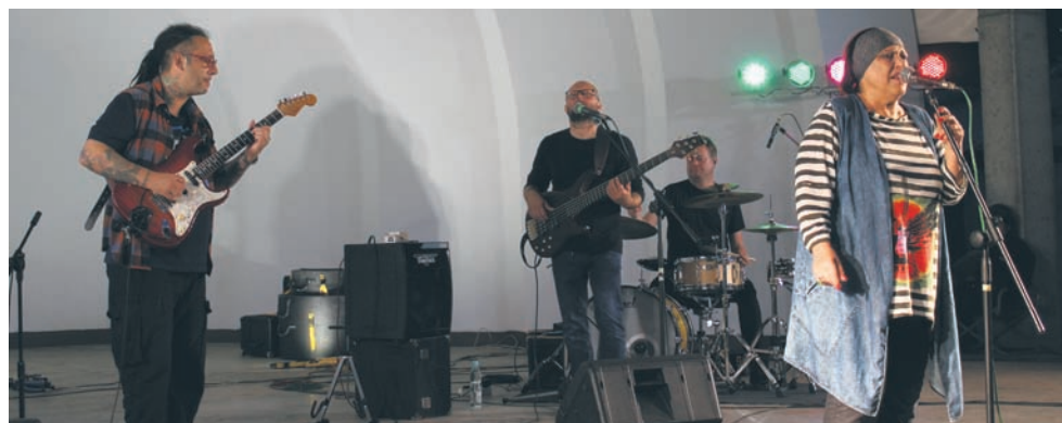
Artystka zaczarowała publiczność swoim śpiewem.