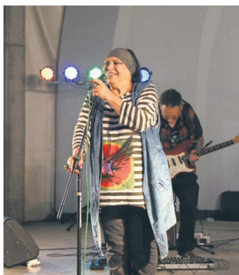
Gwiazdą tegorocznego festiwalu była Grażyna Łobaszewska.