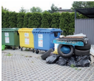
Śmieci pojawiły się przy kompleksie garaży na początku sierpnia.

Inaczej sprawa ta wygląda w przypadku porzuconych opon, bo te należy oddać w Gminnym Punkcie Selektywnego Zbie-