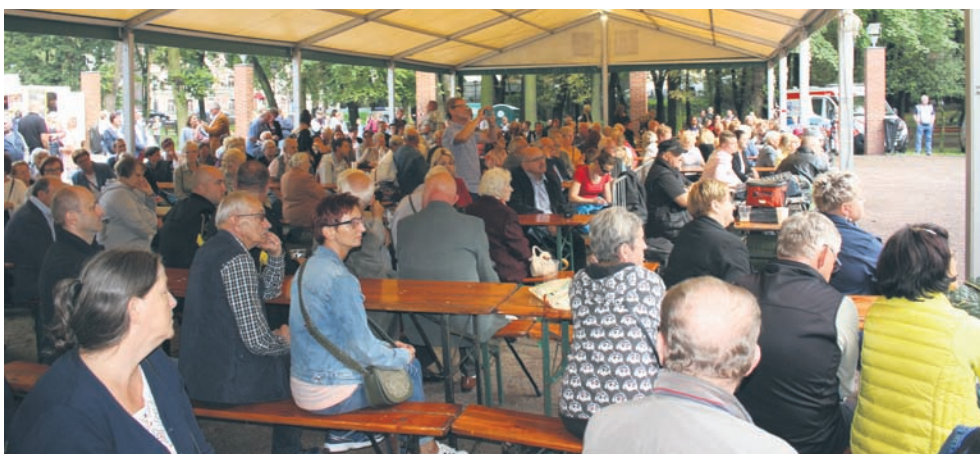
Wydarzenie zgromadziło wielu rudzian.