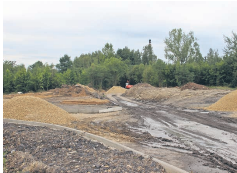
Przy parku Strzelnica budowane jest rolowisko.

Tegoroczny budżet obywatelski w Rudzie Śląskiej obejmuje 10 zadań – 1 ogólnomiejskie i 9 dzielnicowych. Zadanie ogólnomiejskie to tężnia solankowa w strefie aktywności przy ul. Górnośląskiej – przygotowujący