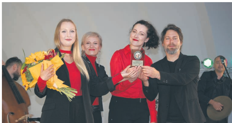
Statuetkę festiwalową otrzymał m.in. zespół The Sound Pack.