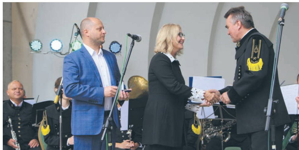
Złota Odznaka Honorowa za Zasługi dla Województwa Śląskiego dla Orkiestry Dętej KWK „Bielszowice”.