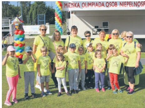
W olimpiadzie wzięli udział podopieczni rudzkich ośrodków.

Niepełnosprawni mogli wziąć udział w kilkunastu konkurencjach m.in.: pchnięciu kulą, skoku w dal z miejsca, rzutach do kosza, minihokeju, rzutach obręczami do celu, rzutach piłką lekarską oraz w biegu z przeszkodami. Nie zabrakło też wielu wspólnych zabaw. – Celem tej imprezy jest upowszechnienie sportu i podnoszenie sprawności fizycznej wśród osób niepełnosprawnych oraz umożliwienie im udziału