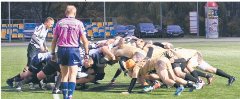
Ostatni mecz w tym sezonie okazał się szczęśliwy dla Gryfów.

RUGBY RUDA ŚLĄSKA – ALFA BYDGOSZCZ 43:29 (31:12)