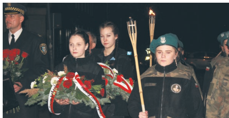
W czasie uroczystości uczczono powstańców śląskich.

uroczystości szkolnych i miejskich. Po uroczystym ślubowaniu nie mogło zabraknąć także przemarszu w asyście orkiestry dętej przed Pomnik Obrońców