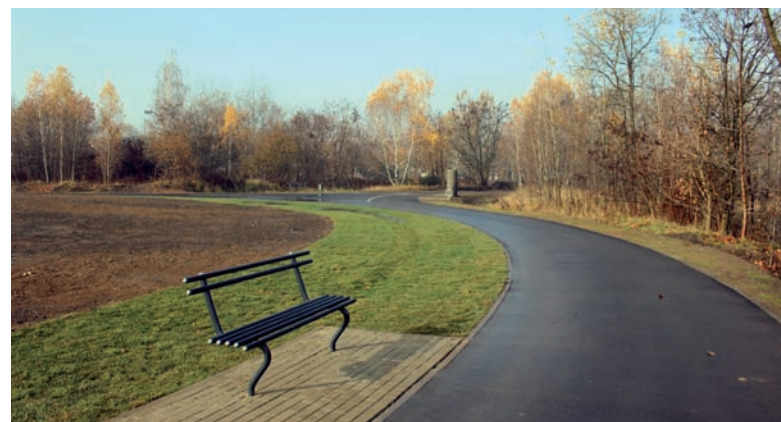
Tor rolkarski ma ok. 674 m długości.

Zadanie było jednym z dziewięciu projektów dzielnicowych, wybranych przez mieszkańców do realizacji w ramach budżetu obywatelskiego na 2019 rok. Większość pozostałych została już zrealizowana, a są to: rozbudowa infrastruktury sportowej przy Szkole Podstawowej nr 40, Halembka Strefa Aktywności Fizycznej przy Szkole Podstawowej nr 24, strefa aktywności „Mrówcza Górka”, strefa crossfit/siłownia napowietrzna typu street workout przy