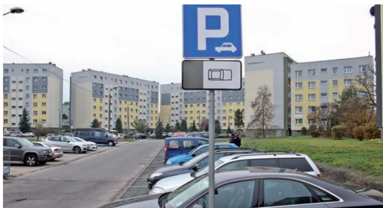
Przy ul. Zgrzebnioka przybyło kilkanaście miejsc parkingowych.

Pomimo trudności z ofertami w ostatnim czasie udało się sfinalizować budowę rolowiska przy parku Strzelnica, które miało być realizowane w 2018 r. W ramach tej inwestycji wykonano trasę dla rolkarzy o długości ok. 674 m i szerokości 3 m, a także infrastrukturę towarzyszącą: strefę hamowania, ubierania rolek, odpoczynku, slalomu oraz skoków. Główny tor rolkowy składa się z dwóch stycznych okręgów o promieniu osi 34 m, na którym wydzielono