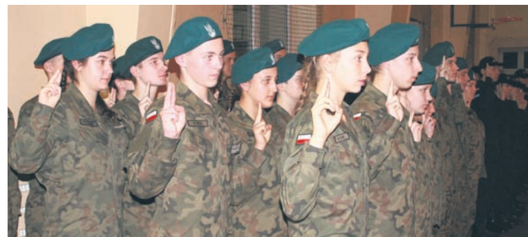
W piątek ślubowanie złożyli uczniowie pierwszych klas IV LO.

W trakcie Dnia Podchorążego uczniowie klas pierwszych złożyli uroczyste ślubowanie, natomiast wyróżnieni kadeci klas wyższych otrzymali awans za bardzo dobre wyniki w nauce, wzorowe zachowanie, czynny udział w zajęciach mundurowych, godne reprezentowanie szkoły podczas konkursów oraz