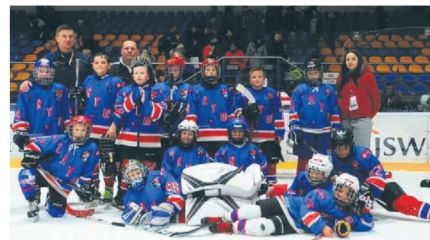
Młodzież Zrywu dzielnie walczyła na turnieju w Jastrzębiu.

W turnieju podzielonym na dwie grupy wiekowe (roczniki 2010 i 2011) wzięło udział około 300 młodych adeptów hokeja, pochodzących z dziesięciu klubów z Polski, trzech zagranicznych oraz z dwóch drużyn wyselekcjonowanych zawodników z różnych klubów z Polski (Polskie Centrum Hokeja na Łodzi oraz Laszka Hawks). W każdej grupie wiekowej druży-