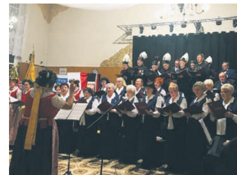
Chórzyści świętowali jubileusz podczas niedzielnego koncertu.