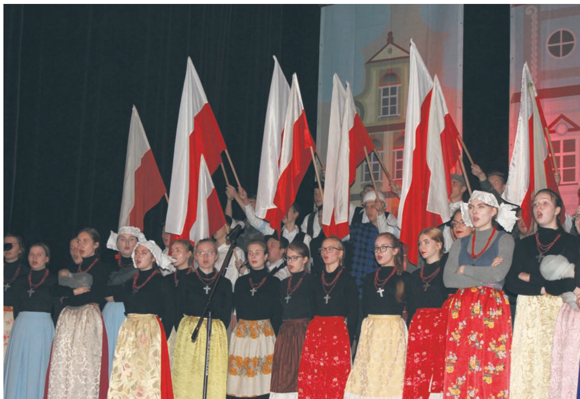
Koncert na Ficusie to nie pierwsze wspólne przedsięwzięcie młodzieży z rudzkiego „Morcinka” i Śląskich Technicznych Zakładów Naukowych w Katowicach.

Kolonia Ficus to historyczne osiedle robotnicze znajdujące się przy ul. Kubiny w Rudzie Śląskiej – Wirku. Od 2006 roku wpisane jest na Szlak Zabytków Techniki Województwa Śląskiego. Osiedle to powstało w 1867 roku dla pracowników kopalni Gottesesgen (obecnie kopalnia Pokój). Pod koniec 2016 roku władze miasta zakupiły jeden z ostatnich niewyremontowanych domów, który popadał w coraz większą ruinę. Na jego renowację udało się pozyskać unijną dotację w kwocie 1,5 mln zł. Obiekt jest już wyremontowany i czeka na wyposażenie. Ma się tam znajdować biblioteka, punkt informacyjny, a także izba pamięci. IM