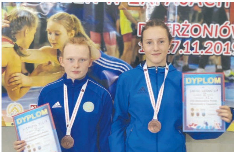
Młode zapaśniczki popisały się talentem i dobrą formą.

Dwa brązowe medale zdobyły zapaśniczki ZKS-u Slavia Ruda Śląska w ubiegły weekend. Mistrzostwa Polski Młodzieży w Dzierżoniowie były najważniejszą rangą zawodami w tej grupie wiekowej dla dziewcząt.