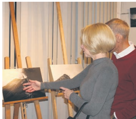
W ramach festiwalu m.in. odbył się wernisaż fotografii górskiej.