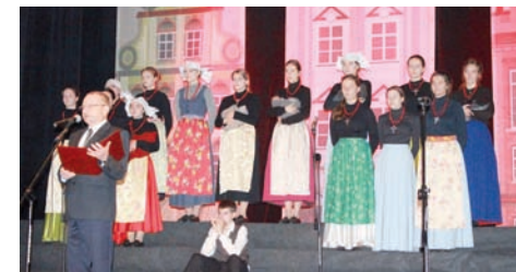
Spektakl zaprezentowano m.in. w bielszowickim Domu Kultury.

Spektakl powstał przy połączeniu sił uczniów tej właśnie szkoły i katowickich Śląskich Technicznych Zakładów Naukowych oraz nauczycieli regionalistów pracujących w tych szkołach. – Kiedy coś robimy, dzie-